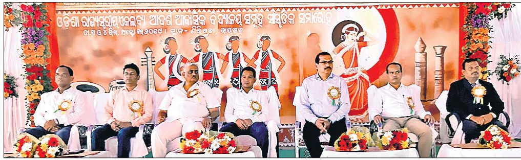
କାର୍ଯ୍ୟକ୍ରମରେ ମଞ୍ଚାସୀନ ଅତିଥି ।

ରାୟଗଡ଼ାର ଶିକ୍ଷାବୃତ୍ତିର ଏକଲବ୍ୟ ଆଦର୍ଶ ଆବାସିକ ବିଦ୍ୟାଳୟ ପ୍ରାଙ୍ଗଣରେ ୨ୟ ରାଜ୍ୟସ୍ତରୀୟ ଏକଲବ୍ୟ ଆଦର୍ଶ ଆବାସିକ ବିଦ୍ୟାଳୟ ସଂସ୍କୃତିକ ସମାରୋହ ଗୁରୁବାର ଉଦଘାଟିତ ହୋଇଯାଇଛି ।