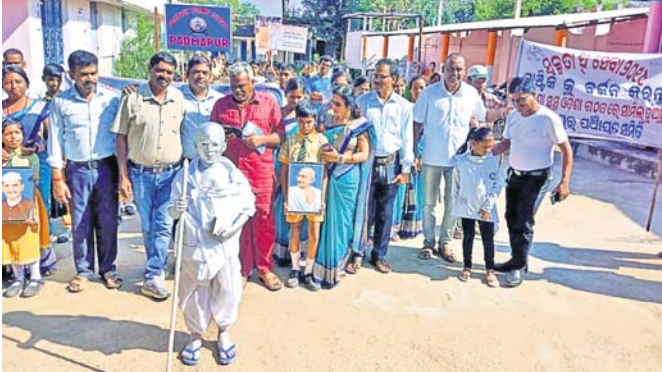
ଶୋଭାଯାତ୍ରାରେ ବାହାରିଥିବା ଛାତ୍ରଛାତ୍ରୀ ଓ ଅନ୍ୟମାନେ ।