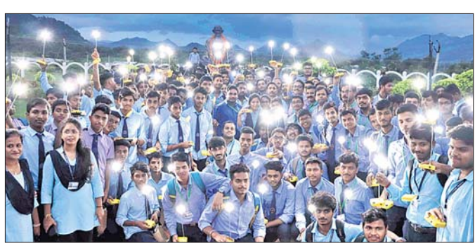
ଛାତ୍ରଛାତ୍ରୀ ସୌରଚାଳିତ ଲକ୍ଷ୍ୟ ପ୍ରଦର୍ଶନ କରୁଛନ୍ତି ।