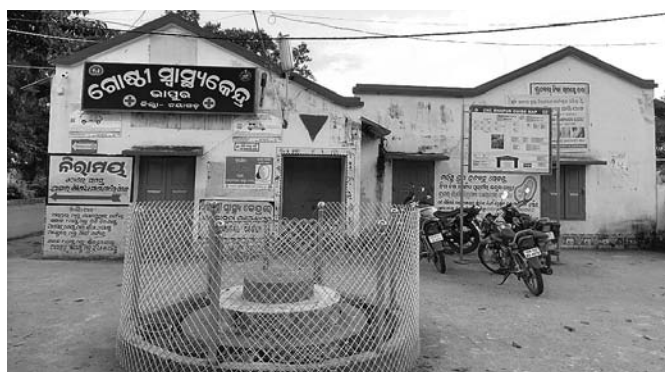
ଭାପୁର ଗୋଷ୍ଠୀ ସାମ୍ବାୟକେନ୍ଦ୍ର ଯୋଗାଇଛନ୍ତି। ଏବେ ୬/୬ ମାସ ହେଲା ଜଣେ ଦକ୍ଷ ବିଶେଷଜ୍ଞ ତାତ୍ତ୍ୱରକୁ

ଭାପୁର, ୩୧୦(ଡି.ଏ.ଏ.) ସାରା ରାଜ୍ୟରେ ତାତ୍ତ୍ୱର ଅଭାବରୁ ରୋଗୀ ସେବା ବ୍ୟାହତ ହେଉଥିବା ବେଳେ କେତେକ ସ୍ଥାନରେ ଆବଶ୍ୟକ ଭିଜିଙ୍ଗି ଅଭାବରୁ ତାତ୍ତ୍ୱର ଥାଇ ମଧ୍ୟ ଲୋକମାନେ ସେବା ପାଇବାକୁ ବଞ୍ଚିତ ହେଉଛନ୍ତି। ଏଠାରେ ପ୍ରସଙ୍ଗକ୍ରମେ ଭାପୁର ଗୋଷ୍ଠୀ ସାମ୍ବାୟକେନ୍ଦ୍ର ଉଦ୍‌ଘାଟନା ଦିଆଯାଇପାରେ। ଏଠାରେ ୨ ଲକ୍ଷ ଲୋକଙ୍କୁ ସାମ୍ବାୟକେନ୍ଦ୍ର ଯୋଗାଇଦେବା ପାଇଁ ୨ ଜଣ ଏଲୋପ୍ୟାଥୀ ତାତ୍ତ୍ୱରକ ସହ ଜଣେ ଆୟୁଷ ତାତ୍ତ୍ୱର ନିଯୁକ୍ତ ହୋଇଛନ୍ତି। ସେମାନେ ପାଳିକରିଲୋକଙ୍କୁ ସାମ୍ବାୟକେନ୍ଦ୍ର ଯୋଗାଇଛନ୍ତି। ଏବେ ୬/୬ ମାସ ହେଲା ଜଣେ ଦକ୍ଷ ବିଶେଷଜ୍ଞ ତାତ୍ତ୍ୱରକୁ