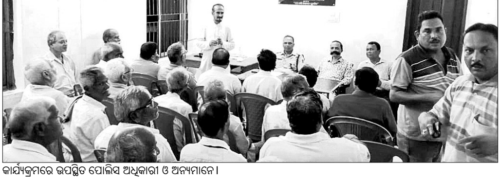
କାର୍ଯ୍ୟକ୍ରମରେ ଉପସ୍ଥିତ ପୋଲିସ୍ ଅଧିକାରୀ ଓ ଅନ୍ୟମାନେ।