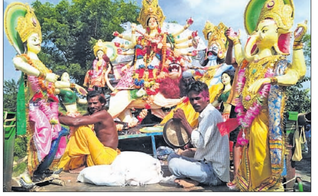
ଦେବୀ ଦୁର୍ଗାଙ୍କୁ ଭଜାଣି ପାଇଁ ନିଆଯାଇଛି।

ଖଣ୍ଡପଡ଼ା, ୯/୧୦(ସ.ପ୍ର.)-କର୍ଣ୍ଣିଲୋ ପାଣ୍ଡୁସାହୁ ପାଟଣାଠାରେ ଗଡ଼ ୪ ଚାରିଶ ଠାକୁ ଆରମ୍ଭ ହୋଇଥିବା ବିଶ୍ୱଶାନ୍ତି ରୈପିକ ମହାଯଜ୍ଞ ବୁଧବାର ଉଦ୍‌ଯାପିତ ହୋଇଯାଇଛି।