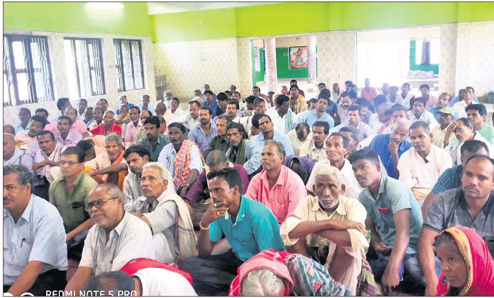
ସମାବେଶରେ ଯୋଗଦେଇଥିବା ଚାଷୀମାନେ।

ନବନିର୍ମାଣ କୃଷକ ସଙ୍ଗଠନର ନୟାଗଡ଼ ଜିଲ୍ଲାସ୍ତରୀୟ ସମାବେଶ ବୁଧବାର ସହରସ୍ଥିତ ବିଜୁ ପଟ୍ଟନାୟକ କଲ୍ୟାଣମଣ୍ଡପଠାରେ ଅନୁଷ୍ଠିତ ହୋଇଯାଇଛି।