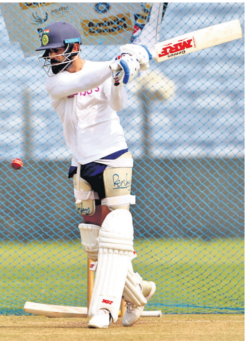
ନେଟ୍‌ରେ ଅଭ୍ୟାସ କରୁଛନ୍ତି ବିରାଟ କୋହଲି।

ଓପନର ହିସାବରେ ଚେଷ୍ଟ ପଦାର୍ପଣରେ ଚାରୁକା ବ୍ୟାଟ୍‌ମ୍ୟାନ ରୋହିତ ଶର୍ମା ଜବରଦସ୍ତ ପ୍ରଦର୍ଶନ କରିଛନ୍ତି। ପ୍ରଥମ ଚେଷ୍ଟରେ ସେ ଦୁଇଟି ଯାକ ଇନିଂସରେ ଶତକ ହାସଲ କରି ଚୟନକର୍ତ୍ତା ଓ ଟିମ୍ ମ୍ୟାନେଜମେଣ୍ଟର ନିଷ୍ପତ୍ତିକୁ ଯଥାର୍ଥ ବୋଲି ପ୍ରମାଣିତ କରିଛନ୍ତି।