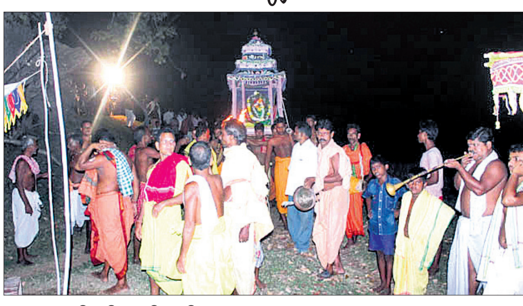
ଶ୍ରୀ ଜୀଉଙ୍କୁ ଯାତ୍ରା ପଡ଼ିଆକୁ ବିନାମରେ ନିଆଯାଇଛି।

ମହିଷାସୁରର ନିଧନ ପାଇଁ ମା' ଦୁର୍ଗାଙ୍କୁ ପ୍ରଦାନ କରାଯାଇଥିବା ଶଙ୍ଖ, ଚକ୍ର ଆୟୁଧ ମଙ୍ଗଳଦାୟକ ବିଜୟା ଦଶମୀ ତିଥିରେ କର୍ଣ୍ଣିଲୋ ନୀଳମାଧବ ଜୀଉଙ୍କୁ ସମର୍ପଣ କରାଯାଇଛି।