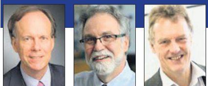
ଫିଲିପ୍ ପି. କିଲ୍ଡ୍ ଟ୍ରେଭିସ୍ ଏଲ୍. ସେମେଜା ପିଟର୍ ଜେ. ରାଡ୍‌ଫ୍ରିଡ୍