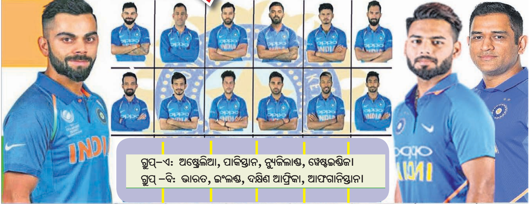
ଗୁପ୍-ଏ: ଅଷ୍ଟ୍ରେଲିଆ, ପାକିସ୍ତାନ, ନ୍ୟୁଜିଲାଣ୍ଡ, ଝେଷ୍ଟ୍‌ଇଣ୍ଡିଜ ଗୁପ୍-ବି: ଭାରତ, ଇଂଲଣ୍ଡ, ଦକ୍ଷିଣ ଆଫ୍ରିକା, ଆଫଗାନିସ୍ତାନ