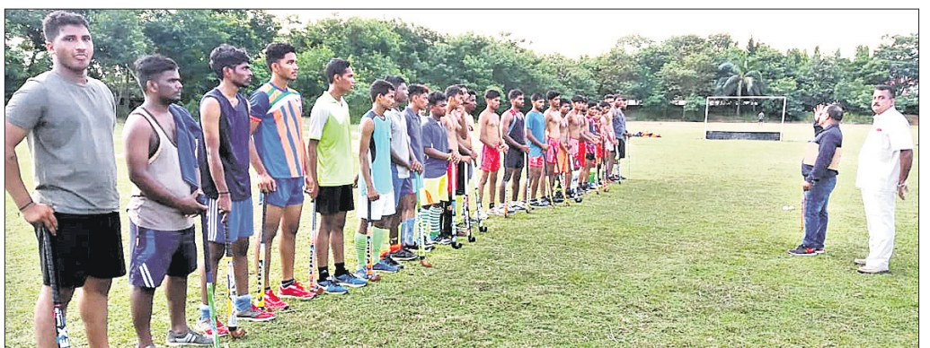
ଚୟନ ଶିବିରରେ ପ୍ରତିଯୋଗୀଙ୍କୁ ପ୍ରଶିକ୍ଷଣ ଦିଆଯାଇଛି ।