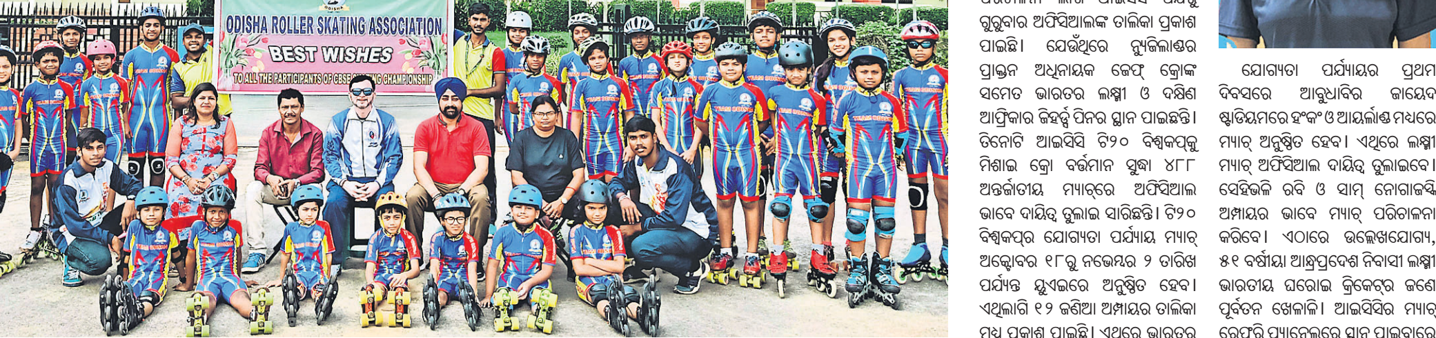
ବିଦିଆଲ କ୍ରୀଡ଼ା ମହୋତ୍ସବରେ ଭାଗନେବାକୁ ମନୋନୀତ ହୋଇଥିବା ଓଡ଼ିଶା ଦଳର ଖେଳାଳିମାନେ କର୍ମକର୍ତ୍ତାଙ୍କ ସହ ଗହଣରେ।

ଓଡ଼ିଶାରୁ ଭାଗନେବେ ୩୫ ଷ୍ଟେଟର ଜିଏସ୍ ଲକ୍ଷ୍ମୀ ପ୍ରଥମ ମହିଳା ରେଫରି ହେବେ।