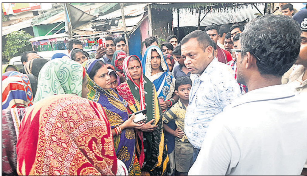
ତହସିଲଦାର ଉତ୍ତମ ମହିଳାଙ୍କୁ ବୁଝାଣୁଛନ୍ତି।