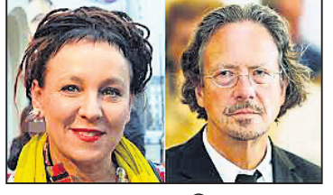
ଓଲ୍‌ଗା ଗୋକାରକୁଙ୍କ ପିଟର ହାଣ୍ଡକେ

ଷ୍ଟକହୋମ, ୧୦୧୦ (ଏଏଫ୍‌ସି): ପୋଲାଣ୍ଡ ଲେଖକ ଓଲ୍‌ଗା ଗୋକାରକୁ ଏବଂ ଅଷ୍ଟ୍ରିଆର ଔପନ୍ୟାସିକ ପିଟର ହାଣ୍ଡକେଙ୍କୁ ଯଥାକ୍ରମେ ୨୦୧୮ ଓ ୨୦୧୯ ବର୍ଷ ଲାଗି ସାହିତ୍ୟରେ ନୋବେଲ ପୁରସ୍କାର ପାଇଁ ମନୋନୀତ କରାଯାଇଛି। ଓଲ୍‌ଗା ହେଉଛନ୍ତି ତାଙ୍କ ସମୟର ଶ୍ରେଷ୍ଠ ଔପନ୍ୟାସିକ। ଜୀବନଶୈଳୀକୁ ନେଇ ଓଲ୍‌ଗାଙ୍କର ବିସ୍ତୃତ ତଥ୍ୟଭିତ୍ତି ଆବେଗଭରା ପରିକଳ୍ପନା ପାଇଁ ତାଙ୍କୁ ଏହି ଶ୍ରେଷ୍ଠ ପୁରସ୍କାରରେ ସମ୍ମାନିତ କରାଯାଇଛି। ଅନ୍ୟପକ୍ଷରେ ହାଣ୍ଡକେଙ୍କୁ ତାଙ୍କର ପ୍ରଭାବଶାଳୀ ସାହିତ୍ୟ ସୃଷ୍ଟି ଲାଗି ଏହି ପୁରସ୍କାର ମିଳିବାକୁ ଯାଉଛି। ଦ୍ୱିତୀୟ ବିଶ୍ୱଯୁଦ୍ଧ ପରେ ହାଣ୍ଡକେ ଯୁଗୋସ୍ଲାଭିଆର ନିକକୁ ସବୁଠୁ ପ୍ରଭାବଶାଳୀ ସାହିତ୍ୟିକ ଭାବେ ପ୍ରତିଷ୍ଠିତ କରାଯାଇଥିଲେ। ତାଙ୍କ ସୃଜନଶାଳିତା ବୃତ୍ତ ଉଚ୍ଚାନ୍ତର ପୂର୍ଣ୍ଣ ଯାହାକୁ ନୂତନ ସାରସ୍ୱତ ଅଭିବ୍ୟକ୍ତି ଜାତ କରିଥାଏ। ଉଭୟ ସାହିତ୍ୟିକଙ୍କୁ ପୁରସ୍କାର ବାବଦରେ ୯ ନିୟୁତ ଗ୍ରୋନର (ପାଖାପାଖି ୯୧୨,୦୦୦ ଡଲାର) ମିଳିବ। ଏହି ସମ୍ମାନକ୍ରମ ପୁରସ୍କାର ପାଇବାରେ ଓଲ୍‌ଗା ହେଉଛନ୍ତି ୧୫ତମ ମହିଳା। ୧୯୦୧ରୁ ସାହିତ୍ୟରେ ଏସମିଧ୍ୟ ୧୧୬ ଜଣଙ୍କୁ ନୋବେଲ ପୁରସ୍କାର ମିଳିଛି। ଗତବର୍ଷ ଏକ ଯୌନ ନିର୍ଯାତନା ମାମଲାକୁ ନେଇ ଏହି ପୁରସ୍କାର ଘୋଷଣା ବିଳମ୍ବିତ ହୋଇଥିଲା।