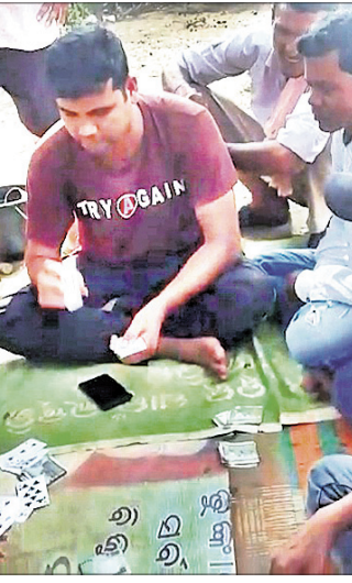
କନସ୍ଵେବ କାରୁ ଜୁଆ ଖୋଜୁଛନ୍ତି।