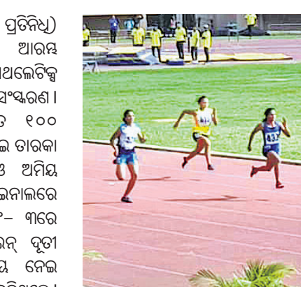
ରେସ୍ ଅବସରରେ ଦୂତୀ ଦାୟ (ତାହାଣ)। ପଛରେ ପକାଇଦେବାରେ ସକ୍ଷମ ହୋଇଛନ୍ତି। ଏହା ଏକ ଓପନ

ପ୍ରତିଯୋଗିତା ହୋଇଥିବାବେଳେ ଦେଶ ବାହାରୁ ପ୍ରତିଯୋଗୀ ମଧ୍ୟ ଆଂଶୁଗ୍ରହଣ କରିଛନ୍ତି। ପ୍ରଦର୍ଶନରେ ସୁଦ୍ଧି ଅଛି।