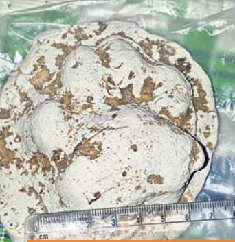
ଯାଦଚିହ୍ନ ମିଳିବା ପରେ ଲୋକେ ଆତଙ୍କିତ ଏବଂ ବନ ବିଭାଗ ସତର୍କ, ଲାଗିବ ଗ୍ରାମ୍ୟ କ୍ୟାମ୍ପେରା

ଏକାଧିକ ଗୋରୁ ଜଙ୍ଗଲକୁ ଚରିବାକୁ ଯାଇଥିବାବେଳେ ନିଷେଧ ଓ ଆହତ ଅଞ୍ଚଳରେ ବନ ବିଭାଗ ପକ୍ଷରୁ ପାଟ୍ରୋଲିଂ ବ୍ୟବସ୍ଥା କଡ଼ାକଡ଼ି କରି ଦିଆଯାଇଛି। ବନ ଲୋକଙ୍କୁ ମଧ୍ୟ ଜଙ୍ଗଲକୁ ଯିବାକୁ ବାରଣ କରାଯାଇଛି। ଡିଏଫ୍ ଓ ଅଭୟ କୁମାର ଦଳେଇ, ଏସିଏଫ୍ ସୁବର୍ଣ୍ଣ ବାଦା ଘଟଣା ପ୍ରତି ନଜର ରଖିଛନ୍ତି। ସୂଚନାଯୋଗ୍ୟ, ବିଗତ ୨୫ ଦିନ ମଧ୍ୟରେ ସମ୍ପୂର୍ଣ୍ଣ ଅଞ୍ଚଳର