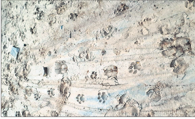
ଜଙ୍ଗଲରେ ଓ ପ୍ରାଣୀଙ୍କ ଅପଦାପତ୍ତିରେ ପଡ଼ିଥିବା ବାୟୁ ପାଦଚିହ୍ନ।

ଗଞ୍ଜାମ ଜିଲ୍ଲା ଭଞ୍ଜନଗର ଉତ୍ତର ମୁକୁନ୍ଦର ବନଖଣ୍ଡ ଜଗନ୍ନାଥପ୍ରସାଦ ରେଞ୍ଜି ଲକ୍ଷ୍ମଣ ପାହାଡ଼ ନିକଟସ୍ଥ ଗୁଣ୍ଡିରିବାଡ଼ି ରାଜ୍ୟ ଗ୍ରାମ ନିକଟ ଜଙ୍ଗଲରେ ଏକ କଲରାପତରିଆ ବାୟୁଣୀକୁ ବନ ବିଭାଗ କର୍ମଚାରୀ ଠାବ କରିଛନ୍ତି। ଜଙ୍ଗଲରେ ବାୟୁ ଥିବାର ପ୍ରମାଣ ଗୁରୁବାର ମିଳିବା ପରେ ସମ୍ପୂର୍ଣ୍ଣ ଅଞ୍ଚଳବାସୀ ଆତଙ୍କିତ ହୋଇପଡ଼ିଛନ୍ତି। ଅପରପକ୍ଷେ ସାଧାରଣ ଲୋକେ ଏବଂ ଗୃହପାଳିତ ପ୍ରାଣୀଙ୍କ ଯେକୌଣସି ନିର୍ଦ୍ଦେଶ ସେଥିପାଇଁ ବନ ବିଭାଗ ସତର୍କ ହୋଇଯାଇଛି।