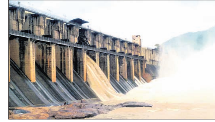
କଣିହାଁ, ୧୦/୧୦ (ଡି.ଏ.ଏ.)

ଅନୁଗୋଳ ଜିଲ୍ଲା କଣିହାଁ ବ୍ଲକ୍ସ୍ଥିତ ବ୍ରାହ୍ମଣୀ ନଦୀ ବନ୍ଧ ଯୋଜନାର