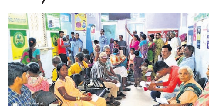
ରୋଗୀ ଏବଂ ସେମାନଙ୍କ ସମ୍ପର୍କୀୟମାନେ।