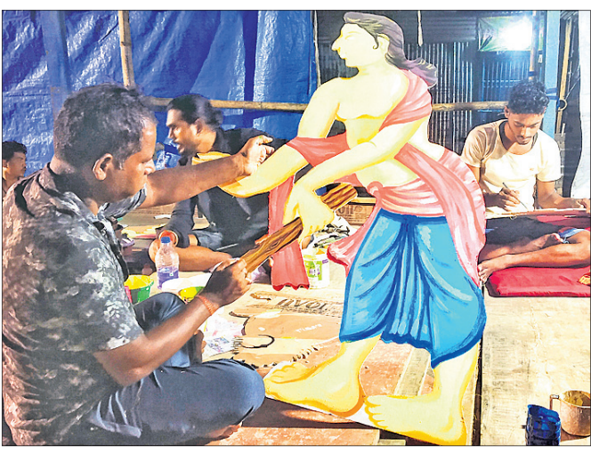
ପୂର୍ଣ୍ଣିମାରେ ବ୍ୟସ୍ତ ଜଣେ କାରିଗର।

ଅନୁଗୋଳ ଅଧିକ, ୧୦୧୧୦ ପୂଜା ପାଇଥିଲେ। ଏହାପରେ ଠାରୁ ଜିଲ୍ଲା ଓ ସହରର ବିଭିନ୍ନ ସ୍ଥାନରେ ଲକ୍ଷ୍ମୀ ପୂଜା କରାଯାଇଥିଲା। ଉତ୍ତମଧରେ ସହରର ୨୯ଟି ମଣ୍ଡପକୁ ନେଇ ଅନୁଗୋଳରେ ସେଣ୍ଟ୍ରାଲ ପୂଜା କମିଟି ଗଠନ କରାଯାଇଛି। ଚଳିତବର୍ଷ ପୂଜା ପାଇଁ ମା' ଲକ୍ଷ୍ମୀ ପୂଜା କମିଟି ପକ୍ଷରୁ ପୂଜା ଦିଆଯାଇଛି। କୁଳାର ପୂର୍ଣ୍ଣିମା ତିଥିରୁ ଆରମ୍ଭ ହେଉଥିବା ଏହି ପୂଜା ସହରରେ ୨୯ ମଣ୍ଡପରେ ୧୦ ଦିନ ଧରି ଚାଲିବ। ପୂଜା କମିଟି ସଦସ୍ୟମାନଙ୍କ କହିବା ଅନୁଯାୟୀ, ଅନୁଗୋଳରେ ପ୍ରଥମେ ଲକ୍ଷ୍ମୀ ବଜାରରେ ମା' ଲକ୍ଷ୍ମୀ ଆରମ୍ଭ ହୋଇଥିଲା। ଏହା ପରବର୍ଷ ବଜାର ସ୍ଥଳରେ ମା' ଲକ୍ଷ୍ମୀ ପୂଜା ପାଇଥିଲା। ଏହାପରେ ବରୋବସ୍ତ କରାଯାଇଥିବା ସୁଦ୍ଧା ପ୍ରଦାନ କରାଯାଇଛି।