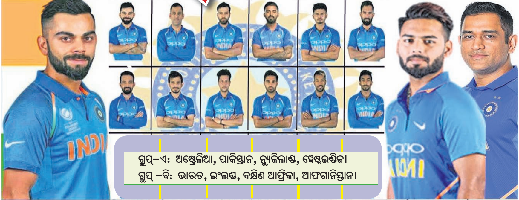
ଗ୍ରୁପ୍-ଏ: ଅଷ୍ଟ୍ରେଲିଆ, ପାକିସ୍ତାନ, ନ୍ୟୁଜିଲାଣ୍ଡ, ଝେଷ୍ଟୁଇଣ୍ଡିଜ ଗ୍ରୁପ୍-ବି: ଭାରତ, ଇଂଲଣ୍ଡ, ଦକ୍ଷିଣ ଆଫ୍ରିକା, ଆଫଗାନିସ୍ତାନ

ଦ୍ୱିଶା ଆଫ୍ରିକା ସହିତ ଚେଷ୍ଟୁ ଉଦ୍ଦିଷ୍ଟରେ ଚିନ୍ତା ଇତିଆର ସୁପର ଶୋ ଅବ୍ୟାହତ ରହିଛି। ପ୍ରଥମ ଚେଷ୍ଟୁ ୨୦୩ ରନ୍ ର ବିଶାଳ ବ୍ୟବଧାନରେ ଚିତ୍ତିବାରେ ଭଲ ଅଭିଜ୍ଞ ଏବଂ ନୂତନ ଖେଳାଳିମାନଙ୍କ ସଫଳତା ଏପରି ଏକ ବିରାଟ ଚିନ୍ତା ବିଳାସ ଆଣିଦେଇଛି। ଯେଉଁଥିରେ ବିଶ୍ୱର ଅନ୍ୟତମ ଶ୍ରେଷ୍ଠ ଅଫଫିନ୍ ରବିନ୍ଦ୍ରନାଥ ଅଶ୍ୱିନୀଙ୍କ ସଫଳ ଚେଷ୍ଟୁ ପ୍ରତ୍ୟାବର୍ତ୍ତନ ସାମିଲ ରହିଛି। କର୍ନାଟକର ରଣଜୀ ଓପନର୍ ମୟଙ୍କ ଅଗ୍ରାଧିକାର ପ୍ରଥମ ଚେଷ୍ଟୁ ମ୍ୟାଚରେ ବିଶ୍ୱର ଅନ୍ୟତମ ସଫଳ ଚେଷ୍ଟୁ ପ୍ରଦର୍ଶନ ଏବଂ ଗୋଟିଏ ଚେଷ୍ଟୁ ମ୍ୟାଚରେ ଭଲ ଚିନ୍ତା ପକ୍ଷରୁ ୫ଟି ଶତକ, କେତେଗୁଡିଏ ଦଶନ୍ଧୀ କ୍ୟାଚ୍ ସହିତ ଚିନ୍ତା ଇତିଆ ୧୬୦ ପଏଣ୍ଟ ସହ ବିଶ୍ୱ ଚେଷ୍ଟୁ ଚାମ୍ପିୟନଶିପରେ ୧୯୯ ଗ୍ଲାନ ହାସଲ କରିଛି। ଚେଷ୍ଟୁ ସଫଳତା ସହ ଭାରତ ମିଶ୍ର ଟି୨୦ ବିଶ୍ୱକପ୍ ପାଇଁ ମଧ୍ୟ ପ୍ରସ୍ତୁତି ଆରମ୍ଭ ହୋଇଛି। କ୍ଲିଫାଏ ମ୍ୟାଚରେ ଶ୍ରୀଲଙ୍କା ଓ ବାଂଲାଦେଶ ଅନ୍ୟ ଚିନ୍ତାଗୁଡିକ ସହ ଅବତୀର୍ଣ୍ଣ ହେବେ। ଏହାପରେ ବିଶ୍ୱକପ୍ରେ ଅଂଶଗ୍ରହଣ କରିବାକୁ ଥିବା ଦଳଗୁଡିକ ନେଇ ଛିଡ଼ି ଖଣ୍ଡ ହେବ। ଚିନ୍ତା ଇତିଆ ତା'ର ବିଶ୍ୱକପ୍ ପ୍ରତିମା ୨୦୨୦ ସାଉଥ ଆଫ୍ରିକା ସହିତ ଗଠି ଟି୨୦ ମ୍ୟାଚରୁ ଆରମ୍ଭ କରିଛି। ଆସନ୍ତାବର୍ଷ ଅଷ୍ଟ୍ରେଲିଆରେ ଖେଳାଯିବ ଆଇସିସି ଟି୨୦ ବିଶ୍ୱକପ୍। ଏଥିପାଇଁ ଚିନ୍ତା ଇତିଆ ତା'ର ଜୋରଦାର ପ୍ରସ୍ତୁତି ଆରମ୍ଭ କରିଛି। ଏହି ବିଶ୍ୱକପ୍ ପାଇଁ ଚିନ୍ତା ଇତିଆ ଖେଳିବାକୁ ଥିବା ମ୍ୟାଚଗୁଡିକ ମଧ୍ୟରେ ଟି୨୦ ଫର୍ମାଟକୁ ଅଧିକ ଗୁରୁତ୍ୱ ଦିଆଯାଇଛି। ଧଳା ବଲରେ ଅଷ୍ଟ୍ରେଲିଆ ପରିବେଶରେ ଖେଳାଯିବାକୁ ଥିବା ଏହି ବିଶ୍ୱକପ୍ ପାଇଁ ଅନେକ ନୂଆ ମୁହଁକୁ ଚିନ୍ତା ଇତିଆ ଏବେଠାରୁ ସୁଯୋଗ ଦେବାକୁ ଆରମ୍ଭ କରିଛି। ଟି୨୦ ବିଶ୍ୱକପ୍ ଏହି ୭ମ ସଂସ୍କରଣ ଅନ୍ତର୍ଗତାୟ, କ୍ରିକେଟ କାଉନ୍ସିଲ (ଆଇସିସି) ଏବଂ କ୍ରିକେଟ ଅଷ୍ଟ୍ରେଲିଆ (ସିଏ) ଦ୍ୱାରା ପରିଚାଳିତ ହେବ। ଅକ୍ଟୋବର ୧୮ ତାରିଖରୁ ଆରମ୍ଭ ହୋଇ ୧୫ ନଭେମ୍ବର ୨୦୨୦ ପର୍ଯ୍ୟନ୍ତ ଖେଳାଯିବାକୁ ଥିବା ଏହି ମେଗା ଟୁର୍ନାମେଣ୍ଟରେ ମୋଟ ୧୬ଟି ଦଳ