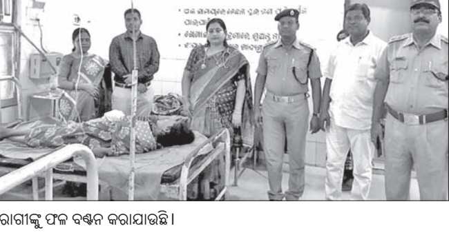
ରୋଗୀଙ୍କୁ ଫଳ ବଞ୍ଚନ କରାଯାଇଛି।