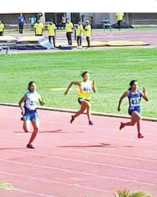
ରେସ୍ ଅବସରରେ ଦୂତୀ ଦାୟ (ତାହାଣୀ)। ପଛରେ ପକାଇଦେବାରେ ସକ୍ଷମ ହୋଇଛନ୍ତି। ଏହା ଏକ ଓପନ

ଭୁବନେଶ୍ୱର, ୧୦।୧୦(କ୍ରୀଡ଼ା ପ୍ରତିନିଧି) ରାଜ୍ୟରେ ଗୁରୁବାରଠାରୁ ଆରମ୍ଭ ହୋଇଛି ଜାତୀୟ ଓପନ ଆଥଲେଟିକ୍ସ ଚାମ୍ପିୟନଶିପ୍‌ରେ ୫୯ତମ ସଂସ୍କରଣ।