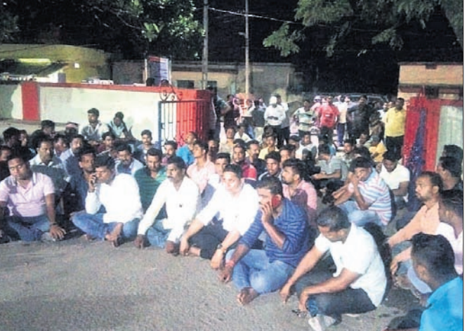
ଧାନା ଆଗରେ ଧାରଣା ଦିଆଯାଇଛି। ହୋଇଥିଲା। ଉଭୟପକ୍ଷ ପରସ୍ପର ଆନାରେ ଧାରଣା ଦେଇ ବସି ରହିଛନ୍ତି।

ଏମ୍.ପି.ଏ.ରୁ ଭୁବନେଶ୍ୱରୀ କୋଇଲା ଖଣିରେ କୋଇଲା ପରିବହନକୁ ନେଇ