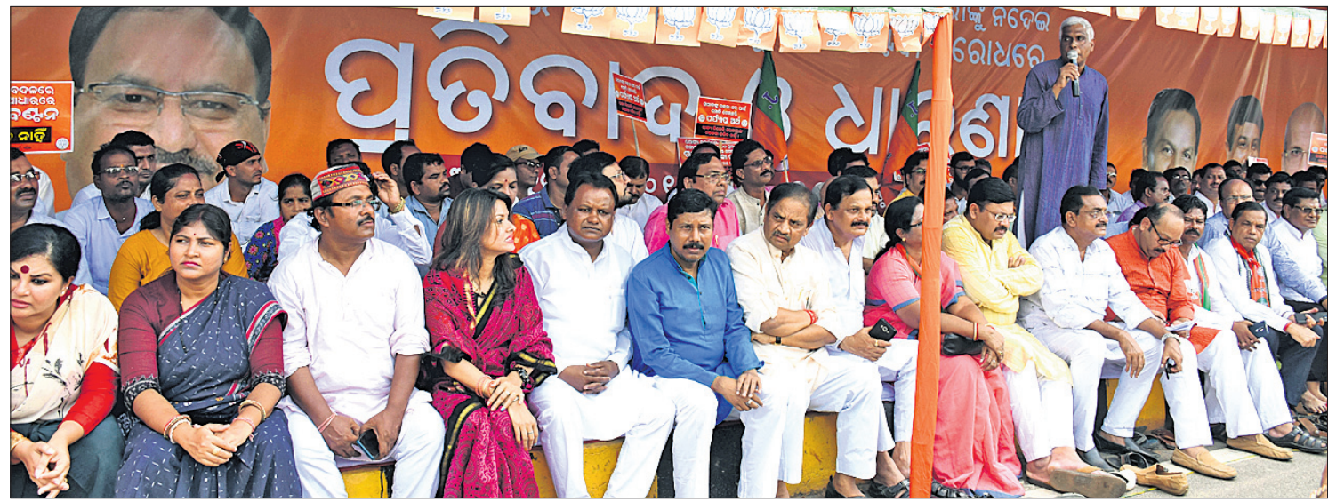
ରାଜଭବନ ସମ୍ମୁଖରେ ଗୁରୁବାର ଭାଜପା ପକ୍ଷରୁ ବିଆଯାଇଥିବା ଧାରଣାରେ ଉପସ୍ଥିତ ନେତୃମଣ୍ଡଳ।