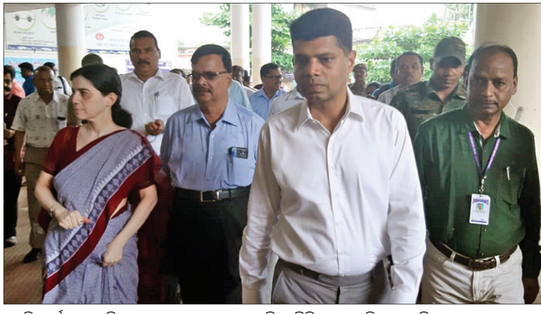
୫-ଟି କାର୍ଯ୍ୟକ୍ରମ ସତିବନ୍ଧ ଓ ଅନ୍ୟ ଅଧିକାରୀମାନେ ଜିଲ୍ଲା ଟିକିଆଳୟ ବୁଲି ଦେଖୁଛନ୍ତି।