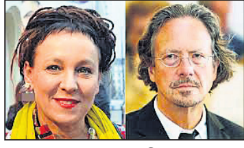
ଓଲ୍‌ଗା ଗୋକାରଙ୍କୁ ପିଟର ହାଣ୍ଡକେ

ଷ୍ଟକହୋମ, ୧୦୧୦ (ଏଫପି): ପୋଲାଣ୍ଡ ଲେଖକ ଓଲ୍‌ଗା ଗୋକାରଙ୍କୁ ଏବଂ ଅଷ୍ଟ୍ରିଆର ଔପନ୍ୟାସିକ ପିଟର ହାଣ୍ଡକେଙ୍କୁ ୨୦୧୮ ଓ ୨୦୧୯ ବର୍ଷ ଲାଗି ସାହିତ୍ୟରେ ନୋବେଲ ପୁରସ୍କାର ପାଇଁ ମନୋନୀତ କରାଯାଇଛି। ଓଲ୍‌ଗା ହେଉଛନ୍ତି ତାଙ୍କ ସମୟର ଶ୍ରେଷ୍ଠ ଔପନ୍ୟାସିକ। ଜୀବନଶୈଳୀକୁ ନେଇ ଓଲ୍‌ଗାଙ୍କର ବିସ୍ତୃତ ତଥ୍ୟଭିତ୍ତିତ ଆବେଗଭରା ପରିକଳ୍ପନା ପାଇଁ ତାଙ୍କୁ ଏହି ଶ୍ରେଷ୍ଠ ପୁରସ୍କାରରେ ସମ୍ମାନିତ କରାଯାଇଛି। ଅନ୍ୟପକ୍ଷରେ ହାଣ୍ଡକେଙ୍କୁ ତାଙ୍କର ପ୍ରଭାବଶାଳୀ ସାହିତ୍ୟ ସୃଷ୍ଟି ଲାଗି ଏହି ପୁରସ୍କାର ମିଳିବାକୁ ଯାଉଛି। ଦ୍ୱିତୀୟ ବିଶ୍ୱଯୁଦ୍ଧ ପରେ ହାଣ୍ଡକେ ଯୁରୋପରେ ନିଜକୁ ସବୁଠୁ ପ୍ରଭାବଶାଳୀ ସାହିତ୍ୟିକ ଭାବେ ପ୍ରତିଷ୍ଠିତ କରାଇପାରିଥିଲେ। ତାଙ୍କ ସୂକ୍ଷ୍ମଗୀତା ବୃତ୍ତ ଲକ୍ଷ୍ମଣାକ୍ଷରେ ପୁଣି, ଯାହାକୁ ନୂତନ ସାରସ୍ୱତ ଅଭିବ୍ୟକ୍ତି ଜାତ ହୋଇଛି। ଉଭୟ ସାହିତ୍ୟିକଙ୍କୁ ପୁରସ୍କାର ବାବଦରେ ୯ ନିୟୁତ ଗ୍ରୋନର (ପାଖାପାଖି ୯୧୨,୦୦୦ ଡଲାର) ମିଳିବ। ଏହି ସମ୍ମାନକ୍ରମ ପୁରସ୍କାର ପାଇବାରେ ଓଲ୍‌ଗା ହେଉଛନ୍ତି ୧୫ତମ ମହିଳା। ୧୯୦୧ରୁ ସାହିତ୍ୟରେ ଏପର୍ଯ୍ୟନ୍ତ ୧୧୬ ଜଣଙ୍କୁ ନୋବେଲ ପୁରସ୍କାର ମିଳିଛି। ଗତବର୍ଷ ଏକ ଯୌନ ନିର୍ଯାତନା ମାମଲାକୁ ନେଇ ଏହି ପୁରସ୍କାର ଘୋଷଣା ବିଳମ୍ବିତ ହୋଇଥିଲା।