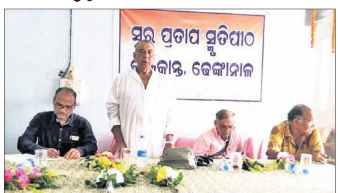
କେ.ପି. ସିଂହଦେଓ ଉଦ୍‌ଘାଟନ ବେଉଛନ୍ତି।

ଡେକାନାଲ ଜିଲ୍ଲାକାର୍ଯ୍ୟକ୍ରମ ସୁରପ୍ରତାପ ସ୍ମୃତିପୀଠର ବାର୍ଷିକ ଉତ୍ସବ ଗୁରୁବାର ପାଳିତ ହୋଇଯାଇଛି। ଏଥିରେ ଅଧକ୍ଷତା କରି ପୂର୍ବତନ କେନ୍ଦ୍ରମନ୍ତ୍ରୀ କାମାକ୍ଷୀ ପ୍ରସାଦ ସିଂହଦେଓ (କେପି) କହିଲେ, ରାଜା ସୁରପ୍ରତାପଙ୍କ ସ୍ମୃତି ଅବଧୂର ଶାସନ କାଳ ମଧ୍ୟରେ ଶିକ୍ଷା, ସ୍ୱାସ୍ଥ୍ୟ, ଜଳସେଚନ, ଗମନାଗମନର ବିକାଶ ହୋଇପାରିଥିଲା। ମଠମନ୍ଦିରର ସୁରକ୍ଷା ଉପରେ ସେ ଗୁରୁତ୍ୱ ଦେଉଥିଲେ। ଗ୍ରାମରେ ଆଧ୍ୟାତ୍ମିକ ଶିକ୍ଷା ପାଇଁ ଭାଗବତ ରୁଜି ଘାପନା କରାଯାଇଥିଲା। ସେ ନିଜେ ପାଦରେ ଚାଲିଚାଲି ନଗର ସଂକୀର୍ତ୍ତନ କରୁଥିଲେ। ଏବେ ଡେକାନାଲ ଗଡ଼ଜାତ ରାଜ୍ୟର ଅନେକ ଐତିହାସିକ କୀର୍ତ୍ତିରାଜି ଲୋପ ପାଇବାକୁ ବସିଲାଣି। ଏହାକୁ ନେଇ କେପି ଉଦ୍‌ଘୋଷଣା କରିଥିଲେ। ସେହିପରି ପୁରାତନ ନାମକୁ ପରିବର୍ତ୍ତନ କରାଯାଇଥିବାରୁ ବିଠିକରେ ତାହାକୁ ଆକର୍ଷଣ କରିଥିଲେ। ଡେକାନାଲ ଗଡ଼ଜାତ ଅଞ୍ଚଳରେ