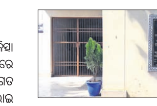
ଗତ ଜୁଲାଇ ୧୫ରେ ଏହି ଜେରିଆରିକ ଖାର୍ତ ଉଦ୍‌ଘାଟିତ ହୋଇଥିଲା। ଅନୁଗୋଳ ବିଧାନସଭା ପରିସରରେ ଉଦ୍‌ଘାଟନ କରାଯାଇଥିଲା।

ବୟସ୍କ ରୋଗୀ ବା ବରିଷ୍ଠ ନାଗରିକଙ୍କ ଚିକିତ୍ସା ପାଇଁ ଅନୁଗୋଳ ଜିଲ୍ଲା ପୁଞ୍ଜ୍ୟ ଚିକିତ୍ସାଳୟରେ