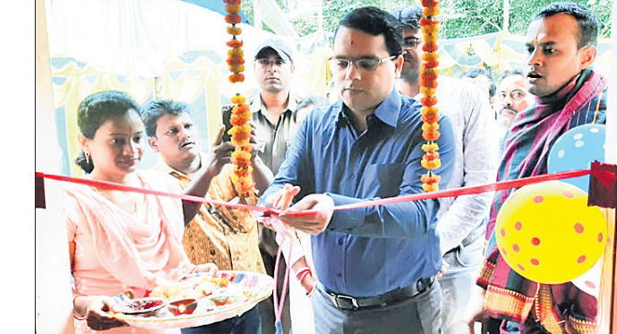
ରାଜସ୍ୱ ନିରୀକ୍ଷକଙ୍କ କାର୍ଯ୍ୟାଳୟ କୋଠା ଜିଲାପାଳ ଉଦଘାଟନ କରୁଛନ୍ତି।

ମୟୂରଭଞ୍ଜ ଜିଲ୍ଲା ଦାନ୍ତିଆମୁହାଁ ରାଜସ୍ୱ ନିରୀକ୍ଷକଙ୍କ କାର୍ଯ୍ୟାଳୟ ଗୁରୁବାର ଉଦଘାଟିତ ହୋଇଯାଇଛି।