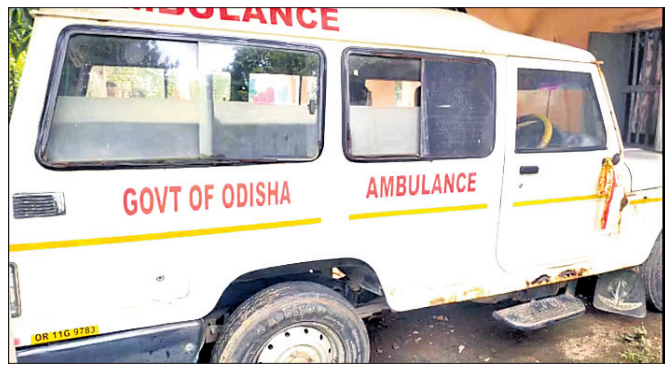
ବାଲିଗିପୋଷି ଡାକ୍ତରଖାନାର ଆମ୍ବୁଲାନ୍ସ

ବାଲିଗିପୋଷି ଗୋଷ୍ଠୀ ସାମ୍ବ୍ୟକେନ୍ଦ୍ରକୁ ଜଣେ ପ୍ରସୂତିକ୍ତା ନେଇ ବାରିପଦା ମେଡିକାଲ ଆଖୁଥିବା ବେଳେ ଆମ୍ବୁଲାନ୍ସରେ ତେଲ ସରିଯାଇଥିଲା।