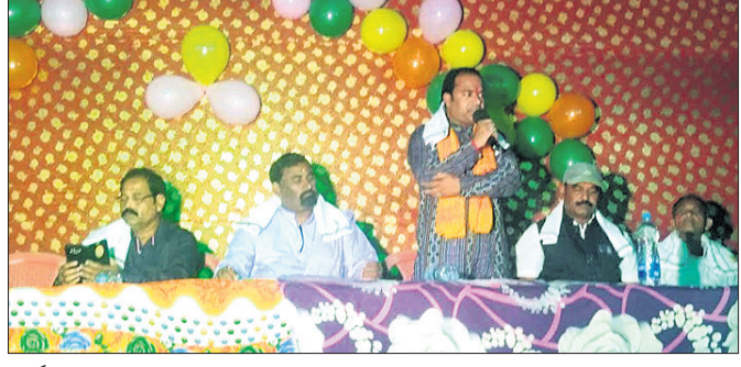
ବାର୍ଷିକ ଉତ୍ସବରେ ଉପସ୍ଥିତ ଅତିଥି ।