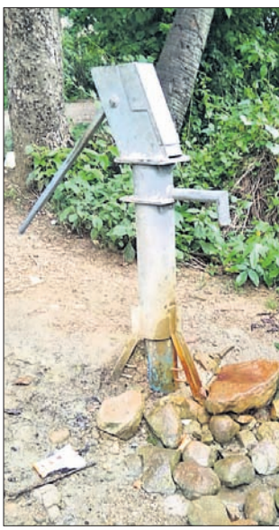
ଓ ପ୍ଲାଟଫର୍ମ (ପିଣ୍ଡ) ନିର୍ମାଣ ପାଇଁ ଅଞ୍ଚଳରେ ଯତ୍ନ ଅନୁଦାନ

■ ବିଶୁଦ୍ଧ ଜଳ ପାଇଁ ଲୋକେ ହରାହରୀ ■ ଅଭିଯୋଗ ସତ୍ତ୍ୱେ ନିଆଯାଉନି ପଦକ୍ଷେପ