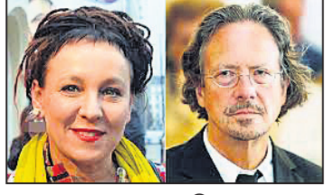
ଓଲ୍‌ଗା ଗୋକାରକୁକ୍ ପିଟର ହାଣ୍ଡକେ

ଷ୍ଟକହୋମ, ୧୦୧୦ (ଏଏଫ୍‌ସି): ପୋଲାଣ୍ଡ ଲେଖକ ଓଲ୍‌ଗା ଗୋକାରକୁକ୍ ଏବଂ ଅଷ୍ଟ୍ରିଆର ଔପନ୍ୟାସିକ ପିଟର ହାଣ୍ଡକେଙ୍କୁ ଯଥାକ୍ରମେ ୨୦୧୮ ଓ ୨୦୧୯ ବର୍ଷ ଲାଗି ସାହିତ୍ୟରେ ନୋବେଲ ପୁରସ୍କାର ପାଇଁ ମନୋନୀତ କରାଯାଇଛି। ଓଲ୍‌ଗା ହେଉଛନ୍ତି ତାଙ୍କ ସମୟର ଶ୍ରେଷ୍ଠ ଔପନ୍ୟାସିକ। ଜୀବନଶୈଳୀକୁ ନେଇ ଓଲ୍‌ଗାଙ୍କର ବିସ୍ତୃତ ତଥ୍ୟଭିତ୍ତି ଆବେଗଭରା ପରିକଳ୍ପନା ପାଇଁ ତାଙ୍କୁ ଏହି ଶ୍ରେଷ୍ଠ ପୁରସ୍କାରରେ ସମ୍ମାନିତ କରାଯାଇଛି। ଅନ୍ୟପକ୍ଷରେ ହାଣ୍ଡକେଙ୍କୁ ତାଙ୍କର ପ୍ରଭାବଶାଳୀ ସାହିତ୍ୟ ସୃଷ୍ଟି ଲାଗି ଏହି ପୁରସ୍କାର ମିଳିବାକୁ ଯାଉଛି। ଦ୍ଵିତୀୟ ବିଶ୍ଵଯୁଦ୍ଧ ପରେ ହାଣ୍ଡକେ ଯୁଗୋସ୍ଲାଭିଆର ନିକକୁ ସବୁଠୁ ପ୍ରଭାବଶାଳୀ ସାହିତ୍ୟିକ ଭାବେ ପ୍ରତିଷ୍ଠିତ କରାଯାଇଥିଲେ। ତାଙ୍କ ସୂକ୍ଷ୍ମଗାଳତ୍ୟ ଦୃଢ଼ ଉଚ୍ଚାନ୍ତରେ ପୂର୍ଣ୍ଣ, ଯାହାକୁ ନୂତନ ସାରସ୍ଵତ ଅଭିବ୍ୟକ୍ତି ଜାବତ୍ କରିଥାଏ। ଉଭୟ ସାହିତ୍ୟିକଙ୍କୁ ପୁରସ୍କାର ବାବଦରେ ୯ ନିୟୁତ ଗ୍ରୋନର (ପାଖାପାଖି ୯୧୨,୦୦୦ ଡଲାର) ମିଳିବ। ଏହି ସମ୍ମାନକ୍ରମ ପୁରସ୍କାର ପାଇବାରେ ଓଲ୍‌ଗା ହେଉଛନ୍ତି ୧୫ତମ ମହିଳା। ୧୯୦୧ରୁ ସାହିତ୍ୟରେ ଏସମ୍ପୃକ୍ତ ୧୧୬ ଜଣଙ୍କୁ ନୋବେଲ ପୁରସ୍କାର ମିଳିଛି। ଗତବର୍ଷ ଏକ ଯୌନ ନିର୍ଯାତନା ମାମଲାକୁ ନେଇ ଏହି ପୁରସ୍କାର ଘୋଷଣା ବିଳମ୍ବିତ ହୋଇଥିଲା।