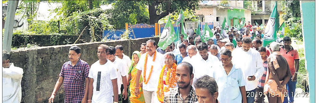
ଉପରାଜ୍ୟ ବିଧାୟକ ସମର୍ଥକଙ୍କ ସହିତ ପଦଯାତ୍ରାରେ ଯାଉଛନ୍ତି ।