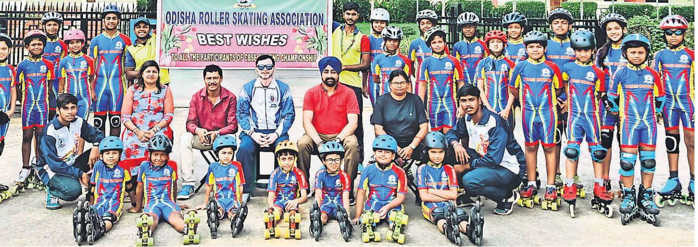
ବିଦିଆଲ କ୍ରୀଡ଼ା ଚାମ୍ପିୟନଶିପ୍‌ରେ ଭାଗନେବାକୁ ଅନୁମତି ଦିଆଯାଇଛି। ଓଡ଼ିଶା ଦଳର ଖେଳାଳିମାନେ କର୍ମକର୍ତ୍ତାଙ୍କ ସହ ଗୁରୁବାରରେ।

ଯୋଗ୍ୟତା ପର୍ଯ୍ୟାୟର ପ୍ରଥମ ଦିବସରେ ଆହୁଧାରି ଲାଭେଇ ଷ୍ଟାଡ଼ିୟମରେ ହିନ୍ଦି ଓ ଆନ୍ଧ୍ରପ୍ରଦେଶ ମଧ୍ୟରେ ମ୍ୟାଚ୍ ଅନୁଷ୍ଠିତ ହେବ। ଏଥିରେ ଲକ୍ଷ୍ମୀ ମ୍ୟାଚ୍ ଅର୍ପିତ ଆଇସିସି ଦାୟିତ୍ୱ ତୁଲାଇବେ। ଅନ୍ତର୍ଜାତୀୟ ମ୍ୟାଚ୍‌ରେ ଅର୍ପିତ ଆଇସିସି ଭାବେ ଦାୟିତ୍ୱ ତୁଲାଇ ସାରିଛନ୍ତି ଟି୨୦ ବିଶ୍ୱକପ୍ ଯୋଗ୍ୟତା ପର୍ଯ୍ୟାୟ ମ୍ୟାଚ୍‌ରେ ଅକ୍ଟୋବର ୧୮ରୁ ନଭେମ୍ବର ୨ ତାରିଖ ପର୍ଯ୍ୟନ୍ତ ଯୁଦ୍ଧରେ ଅନୁଷ୍ଠିତ ହେବ। ଏଥିରେ ୧୨ ଜଣ ଆଧ୍ୟାୟ ଚାଳିକା ମଧ୍ୟ ପ୍ରକାଶ ପାଇଛି। ଏଥିରେ ଭାରତର ସୁଦୀପା ରବି ମଧ୍ୟ ରହିଛନ୍ତି।