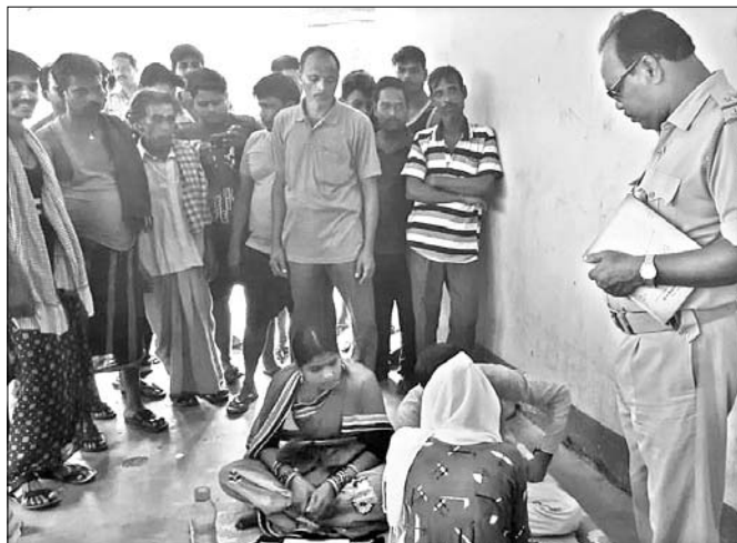
ବେଗୁନିଆ ପୋଲିସ ପକ୍ଷରୁ ତଦତ୍ତ କରାଯାଇଛି ।

ପ୍ରତିଶ୍ରୁତି ଦେଇ ଗୋଟିଏ ମହିଳା ସ୍ୱୟଂ ସହାୟକା ଗୋଷ୍ଠୀର ୪୫ ସଦସ୍ୟାଙ୍କଠାରୁ ୧୫୦୦ ଟଙ୍କା ଗତ ୬ ତାରିଖରେ ନେଇ ଟଙ୍କା ନେବା ପରେ ଉକ୍ତ ମହିଳାଙ୍କ ସହ ଯୋଗାଯୋଗ ସମ୍ପର୍କ ହୋଇ ନ ଥିଲା। ତେବେ ଉକ୍ତ ମହିଳା ନିଜର କେତେଜଣ ସହଯୋଗୀଙ୍କ ଦ୍ୱାରା ବେଗୁନିଆ ଚଳୁଥିବା ଗୋଟିଏ ଗାଁ ପରେ ଅନ୍ୟ ଗାଁକୁ ଗର୍ଭେ