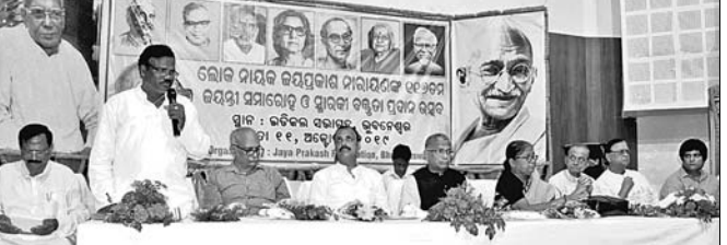
ଉତ୍ସବରେ ଯୋଗ ଦେଇଥିବା ଅତିଥିବୃନ୍ଦ।

ସାଧାରଣ ଗରିବ ଶ୍ରେଣୀର ଲୋକଙ୍କ ମୌଳିକ ସମସ୍ୟାର ସମାଧାନ ଦିନରେ ଜୟପ୍ରକାଶ ନାରାୟଣ କାର୍ଯ୍ୟ କରୁଥିଲେ। ସେ ଶୋଷଣହୀନ ସମାଜ ଗଠନ କରିବା ନିମନ୍ତେ ଅହରହ ଉଦ୍ୟମ ଚଳାଇଥିଲେ। ଜାତିର ପିତା ମହାତ୍ମା ଗାନ୍ଧୀ ଭାରତବର୍ଷକୁ ଏକ ନୂତନ ଦିଶା ଦେବା ସହିତ ସ୍ୱାଧୀନତା ଆଣିଥିଲେ। ଗଣିତାଳ ପରେ ଜୟପ୍ରକାଶ ଦେଶକୁ ଅର୍ଥନୈତିକ କ୍ଷେତ୍ରରେ ପରିବର୍ତ୍ତନ ଆଣି ଦ୍ୱିତୀୟ ସ୍ୱାଧୀନତା ଦେଇଥିଲେ ବୋଲି ରାଜ୍ୟ ସଭା ଉପାଧ୍ୟକ୍ଷ ହରିବଂଶ ମତବ୍ୟକ୍ତ କରିଛନ୍ତି। ଶୁକ୍ରବାର ଉତ୍ତରାଧିକାରୀମାନେ ଜୟପ୍ରକାଶ ଫାଉଣ୍ଡେସନ ପକ୍ଷରୁ ଲୋକନାୟକ ଜୟପ୍ରକାଶ ନାରାୟଣଙ୍କ ୧୧୭ତମ ଜୟନ୍ତୀ ଉତ୍ସବ ଓ ସ୍ମାରଣା ବସ୍ତ୍ର ପ୍ରଦାନ ଉତ୍ସବ ଅନୁଷ୍ଠିତ ହୋଇଥିଲା। ଏଥିରେ ମୁଖ୍ୟ ଅତିଥି ଭାବେ ହରିବଂଶ ଯୋଗାଦେଇ ଆନା ଅଞ୍ଚଳର ଜଣେ ମହିଳାଙ୍କ ସହ ସମିତିକ ବସ୍ତ୍ରତା ଥିଲା। ପରବର୍ତ୍ତୀ ସମୟରେ ସେ ମହିଳାଙ୍କୁ ଏକ ତରଫା ପ୍ରେମ