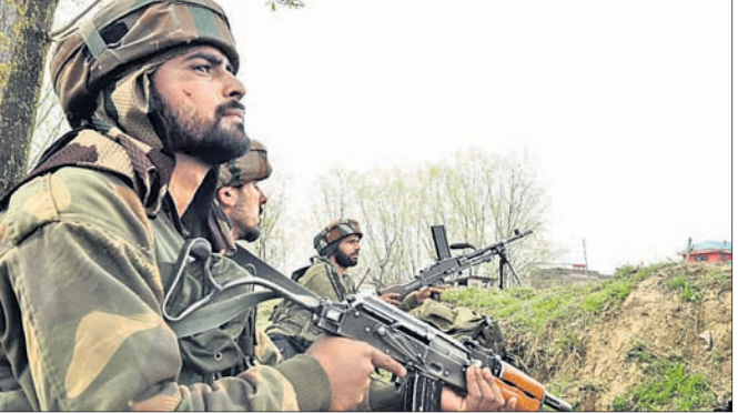
ପରେ ଏଲ୍‌ଓସିରେ ସର୍ବାଧିକ ଉଲ୍ଲଂଘନ ଦେଖାଦେଇଛି। ଭାରତ-ପାକିସ୍ତାନ ମଧ୍ୟରେ ଥିବା ୭୭୮ କି.ମି. ବିସ୍ତୃତ ଏଲ୍‌ଓସିରେ ଚଳିତବର୍ଷ ଶତପ୍ରତିଶତ ୨,୩୨୦ ଥର ଅସ୍ତବିରତି ଉଲ୍ଲଂଘନ କରିଯାଇଛି।

ନୂଆଦିଲ୍ଲୀ, ୧୧ ଅକ୍ଟୋବର (ପି.ଟି.): ପାକିସ୍ତାନ ସେନା ସମ୍ପର୍କରେ ୨ ମାସ ମଧ୍ୟରେ ୬୦୦ରୁ ଊର୍ଦ୍ଧ୍ୱ ଅସ୍ତବିରତି ଉଲ୍ଲଂଘନ କରାଯାଇଛି।