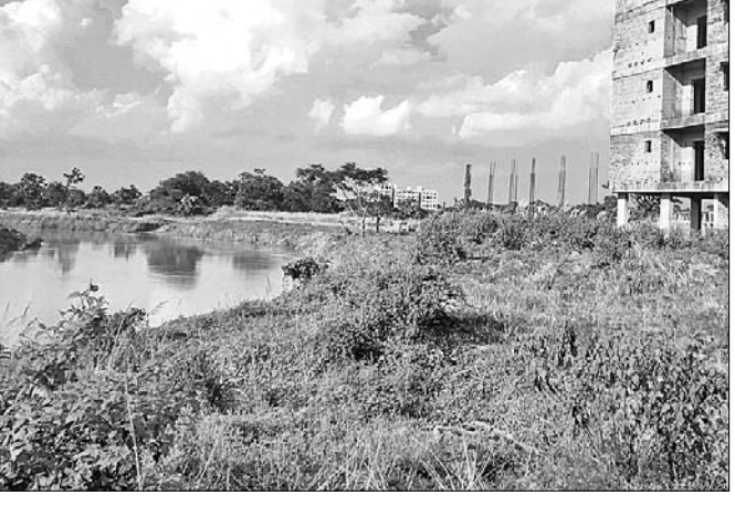
ଗାଝୁଆ ନଦୀ ।

କ୍ରେନ ସଂଯୋଗ ଯୋଗୁ ଏହା ପ୍ରତ୍ୟେକ ଦିନ ଆଖ୍ୟା ପାଇଲାଣି। ସେହିଭଳି ଗଜୁଆ ନଦୀ ଗତିପଥ ବଦଳାଇ ଚାଷୀ ଓ ଚାଷ ପ୍ରତି ବିପଦ ସୃଷ୍ଟି କରିଛି ବୋଲି ଚାଷୀମାନେ କହୁଛନ୍ତି। ଜଳସେଚନ ଆଦି ଗ୍ରାମ ଦେଇ ଗଜୁଆରେ ମିଶିଛି। ପ୍ରାକୃତିକ ଜଳଉତ୍ସରୁ ନିକଟ ମଧ୍ୟ ଗଜୁଆ ନଦୀ ଭଳି ଅନୁଭୂତ ଅବସ୍ଥା ପାଇଛନ୍ତି। ଅବବାହିକା ପୋତି ହୋଇଯିବା,