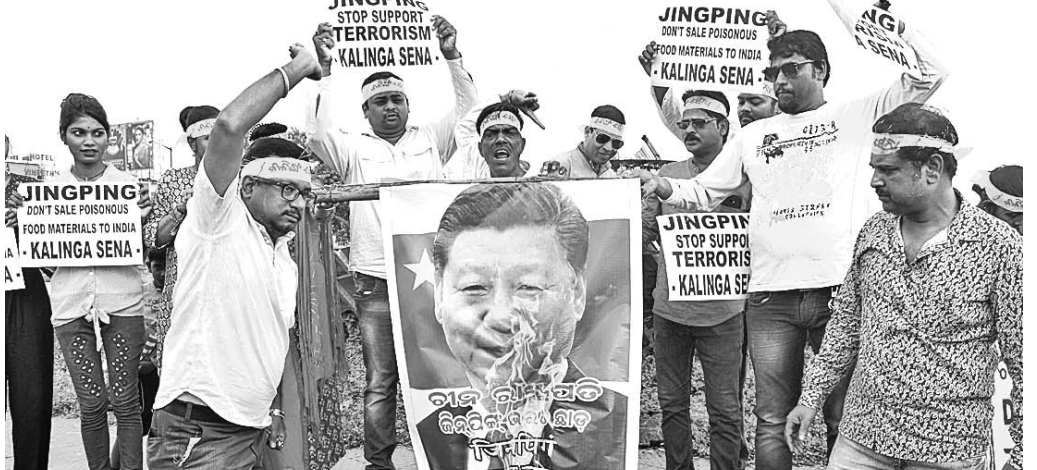
ଚାଳନା ରାଷ୍ଟ୍ରପତି ଡି ଜିଂପିଂଙ୍କ ଭାରତ ଗସ୍ତକୁ ବିରୋଧ କରି ଶୁକ୍ରବାର କଳିଙ୍ଗ ସେନା ପକ୍ଷରୁ ମାଷ୍ଟରକ୍ୟାଣ୍ଡିନାରେ ଚାକ୍ ଫଗୋଟିପ୍ରସ୍ତୁତ ଦାହ କରୁଛି।