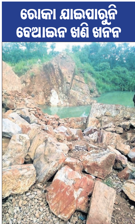
ଖୋର୍ଦ୍ଧା ଅଫିସ, ୧୧/୧୦

ଖୋର୍ଦ୍ଧା ତହସିଲ ନରଗରଠା ଅଞ୍ଚଳରେ ଥିବା ବଉଳମାଳ ପଥର ଖଣିର ନିଲାମ ପ୍ରାୟ ୬ ବର୍ଷ ଧରି ବନ୍ଦ ରହିଛି। ହେଲେ ବେଆଇନ ଖଣି ଖନନକୁ ରୋକା ଯାଇପାରୁନି। କିଛିଦିନ ତଳେ ନୟାଗଡ଼ ଜିଲାର