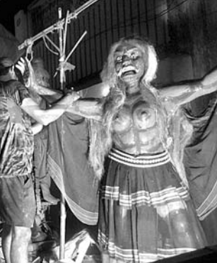
ରାଜଧାନୀ ଉପକଣ୍ଠ ଭିଜ୍ଞାନପୁରର ଦୁର୍ଗାପୂଜା ଭବାଣୀରେ ବାହାରିଥିବା ଏକ ମେଡ଼।

ବାଲିଅନ୍ତା, ୧୧୧୦(ଡି.ଏନ୍.ଏ.): ବାଲିଅନ୍ତା ବ୍ଲକ୍ ଅଧୀନ ଭିଜ୍ଞାନପୁର ଅଞ୍ଚଳରେ ଦୁର୍ଗାପୂଜା ଭବାଣୀ ଉତ୍ସବ ଶୁକ୍ରବାର ଧୂମଧାମରେ ଅନୁଷ୍ଠିତ ହୋଇଯାଇଛି। ଏଥିରେ ୭ଟି ମେଡ଼ ସାମିଲ ହୋଇଥିଲେ। ଭିଜ୍ଞାନପୁର ପଞ୍ଚପଦର ନାଟକ ସମିତିର ମା'ଙ୍କ ଦୁର୍ଗାପୂଜା ମଣ୍ଡପ ନିକଟରେ ଅପରାହ୍ଣ ୪ଟାରେ ପ୍ରଥମେ ମେଡ଼ଗୁଡ଼ିକ ଏକତ୍ର ହୋଇଥିଲେ। ସେଠାରେ ପୂର୍ବରୁ କାରକରେ ଉଠିଥିବା ନାମ ଅନୁସାରେ ପ୍ରଥମେ ମହାଦେବ ସାହିର ମହାବୀରଙ୍କ ମୂର୍ତ୍ତି ଶୋଭାଯାତ୍ରାରେ ବାହାରିଥିଲା। ତାଙ୍କ ପଛକୁ ବଣିଆ ସାହିର ଲକ୍ଷ୍ମୀ ନାରାୟଣ, ବଜାର ସାହିର ମହାବୀର, ମୁକୁଳି ସାହିର ଲକ୍ଷ୍ମୀ ନାରାୟଣ, ମହାଦେବ ସାହିର ମହାଦେବ, ରାମଚନ୍ଦ୍ରପୁରର ରାମ,