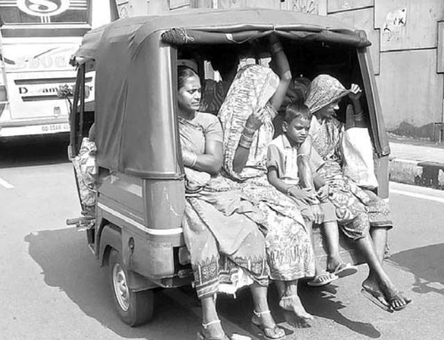
ବିପଦକୁ ବେଝାରିବ: ଭୁବନେଶ୍ୱର-କଟକ ଗାଡ଼ୀର ଭାରତପଥରେ ଏକ ଅଗୋରେ ଯାତ୍ରୀମାନେ ବିପଦକୁ ଅବଗ୍ରେ ଗତବ୍ୟମୁକ୍ତ ଯାଇଛନ୍ତି।