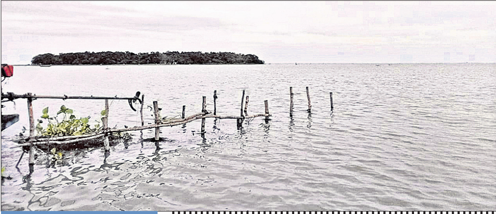
ଦୀନନ ଶ୍ରମିକ ଭାବେ ହେଉଛନ୍ତି ବାହାର ରାଜ୍ୟ ମୁହଁ

ଚିଲିକା ଉପରେ ପେଟପାଟଣା ପାଇଁ ନିକରଣୀଳ ୨ ଲକ୍ଷ ମହାଧଳାଦୀ ଏବେ ଚିକ୍ତାରେ ପଡିଛନ୍ତି। ଚିଲିକାକୁ ଭାତହାଣ୍ଡି ମନେକରି କୌଳିକ ବୃଦ୍ଧି ଭାବେ ମାଛ ଧରି ମହାଧଳାଦୀ ପରିବାର ପ୍ରତିପୋଷଣ କରି ଆସୁଥିଲେ। ଏବେ ଚିଲିକା ମାଛ ରାହିଦା ମେଘାଇ ପାଠୁ ନ ଥିବାରୁ ସେମାନେ ଦୀନନ ଶ୍ରମିକ ଭାବେ ବାହାର ରାଜ୍ୟମୁହଁ ହେଲେଣି। କେତେକଙ୍କ ମହାଧଳାଦୀ ପ୍ରତ୍ୟହ ଟ୍ରେଡ୍ ଯୋଗେ ଭୁବନେଶ୍ୱର, କଟକ ଦିନମୁକ୍ତିଆ କାମ କରିବାକୁ ଯାଉଛନ୍ତି। ଅନ୍ୟପକ୍ଷେ ଯାହା କିଛି ମାଛ ଧରା ହେଉଛି, ତାହା ଗ୍ଲାନାୟ ଚାହିଦା ମେଘାଇ ପାଠୁ ନାହିଁ। ଫଳରେ ଗାଁକୁ ଗାଁ ବୁଲି ଖୁରୁଆ ମାଛ ବିକ୍ରିଥିବା କେବେବି ମହିଳାମାନେ ଶ୍ରମିକ ଭାବେ କାମ କରିବାକୁ ବାଧ୍ୟ ହେଉଛନ୍ତି ବୋଲି ମହାଧଳାଦୀ ସଂଘ ପକ୍ଷରୁ କୁହାଯାଇଛି।