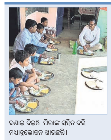
ବଣାଇ ବିଲଓ ପିଲାଙ୍କ ସହିତ ବସି ମଧ୍ୟାହ୍ନଭୋଜନ ଖାଇଛନ୍ତି।

ସମୟରେ କେହି ଜଣେ ଫଟୋ ଉଠାଇ ସୋସିଆଲ ମିଡ଼ିଆରେ ଭାଇଭାଉଁ କରିଥିଲେ। ଭାଇଭାଉଁ ପରେ ଜିଲାପାଳ କାର୍ଯ୍ୟାନୁଷ୍ଠାନ ଗ୍ରହଣ କରିଛନ୍ତି। ଏ ବିଷୟରେ ବ୍ଲକ୍ ଶିକ୍ଷା ଅଧିକାରୀଙ୍କୁ ପଚାରିବାରୁ ସେ ବିଦ୍ୟାଳୟରେ ମଧ୍ୟାହ୍ନଭୋଜନ ପରଖିଥିଲେ, ମାତ୍ର ସେଠାରେ ତିଳେଇ କିମ୍ବା ମଟର ତାଙ୍କ ଥାଳିରେ ନ ଥିବା ପ୍ରକାଶ କରିଛନ୍ତି। ତାଙ୍କ କହିବା ମୁତାବକ ତଳେ ବସି ଛାତ୍ରଛାତ୍ରୀଙ୍କ ସହିତ ଖାଇଥିଲେ। ପିଲାଙ୍କ ଥାଳିରେ କେବଳ ତାଳମା ଭାତ ରହିଥିଲା। ମାତ୍ର ଶିକ୍ଷା ଅଧିକାରୀଙ୍କ ଖାଇବା ଥାଳିରେ ଭାତ ସହିତ ତିଳେଇ ଏବଂ ବିଲିନ ଭଜା ଖାଦ୍ୟ ରହିଥିଲା। ସେ ଏହାକୁ ଖାଇବା