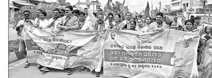
ପଦଯାତ୍ରାରେ ସାମିଲ ହୋଇଥିବା ନେତା ଓ କର୍ମୀମାନେ ।