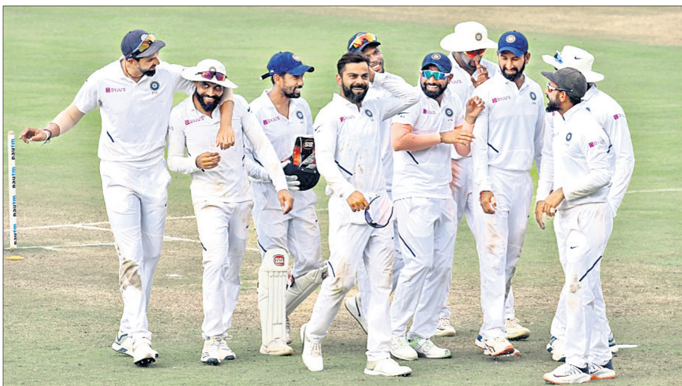
ବିଜୟ ହାସଲ ପରେ ଉଲ୍ଲସିତ ଭାରତୀୟ ଖେଳାଳି ।

ପୁଣେ, ୧୩।୧୦(ପି.ବି.) ବିରାଟ କୋହଲିଙ୍କ ନେତୃତ୍ୱାଧୀନ ଇନ୍ଦିୟ ଦଳ ଗୋଟିଏ ଦିନୀୟ ଟେଷ୍ଟ ମ୍ୟାଚରେ ଚୀନ ଦଳକୁ ୨୦୦ ରନରେ ହରାଇ ବିଜୟ ହାସଲ କରିଥିଲା।