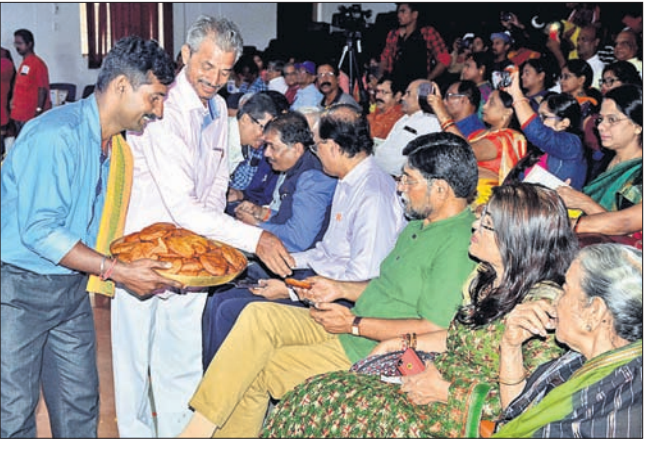
କାର୍ଯ୍ୟକ୍ରମରେ କାକରାପିଠା ବଣ୍ଟନ କରାଯାଇଛି।

ପାଠ୍ୟ ଏହାକୁ ସଂଯୋଜନା କରିଥିଲେ। ଏହି ଅବସରରେ କୁଆଁର ପୁନେଇଁ କହିଲେ... କାର୍ଯ୍ୟକ୍ରମର ଗୋଭେନିୟର ଉଦ୍ଦେଶ୍ୟ ହୋଇଥିଲା। ନରେନ୍ଦ୍ରପୁରର ରାଜେନ୍ଦ୍ର ପାତ୍ର ଓ ଦଳ ଶଙ୍ଖବାଦ୍ୟ ପରିବେଷଣ କରିଥିଲେ।