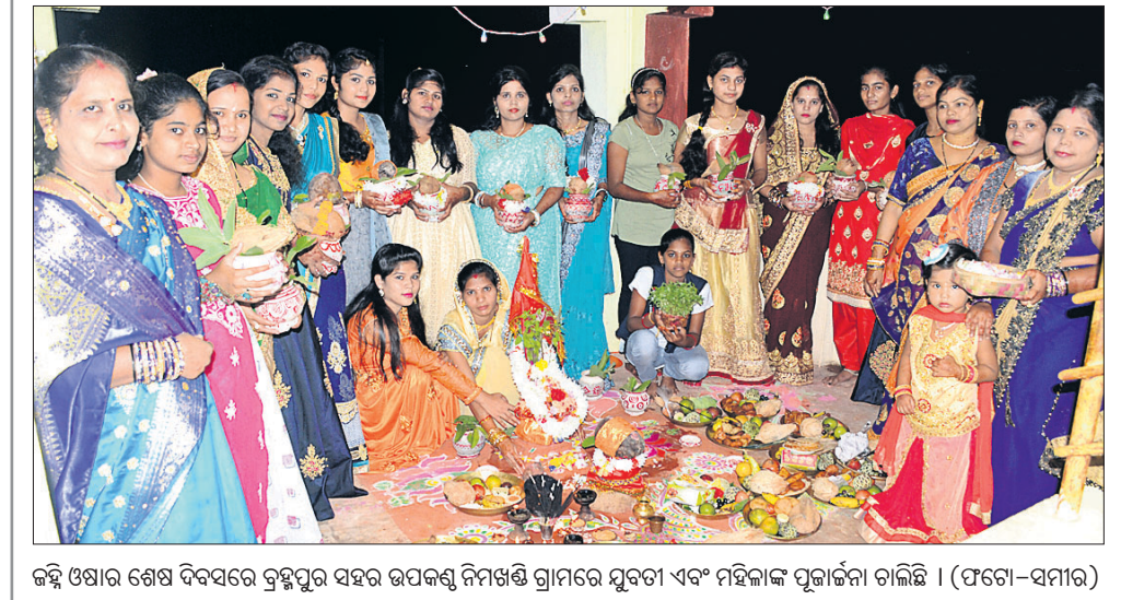
କଞ୍ଚି ଓଷାର ଶେଷ ଦିନରେ ବ୍ରହ୍ମପୁର ସହର ଉପକଣ୍ଠ ନିମଖଣ୍ଡି ଗ୍ରାମରେ ଯୁବତୀ ଏବଂ ମହିଳାଙ୍କ ପୂଜାର୍ଚ୍ଚନା ଚାଲିଛି ।

ସତ୍ୟସାଧୁ ସେବା ସମିତିର ସ୍ୱଚ୍ଛତା କାର୍ଯ୍ୟକ୍ରମ । ସତ୍ୟସାଧୁ ସେବା ସମିତିର ସ୍ୱଚ୍ଛତା କାର୍ଯ୍ୟକ୍ରମ । ସତ୍ୟସାଧୁ ସେବା ସମିତିର ସ୍ୱଚ୍ଛତା କାର୍ଯ୍ୟକ୍ରମ ।