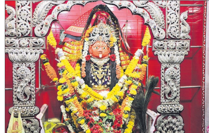
ମା' କାଳୁଆ ଠାକୁରାଣୀ ।

ଗୋଷାଣୀନ୍ଦୁଆଁ କାଳୁଆ ଯାତ୍ରା ଉଦ୍‌ଯାପିତ । ଗୋଷାଣୀନ୍ଦୁଆଁ କାଳୁଆ ଯାତ୍ରା ଉଦ୍‌ଯାପିତ । ଗୋଷାଣୀନ୍ଦୁଆଁ କାଳୁଆ ଯାତ୍ରା ଉଦ୍‌ଯାପିତ ।