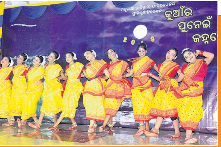
କୁମାରୀମାନେ ଠିଆପୁଡ଼ି ନାରଙ୍ଗ ନୃତ୍ୟ ପରିବେଷଣ କରୁଛନ୍ତି।