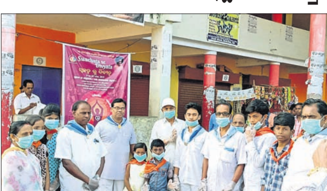
ସତ୍ୟସାଧୁ ସେବା ସମିତିର ସ୍ୱଚ୍ଛତା କାର୍ଯ୍ୟକ୍ରମ ।

ସତ୍ୟସାଧୁ ସେବା ସମିତିର ସ୍ୱଚ୍ଛତା କାର୍ଯ୍ୟକ୍ରମ । ସତ୍ୟସାଧୁ ସେବା ସମିତିର ସ୍ୱଚ୍ଛତା କାର୍ଯ୍ୟକ୍ରମ । ସତ୍ୟସାଧୁ ସେବା ସମିତିର ସ୍ୱଚ୍ଛତା କାର୍ଯ୍ୟକ୍ରମ ।