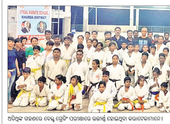
ଅତିଥିକ୍ ଗହଣରେ ବେଲ୍ ଗ୍ରେଡ଼ିଂ ପରୀକ୍ଷାରେ ଭରାଣ୍ଟ ହୋଇଥିବା କରାଟୋକାମାନେ।

ଟୁର୍ନାମେଣ୍ଟରୁ ଓଡ଼ିଶା ବାଦ୍ ପଡ଼ିଥିଲେ ସୁଦ୍ଧା ଚଳିତ ବର୍ଷର ପ୍ରଦର୍ଶନ ଗତ ୫ ବର୍ଷ ମଧ୍ୟରେ ଶ୍ରେଷ୍ଠ ରହିଛି। ବର୍ତ୍ତମାନ ସୁଦ୍ଧା ଓଡ଼ିଶା ୩ ମ୍ୟାଚ୍ରେ ବିଜୟୀ ହୋଇ ସାରିଲାଣି। ଆଉ ଗୋଟିଏ ମ୍ୟାଚ୍ ବାଜି ରହିଅଛି। ଗତ ଦୁଇ ସଂସ୍କରଣରେ ଓଡ଼ିଶା ୨ଟି ଲେଖାଏ ମାଚ୍ ଜିତିଥିଲା। ଏହାର ପୂର୍ବ ୨ ସଂସ୍କରଣରେ ଗୋଟିଏ ଲେଖାଏ ମାଚ୍ ଓଡ଼ିଶା ବିଜୟୀ ହୋଇଥିଲା।