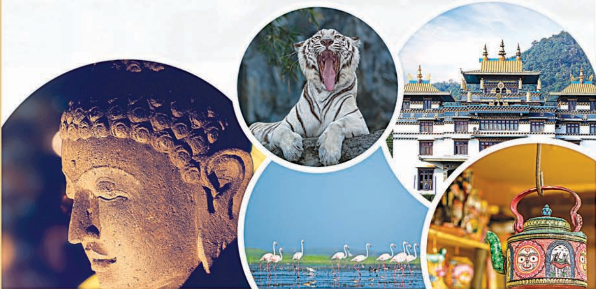
Department of Tourism, Government of Odisha www.odishatourism.gov.in