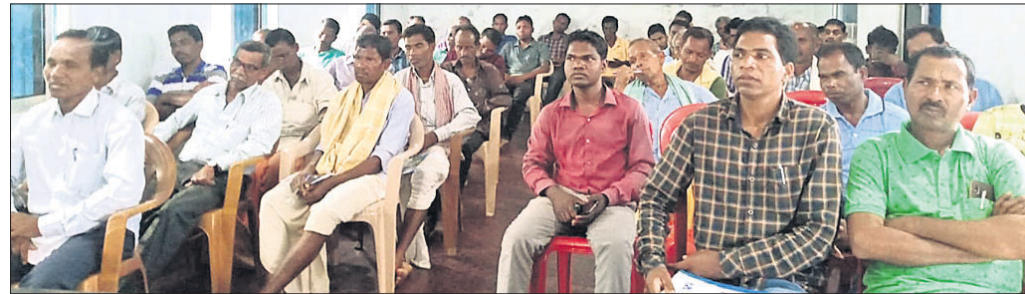
ଶିବିରରେ ଉପସ୍ଥିତ କୃଷକ ।

କଞ୍ଚି ଓଷାର ଶେଷ ଦିନରେ ବ୍ରହ୍ମପୁର ସହର ଉପକଣ୍ଠ ନିମଖଣ୍ଡି ଗ୍ରାମରେ ଯୁବତୀ ଏବଂ ମହିଳାଙ୍କ ପୂଜାର୍ଚ୍ଚନା ଚାଲିଛି । ସତ୍ୟସାଧୁ ସେବା ସମିତିର ସ୍ୱଚ୍ଛତା କାର୍ଯ୍ୟକ୍ରମ । ସତ୍ୟସାଧୁ ସେବା ସମିତିର ସ୍ୱଚ୍ଛତା କାର୍ଯ୍ୟକ୍ରମ ।