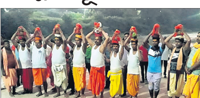
କଳସ ଶୋଭାଯାତ୍ରା ।