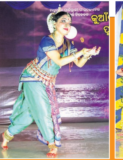
କାତୀୟ ପୁରୁଷାନ୍ତ୍ରପ୍ରସ୍ତ ଅଭିନୀତ ଦଳ ଓଡ଼ିଶା ନୃତ୍ୟ ପରିବେଷଣ କରୁଛନ୍ତି।