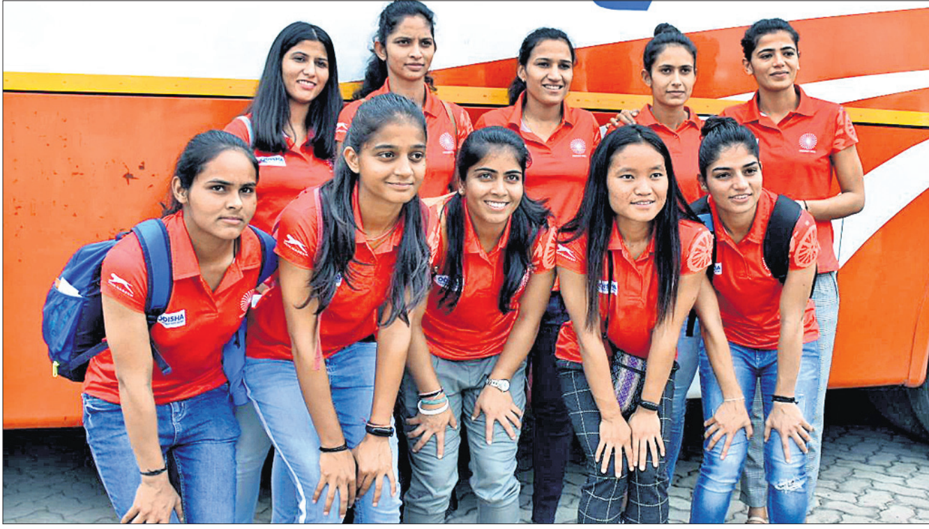
କଳିଙ୍ଗ ଷ୍ଟାଡ଼ିୟମରେ ହେବାକୁ ଥିବା ଜାତୀୟ କ୍ୟାମ୍ପ ଲାଗି ଉଦ୍ଦିଷ୍ଟ ବିଶ୍ୱ ପକ୍ଷୀୟ ଅନ୍ତର୍ଜାତୀୟ ବିଦ୍ୟାଳୟରେ ପହଞ୍ଚିଥିବା ଭାରତୀୟ ମହିଳା ହକି ଖେଳାଳି।

ଅଲମେନ, ୧୩।୧୦(ପି.ଟି.): ଉପାଧିକାର ବ୍ୟାଡମିଣ୍ଟନ ଚାଲଟ ଭାରତର ଲକ୍ଷ୍ୟ ସେନ ଆଉ ଏକ ବିଶ୍ୱସ୍ତ୍ରୀୟ ସଫଳତା ଅର୍ଜନ କରିଛନ୍ତି। ନେଦରଲାଣ୍ଡର ଅଲମେନଠାରେ ଖେଳାଯାଇଥିବା ଡର୍ ଓପନ୍ ବ୍ୟାଡମିଣ୍ଟନ ଟୁର୍ନାମେଣ୍ଟରେ ସେ ଗାଇଟଲ ହାସଲ କରିଛନ୍ତି। ଉଦ୍ଦିଷ୍ଟ ଅନୁଷ୍ଠିତ ପୁରୁଷ ସିଙ୍ଗଲ୍ ଫାଇନାଲ ମ୍ୟାଚ୍ରେ ୧୮ ବର୍ଷୀୟ ଲକ୍ଷ୍ୟ ୧୫-୨୧, ୨୧-୧୪, ୨୧-୧୫ରେ ବିଶ୍ୱ ୧୬୦ ନମ୍ବର ଖେଳାଳି ଜାପାନର ଯୁସୁକ ଓନୋତୋଙ୍କୁ ପରାସ୍ତ କରି ଚାମ୍ପିୟନ ହୋଇଛନ୍ତି। ବିଜୟ ହେବା ପାଇଁ ତାଙ୍କୁ ୬୩ ମିନିଟ୍ ସମୟ ଆବଶ୍ୟକ ହୋଇଥିଲା। ଏଥିପରି ଲକ୍ଷ୍ୟ କ୍ୟାରିୟରର ପ୍ରଥମ ବିଦେଶୀୟ ଖୁବ୍ ଚାମ୍ପିୟନ ହୋଇଛନ୍ତି। ଏହି ଲଭେଇ ବିଦେଶୀୟ ଖୁବ୍ ଚାମ୍ପିୟନ ସୁପର ୧୦୦ ବିଦେଶୀୟ ଖେଳାଳି ପ୍ରଥମ ଗେମ୍ରେ ପରାସ୍ତ ହୋଇଥିଲେ ମଧ୍ୟ ଲକ୍ଷ୍ୟ ପ୍ରତ୍ୟାବର୍ତ୍ତନ କରି ଦ୍ୱିତୀୟ ଓ ତୃତୀୟ ଗେମ୍କୁ ହାତରେ ନେଇଥିଲେ। ଲକ୍ଷ୍ୟ ଏବେ ବିଶ୍ୱ ର୍ୟାଙ୍କିଙ୍ଗର ୭୨ତମ ସ୍ଥାନରେ ରହିଛନ୍ତି। ଗତମାସ ସେ ଦେଲହୀଆନ ଓପନ୍ ଚାମ୍ପିୟନ ହୋଇଥିଲେ। ସେ ମଧ୍ୟ ଏସିଆନ ଚାମ୍ପିୟନ ଚାମ୍ପିୟନଶିପ୍ରେ ଚାମ୍ପିୟନ ହୋଇଥିଲେ। ପୁର ଅଲିମ୍ପିକ୍ ଗେମ୍ରେ ସେ ଗୋପ୍ୟ ପଦକ ଜିତିଥିଲେ। ସେହିପରି ଗତବର୍ଷ ବିଶ୍ୱ ଚାମ୍ପିୟନ ଚାମ୍ପିୟନଶିପ୍ ସେ ଖ୍ରୀଷ୍ଟ ପଦକ ହାସଲ କରିଥିଲେ।