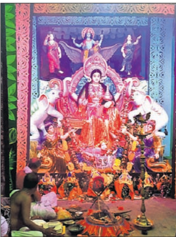
ମତେରେ ପୂଜା ପାଉଥିବା ମା' ଗଜଲକ୍ଷ୍ମୀଙ୍କ ମୂର୍ତ୍ତୀ । ବାବୁଆଳି ମାଧ୍ୟମରେ ହେଲମେଟ ବିନା ଗାଡ଼ି ଚଳାଇବା ବିପଦ ସଚେତନତା ବାର୍ତ୍ତା ।

ଭଦ୍ରକ ଜିଲ୍ଲା ଗନ୍ଧବାଳି ବ୍ଲକ ମତେର ପ୍ରସିଦ୍ଧ ଗଜଲକ୍ଷ୍ମୀ ପୂଜା କୁମାର ପୂର୍ଣ୍ଣିମାଠାରୁ ଆରମ୍ଭ ହୋଇଛି । ପୂଜା ପାଇଁ ସମଗ୍ର ଅଞ୍ଚଳ ଉତ୍ସବମୁଖର ହୋଇଉଠିଛି । ରଜନି ଆଲୋକମାଳାରେ ପରିବେଶ ଝଲୁଛି । ସୁନ୍ଦର ସାକ୍ଷରୀ ସାଙ୍ଗକୁ ଲାଲ୍ ଓ ଚୋରଣ ଆକର୍ଷଣର କେନ୍ଦ୍ରବିନ୍ଦୁ ପାଲଟିଛି । ସେହିପରି ପାର୍ଶ୍ୱମୂର୍ତ୍ତି, 'ହେଲମେଟ ବିନା ଗାଡ଼ି ଚଳାଇବା ବିପଦ', 'କାଳନେମି ବଧ', 'ସତା ସାବିତ୍ରୀ', 'ସାତା ହରଣ' ଆଦି ସାମାଜିକ ସମସ୍ୟା ଓ ଯୌଗିକ କଥା ସମ୍ପର୍କିତ ବାବୁଆଳି ଦର୍ଶକଙ୍କୁ ବାନ୍ଧି ରଖୁଛି । ବାବୁଡ଼ି ଖେଳକୁ ଏଠାରେ ଆରମ୍ଭ ହୋଇଥିବା ଏହି ପୂଜା ଚଳିତ ବର୍ଷ ୭୦ ବର୍ଷରେ ପଦାର୍ପଣ କରିଛି । ସପ୍ତାହ ବ୍ୟାପୀ ଆସନ୍ତା ୧୯ ତାରିଖ ପର୍ଯ୍ୟନ୍ତ ଗଜଲକ୍ଷ୍ମୀଙ୍କ ପୂଜା ଚାଲିବ । ୨୦ ତାରିଖରେ ଭବାଣି ଶୋଭାଯାତ୍ରା । ସ୍ଥାନୀୟ ଲୋକଙ୍କର ଧାନ ଗଣ ପୂଜା ବେଉସା । ଧାନ ଅମଳର ପ୍ରାୟ ସମୟରେ ଏହି ପୂଜା ପାଳିତ ହେଉଥିବାରୁ ଅଧିକ ଅମଳ ପାଇଁ ସମସ୍ତେ ମା'ଙ୍କ ପାଖରେ ପ୍ରାର୍ଥନା କରିଥାନ୍ତି । ମା'ଙ୍କ ଦୈନିକ ଖୋଡ଼ଣ