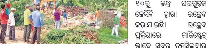
କେସିଏ ଦ୍ୱାରା ଜବରଦଖଲ ଉଚ୍ଛେଦ କରାଯାଇଛି।

ବାଲେଶ୍ୱର ଜିଲା ପ୍ରଶାସନ ପକ୍ଷରୁ ଆରମ୍ଭ ହୋଇଥିବା ମିଶନ୍ 'ବିୟୁଟି ସିଟି' ପାଇଁ ଉଚ୍ଛେଦ ପ୍ରକ୍ରିୟାକୁ ତଳିତବର୍ଷ ଦୁର୍ଗାପୂଜା ପାଇଁ ବନ୍ଦ କରାଯାଇଥିଲା। ପୂର୍ବ ନିର୍ଦ୍ଧାରିତ ଯୋଜନା ଅନୁଯାୟୀ ସୋମବାର ପୂର୍ବାହ୍ନରେ ଡେଲେଜାସାହି-ଶୋଭା ଚାମ୍ପିରୁ