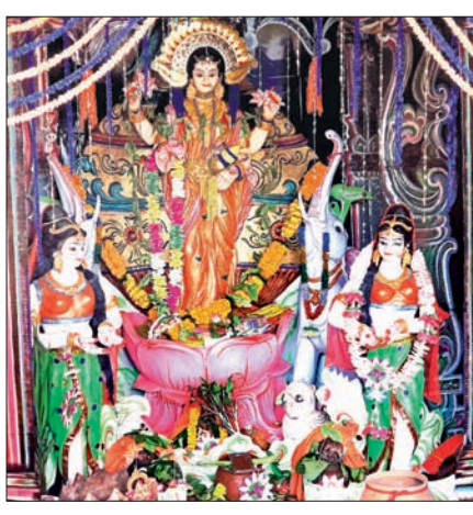
କେନ୍ଦୁଆପଦା ଛକ ପୂଜା ମତେ ।

ଭଦ୍ରକ ଜିଲ୍ଲାର ପ୍ରସିଦ୍ଧ ଗଜଲକ୍ଷ୍ମୀ ପୂଜା ବନ୍ଧୁ ଧାନ ଛକ ଓ କେନ୍ଦୁଆପଦା ଛକଠାରେ ରବିବାରଠାରୁ ଆରମ୍ଭ ହୋଇଛି । ଏଥିପାଇଁ ବନ୍ଧୁ ଅଞ୍ଚଳ ଉତ୍ସବମୁଖର ହୋଇଛି । ଭଦ୍ରକ ସମେତ