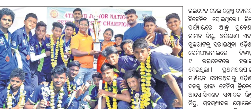
ଅତିଥିକ ଗହଣରେ ପ୍ରତି ସହ ଚାମ୍ପିୟନ୍ ଓଡ଼ିଶା ଦଳ ।

ଭୁବନେଶ୍ୱର, ୧୪।୧୦ (କ୍ରୀଡ଼ା ପ୍ରତିନିଧି) ଜାତୀୟ ସର୍ବଜ୍ଞାନିୟର ଚେନିସ କ୍ରିକେଟର ୪ର୍ଥ ସଂସ୍କରଣ ଯୋଗ୍ୟତା ଉତ୍ତରାଖଣ୍ଡରେ ଉଦ୍‌ଯାପିତ ହୋଇଛି। ଏହାର ଫାଇନାଲରେ ଝାଡ଼ଖଣ୍ଡକୁ ୬୬ ରନରେ ହରାଇ ଓଡ଼ିଶା ପ୍ରଥମଥରପାଇଁ ଚାମ୍ପିୟନ ହୋଇଛି। ଚପ୍ ଜିତିଥିବା ଓଡ଼ିଶା ପ୍ରଥମେ ବ୍ୟାଟିଂ କରି ନିର୍ଦ୍ଧାରିତ ୧୦ ଓଭରରେ ୩ ଉଇକେଟ ହରାଇ ୧୨୮ ରନ କରିଥିଲା। ଜବାବରେ ଝାଡ଼ଖଣ୍ଡ ପୁରା ଓଭର ଖେଳିଥିଲେ ହେଁ ୬ ଉଇକେଟ ହରାଇ ୬୨ ରନ କରିଥିଲା। ଓଡ଼ିଶାର ବ୍ୟାଟିଂ ସମ୍ପାଦକ ପଦ ସମ୍ଭାଳିବେ।