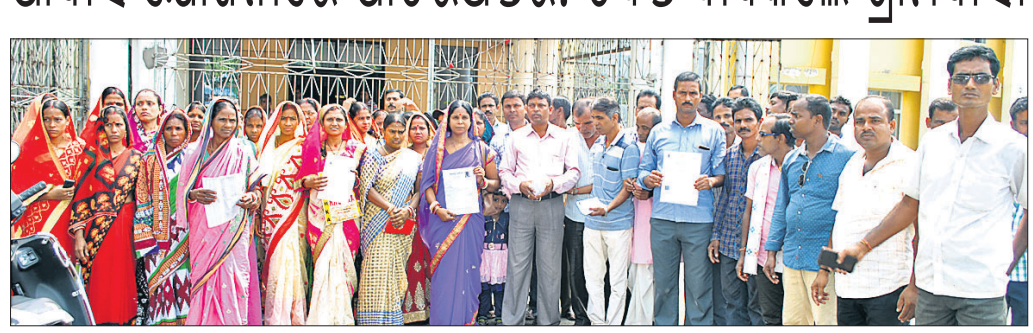
ଜିଲ୍ଲାପାଳଙ୍କ କାର୍ଯ୍ୟକ୍ରମ ସମ୍ମୁଖରେ ଗ୍ରାମବାସୀ ।