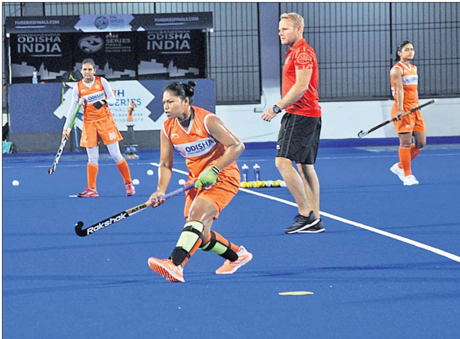
କଲିଙ୍ଗ ଷ୍ଟାଡ଼ିୟମରେ ମହିଳା ଦଳର ଖେଳାଳିଙ୍କ ଅଭ୍ୟାସ ।