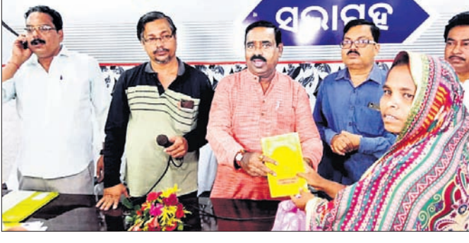
ବିଧାୟକ ଜଣେ ହିତାଧିକାରୀଙ୍କୁ ଭବା ବନ୍ଧନ କରୁଛନ୍ତି।