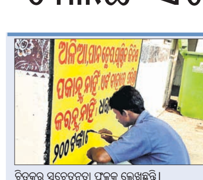
ଚିତ୍ରକର ସଚେତନତା ଫଳକ ଲେଖୁଛନ୍ତି ।

ଭଦ୍ରକ ଜିଲ୍ଲା ମୁଖ୍ୟ ଚିକିତ୍ସାଳୟ ବିଭିନ୍ନ ସମୟରେ ନାନା ଚର୍ଚ୍ଚାରେ ରହିଆସିଛି । 'ମୋ ସରକାର ଯୋଜନା'ର ସମାପ୍ତ ପାଇଁ ୫-ଟି ସଚିବ ଓ ରାଜ୍ୟ ସ୍ୱାସ୍ଥ୍ୟ ବିଭାଗ ଅଧିକାରୀ ପ୍ରମୁଖ ଭଦ୍ରକ ଜିଲ୍ଲା ଚିକିତ୍ସାଳୟ ପରିବର୍ତ୍ତନରେ ଆସିବା କାର୍ଯ୍ୟକ୍ରମ ଥିବାରୁ ଜିଲ୍ଲା ସ୍ୱାସ୍ଥ୍ୟ ବିଭାଗ ଚଳଚଞ୍ଚଳ ହୋଇଉଠିଛି । ରାତାରାତି କେଉଁଠି ଫଳକ ଲେଖା ଚାଲିଛି ତ ଆଉ କେଉଁଠି ରଙ୍ଗ ଦିଆଯାଉଛି ହେଲେ ଭିଜୁଲିରେ ସୁଧାର ନାହିଁ କି ଛିତିରେ ଆସୁନି ପରିବର୍ତ୍ତନ । କେବଳ ଜିଲ୍ଲା ମୁଖ୍ୟ ଚିକିତ୍ସାଳୟ ବୁହେଁ ସାରା ଜିଲ୍ଲାରେ ତାଲୁକ, କର୍ମଚାରୀ ଅଭାବ ଆଦି କାରଣରୁ ସ୍ୱାସ୍ଥ୍ୟସେବା ବିପର୍ଯ୍ୟସ୍ତ ହୋଇପଡ଼ୁଛି । ତାଲୁକଖାନାଗୁଡ଼ିକର ଉନ୍ନତି ଲାଗି ସରକାର ବିପୁଳ ଟଙ୍କା ଖର୍ଚ୍ଚ କରିବା ସହ ମାରଣାରେ ଔଷଧ ଏବଂ ଅନ୍ୟାନ୍ୟ ସୁବିଧା ଯୋଗାଇ ଦେଉଥିବା ବେଳେ ଜିଲ୍ଲାବାସୀ ସରକାରୀ ସ୍ୱାସ୍ଥ୍ୟସେବାକୁ ଦୃଷ୍ଟି ହେବା ଉଦ୍‌ଦେଶ୍ୟ କାରଣ ହୋଇଛି । ଜିଲ୍ଲା ମୁଖ୍ୟ ଚିକିତ୍ସାଳୟରେ ଶତାଧିକ ରୋଗୀ