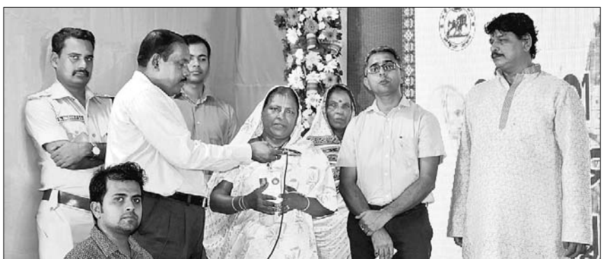
ଭିଡ଼ି କନ୍ଦର୍ପରେଣୁ ମାଧ୍ୟମରେ ମୁଖ୍ୟମନ୍ତ୍ରୀ ନବୀନ ପଟ୍ଟନାୟକଙ୍କ ସହ ଜଣେ ହରିଷ୍ଠିଆଳି କଥା ହେଉଛନ୍ତି।