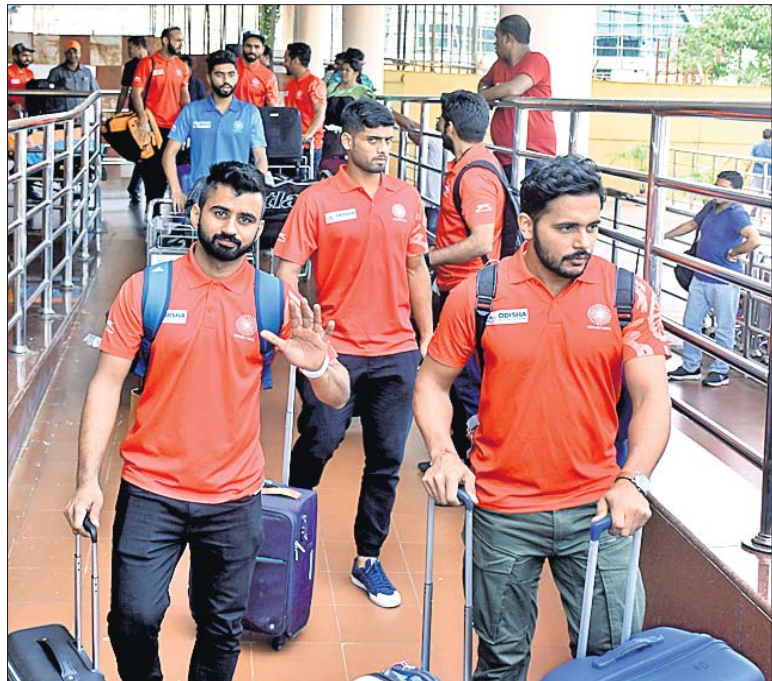
ଭୁବନେଶ୍ୱର ବିଜୁ ପଟ୍ଟନାୟକ ଅନ୍ତର୍ଜାତୀୟ ବିମାନ ବନ୍ଦରରେ ପହଞ୍ଚିଥିବା ଭାରତୀୟ ପୁରୁଷ ହକି ଦଳର ଖେଳାଳିମାନେ ।