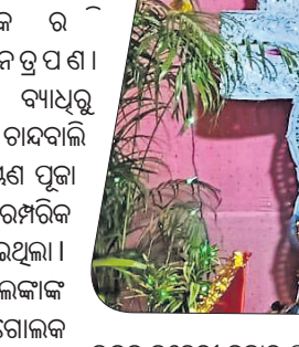
ଭଦ୍ରକ କଚେରୀ ବଜାର ପୂଜା ମତେ ।

ନେତ୍ରପଣା ଦେଲେ ମାନସିକ ପୁରଣ ହେବା ସାଙ୍ଗକୁ ଦୂରାଗୋର ବ୍ୟାଧିକୁ ପୂଜି ମିଳିଥାଏ ବୋଲି ବିଶ୍ୱାସ ରହିଛି । ସେହିପରି ଭଦ୍ରକ ଗନ୍ଧବାଳି ରାସ୍ତାପାର୍ଶ୍ୱରେ ସିଦ୍ଧୋଳଠାରେ ମଧ୍ୟ ସାର୍ବଜନୀନ ଲକ୍ଷ୍ମୀନାରାୟଣ ପୂଜା ସ୍ଥାନୀୟ ଗ୍ରାମବାସୀଙ୍କ ସହଯୋଗରେ ପାଳିତ ହୋଇଛି । ପାରମ୍ପରିକ ନାଟ ଅନୁସାରେ ଛେରାପହରା ଓ ନେତ୍ରପଣା କାର୍ଯ୍ୟକ୍ରମ ହୋଇଥିଲା । ମଙ୍ଗଳପୁର ପଞ୍ଚାୟତ କନାଟିଆ ଗ୍ରାମର ହରିହର ଲେଙ୍କାଙ୍କ ବାସଭବନରେ ମଧ୍ୟ ଲକ୍ଷ୍ମୀନାରାୟଣ ପୂଜା କରାଯାଇଛି । ସ୍ୱର୍ଗତ ଗୋଲକ ପ୍ରସାଦ ଲେଙ୍କାଙ୍କ ଉଦ୍ୟମରେ ଏଠାରେ ଏହି ପୂଜା ଆରମ୍ଭ ହୋଇଥିଲା ।