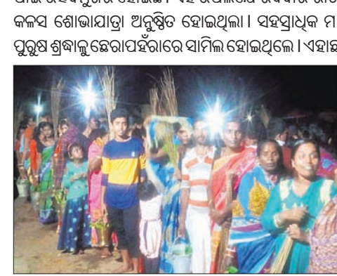
ଛେରାପହରା ପାଇଁ ତିଆରି ହୋଇଛନ୍ତି ଶ୍ରଦ୍ଧାଳୁ ।

ତିହିଡ଼ି ବ୍ଲକର ସିଦ୍ଧୋଳ ପଞ୍ଚାୟତ ଲକ୍ଷ୍ମୀନାରାୟଣ ପୂଜା ପାଇଁ ଉତ୍ସବମୁଖର ହୋଇଛି । ଏହି ଉପଲକ୍ଷେ ରବିବାର ରାତିରେ ନୂଆପାଟଣା ଗାଁରେ କଳ୍ପ ବୃକ୍ଷାଲମ୍ବ ପୂଜା ଅନୁଷ୍ଠିତ ହୋଇଥିଲା । ସହସ୍ରାଧିକ ମାନସିକଧାରୀ ମହିଳା ଓ ପୁରୁଷ ଶ୍ରଦ୍ଧାଳୁ ଛେରାପହରାରେ ସାମିଲ ହୋଇଥିଲେ । ଏହାଛଡ଼ା ଆଖପାଖ ଅଞ୍ଚଳର ମାନସିକଧାରୀ ଲକ୍ଷ୍ମୀନାରାୟଣଙ୍କୁ ନେତ୍ରପଣା ଅର୍ପଣ କରି ଥିଲେ । ଏଠାରେ ଠାକୁରଙ୍କ ବିଭିନ୍ନ କଳ୍ପ ଅର୍ପଣ ଅର୍ପଣ ହେଉଥିବା କରୁଛନ୍ତି ।