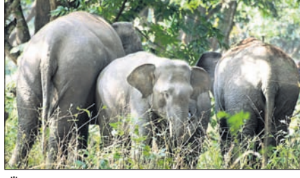
ଗାଁ ମୁଖରେ ଥିବା ହାତୀପଲ।

କେନ୍ଦୁଝର ଜିଲ୍ଲା, ଚମ୍ପୁଆ ରୋଜି ଅନ୍ତର୍ଗତ ବାଲିବନ୍ଧ ଫରେଷ୍ଟ ସେକ୍ଟରର ଗ୍ରାମାଞ୍ଚଳରେ ରବିବାର ବିକଳିତ ରାତିରେ ପୁଣି ହାତୀପଲ ପଶି ଆସିଛନ୍ତି। ହାତୀପଲ ୨ଟି ଦଳରେ ବିଭକ୍ତ ହୋଇଥିବାବେଳେ, ବନ ବିଭାଗର ସୁରନା ଅନୁଯାୟୀ ଗୋଟିଏ ଦଳରେ ୨୩ ହାତୀ ଏବଂ ଅନ୍ୟ ଦଳରେ ୧୮ହାତୀ ରହିଛନ୍ତି। ସୁରନା ଅନୁଯାୟୀ ୧୮ସଂଖ୍ୟା ଥିବା ହାତୀପଲ ନୟାଗଡ଼ ପଞ୍ଚାୟତର ବାମନଡିଆ ଜଙ୍ଗଲରେ ରହିଥିବାବେଳେ, ୨୩ଟିକିଆ ହାତୀପଲ ଚଢ଼ଠିଆ ପଞ୍ଚାୟତର ମଣାବା ଜଙ୍ଗଲରେ ରହିଛନ୍ତି। ହାତୀପଲ ପଶି ଆସିଥିବାରୁ ଗ୍ରାମବାସୀ ତଥା ଚାଷୀମାନେ ଭୟଭୀତ ଅବସ୍ଥାରେ ଅଛନ୍ତି। ହାତୀପଲ ଫସଲ ଉତ୍ପାଦିବା ସହିତ ଘର ଭଙ୍ଗୁଛନ୍ତି। ୧୮ସଂଖ୍ୟା ଥିବା ହାତୀପଲର କ୍ଷୟକ୍ଷତି ସମ୍ପର୍କରେ ଜଣା ପଡ଼ିନାହିଁ। ଏହି ୨୩ଟିକିଆ ହାତୀ ପଲ ବ୍ୟାପକ ଫସଲ କ୍ଷୟକ୍ଷତି କରିବା ସହିତ ମଣାବା ଗ୍ରାମ ଜାମୁଡି ସାହିରେ ପୂର୍ଣ୍ଣଚନ୍ଦ୍ର ମୁଖା,