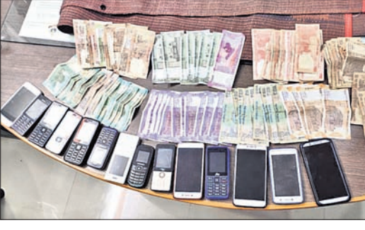
କବଚ ଟଙ୍କା ଓ ମୋବାଇଲ।

24x7 Helpline : 0171-3055171 | ନିଜର ନିକଟତମ ମେଡିକାଲ ଷ୍ଫୋରକୁ କିଣନ୍ତୁ