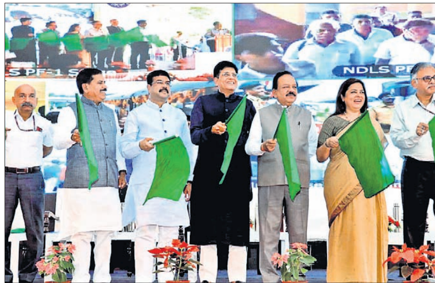
ନୂଆଦିଲ୍ଲୀରୁ ରେଳମନ୍ତ୍ରୀ ପୀୟୁଷ ଗୋୟଲ, କେନ୍ଦ୍ରମନ୍ତ୍ରୀ ଧର୍ମେନ୍ଦ୍ର ପ୍ରଧାନ ଓ ଅନ୍ୟମାନେ ଭୁବନେଶ୍ୱର-ନୟାଗଡ଼ ଟାଉନ୍ ସେବା ଏକ୍ସପ୍ରେସ୍ ଉଦ୍ଘାଟନ କରୁଥିବାବେଳେ ଭୁବନେଶ୍ୱରରେ ଅନୁଷ୍ଠିତ ହେଉଥିବା ଦୃଶ୍ୟ।

ଭୁବନେଶ୍ୱର, ୧୫।୧୦।(ବୁଧବେ): ବିଧାନସଭା ଗ୍ରହାଣୀୟ କମିଟିର ୪୪ ବୈଠକ ବିଧାନସଭା ପ୍ରଥମ ସମ୍ମାନାୟକ ଅଧ୍ୟକ୍ଷତାରେ ମଙ୍ଗଳବାର ଅନୁଷ୍ଠିତ ହୋଇଛି। ବିଧାନସଭା ୫୪ ନମ୍ବର ପ୍ରକାଶନରେ ଅନୁଷ୍ଠିତ ହୋଇଥିବା ଏହି ବୈଠକରେ, ବିଧାନସଭା ଗ୍ରହାଣୀୟ କମିଟିର ୪୪ ବୈଠକରେ ବିଧାନସଭା ପ୍ରାରମ୍ଭିକ ଅଟଳକ କମିଟି ନିକଟରେ ଦାଖଲ କରାଯାଇଛି। ପ୍ରକାଶନ ଗ୍ରହାଣୀୟ କମିଟିର ୪୪ ବୈଠକରେ ବିଧାନସଭା ପ୍ରାରମ୍ଭିକ ଅଟଳକ କମିଟି ନିକଟରେ ଦାଖଲ କରାଯାଇଛି। ପ୍ରକାଶନ ଗ୍ରହାଣୀୟ କମିଟିର ୪୪ ବୈଠକରେ ବିଧାନସଭା ପ୍ରାରମ୍ଭିକ ଅଟଳକ କମିଟି ନିକଟରେ ଦାଖଲ କରାଯାଇଛି।