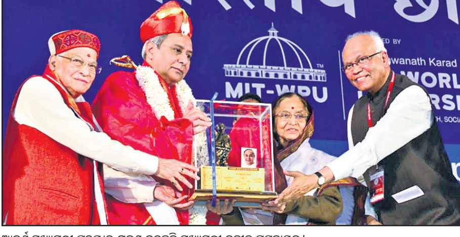
ଆଦର୍ଶ ମୁଖ୍ୟମନ୍ତ୍ରୀ ପୁରସ୍କାର ଗ୍ରହଣ କରୁଛନ୍ତି ମୁଖ୍ୟମନ୍ତ୍ରୀ ନବୀନ ପଟ୍ଟନାୟକ।