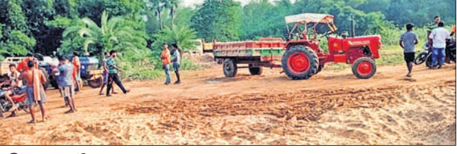
ମଣିନାଥପୁର ବୈତରଣୀ ଘାଟରେ ଚୋର।

ଘଟି ନଦୀବନ୍ଧ ଦୁର୍ବଳ ହୋଇପଡ଼ୁଛି। ଏହା ବନ୍ୟା ବେଳେ ପାର୍ଶ୍ଵବର୍ତ୍ତୀ ଅଞ୍ଚଳ ପ୍ରତି ବିପଦ ସୃଷ୍ଟି କରୁଛି। ଏହି କାରଣରୁ ଗାଁ ଚଢ଼ାଇ କରି ଧରପତ୍ର କରୁଥିଲେ ମଧ୍ୟ ବାଲି ଚୋରା ଚାଲାଇ ଚାଲିଯାଇ ପାରୁ ନାହିଁ । ରାସ୍ତାରେ ଧରପତ୍ରକୁ ଏତଲାଦା ଲାଗି ବାଲି ଚୋରମାନେ ଏବେ ରାସ୍ତାରେ ଲୋକ ଜଗାଇ ଟ୍ରକ ଓ ଟ୍ରାକ୍ଟର ଯୋଗେ ଚାଲାଇ କରୁଥିବା ଅଞ୍ଚଳବାସୀ ଅଭିଯୋଗ କରିଛନ୍ତି। ବୈତରଣୀ ନଦୀ ଶ୍ୟାମଳୁ ଜୁମାଗଡ଼ ବାଲି ଚୋରି ହେବା ଯୋଗୁ କୃଷକ