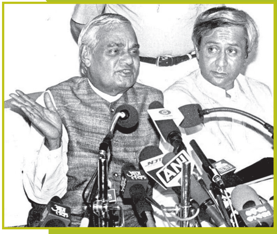
ପୂର୍ବତନ ପ୍ରଧାନମନ୍ତ୍ରୀ ଅଟଳ ବିହାରୀ ବାଜପେୟୀଙ୍କ ସହ