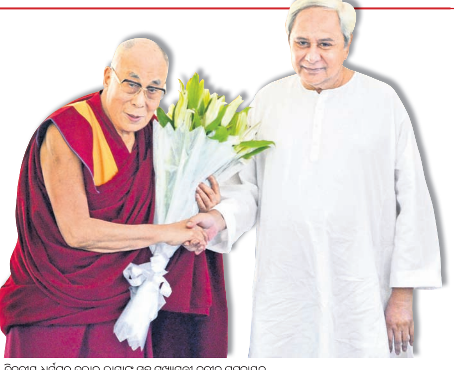
ତିବ୍ୱତୀୟ ଧର୍ମଗୁରୁ ଦଲାଲ ଲାମାଙ୍କ ସହ ମୁଖ୍ୟମନ୍ତ୍ରୀ ନବୀନ ପଟ୍ଟନାୟକ