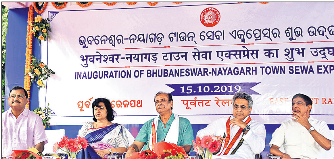
ଭୁବନେଶ୍ୱର-ନୟାଗଡ଼ ଟାଉନ୍ ସେବା ଏକ୍ସପ୍ରେସ୍ ଉଦ୍ଘାଟନ କରୁଥିବାବେଳେ ଭୁବନେଶ୍ୱରରେ ଅନୁଷ୍ଠିତ ହେଉଥିବା ଦୃଶ୍ୟ।