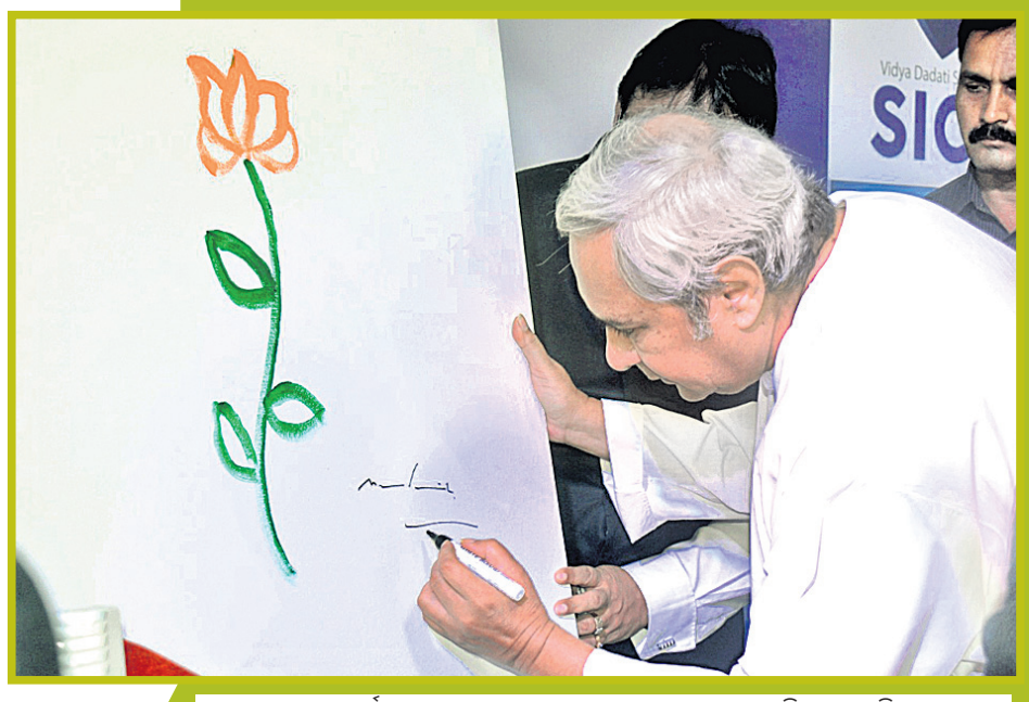
ଏକ କାର୍ଯ୍ୟକ୍ରମ ଅବସରରେ ମୁଖ୍ୟମନ୍ତ୍ରୀ ନବୀନ ପଟ୍ଟନାୟକ ଚିତ୍ର ଆଙ୍କୁଛନ୍ତି।