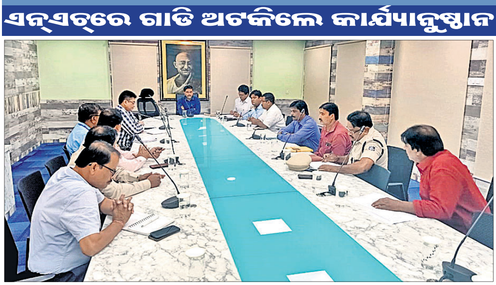
ବୈଠକରେ ଜିଲାପାଳ ଓ ଅନ୍ୟମାନେ।