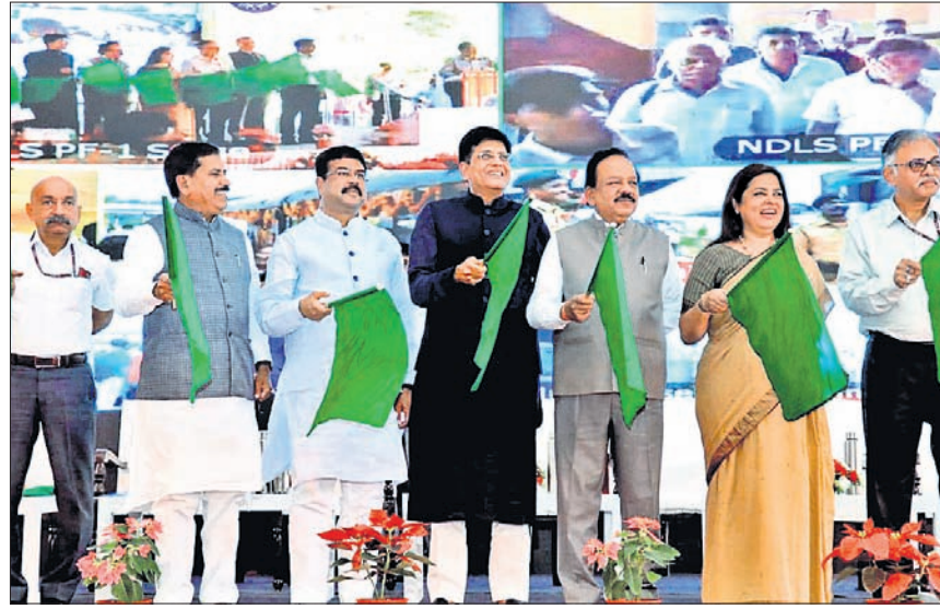
ନୂଆଦିଲ୍ଲୀରୁ ରେଳମନ୍ତ୍ରୀ ପାୟୁଷ ଗୋୟଲ, କେନ୍ଦ୍ରମନ୍ତ୍ରୀ ଧର୍ମେନ୍ଦ୍ର ପ୍ରଧାନ ଓ ଅନ୍ୟମାନେ ଭୁବନେଶ୍ୱର-ନୟାଗଡ଼ ଟାଉନ୍ ସେବା ଏକ୍ସପ୍ରେସ୍ କୁ ଭିଡ଼ି କର୍ମରେ ଉପସ୍ଥିତ ରହିଥିବା ଦେଖିବାକୁ ମିଳିଥିଲା।

ଭୁବନେଶ୍ୱର, ୧୫।୧୦।(ବୁଧବେ): ବିଧାନସଭା ଗ୍ରହାଣୀୟ କମିଟିର ୪୪ ବୈଠକ ବିଧାନସଭା ପ୍ରଥମ ସମ୍ମାନାୟକ ଅଧ୍ୟକ୍ଷତାରେ ମଙ୍ଗଳବାର ଅନୁଷ୍ଠିତ ହୋଇଛି। ବିଧାନସଭା ୫୪ ନମ୍ବର ପ୍ରକାଶନରେ ଅନୁଷ୍ଠିତ ହୋଇଥିବା ଏହି ବୈଠକରେ, ବିଧାନସଭା ଗ୍ରହାଣୀୟ କମିଟିର ୪୪ ବୈଠକରେ ବିଧାନସଭା ପ୍ରାରମ୍ଭିକ ଅଟଳକ କମିଟି ନିକଟରେ ଦାଖଲ କରାଯାଇଛି। ପ୍ରକାଶନ ଗ୍ରହାଣୀୟ କମିଟିର ୪୪ ବୈଠକରେ ବିଧାନସଭା ପ୍ରାରମ୍ଭିକ ଅଟଳକ କମିଟି ନିକଟରେ ଦାଖଲ କରାଯାଇଛି। ପ୍ରକାଶନ ଗ୍ରହାଣୀୟ କମିଟିର ୪୪ ବୈଠକରେ ବିଧାନସଭା ପ୍ରାରମ୍ଭିକ ଅଟଳକ କମିଟି ନିକଟରେ ଦାଖଲ କରାଯାଇଛି।