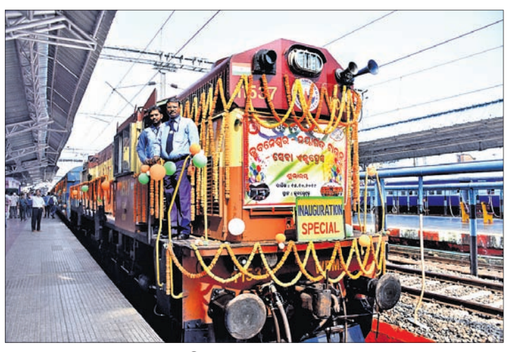
ଭୁବନେଶ୍ୱରରୁ ନୟାଗଡ଼କୁ ପ୍ରଥମ କରି ଯାଇଥିବା ଏକ୍ସପ୍ରେସ୍ ଟ୍ରେନ୍। (ଅଧିକ ପଠା: ପୃଷ୍ଠା-୧୫)

ପ୍ରତିଦିନ ଭୁବନେଶ୍ୱରରୁ ସନ୍ଧ୍ୟା ୬ଟା ୪୦ରେ ଛାଡ଼ି ନୟାଗଡ଼ରେ ରାତି ୮ଟା ୪୫ରେ ପହଞ୍ଚିବ। ନୟାଗଡ଼ ଟାଉନରୁ ସକାଳ ୬ଟା ୩୦ରେ ଛାଡ଼ି ୯ଟାରେ ଭୁବନେଶ୍ୱରରେ ପହଞ୍ଚିବ।