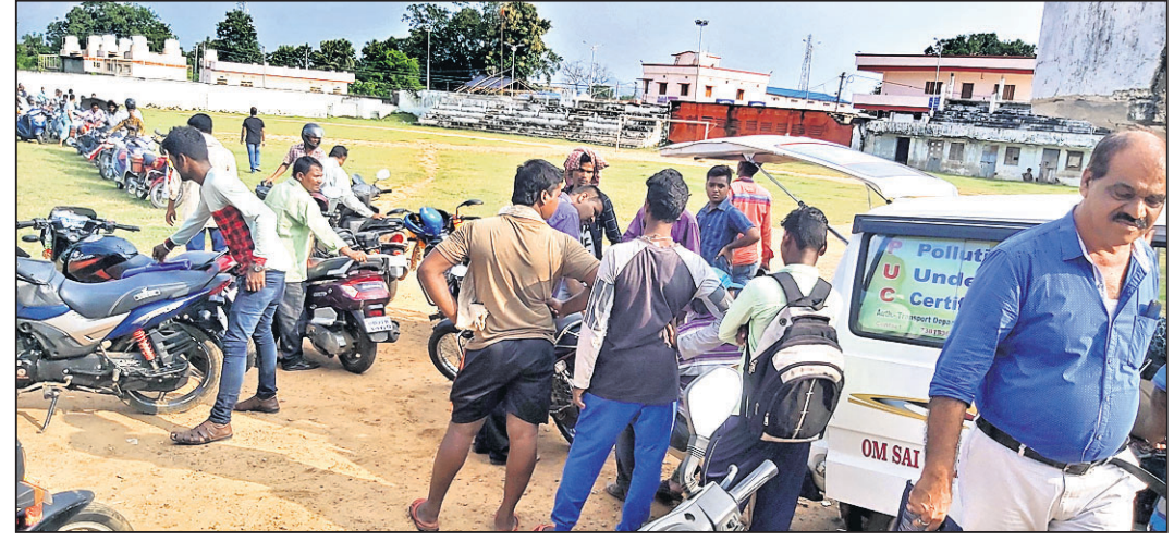
ପ୍ରଦୂଷଣ ପ୍ରମାଣପତ୍ର ପାଇଁ ଜେଲ ପଡ଼ିଆରେ ଲକ୍ଷ୍ୟ ଲାଭନ।

ଉତ୍ତରଗଞ୍ଜ, ୧୫।୧୦।(ଡି.ଏନ.ଏ.) ନୂଆ ମୋଟରଯାନ ଆଇନ କଡ଼ାକଡ଼ି ଲାଗୁ ହୋଇଛି। ବାଇକ ଓ ଭାରିୟାନ ଚଳାଇବା ପାଇଁ ଯାହା ନିୟମ ଅଛି ତାକୁ ପାଳନ କରିବା ପାଇଁ ଲୋକେ ପ୍ରଚେଷ୍ଟା ଆରମ୍ଭ କରିଛନ୍ତି। ତେଣୁ ଦୁର୍ଘଟଣା ହାର ମଧ୍ୟ କମିଛି। କିନ୍ତୁ ପ୍ରମାଣପତ୍ର ପକ୍ଷରୁ ପ୍ରଦୂଷଣ ପ୍ରମାଣପତ୍ର, ଡ୍ରାଇଭିଂ ଲାଇସେନ୍ସ ଆଦି ସୁବିଧାରେ ଲୋକଙ୍କୁ ଯୋଗାଇ ଦିଆଯାଇ ପାରୁନାହିଁ। ଯେଉଁଥିପାଇଁ ଲୋକଙ୍କ ମଧ୍ୟରେ ଅସନ୍ତୋଷ ଦେଖା ଦେଇଛି। ଉତ୍ତରଗଞ୍ଜ ଏକ ବଡ଼ ସହର ହୋଇଥିବା ବେଳେ ଏହି ଅଞ୍ଚଳରେ ପ୍ରାୟ ୫୦ ହଜାରରୁ ଊର୍ଦ୍ଧ୍ୱ ପେଟ୍ରୋଲ ଓ ଡିଜେଲ ଗାଡ଼ି ରହିଛି। ଉକ୍ତ ଗାଡ଼ିଗୁଡ଼ିକୁ ପ୍ରଦୂଷଣ ପ୍ରମାଣପତ୍ର ଦେବାପାଇଁ ବର୍ତ୍ତମାନ ୩ ଯୁନିଟ୍ ରହିଛି। ଉକ୍ତ ଯୁନିଟ୍ଗୁଡ଼ିକ ମଧ୍ୟ ବିଭିନ୍ନ ସମୟରେ ସହର ବାହାର ଅନ୍ୟ ରୁକ୍ ଅଞ୍ଚଳକୁ ଚାଲି ଯାଇଛନ୍ତି। ଉତ୍ତରଗଞ୍ଜରେ ଯେତେବେଳେ ପ୍ରଦୂଷଣ ପ୍ରମାଣପତ୍ର ଦିଆଯାଉଛି, ସେ ସମୟରେ ଲୋକଙ୍କର ପ୍ରବଳ ଭିଡ଼