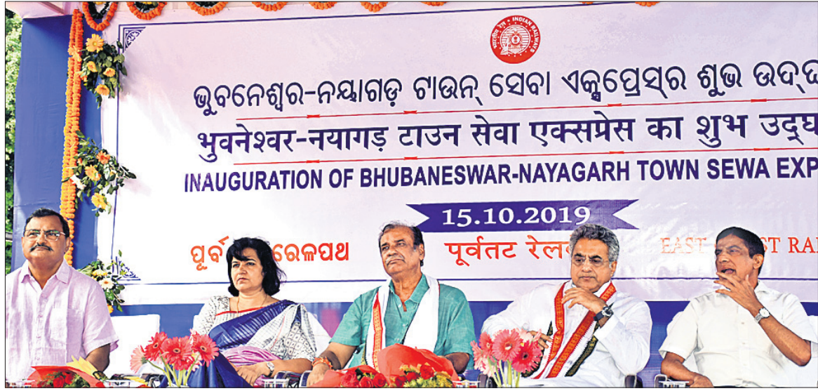
ଭୁବନେଶ୍ୱର-ନୟାଗଡ଼ ଟାଉନ୍ ସେବା ଏକ୍ସପ୍ରେସ୍ କୁ ଭିଡ଼ି କର୍ମରେ ଉପସ୍ଥିତ ରହିଥିବା ଦେଖିବାକୁ ମିଳିଥିଲା।