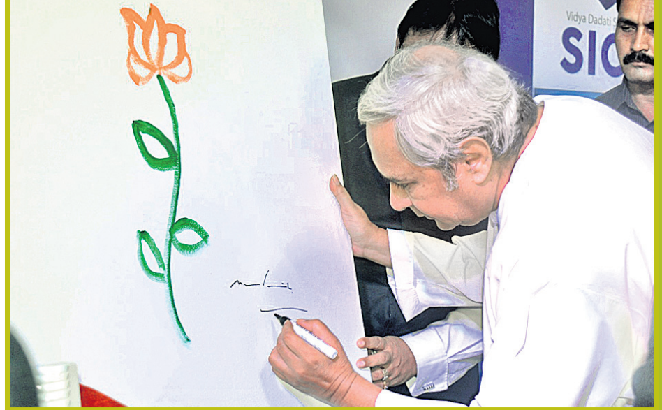
ଏକ କାର୍ଯ୍ୟକ୍ରମ ଅବସରରେ ମୁଖ୍ୟମନ୍ତ୍ରୀ ନବୀନ ପଟ୍ଟନାୟକ ବିଜୁ ଆଙ୍କୁଛନ୍ତି।