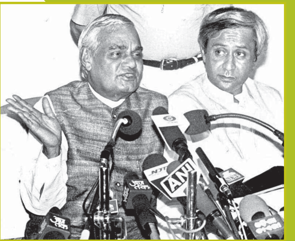
ପୂର୍ବତନ ପ୍ରଧାନମନ୍ତ୍ରୀ ଅବଳ ବିହାରୀ ବାଜପେୟୀଙ୍କ ସହ