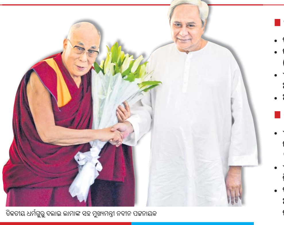
ତିବ୍ବତୀୟ ଧର୍ମଗୁରୁ ଦଲାଲ ଲାମାଙ୍କ ସହ ମୁଖ୍ୟମନ୍ତ୍ରୀ ନବୀନ ପଟ୍ଟନାୟକ