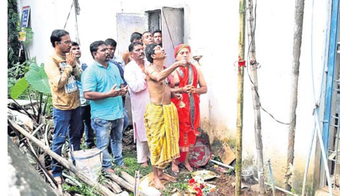
ଶୁଭଖୁଣ୍ଟି ସ୍ଥାପନ କରାଯାଇ ପୂଜାର୍ଚ୍ଚନା କରାଯାଇଛି ।