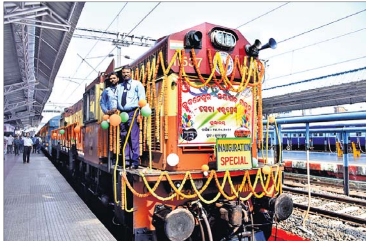
ଭୁବନେଶ୍ୱରରୁ ନୟାଗଡ଼କୁ ପ୍ରଥମ କରି ଯାଇଥିବା ଟ୍ରେନ୍।