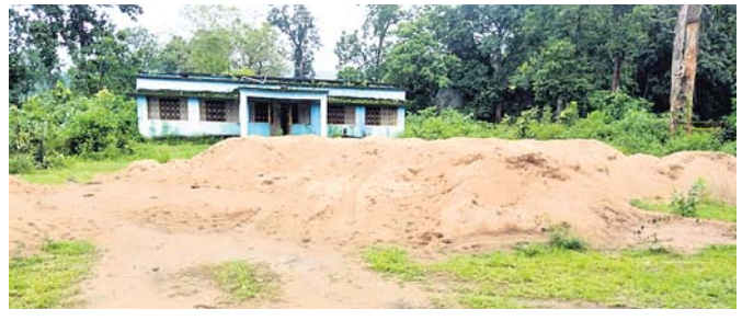
ପରିଷ୍କୃତ ଅବସ୍ଥାରେ ଚନ୍ଦ୍ରପୁର ଡାକ ବଙ୍ଗଳା।