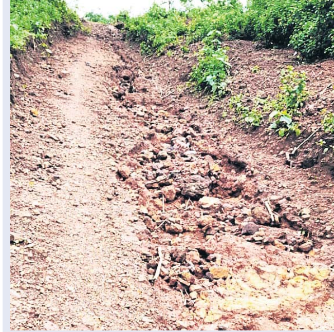
ଗ୍ରାମକୁ ଯାଇଥିବା ରାସ୍ତା ।