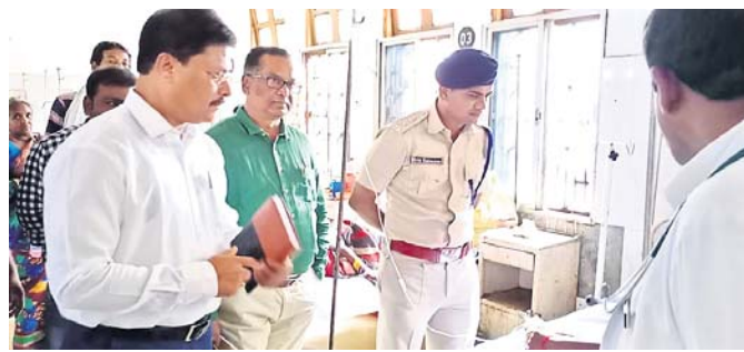
ଡାକ୍ତରଖାନା ପରିସରର ଔଷଧ ଦୋକାନ ସିଲ୍