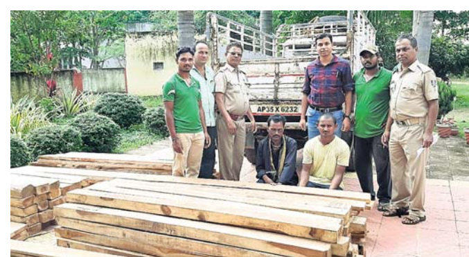
ଜବତ କାଠ ସହ ଗିରଫ ୨ ଅଭିଯୁକ୍ତ ।

ପଦକ୍ଷେପ ନେବା ପାଇଁ ବୁଲ୍‌ବାସୀ ଦାବି କରିଛନ୍ତି । ଏ ସମ୍ପର୍କରେ ଚନ୍ଦ୍ରପୁର ବିଡିଓ ଜର୍ଜ ଭୁଞ୍ଜାଙ୍କୁ ପଚାରିବାରୁ , ବଙ୍ଗଳା ସମ୍ପର୍କରେ ସ୍ଥିତି ଅବଗତ ଅଛି । ଏହାର ଅବସ୍ଥା ଦେଖି ତାଲା ପକାଯାଇଥିଲା । କେହି ଦୁର୍ଭିକ୍ଷ ସେସବୁକୁ ଭାଙ୍ଗି ନଷ୍ଟ କରିଦେଇଛନ୍ତି । ଏହାର ରକ୍ଷଣାବେକ୍ଷଣ ପାଇଁ ଅର୍ଥର ଆବଶ୍ୟକ ଅଛି । ଏଥିପାଇଁ ପ୍ରଶାସନକୁ ସୂଚି ଦିଆଯାଇଛି । ପ୍ରଶାସନ ଏଥିପ୍ରତି ଦୃଷ୍ଟି ଦେଇ