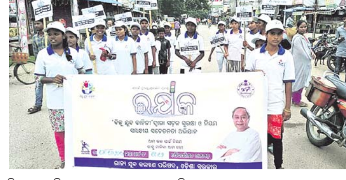
ବିଜୁ ଯୁବ ବାହିନୀ ପକ୍ଷରୁ ରାୟଗଡ଼ାରେ ବାହାରିଥିବା ସଚେତନତା ଶୋଭାଯାତ୍ରା ।

ଅଞ୍ଚଳର ବୋଲି ଜଣାଯାଇଛି । ପରେ ସମସ୍ତଙ୍କୁ ଶିଶୁ ମଙ୍ଗଳ କମିଟିକୁ ହସ୍ତାନ୍ତର କରାଯାଇଛି । ତାଙ୍କୁ ଆନ୍ଧ୍ର ଏକ ଉଦ୍ଧାର ହୋଇଥିବା ଶିଶୁ ଶ୍ରମିକମାନେ କଲ୍ୟାଣସିଂହପୁର, ପୁନିଗୁଡ଼ା, କୋଲିନରା