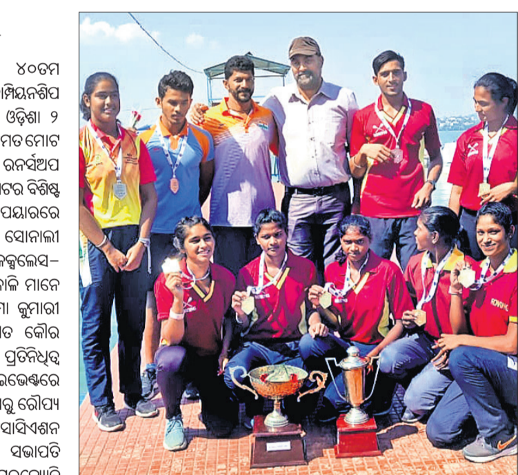
ଟ୍ରଫି ପଦକ ସହ କର୍ମକର୍ତ୍ତାଙ୍କ ଗହଣରେ ଓଡ଼ିଶା ରୋଲ୍ ଦଳ।

ମଧ୍ୟପ୍ରଦେଶର ଭୋପାଳଠାରେ ୪୦ତମ ଜୁନିୟର ଜାତୀୟ ରୋଲ୍ ଚାମ୍ପିୟନଶିପ୍ ଅନୁଷ୍ଠିତ ହୋଇଯାଇଛି। ଏଥିରେ ଓଡ଼ିଶା ୨ ସ୍ୱର୍ଣ୍ଣ ଓ ଚାମ୍ପିୟନ ଚାମ୍ପିୟନ ହେବାକୁ ଥିବା ଟି୨୦ ବିଶ୍ୱକପ୍ ପାଇଁ ଉତ୍ତମ ପୁରୁଷ ଓ ମହିଳା ଦଳ ପାଇଁ ସମାନଭାବେ ପୁରସ୍କାର ରାଶି ଦିଆଯିବ ବୋଲି କ୍ରିକେଟ ଅଷ୍ଟ୍ରେଲିଆ ଘୋଷଣା କରିଛି।