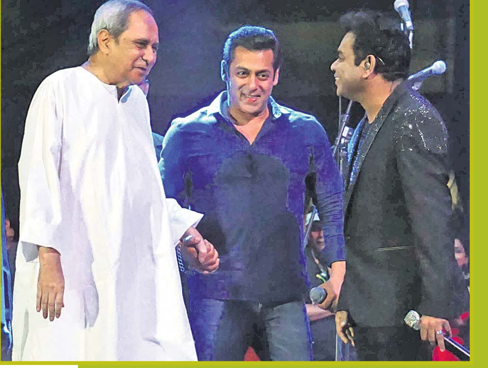
ବିଶିଷ୍ଟ ସଙ୍ଗୀତ ନିର୍ଦ୍ଦେଶକ ଏ.ଆର୍. ରେହମାନ ଓ ଲୋକପ୍ରିୟ ଅଭିନେତା ସଲମାନ ଖାନ୍‌ଙ୍କ ସହ