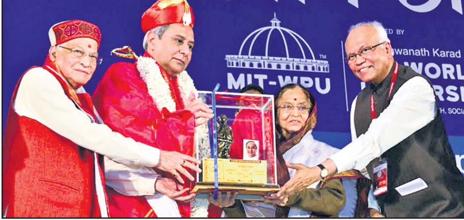
ଆଦର୍ଶ ମୁଖ୍ୟମନ୍ତ୍ରୀ ପୁରସ୍କାର ଗ୍ରହଣ କରୁଥିବା ମୁଖ୍ୟମନ୍ତ୍ରୀ ନବୀନ ପଟ୍ଟନାୟକ।

ମୁଖ୍ୟମନ୍ତ୍ରୀ ନବୀନ ପଟ୍ଟନାୟକ ୨୦୧୮ ଜାନୁୟାରୀରେ ପୁରୀଠାରେ ପୂର୍ବତନ ରାଷ୍ଟ୍ରପତି ପ୍ରତିଭା ପାଟିଲଙ୍କ ହାତରୁ ଆଦର୍ଶ ମୁଖ୍ୟମନ୍ତ୍ରୀ ପୁରସ୍କାର ଗ୍ରହଣ କରିଥିଲେ। ଏହି ଅବସରରେ ସେ କହିଥିଲେ ଯେତେବେଳେ ସାଧାରଣ ଜନତା ରାଜନୀତିରେ ଅଙ୍ଗାଙ୍ଗୀଭାବେ ଉଠିବେ ସେମାନେ ଆଣି, ସେତେବେଳେ କୌଣସି ଆର୍ଦ୍ଧ-ଜନକର୍ମେତ୍ରି ଉହେ ନାହିଁ।