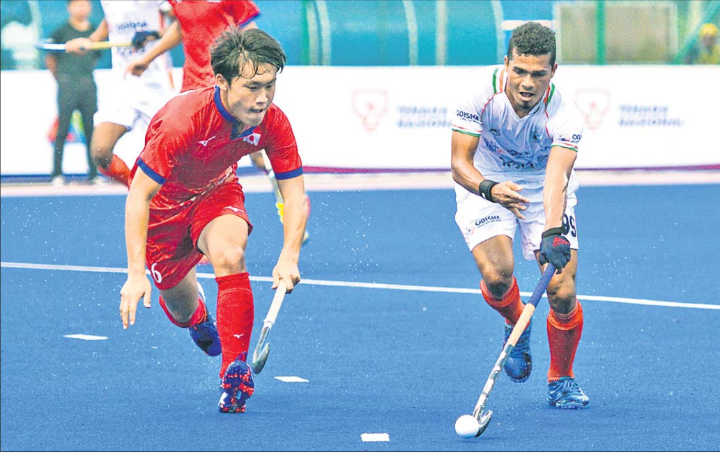
ଜାପାନ ଖେଳାଳିଙ୍କଠାରୁ ବଲ୍ ନେଇ ଆଗେଇ ଯାଇଛନ୍ତି ଓଡ଼ିଶାର ଶତାଧିକ ଲାଗୁ।

ସ୍କୁଲତାନ ଜୋହର କପ୍ ଜୁନିୟର ହକି ଟୁର୍ନାମେଣ୍ଟର ମଙ୍ଗଳଦୀନ ଅନୁଷ୍ଠିତ ଏକ ସଂଘର୍ଷପୂର୍ଣ୍ଣ ମ୍ୟାଚରେ ଭାରତ ୩-୪ ଗୋଲରେ ଜାପାନରୁ ହାରିଯାଇଛି। ମ୍ୟାଚରେ ଭାରତ ଲକ୍ଷ୍ମଣୀ ପ୍ରଦର୍ଶନ କରିଥିଲେ ହେଁ ଗୋଟିଏ ଗୋଲ ବ୍ୟତୀତରେ ପରାଜୟରଣ କରିଛି। ଚଳିତ ଟୁର୍ନାମେଣ୍ଟରେ ଭାରତର ଏହା ପ୍ରଥମ ପରାଜୟ। ପ୍ରଥମ ୨ଟି ମ୍ୟାଚରେ ଦଳ ମାଲେସିଆକୁ ୪-୨ ଓ ନ୍ୟୁଜିଲାଣ୍ଡକୁ ୮-୨ ଗୋଲରେ ପରାସ୍ତ କରିଥିଲା। ଭାରତ ଏହାର ପରବର୍ତ୍ତୀ ରାଉଣ୍ଡ ରବିନ ଲିଗ୍ ମ୍ୟାଚରେ ବୁଧବାର ଅଷ୍ଟ୍ରେଲିଆକୁ ଭେଟିବ। ଆରମ୍ଭରୁ ଆକ୍ରମଣାତ୍ମକ ଖେଳିଥିବା ଜାପାନକୁ ପ୍ରଥମ ମିନିଟରେ ହିଁ ଫାଇଦା ମିଳିଥିଲା। ମିଳିଥିବା ଯୋଗୁଁ କର୍ନରକୁ ଓଡ଼ିଆରୁ ମାଡ଼ୁଗୋଡ଼ିଆ ଡ୍ରାଏଫ୍ଟିଙ୍ଗ୍ କରିଆରେ ଗୋଲରେ ପରିଣତ କରି ଦଳକୁ ଅଗ୍ରଣୀ କରାଇଥିଲେ। ଜବାବରେ ଭାରତ ମଧ୍ୟ ଆକ୍ରମଣାତ୍ମକ ପଛା ଅବଲମ୍ବନ କରି ୩ୟ ମିନିଟରେ ଏକ ଯୋଗୁଁ ଟାଇ ଆସାଇଥିଲା। ସିମ୍ଲୁଙ୍କ ପ୍ରଶାସକ କାଳରେ ଷ୍ଟେଣ୍ଡକ୍ରିକେଟ ଷ୍ଟେଣ୍ଡକ୍ରିକେଟର କିଛି ଆଶ୍ଚର୍ଯ୍ୟପୂର୍ଣ୍ଣ ପ୍ରଦର୍ଶନ କରିପାରି ନ ଥିଲା। ମୋଟ ୧୪ ଟେଷ୍ଟକୁ ଦଳ ଗୋଟିଏରେ ବିଜୟୀ ହୋଇଥିଲା।