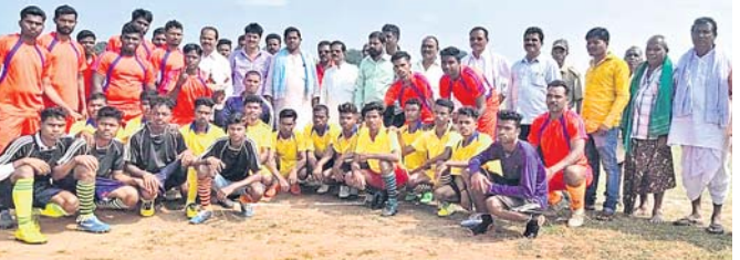
ଅତିଥିମାନଙ୍କ ସହ ଖେଳାଳିମାନେ।

ନବରଙ୍ଗପୁର ଜିଲ୍ଲା ଡାବୁଗାଁ ବ୍ଲକର ଚରାକାବୁଡ଼ା ପଞ୍ଚାୟତ ଅଧୀନ କୁରୁମାବନ୍ଧ ଗ୍ରାମର ମିନି ଷ୍ଟାଡ଼ିୟମ ଠାରେ ମା' ଦୁଲ୍ଲାରଦେଇ ପୁଟବଲ ଟୁର୍ନାମେଣ୍ଟ ମଙ୍ଗଳଦୀନ ହୋଇଯାଇଛି। ଏଥିରେ ନବରଙ୍ଗପୁର ଏମପି ଉପମେଣ୍ଡ ଚନ୍ଦ୍ର ମାଝୀ ମୁଖ୍ୟ ଅତିଥି ଭାବେ ଯୋଗ ଦେଇ ଟୁର୍ନାମେଣ୍ଟକୁ ଉଦ୍‌ଘାଟନ କରିଥିଲେ। ଉଦ୍‌ଘାଟନ ମ୍ୟାଚଟି ମାରିଆଗୁଡ଼ା ଓ ମାଝୀଗୁଡ଼ା ଦଳ ମଧ୍ୟରେ ଅନୁଷ୍ଠିତ ହୋଇଥିଲା। ଏଥିରେ ମାଝୀଗୁଡ଼ାଦଳ ୧-୩ ଗୋଲରେ