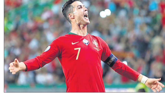
ଗୋଲ ନ ହେବାକୁ ଯୁକ୍ତନଗର ୨-୧ ଗୋଲରେ ବିଜୟୀ ହୋଇଥିଲା।

ଷ୍ଟାର୍ ଖେଳାଳି କ୍ରିଷ୍ଟିଆନୋ ରୋନାଲ୍ଡୋ ୭୦୦ତମ କ୍ୟାରିୟର ଗୋଲ୍‌ସ୍କୋର ସହ ଯୁବୋପିଆନ ଚାମ୍ପିୟନଶିପ୍ ଯୋଗ୍ୟତା ପର୍ଯ୍ୟାୟର ଏକ ମ୍ୟାଚ୍‌ରେ ପର୍ଯ୍ୟୁଗାଲ ୧-୨ ଗୋଲରେ ଯୁକ୍ତନଗର ନିକଟରୁ ପରାସ୍ତ ହୋଇଛି।