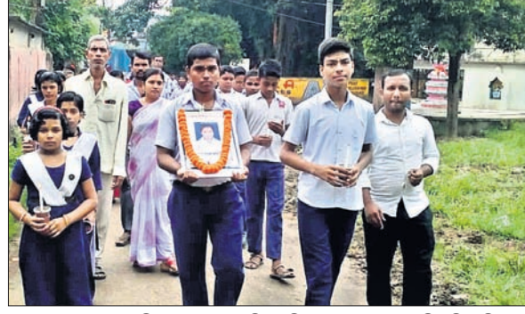
ଶୋଭାଯାତ୍ରାରେ ସାମିଲ ହୋଇଥିବା ଶିଶୁମିହିର ଛାତ୍ରାଛାତ୍ରୀ ଓ ଶିକ୍ଷୟିତ୍ରୀଶିକ୍ଷକ।