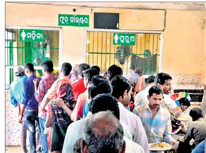
ଗୋଟିଏ କାଉଣ୍ଟର ଖୋଲିଥିବା ଯୋଗୁ ପ୍ରବଳ ଭିଡ଼।

ଲୋକଙ୍କ ପାଇଁ ଖାଦ୍ୟ ପରଖା ଯାଉଛି। 'ମାଂସ ଗ୍ରନ୍ଥ' ପକ୍ଷରୁ ଖାଦ୍ୟ ପ୍ରସ୍ତୁତ କରାଯାଉଛି।