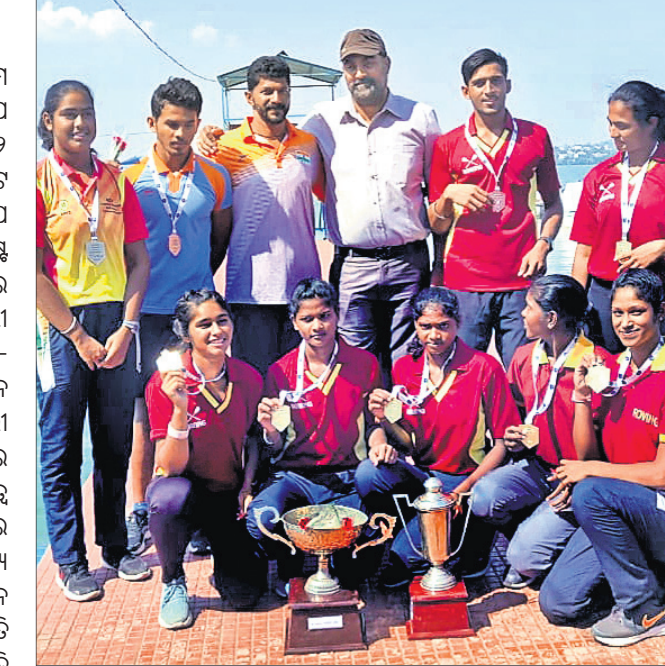
ଟ୍ରଫି ପଦକ ସହ କର୍ମକର୍ତ୍ତାଙ୍କ ସହ ଓଡ଼ିଶା ରୋଇଂ ଦଳ।

ମଧ୍ୟପ୍ରଦେଶର ଭୋପାଳଠାରେ ୪୦ତମ ଜୁନିୟର ଜାତୀୟ ରୋଇଂ ଚାମ୍ପିୟନସ୍‌ସିପ୍ ଅନୁଷ୍ଠିତ ହୋଇଯାଇଛି। ଏଥିରେ ଓଡ଼ିଶା ୨ ବର୍ଷ ଓ ଗୋଟିଏ ରୌପ୍ୟ ପଦକ ସମେତ ମୋଟ ୩ଟି ପଦକ ବିଜୟୀ ହେବା ସହ ରନର୍ସ ଅପ ହୋଇଛି। ପ୍ରତିଯୋଗିତା ୧୦୦୦ମିଟର ବିଶିଷ୍ଟ ହୋଇଥିଲା।