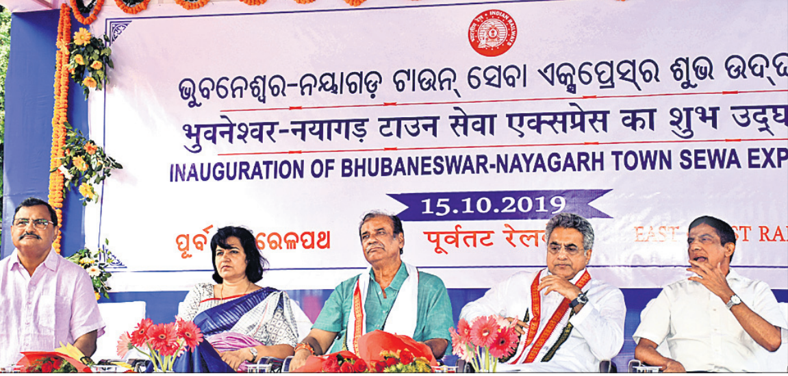
ଭୁବନେଶ୍ୱର-ନୟାଗଡ଼ ଟାଉନ୍ ସେବା ଏକ୍ସପ୍ରେସ୍‌ର ଉଦ୍ଘାଟନ କରୁଥିବାବେଳେ ଭୁବନେଶ୍ୱରରେ ଅନୁଷ୍ଠିତ ଉଦ୍ଘାଟନରେ ଉପସ୍ଥିତ ଅତିଥିମାନେ।