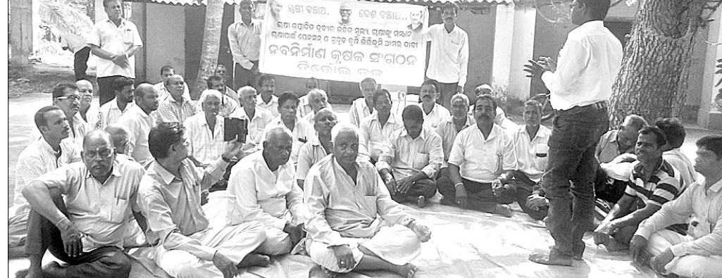
ନବନିର୍ମାଣ କୃଷକ ସଂଗଠନ ବୈଠକରେ ଉପସ୍ଥିତ ଚାଷୀ ଓ କୃଷକ ନେତା।

ସମ୍ପର୍କରେ ଆଲୋଚନା କରିବା ସହ ଉପରୋକ୍ତ ଦାବି ଉପସ୍ଥାପନ କରିଥିଲେ। ଏଥିସହ ଆସକ୍ତା ନାଥ ଶ୍ରୀ ତାରିଖରେ ଭୁବନେଶ୍ୱରରେ ପାଳିଥିବା ଏକ ସମାବେଶରେ ଭୁବନେଶ୍ୱରରେ ପଞ୍ଚମ ଅଧିବେଶନ ଉପସଭାରେ ପଞ୍ଚମ ସମାବେଶରେ ସଫଳ କରିବାକୁ ଆହ୍ୱାନ ଦେଇଥିଲେ।