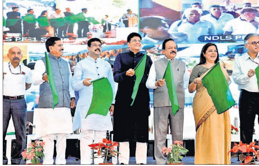
ନୂଆଦିଲ୍ଲୀରୁ ରେଳମନ୍ତ୍ରୀ ପାୟୁଷ ଗୋୟଲ, କେନ୍ଦ୍ରମନ୍ତ୍ରୀ ଧର୍ମେନ୍ଦ୍ର ପ୍ରଧାନ ଓ ଅନ୍ୟମାନେ ଭୁବନେଶ୍ୱର-ନୟାଗଡ଼ ଟାଉନ୍ ସେବା ଏକ୍ସପ୍ରେସ୍‌ର ଉଦ୍ଘାଟନ କରୁଥିବାବେଳେ ଭୁବନେଶ୍ୱରରେ ଅନୁଷ୍ଠିତ ଉଦ୍ଘାଟନରେ ଉପସ୍ଥିତ ଅତିଥିମାନେ।

ଭୁବନେଶ୍ୱର, ୧୫।୧୦।(ବୁଧବାର): ଭୁବନେଶ୍ୱରର ଉପସଭାରେ ଚିକିତ୍ସକ ଶୁଣିବେ କୋଠାରୁ ଖସି ପଡ଼ିଲେ ଯୁବକର ଘଟଣା ଘଟିଛି। ଘଟଣାରେ ଯୁବକ ଶୁଣିବେ କୋଠାରୁ ଖସି ପଡ଼ିଲେ ଯୁବକର ଘଟଣା ଘଟିଛି। ଘଟଣାରେ ଯୁବକ ଶୁଣିବେ କୋଠାରୁ ଖସି ପଡ଼ିଲେ ଯୁବକର ଘଟଣା ଘଟିଛି।