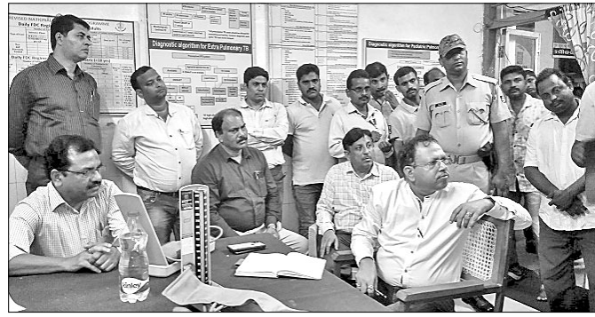
ଜିଲାପାଳ, ସଚିବ ଓ ଅନ୍ୟ ଅଧିକାରୀମାନେ ରୋଗାଳ ସହ ଆଲୋଚନା କରୁଛନ୍ତି।

ମିଳିତ କାରବାର କରିଆସୁଛନ୍ତି ବକେୟା ଅର୍ଥ ଫାଇଦା ପାଇଁ ଏଭଳି ଚାଲି କରାଯାଇଥିବା ବେଳେ ସମର୍ଥନ କରିଛି ମନ୍ଦିର ପ୍ରଶାସନ ଓ ଦେବୋତ୍ତର ବିଭାଗ।