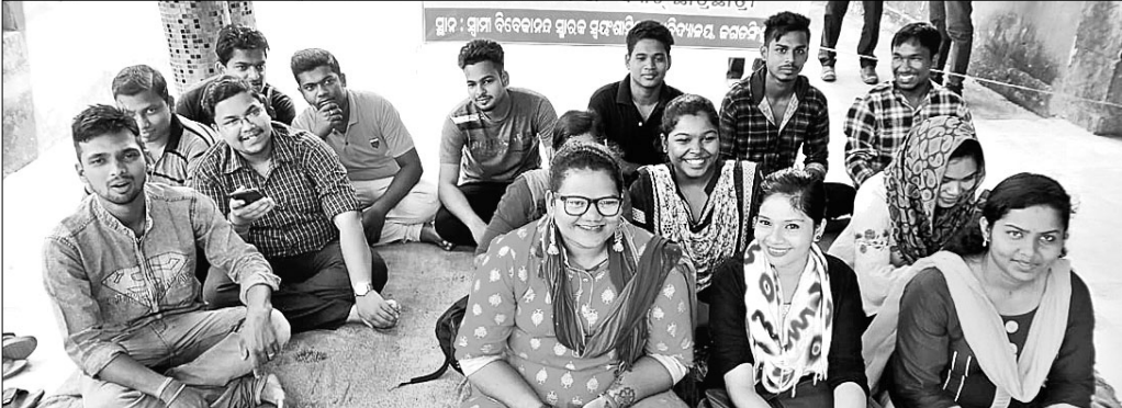
ଧାରଣାରେ ବସିଥିବା ଛାତ୍ରାଛାତ୍ରୀ