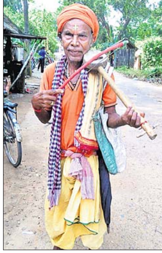
କେନ୍ଦରା ବାଦନ କରୁଛନ୍ତି ସତ୍ୟବାଦୀ। ସେହିଭଳି ଜଣେ ବ୍ୟକ୍ତି ହେଲେ ନୟାଗଡ ଜିଲ୍ଲା ଦଶପଲ୍ଲୀ ରୁକ୍ମକାନ୍ତ ହୋଇଯାଇଛି।