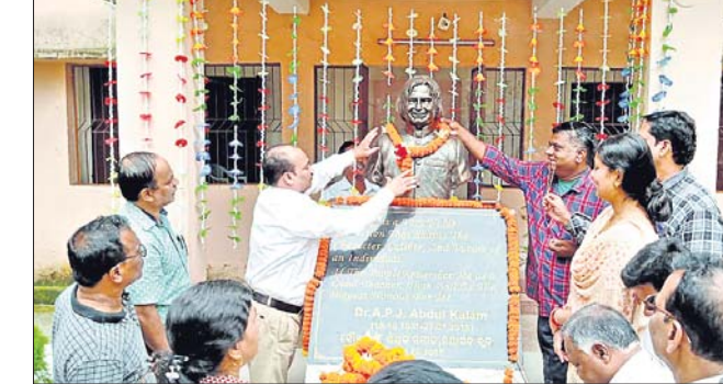
ଅନାବରଣ ହୋଇଥିବା କଲାମଙ୍କ ପ୍ରତିମୂର୍ତ୍ତି। ତଥା ଛାତ୍ରାଛାତ୍ରୀମାନେ ଅନୁପ୍ରାଣୀତ ହେବାପାଇଁ ଅତିଥିମାନେ ପଦ୍ୟକ୍ତ କରିଥିଲେ।

ମହାନ ଜନନାୟକ, ମିଶାଇଲ ମ୍ୟାନ, ଭାରତର ପୂର୍ବତନ ରାଷ୍ଟ୍ରପତି ତଥା ଭାରତର ଡ. ଏ.ପି.ଜେ ଅବଦୁଲ କଲାମଙ୍କ ପୂର୍ଣ୍ଣ ପ୍ରତିମୂର୍ତ୍ତିର ଅନାବରଣ ଉତ୍ସବ ନୟାଗଡ଼ ରୁକ୍ମକାନ୍ତ ହୋଇଯାଇଛି।