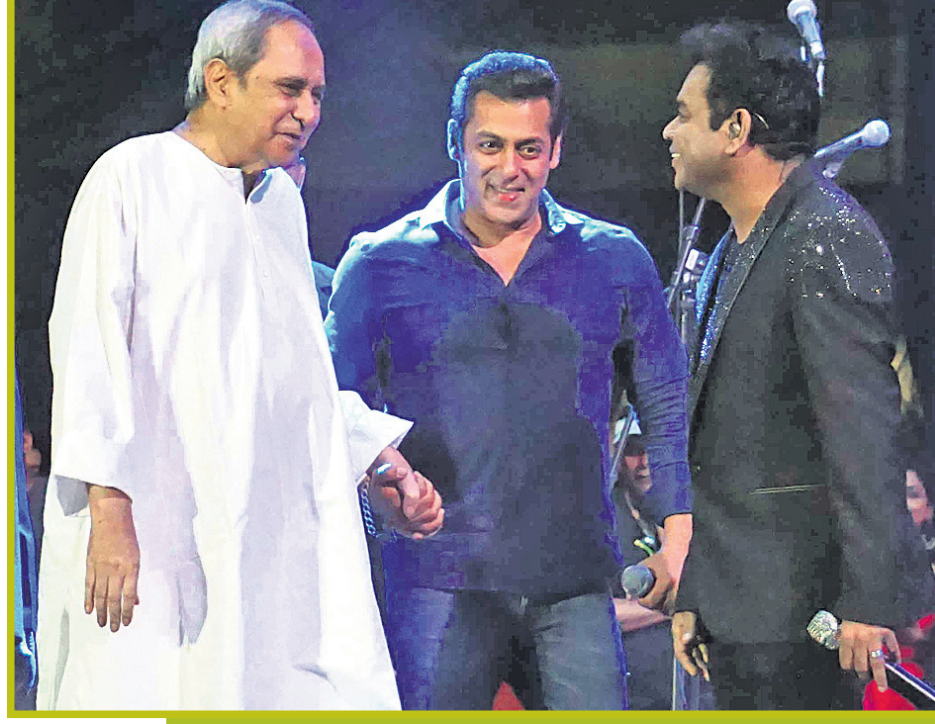
ବିଶିଷ୍ଟ ସଙ୍ଗୀତ ନିର୍ଦ୍ଦେଶକ ଏ.ଆର୍. ରେହମାନ ଓ ଲୋକପ୍ରିୟ ଅଭିନେତା ସଲମାନ ଖାନ୍‌ଙ୍କ ସହ