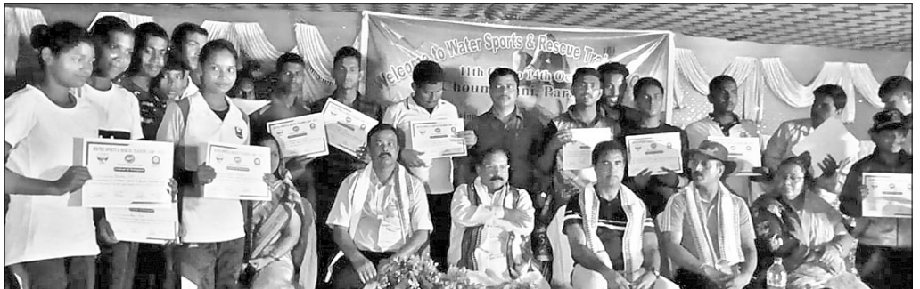
ଉପସଭାରେ ଉପସ୍ଥିତ ମନ୍ତ୍ରୀ ଋତୁନନ୍ଦନ ଦାସ ଓ ଅନ୍ୟମାନେ।

ପାରାକାପରେ ଏଭଳି ପ୍ରଶିକ୍ଷଣ ଶିବିର କରାଯାଇ ଥିବାରୁ ପ୍ରଶିକ୍ଷାଧିକାରୀ ମଧ୍ୟରେ ଭଲ ଉପାଦାନ ପ୍ରକାଶ ପାଇଥିଲା।