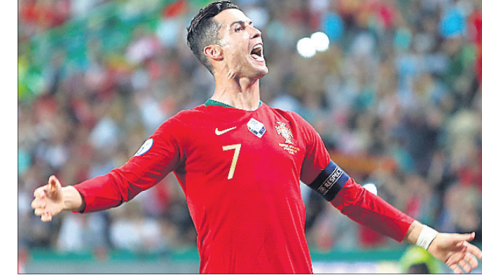
ରୋନାଲ୍ଡୋ ନଭେମ୍ବର ୨୯-୩୦ ମଧ୍ୟରେ ୭୦୦ ଗୋଲ୍ ସମ୍ପାଦନ କରିବେ ବୋଲି ଆଶା କରାଯାଉଛି।

ଷ୍ଟାଡ଼ିୟମ ଡେଇଁଥିବା ରୋନାଲ୍ଡୋଙ୍କ ୭୦୦ତମ କ୍ୟାରିୟର ଗୋଲ୍ ସେହି ସମୟରେ ପୂର୍ଣ୍ଣ ହେବ। ରୋନାଲ୍ଡୋଙ୍କ ୭୦୦ତମ କ୍ୟାରିୟର ଗୋଲ୍ ସେହି ସମୟରେ ପୂର୍ଣ୍ଣ ହେବ। ରୋନାଲ୍ଡୋଙ୍କ ୭୦୦ତମ କ୍ୟାରିୟର ଗୋଲ୍ ସେହି ସମୟରେ ପୂର୍ଣ୍ଣ ହେବ।