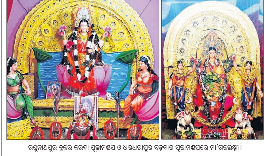
ରଘୁନାଥପୁର ବୁକ୍‌କର କରଦା ପୂଜାମଣ୍ଡପ ଓ ଧରଧରାପୁର ବଡ଼ବାର ପୂଜାମଣ୍ଡପରେ ମା' ଗଜଲକ୍ଷ୍ମୀ।