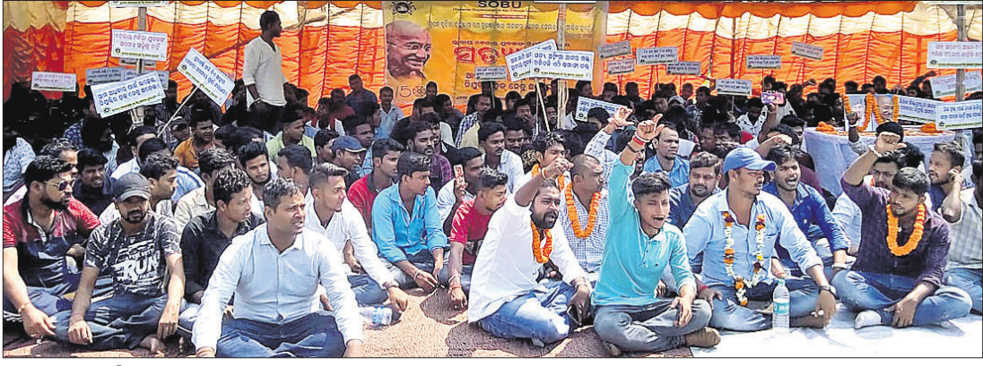
ସତ୍ୟାଗ୍ରହରେ ବସିଥିବା ମୁକ୍ତମାନେ।

ପାରାଦୀପ ବନ୍ଦରେ ୩୦ ବର୍ଷରୁ ଅଧିକ (ବିଲ୍ ଅପରେଟ୍ ଟ୍ରାନ୍ସପୋର୍ଟ) ବର୍ଷ କାମ ପାଇଥିବା ଜ୍ୟେଷ୍ଠତନ୍ତ୍ର ପାରାଦୀପ ଚର୍ଚ୍ଚନା ପ୍ରାଇଭେଟ୍ ଲିମିଟେଡ୍ ଅର୍ଥେଟିକ୍ ଆଗରେ ମଙ୍ଗଳବାର ସୋରୁ (ଷ୍ଟୁଡେଣ୍ଟ୍ ଅର୍ଗାନାଇଜେଶନ୍ ଅଫ୍ ବିଲ୍ ପକନାୟକ୍ ମୁଭିଭିଜି) ପକ୍ଷରୁ ଦିନିକିଆ ସତ୍ୟାଗ୍ରହ କରାଯାଇଛି। ଜ୍ୟେଷ୍ଠତନ୍ତ୍ର ପ୍ରକଳ୍ପରେ ଶ୍ରମିକ ଲୋକଙ୍କୁ ନିୟୁତ୍ତି ପ୍ରଦାନ ଦାବିରେ ଏହି ସତ୍ୟାଗ୍ରହ କରାଯାଇଥିଲା। ସୋରୁ ନେତୃତ୍ୱରେ ୫୫୨ ଜଣ ଉଚ୍ଚଶିକ୍ଷିତ ବେରୋଜଗାର ମୁକ୍ତ ଏଥିରେ ସାମିଲ ହୋଇଥିଲେ। ସେମାନେ ଦର୍ଶାଇଛନ୍ତି ଯେ, ସମ୍ପୂର୍ଣ୍ଣ କମ୍ପାନୀ ବାହାର ରାଜ୍ୟର ସର୍ବସମ୍ପଦ ନିୟୁତ୍ତି ଦେଉଛି। ଏଥିପାଇଁ ଶିଳ୍ପ ପ୍ରଭାବିତ ଶ୍ରମିକଙ୍କୁ ମୁକ୍ତ ମୁକ୍ତମାନେ ବେକାର ହୋଇ ବୁଲୁଛନ୍ତି। ଦିନତମାମ ଧାରଣା ଚାଲିବା ପରେ ପ୍ରଶାସନ ପକ୍ଷରୁ ଶ୍ରମିକଙ୍କୁ ଅତିରିକ୍ତ ଜିଲ୍ଲାପାଳଙ୍କ କାର୍ଯ୍ୟାଳୟରେ