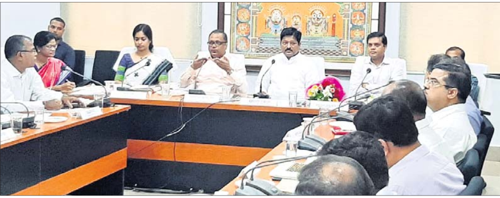
ପିଡି ଡିଆରଡିଏଙ୍କ ଦୁଇଦିନିଆ ସମ୍ମିଳନୀର ଉଦ୍‌ଘାଟନା କାର୍ଯ୍ୟକ୍ରମରେ ମନ୍ତ୍ରୀ ପ୍ରତାପ ଜେନା ଓ ଅନ୍ୟମାନେ ।