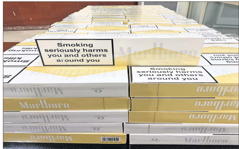
ଜବତ ସିଗାରେଟ ପ୍ୟାକେଟ୍।

ବିମାନରେ ବେଆଇନ ସୁନା ପରେ ଏବେ ବିଦେଶୀ ସିଗାରେଟ ଚାଲାଣ ଧରାପଡ଼ିଛି। ଭୁବନେଶ୍ୱର ବିଜୁ ପଟ୍ଟନାୟକ ଅନ୍ତର୍ଜାତୀୟ ବିମାନବନ୍ଦରରୁ ରାଜସ୍ୱ ଗୋଲ୍ଡମା ବିଭାଗ (ଡିଆରଆଇ) ମଙ୍ଗଳବାର ୧୨ଲକ୍ଷ ଟଙ୍କାର ସିଗାରେଟ ଜବତ କରିଛି। ୪୦୦ ପ୍ୟାକେଟରେ ରହିଥିବା ୮୦୦ହଜାର ସିଗାରେଟ କୁଆଁଳାଲମ୍ପୁରରୁ କଲିକତା ଚାଲାଣ ହେଉଥିଲା। ଭୁବନେଶ୍ୱରରୁ ବସ୍ କିମ୍ବା ଟ୍ରେନ୍ରେ ପଶ୍ଚିମବଙ୍ଗ ଯାଇଥାନ୍ତା। ସିଗାରେଟ ଚାଲାଣ କରୁଥିବା ୨ଜଣଙ୍କୁ ଡିଆରଆଇର ଅଧିକାରୀମାନେ ଅଟକ ରଖି ପଚରାଉଚରା କରୁଛନ୍ତି। ସେମାନଙ୍କ ଘର ପଶ୍ଚିମବଙ୍ଗରେ ବୋଲି ଜଣାପଡ଼ିଛି। ଏହି ଅନ୍ତର୍ଜାତୀୟ ରାଜ୍ୟକେତର ଅଧିକ ଖୋଜାଚାହିଁ ଆରମ୍ଭ ହୋଇଛି। ଡିଆରଆଇ ଅଧିକାରୀଙ୍କ ସୂଚନାସ୍ୱରରେ, ଜବତ ସିଗାରେଟ 'ମାର୍କେଟ୍' ବ୍ରାଣ୍ଡର କୁଆଁଳାଲମ୍ପୁରରେ ଏହାର ବାମ ଖୁବ୍ କମ୍। କିନ୍ତୁ ଓଡ଼ିଶା, ପଶ୍ଚିମବଙ୍ଗ ସମେତ ଭାରତର ଅନ୍ୟ ରାଜ୍ୟରେ ଗୋଟିଏ ସିଗାରେଟ ୧୫ରୁ ୨୦ଟଙ୍କାରେ ବିକ୍ରି ହେଉଛି। ରହିଥିବା ଆଇନ ଅନୁଯାୟୀ ଆମଦାନୀ କଲେ ବିଭିନ୍ନ ଟିକସ ଓ ସବୁ ଖର୍ଚ୍ଚ ମିଶିଲେ ସିଗାରେଟ ଗୋଟାପ୍ରତି କିଶା ୧୫ରୁ ଊର୍ଦ୍ଧ୍ୱ ଟଙ୍କା ପଡ଼ିଯିବ। ତେଣୁ ଧରାପଡ଼ିଥିବା ବୁଲ୍ଡଜଣ ଦଲାଲ କୁଆଁଳାଲମ୍ପୁରରୁ କମ୍ ବାମ୍ରେ ସିଗାରେଟ କିଣି ବେଆଇନ ଭାବେ ଲଗେଜ୍ ପାର୍ସଲରେ ବିମାନରେ ଆଣୁଥିଲେ। ସେମାନେ ସୋମବାର ଏୟାର ଏସିଆ ବିମାନ ଏକେ-୩୧ରେ କୁଆଁଳାଲମ୍ପୁର ବିମାନବନ୍ଦରରୁ ଭୁବନେଶ୍ୱର ଅଭିମୁଖେ ବାହାରିଥିଲେ। ଏ