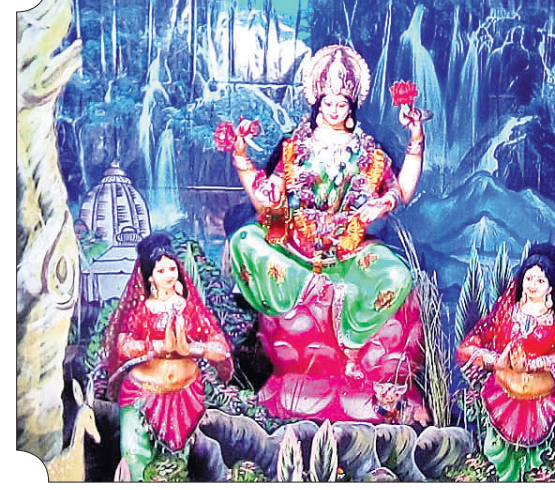
ସାନହିରୋଳ ପୂଜା ପ୍ରତିଷ୍ଠାନ।