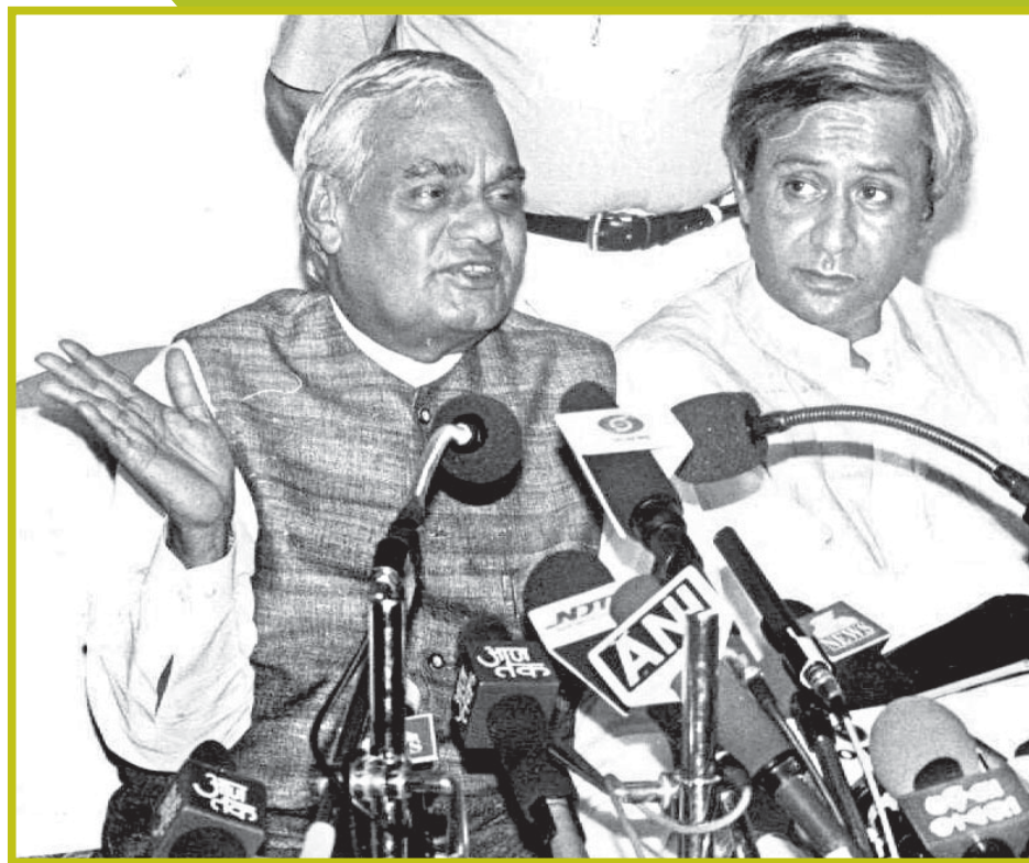
ପୂର୍ବତନ ପ୍ରଧାନମନ୍ତ୍ରୀ ଅଟଳ ବିହାରୀ ବାଜପେୟୀଙ୍କ ସହ