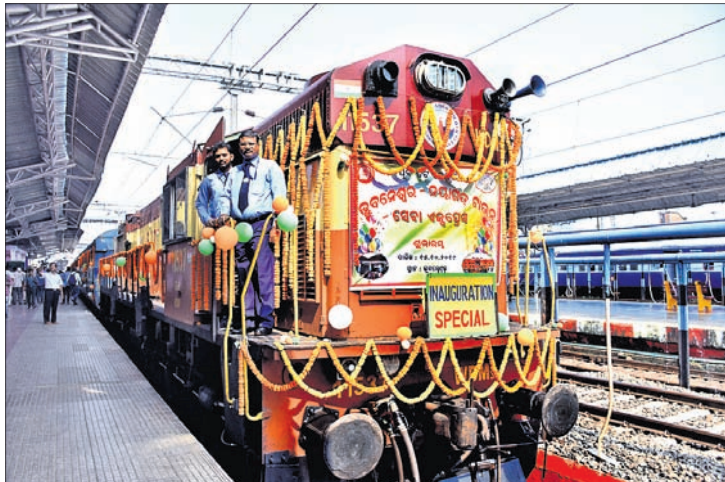
ଭୁବନେଶ୍ୱରରୁ ନୟାଗଡ଼କୁ ପ୍ରଥମ କରି ଯାଇଥିବା ଟ୍ରେନ୍।

ପ୍ରତିଦିନ ଭୁବନେଶ୍ୱରରୁ ସନ୍ଧ୍ୟା ୬ଟା ୪୦ରେ ଛାଡ଼ି ନୟାଗଡ଼ରେ ରାତି ୮ଟା ୪୫ରେ ପହଞ୍ଚିବ। ନୟାଗଡ଼ ଟାଉନରୁ ସକାଳ ୬ଟା ୩୦ରେ ଛାଡ଼ି ୯ଟାରେ ଭୁବନେଶ୍ୱରରେ ପହଞ୍ଚିବ।