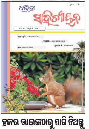
ହଜର ଭାଇଲଠାରୁ ମାରି ନିଅନ୍ତୁ