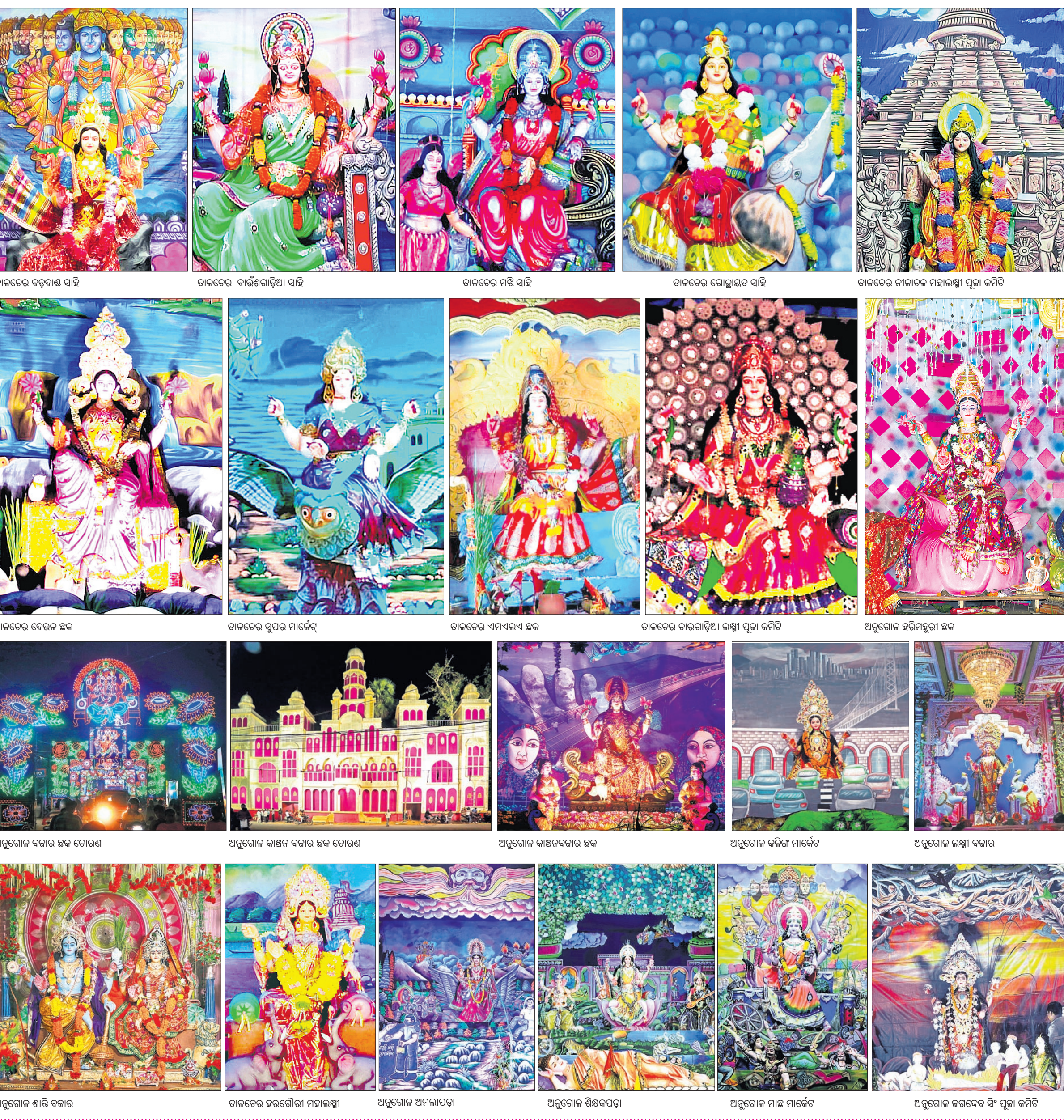
ତାଳଚେର ବଡ଼ବାଣ୍ଡ ସାହି, ତାଳଚେର ବାଉଁଶଗାଡ଼ିଆ ସାହି, ତାଳଚେର ମଝି ସାହି, ତାଳଚେର ଗୋଛାୟତ ସାହି, ତାଳଚେର ନାଳାଚଳ ମହାଲକ୍ଷ୍ମୀ ପୂଜା କମିଟି, ତାଳଚେର ଦେଉଳ ଛକ, ତାଳଚେର ସୁପର ମାର୍କେଟ୍, ତାଳଚେର ଏମଏଲଏ ଛକ, ତାଳଚେର ଚାରଗାଡ଼ିଆ ଲକ୍ଷ୍ମୀ ପୂଜା କମିଟି, ଅନୁଗୋଳ ହରିମନ୍ଦିରା ଛକ, ଅନୁଗୋଳ ବଜାର ଛକ ତୋରଣ, ଅନୁଗୋଳ କାଞ୍ଚନ ବଜାର ଛକ ତୋରଣ, ଅନୁଗୋଳ କାଞ୍ଚନବଜାର ଛକ, ଅନୁଗୋଳ କଳିଙ୍ଗ ମାର୍କେଟ୍, ଅନୁଗୋଳ ଲକ୍ଷ୍ମୀ ବଜାର, ଅନୁଗୋଳ ଶାନ୍ତି ବଜାର, ତାଳଚେର ହରଗୌରୀ ମହାଲକ୍ଷ୍ମୀ, ଅନୁଗୋଳ ଅମଳାପଡ଼ା, ଅନୁଗୋଳ ଶିକ୍ଷକପଡ଼ା, ଅନୁଗୋଳ ମାଛ ମାର୍କେଟ୍, ଅନୁଗୋଳ ଜଗଦେବ ସିଂ ପୂଜା କମିଟି