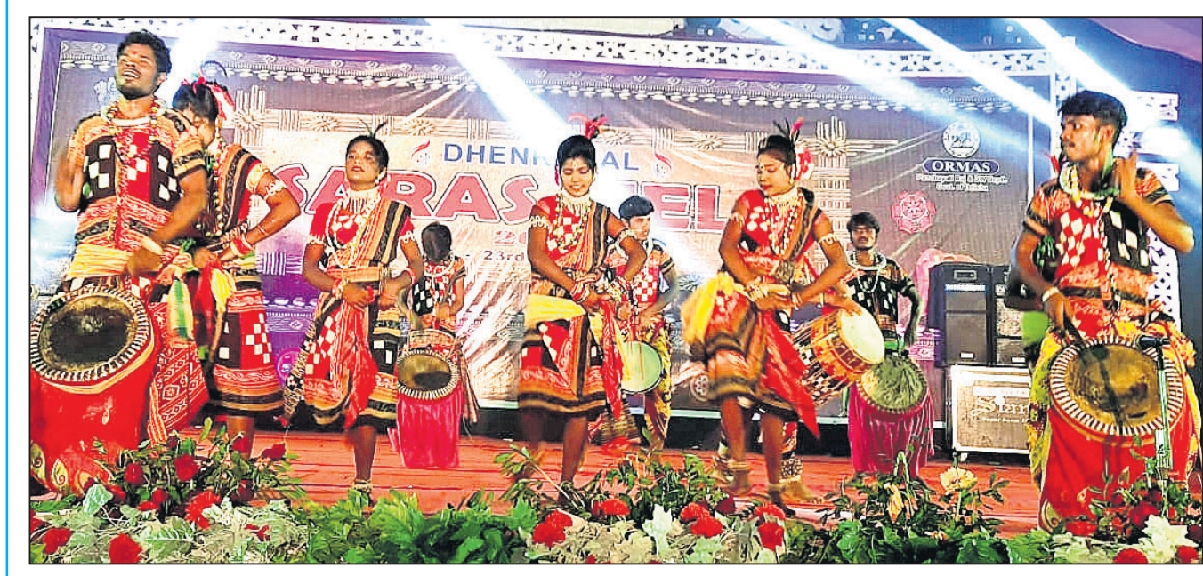
ଦେଢ଼ାମାଳ ମହିଷାସୁତ ପଡ଼ିଆରେ ଆୟୋଜିତ ଜାତୀୟସ୍ତରୀୟ ସରସବଳାରେ ବରଗଡ଼ ଜିଲାର ପୁରଝଙ୍କାର ଅନୁଷ୍ଠାନ ପକ୍ଷରୁ ପରିବେଷିତ ଲୋକନୃତ୍ୟ।