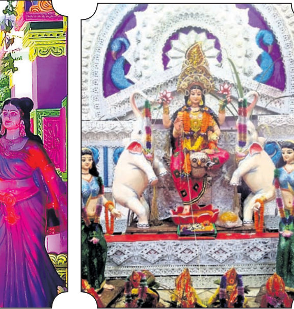
ଘଟିପିରି ବଜାର, ଓଡ଼ାପଡ଼ା।