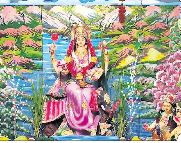
ବାଲିନୀ ପୂଜା ପ୍ରତିଷ୍ଠାନ।