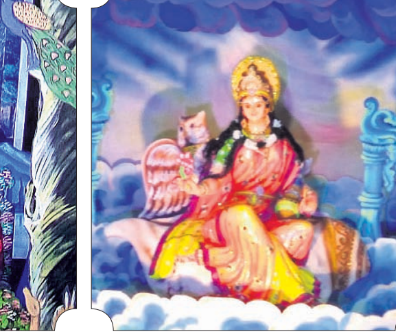
ପଞ୍ଚପଡ଼ା ବେଲବାହାଳସାହି ପୂଜାମଣ୍ଡପ।