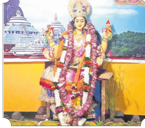
ବାକଟିଆ ପୂଜା ମଣ୍ଡପ, ରାସୋଳ।