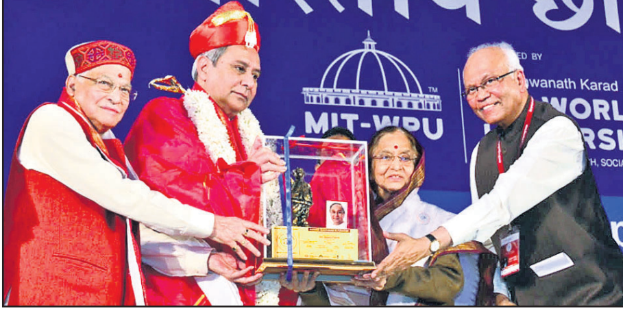
ଆଦର୍ଶ ମୁଖ୍ୟମନ୍ତ୍ରୀ ପୁରସ୍କାର ଗ୍ରହଣ କରୁଛନ୍ତି ମୁଖ୍ୟମନ୍ତ୍ରୀ ନବୀନ ପଟ୍ଟନାୟକ।