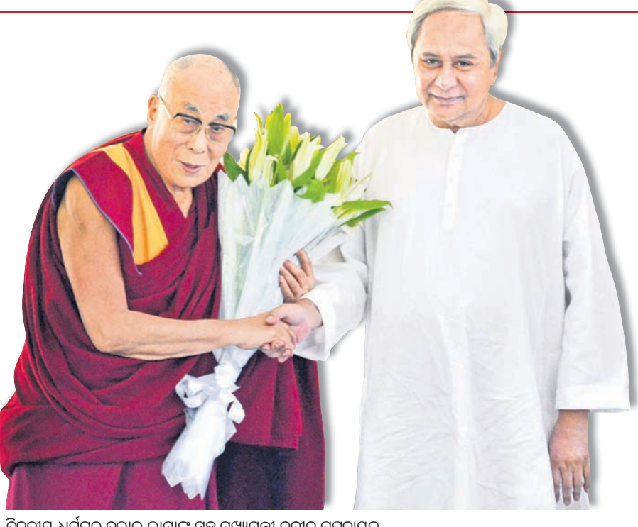
ତିବ୍ୱତୀୟ ଧର୍ମଗୁରୁ ଦଲାଲ ଲାମାଙ୍କ ସହ ମୁଖ୍ୟମନ୍ତ୍ରୀ ନବୀନ ପଟ୍ଟନାୟକ