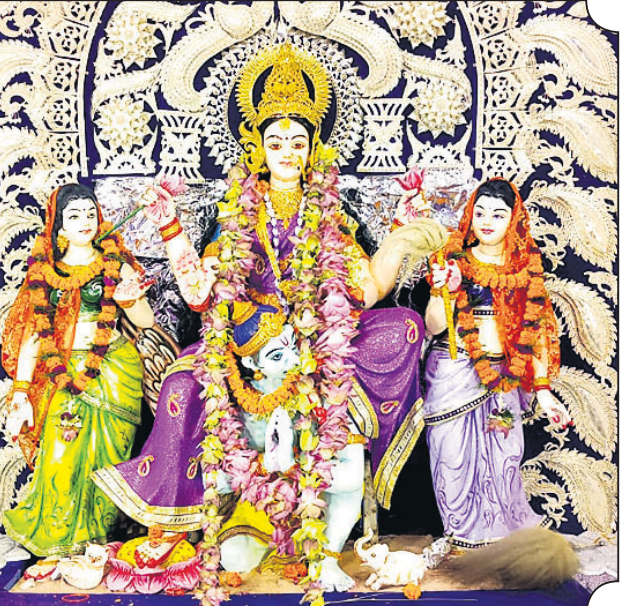
ଦେଢ଼ାମାଳ କୈବଲ୍ୟ ବଜାର, ଦେଢ଼ାମାଳ।