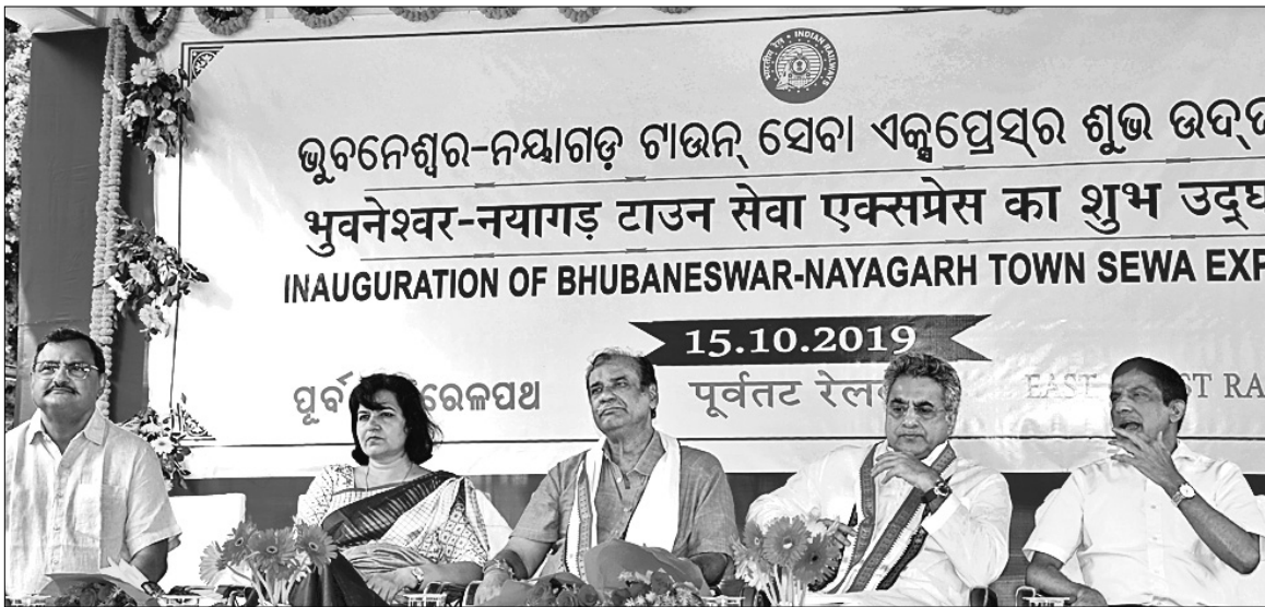
ଭୁବନେଶ୍ୱର-ନୟାଗଡ଼ ଟାଉନ ସେବା ଏକ୍ସପ୍ରେସ୍‌ର ଉଦ୍ଘାଟନ କରିଥିଲେ ଭୁବନେଶ୍ୱରର ଅନୁମୋଦନ ପ୍ରତିନିଧି ପ୍ରଧାନ ଓ ଅନ୍ୟମାନେ।