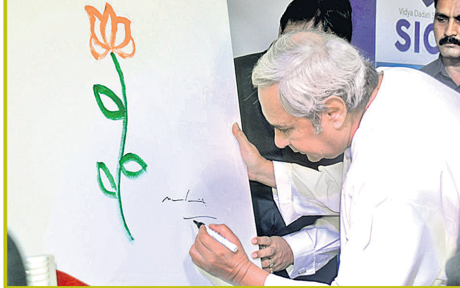
ଏକ କାର୍ଯ୍ୟକ୍ରମ ଅବସରରେ ମୁଖ୍ୟମନ୍ତ୍ରୀ ନବୀନ ପଟ୍ଟନାୟକ ଚିତ୍ର ଆଙ୍କୁଛନ୍ତି।