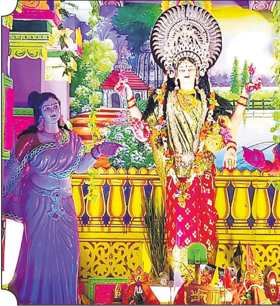
ମହାବୀର ବଜାର, ଦେଢ଼ାମାଳ।