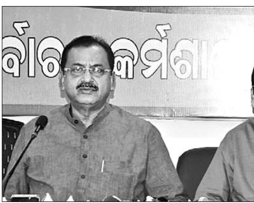
ଭାଜପା ପକ୍ଷରୁ ଆୟୋଜିତ ଖବରଦାତା ସମ୍ମିଳନୀରେ ସମୀକ୍ଷା ପ୍ରସଙ୍ଗ ମନ୍ଦୀ ଓ ଅଧ୍ୟକ୍ଷ ଶ୍ରୀ ଅନୁମୋଦନ ଉପସ୍ଥିତ।

ଭୁବନେଶ୍ୱର, ୧୫.୧୦.୧୯(ବୁଧବାର) ଓଡ଼ିଶାର ସାମ୍ବଲପୁର ଜିଲ୍ଲାର ଚିକିତ୍ସାଳୟରେ ପ୍ରତିନିଧିମଣ୍ଡଳର ଅଧ୍ୟକ୍ଷ ଶ୍ରୀ ଅନୁମୋଦନ ପାଇଁ ପ୍ରାରମ୍ଭିକ ଅନୁମୋଦନ ଦାଖଲ କରିବା ପାଇଁ କାର୍ଯ୍ୟକ୍ରମ ନିର୍ଦ୍ଧାରଣ ସମ୍ପର୍କରେ ଆଲୋଚନା କରାଯାଇଛି।