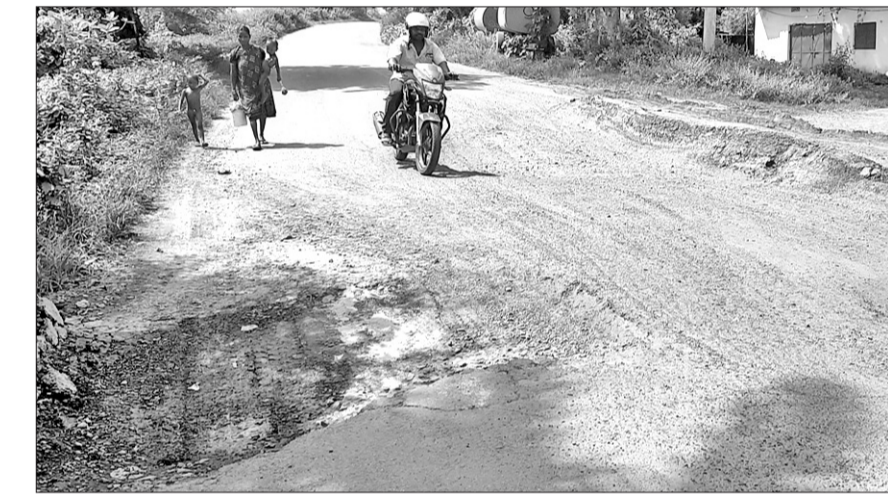
ମାନେଶ୍ୱର-ଗୁଣ୍ଡେରପୁର ରାସ୍ତାର ବଡ଼ ଗର୍ଭ ସୃଷ୍ଟି ହୋଇଛି ।

ସମ୍ବଲପୁର, ୧୫।୧୦।(ବୁଧବାର) ମାନେଶ୍ୱର ଛକଠାରୁ ଗୁଣ୍ଡେରପୁର ରାସ୍ତାର ଏକ ବ୍ରିକ ନିକଟରେ ରାସ୍ତା ଅବସ୍ଥା ଶୋଚନୀୟ ହୋଇପଡିଛି । ରାସ୍ତା ଉପରେ ମାଟି ଧୋଇଯାଇ ବଡ଼ ବଡ଼ ବ୍ରିକ୍ ଗର୍ଭ ସୃଷ୍ଟି ହୋଇଛି ।