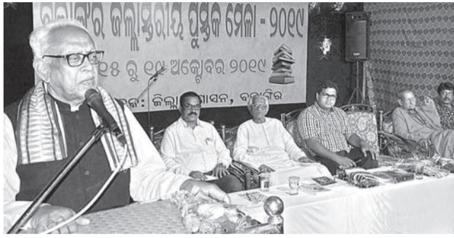
ଜିଲ୍ଲାସ୍ତରୀୟ ପୁସ୍ତକମେଳା ଉଦ୍‌ଘାଟନା ଉତ୍ସବରେ ମଞ୍ଚାଧୀନ ଅତିଥି ।

ସରକାରୀ ଉଦ୍ୟମରେ ଆରମ୍ଭ ହୋଇଥିବା ପ୍ରଥମ ଜିଲ୍ଲାସ୍ତରୀୟ ପୁସ୍ତକମେଳା ସ୍ଥାନୀୟ କୋଶଳ କଳାମଣ୍ଡଳ ପଡ଼ିଆରେ ମଙ୍ଗଳବାର ଉଦ୍‌ଘାଟିତ ହୋଇଛି । ଉଡ଼ିଆ ଭାଷା, ସାହିତ୍ୟ ଓ ସଂସ୍କୃତି ବିଭାଗ ଆନୁକୂଲ୍ୟରେ ତଥା ଜିଲ୍ଲା ପ୍ରଶାସନ ପକ୍ଷରୁ ଆୟୋଜିତ ଏହି ପୁସ୍ତକମେଳାର ଉଦ୍‌ଘାଟନା ଉତ୍ସବରେ ଜିଲ୍ଲାପାଳ ଅଭିମତ ଡାକ୍ତା ସଭାପତିଙ୍କୁ କରାଯାଇଛି ।