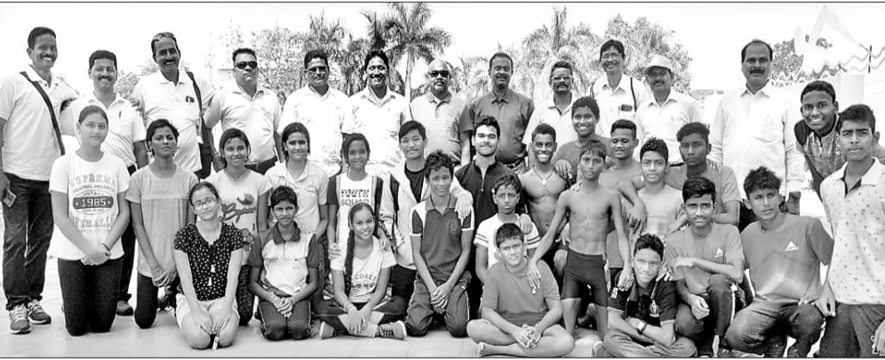
ସମ୍ବଲପୁର ଡା. ଝସକେତନ ସାହୁ ସୁଇମିଂ ପୁଲରେ ଆୟୋଜିତ ସୁଇମିଂ ସକ୍ତରଣ ପ୍ରତିଯୋଗିତାରେ ଅତିଥି ଓ କର୍ମଚାରୀମାନେ ।

ସମ୍ବଲପୁର, ୧୫।୧୦।(ବୁଧବାର) ଡା. ଝସକେତନ ସାହୁ ସୁଇମିଂ ପୁଲରେ ମଙ୍ଗଳବାର ଜିଲ୍ଲା ଶିକ୍ଷା ଅଫିସ ପକ୍ଷରୁ ସୁଇମିଂ ସକ୍ତରଣ ପ୍ରତିଯୋଗିତା ଅନୁଷ୍ଠିତ ହୋଇଯାଇଛି ।