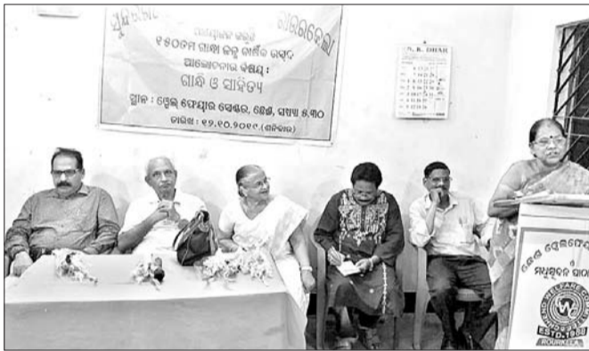
ଗାନ୍ଧୀ ଓ ସାହିତ୍ୟ ଶୀର୍ଷକ ଆଲୋଚନାକୁ ନିମ୍ନୋକ୍ତ ଅତିଥିମାନେ ଅତିଥି କରୁଛନ୍ତି

ଅଗ୍ରଣୀ ସାହିତ୍ୟାଳୟର ପୁସ୍ତକାଳୟରେ ଲେଖକ ସାମ୍ମୁଖ୍ୟ ରାଜରକେଲା ଶାଖା ପକ୍ଷରୁ ଗାନ୍ଧୀ ଓ ସାହିତ୍ୟ ଶୀର୍ଷକ ଆଲୋଚନାକୁ ଆୟୋଜିତ ହୋଇ ଯାଇଛି