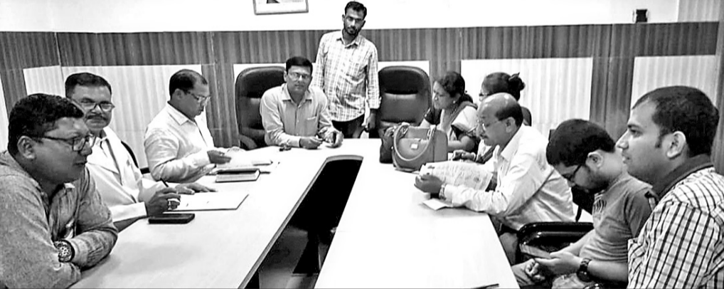
ବୁର୍ଲା ଭାମ୍ବାରରେ ତିନି ଓ ଜେଡିମ୍ପୁର ବୈଠକ ।