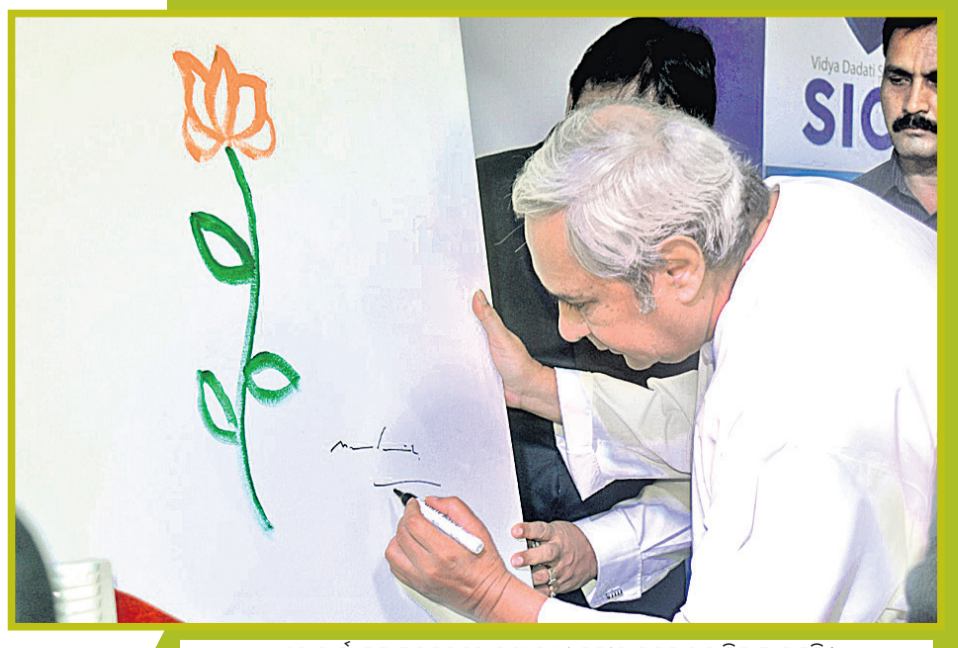
ଏକ କାର୍ଯ୍ୟକ୍ରମ ଅବସରରେ ମୁଖ୍ୟମନ୍ତ୍ରୀ ନବୀନ ପଟ୍ଟନାୟକ ଚିତ୍ର ଆଙ୍କୁଛନ୍ତି।