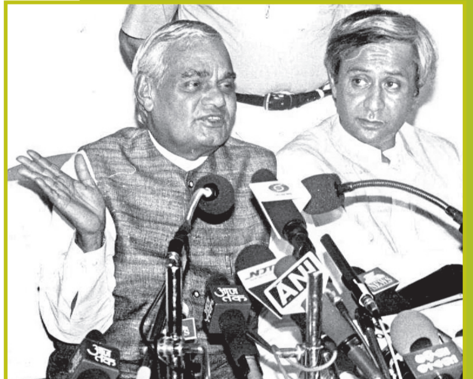
ପୂର୍ବର ପ୍ରଧାନମନ୍ତ୍ରୀ ଅଟେ ବିହାରୀ ବାଜପେୟୀଙ୍କ ସହ

ମୁଖ୍ୟମନ୍ତ୍ରୀ ନବୀନ ପଟ୍ଟନାୟକ ୨୦୧୮ ଜାନୁଆରୀରେ ପୁଣ୍ୟସକ ପୂର୍ବରୁ ରାଷ୍ଟ୍ରପତି ପ୍ରତିଭା ପାଟିଲଙ୍କ ସହିତ ଆଦର୍ଶ ମୁଖ୍ୟମନ୍ତ୍ରୀ ପୁରସ୍କାର ଗ୍ରହଣ କରିଥିଲେ। ଏହି ଅବସରରେ ସେ କହିଥିଲେ ଯେତେବେଳେ ସାଧାରଣ ଜନତା ରାଜନୀତିରେ ଅଙ୍ଗାଙ୍ଗୀ ଭାବେ କର୍ତ୍ତୃତ ହୋଇଥାଆନ୍ତି, ସେତେବେଳେ କୌଣସି ଆର୍ଷ-ରତ୍ନ କେନ୍ଦ୍ର ହେବ ନାହିଁ।