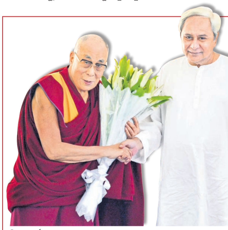
ତିବ୍ବତୀୟ ଧର୍ମଗୁରୁ ଦଳାଇ ଲାମାଙ୍କ ସହ ମୁଖ୍ୟମନ୍ତ୍ରୀ ନବୀନ ପଟ୍ଟନାୟକ

ନବୀନ ପଟ୍ଟନାୟକ ଏବେ ଦକ୍ଷିଣାପଟ୍ଟରୁ ଆସି ସମସ୍ତଙ୍କୁ ଆକର୍ଷଣ କରିଛନ୍ତି। ନବୀନ ପଟ୍ଟନାୟକ ଏବେ ଦକ୍ଷିଣାପଟ୍ଟରୁ ଆସି ସମସ୍ତଙ୍କୁ ଆକର୍ଷଣ କରିଛନ୍ତି।