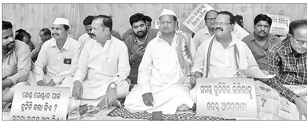
ସେଣ୍ଟ୍ରାଲ ପାର୍କ ଦୁର୍ନୀତିର ଉଚ୍ଚାଦାନ ଉପରେ ବିରୋଧ କରାଯିବ ବୋଲି କଂଗ୍ରେସର ଘୋଷଣା