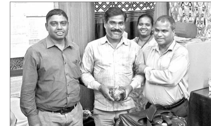
ଆର୍କିଭିଂ ଅଧିକାରୀ କର୍ମଚାରୀଙ୍କୁ ପୁରସ୍କୃତ କରୁଛନ୍ତି

ରାଜରକେଲା ଇନ୍ସାତ କାରଖାନା ଲାଷ୍ଟ ଫର୍ନେସ ବିଭାଗରେ ଗତ ୧୨ ତାରିଖରେ ଏକ ସ୍ୱତନ୍ତ୍ର ପୁରସ୍କାର ଉତ୍ସବ ଆୟୋଜିତ ହୋଇଥିଲା