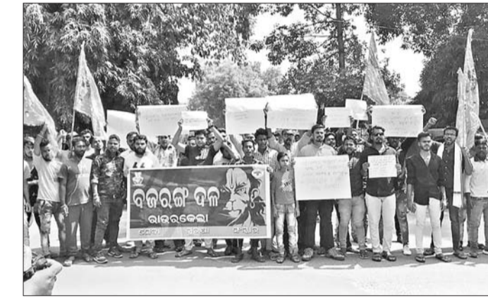
ବଜରଙ୍ଗ ଦଳ କାର୍ଯ୍ୟକର୍ତ୍ତା ଦାବିପତ୍ର ଦେବାକୁ ଆସୁଛନ୍ତି

ନିଜ କାର୍ଯ୍ୟାଳୟ ସମ୍ମୁଖ ସୁନାମ ପାର୍କ ନିକଟରୁ ଏକ ଶୋଭାଯାତ୍ରାରେ ଆଦି ଅଧିକାରୀଙ୍କ କାର୍ଯ୍ୟାଳୟ ସମ୍ମୁଖରେ ପହଞ୍ଚିଥିଲେ ଏଠାରେ ଉପସ୍ଥିତ ସଂଘ କର୍ମକର୍ତ୍ତା କହିଥିଲେ ଯେ, ମୁଖ୍ୟମନ୍ତ୍ରୀ ମମତା ବାନାର୍ଜୀ ଭୋଟ ଲାଭରେ ନ୍ୟାୟ ଅନ୍ୟାୟ ଭୁଲିଯାଇଛନ୍ତି