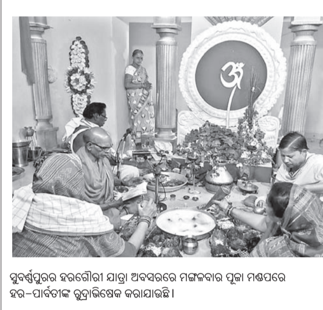
ସୁବର୍ଣ୍ଣପୁରର ହରଗୌରୀ ଯାତ୍ରା ଅବସରରେ ମଙ୍ଗଳବାର ପୂଜା ମଣ୍ଡପରେ ହର-ପାର୍ବତୀଙ୍କ ଚୁଡ଼ାଭିଷେକ କରାଯାଇଛି ।