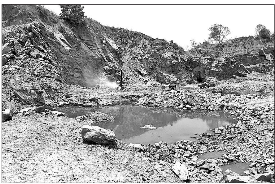
ସୁମୁମୁରା ତହସିଲ ଅଧୀନରେ ଥିବା ଏକ ପଥର ଖାଦାନ ।

ସମ୍ବଲପୁର, ୧୫।୧୦।(ବୁଧବାର) ସୁମୁମୁରା ତହସିଲ ଅଞ୍ଚଳରେ ଅଧିକାଂଶ ପଥର ଖାଦାନ ବେନିଫିଟ ଭାବେ ଲିଙ୍ଗ ପ୍ରଦାନ କରାଯାଇଛି । ହେଲେ ସରକାରୀ ନିୟମ ଓ ମାଜିନି ନିୟମକୁ ପାଳନ କରାଯାଇ ନାହିଁ ।