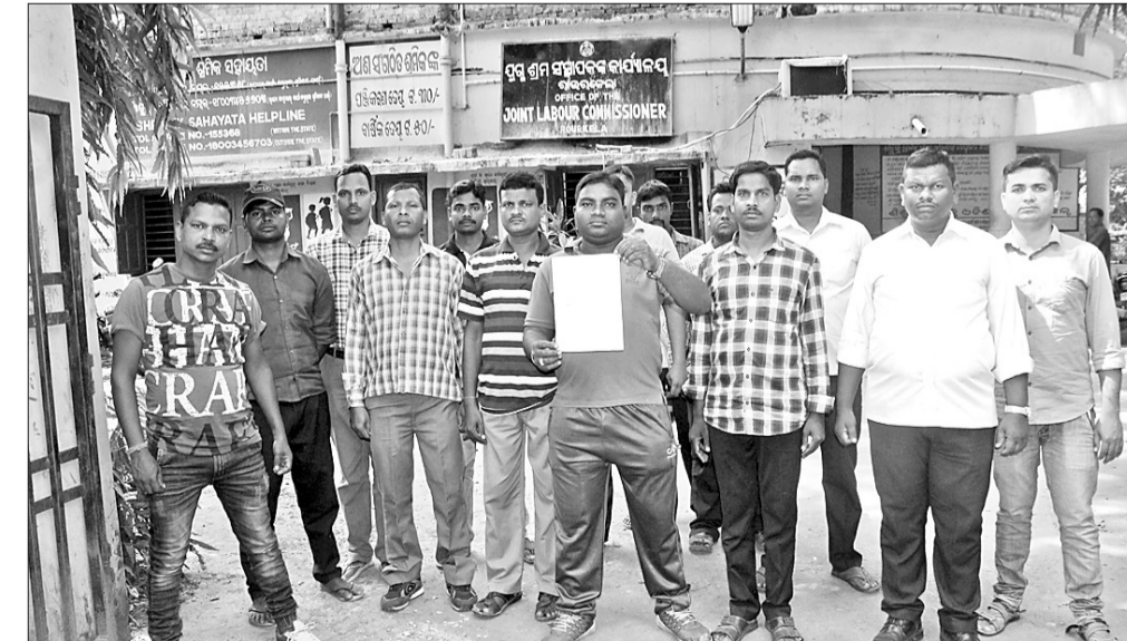
ଘରୋଇ ସୁରକ୍ଷା ଏଜେନ୍ସି କର୍ମଚାରୀଙ୍କୁ ସୁରକ୍ଷା ଦେବାକୁ ନାଲି ଆଖି ଦେବାକୁ ଅନୁରୋଧ କରାଯାଇଛି

ଘରୋଇ ସୁରକ୍ଷା ଏଜେନ୍ସି ଅଧିକାରୀଙ୍କ ଦ୍ୱାରା ଠକେଇ ଅଭିଯୋଗ କରାଯାଇଛି ଏବଂ ଏହାକୁ ଠିକ୍ କରିବାକୁ ଶ୍ରମ ଅଧିକାରୀଙ୍କୁ ନାଲି ଆଖି ଦେବାକୁ ଅନୁରୋଧ କରାଯାଇଛି