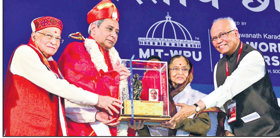
ଆଦର୍ଶ ମୁଖ୍ୟମନ୍ତ୍ରୀ ପୁରସ୍କାର ଗ୍ରହଣ କରୁଥିବା ମୁଖ୍ୟମନ୍ତ୍ରୀ ନବୀନ ପଟ୍ଟନାୟକ।