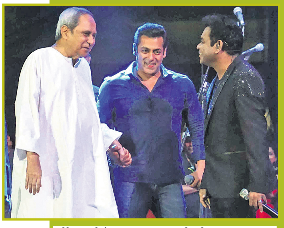
ବିଶିଷ୍ଟ ସଙ୍ଗୀତ ନିର୍ଦ୍ଦେଶକ ଏ.ଆର୍. ରେହମାନ ଓ ଲୋକପ୍ରିୟ ଅଭିନେତା ସଜମାନ ଖାନ୍‌ଙ୍କ ସହ