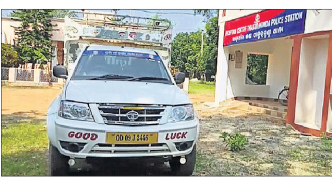
ଜବତ ଗୋରୁ ବୋଝେଇ ପିକଅପ୍ ଭ୍ୟାନ।