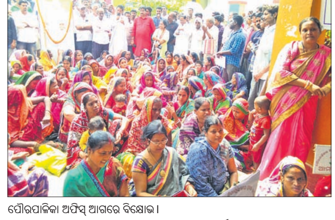
ପୌରପାଳିକା ଅଫିସ ଆଗରେ ବିଛୋଡ଼।

ପୌରପାଳିକା ଅଫିସ ଆଗରେ ବିଛୋଡ଼। ଗ୍ରହଣ ନ କରିବା ପ୍ରତିବାଦରେ ରୁପସାର କାର୍ଯ୍ୟାଳୟ ଘେରାଉ ଆଲୋଚନା କରାଯାଇଥିବା ନଗର କଂଗ୍ରେସ କମିଟି ପକ୍ଷରୁ କୁହାଯାଇଛି। ସହର ମଧ୍ୟରେ ବର୍ଷାଜଳ ଜମି ରହିବା, ଉତ୍ତମ ଆଲୋକ ଠିକ୍ ଭାବେ ମରାମତି କରା ନ ଯିବା, ପ୍ରଧାନମନ୍ତ୍ରୀ ଆବାସ