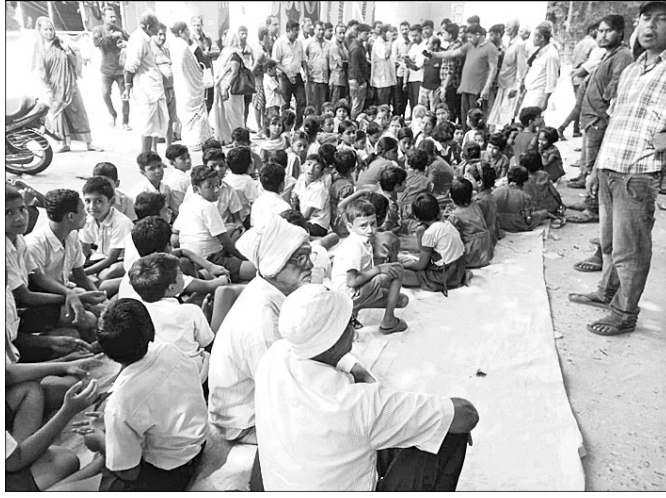
ବିଦ୍ୟାଳୟରେ ତାଲା ପକାଇ ଛାତ୍ରଛାତ୍ରୀ ଓ ଗ୍ରାମବାସୀ ଧାରଣା ଦେଇଛନ୍ତି। ଗ୍ରାମବାସୀ ବର୍ଗାଇଥିଲେ ଯେ, ମଲାଗୁଆଁ ଅବସରରେ ପ୍ରତିବର୍ଷ ଭଳି ଏଥର ଗ୍ରାମର ସାର୍ବଜନୀନ ଲକ୍ଷ୍ମୀପୂଜା ମଙ୍ଗଳଦୀ ଅଳ୍ପ ମହୋତ୍ସବ ଆୟୋଜିତ ହୋଇଥିଲା।

ବାଲେଶ୍ୱର ଜିଲା ଭୋଗରାଇ ବ୍ଲକ୍ ଅଧୀନ ମଲାଗୁଆଁ ପ୍ରାଥମିକ ବିଦ୍ୟାଳୟରେ ଅଳ୍ପ ମହୋତ୍ସବ ଆୟୋଜନକୁ କେନ୍ଦ୍ରକରି ବିବାଦୀୟ ଛୁଟି ସୃଷ୍ଟି ହୋଇଥିବାରୁ ଗ୍ରାମବାସୀ ରୁଧିରୀ ସାରାଦିନ ସ୍କୁଲ ଗେଟ୍‌ରେ ତାଲା ପକାଇ ଆନ୍ଦୋଳନ କରିଥିଲେ।