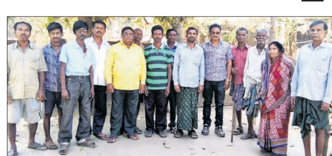
ବେଲଡ଼ିଆ ଓ ଜାମଶୁକା ଗ୍ରାମବାସୀ ରାଜସ୍ୱ ଗ୍ରାମ ମାନ୍ୟତା ଦାବି କରୁଛନ୍ତି।

ମନ୍ତ୍ରରତ୍ନ ଜିଲ୍ଲା କପ୍ପିପଦା ବ୍ଲକ୍ ଅଧୀନ ବଡ଼ବିଶୋଳ ରାଜସ୍ୱ ଗ୍ରାମରେ ରହିଛି ବେଲଡ଼ିଆ ଓ ଜାମଶୁକା ଗ୍ରାମ। ଏହି ୨ଟି ଗାଁ ବଡ଼ବିଶୋଳ ଗ୍ରାମଠାରୁ ପ୍ରାୟ ୫ କି.ମି ଦୂରରେ ଅବସ୍ଥିତ।