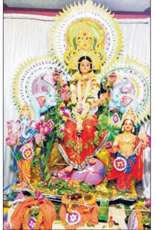
ମାଳଦାଠାରେ ମଣ୍ଡପରେ ପୂଜା ପାଉଛନ୍ତି ମା’ ଗଜଲକ୍ଷ୍ମୀ।

ଭଞ୍ଜାରିପୋଖରୀ ବ୍ଲକ୍ ମାଳଦା ଜଗନ୍ନାଥ ବଜାର ବଣିକ ସଂଘ ପକ୍ଷରୁ ଗଜଲକ୍ଷ୍ମୀ ପୂଜା ଧୂମଧାମ୍ରେ ପାଳନ ହେଉଛି। ଚଳିତବର୍ଷ ଏହି ପୂଜା ୨୦ ବର୍ଷରେ ପଦାର୍ପଣ କରିଛି। ଏଥିପାଇଁ ମାଳଦା ଅଞ୍ଚଳ ଉତ୍ସବପୂର୍ଣ୍ଣ ହୋଇଉଠିଛି। ପୂଜା ପୂର୍ବରୁ ରଙ୍ଗବେରଙ୍ଗର ଆଲୋକମାଳାରେ ସୁସଜ୍ଜିତ କରାଯାଇଛି। ଏଠାରେ ସନ୍ଧ୍ୟାରେ ଦର୍ଶନକଳା ଭିତ୍ତି ଉପରେ ମା’ଙ୍କ ପୂଜା ପାଇଁ ପ୍ରତ୍ୟହ ସନ୍ଧ୍ୟାରେ ସାଂସ୍କୃତିକ କାର୍ଯ୍ୟକ୍ରମ ହେଉଛି। ଏହାଛଡ଼ା ପାର୍ଶ୍ୱ ଦେବଦେବୀ, ବାବୁଆଳି ହେଲମେଟ ପିନ୍ଧନ୍ତୁ ପୁରୁଷିତ ରୁହନ୍ତୁ, ବିକ୍ରମ ବେତାଳ, ଶ୍ରୀ ରାଧେ ପୂଜନା ବଧ, ବସାଇ ନ ଦେବ ନାବ ନ ଯୋଇ ପାଦ ମାଧ୍ୟମରେ ସଚେତନତା ବାର୍ତ୍ତା ପ୍ରଦାନ କରାଯାଉଛି।