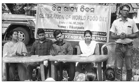
କାର୍ଯ୍ୟକ୍ରମରେ ଉପସ୍ଥିତ ଅତିଥି।

ଆମ ସମାଜରେ ଏପରି ଦିଲ୍ଲି ବ୍ୟକ୍ତି ଅଛନ୍ତି ଯେଉଁମାନେ ମାନସମ୍ମାନକୁ ଖାତିର ନ କରି ପର ଆଗରେ ହାତ ପତେଇଥାନ୍ତି। ଅଥଚ ଆଉ କେହି ଭଲଭାବେ ଆଦର ଅଭ୍ୟର୍ଥନା ଦେଖାଇଲେ ମଧ୍ୟ ସେ ତାହାକୁ ଗ୍ରହଣ ନ କରି ନାନା ସମାଲୋଚନା କରିଥାନ୍ତି। ପ୍ରକୃତିକତା ବ୍ୟକ୍ତିଙ୍କ ଏପରି ରଙ୍ଗଭଙ୍ଗ ହୋଇଥିବା ଅର୍ଥରେ ଏଭଳି ଭକ୍ତି ପ୍ରକାଶ କରାଯାଇଛି।