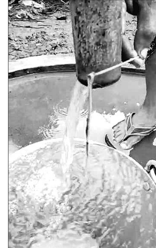
ନଳକୁଅ ପାଣିରୁ ବାହାରିଥିବା ପୋକ।

ନଳକୁଅରୁ ହାହାଲ ହୋଇ ଯାଇଛି ପୋକ ସହିତ ବାହାରୁ ଆସୁଥିବା ପୋକ ଜୋକ। ଏହା ଦେଖି ଖର୍ଚ୍ଚ ବସିବା ଉଚିତ ନଳକୁଅରୁ ପାଣି ପିଇବା ବନ୍ଦ କରିବା ସହିତ ଆନୁଷ୍ଠାନିକ କାମ ମଧ୍ୟ ବନ୍ଦ କରି ଦେଇଛନ୍ତି। ଏହି ଘଟଣା ଦେଖିବାକୁ ମିଳିଛି ଝୁଝୁରା ବ୍ଲକ୍ ଅନ୍ତର୍ଗତ ଖେଣ୍ଡୁରା ଗ୍ରାମ ପଂଚାୟତର ୭୨୯ ଖର୍ଚ୍ଚରେ ରହିଥିବା ନଳକୁଅରୁ। ଖର୍ଚ୍ଚ ବାଦୀ ଏ ନେଇ ପଞ୍ଚାୟତ କାର୍ଯ୍ୟାଳୟରେ ଅଭିଯୋଗ କରିବା ସହିତ ଝୁଝୁରାସ୍ଥିତ ଗ୍ରାମ୍ୟ ପାନୀୟ ଜଳ ଯୋଗାଣ ବିଭାଗର ଦୃଷ୍ଟି ଆକର୍ଷଣ କରିଛନ୍ତି। ନଳକୁଅ ପାଖରେ ଆବର୍ଜନାମୟ ପରିବେଶ ତଥା କେଶିଙ୍ଗ ପାଇବ।