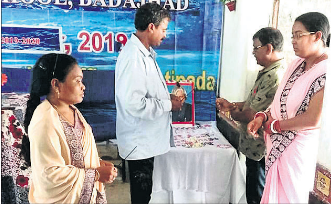
ଅଭିଯୋଗ କଲମାମଙ୍କ ପତ୍ନୀ ଚିତ୍ତରେ ମାଲ୍ୟାପର୍ଣ୍ଣ କରୁଛନ୍ତି।