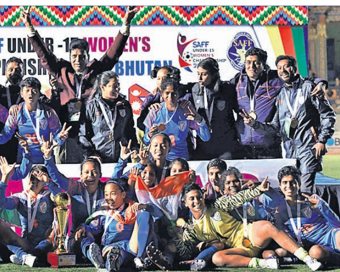
ଚାମ୍ପିୟନ ଭାରତୀୟ ଦଳର ଖେଳାଳିମାନେ ଟ୍ରଫି ସହ ଖୁସି ପୁହୁଛନ୍ତି।