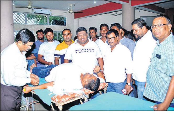
ଶିବିରରେ ବିଜେଡି ନେତାଙ୍କ ସହାୟତାରେ ୩୯୦ ଯୁନିଟ୍ ରକ୍ତ ସଂଗୃହୀତ ହେଉଛି।