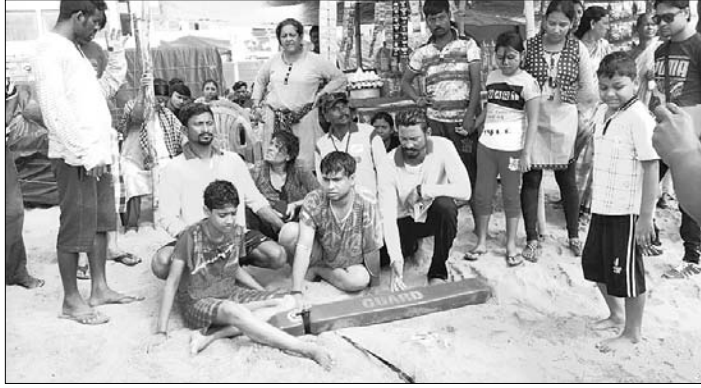
ସମୁଦ୍ରରୁ ଉଦ୍ଧାର ମୁଦ୍ଦକ ଓ ମହିଳା ।

ଅନୁରକ୍ଷିତ ହୋଇପଡ଼ିଛି ସମୁଦ୍ର ସ୍ନାନ । ସତେଜନତା ଅଭାବରୁ କେବେ କେହି ମାତୃରେ ପର୍ଯ୍ୟଟକ ଆହତ ହେଉଛନ୍ତି ତ ଆଉ କେବେ ଗଭୀରକୁ ଭାସିଯାଇ ମୃତ୍ୟୁମୁଖରେ ପହଞ୍ଚିଛି । ଗତ ୭ଦିନରେ ସମୁଦ୍ରରେ ୩ଟି ବଡ଼ଧରଣର ଦୁର୍ଘଟଣା ଘଟିଛି । ଏଥିରେ ୨ଜଣଙ୍କ ଜୀବନ ଯାଇଥିବାବେଳେ କେହି ମାତୃରେ ୩୦ରୁ ଊର୍ଦ୍ଧ୍ୱ ଆହତ ହୋଇଥିବା ଜଣାପଡ଼ିଛି । ମଙ୍ଗଳବାର ସମୁଦ୍ରରେ ବୁଢ଼ିଯାଇ ନିଖୋଜ ଥିବା ୨ଜଣଙ୍କ ମୃତଦେହ ବୁଧବାର ମିଳିଛି । ସେହିପରି ବୁଢ଼ିଯାଉଥିବାବେଳେ ୪ଜଣଙ୍କୁ ଉଦ୍ଧାର କରାଯାଇଛି ।