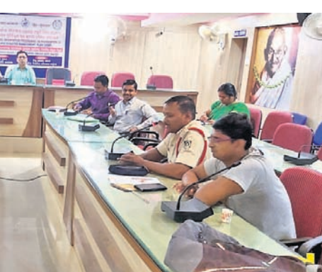
ବୈଠକରେ ଉପସ୍ଥିତ ଅଧିକାରୀ।

ପ୍ରାକୃତିକ ବିପର୍ଯ୍ୟୟ ସମୟରେ ସମନ୍ୱୟ ଅଭାବ ଯୋଗୁଁ ବିଭିନ୍ନ ସମୟରେ ଲୋକେ ଅସୁବିଧାର ସମ୍ମୁଖୀନ ହେଉଛନ୍ତି। ତେଣୁ ସମନ୍ୱୟ ରକ୍ଷା କରି କିଛି ପ୍ରାକୃତିକ ବିପର୍ଯ୍ୟୟକୁ ମୁକାବିଲା କରାଯିବ ସେନେଇ ଏକ ବୈଠକ ରୁଧିରା ଭଞ୍ଜନଗର ରୁକ୍ଷ ସମ୍ମିଳନୀ କକ୍ଷରେ ଅନୁଷ୍ଠିତ ହୋଇଥିଲା। ବୈଠକରେ ଉଦ୍ଦେଶ୍ୟ ହେଲା ଶୁନ ମୁତାହତ। କେତକ ପଞ୍ଚାୟତର ଲୋକ ପ୍ରତିନିଧି ଏବଂ ବିଭିନ୍ନ ବିଭାଗର ଅଧିକାରୀମାନେ ଯୋଗଦେଇ ଆଲୋଚନାରେ ଭାଗ ନେଇଥିଲେ। ଭଞ୍ଜନଗର ଅଗ୍ରଣୀୟ ବିଭାଗର ଅଧିକାରୀ ବୈଠକରେ ଯୋଗଦେଇ କହିଥିଲେ ଯେ, ପ୍ରାକୃତିକ ବିପର୍ଯ୍ୟୟ ମୁକାବିଲା ପାଇଁ ଆମ ପାଖରେ ଆବଶ୍ୟକ ସମ୍ବଳ ସମ୍ପୂର୍ଣ୍ଣ ଭାବେ କର୍ମଚାରୀ ଅଭାବ। କିନ୍ତୁ ଆମକୁ ଏକାଧିକ ବ୍ୟକ୍ତି ସହାୟତା ପାଇଁ ନିବେଦନ କରୁଛନ୍ତି। ଏହି ସମୟରେ ସମନ୍ୱୟ ଆବଶ୍ୟକତା ରହିଛି।