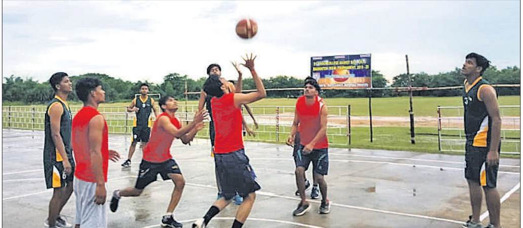
ବାସ୍କେଟବଲ ଖେଳର ଏକ ଦୃଶ୍ୟ।