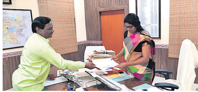
ଜିଲ୍ଲାପାଳଙ୍କୁ ରହିତାଦେଶ କପି ପ୍ରଦାନ କରୁଛନ୍ତି ବିଧାୟକ