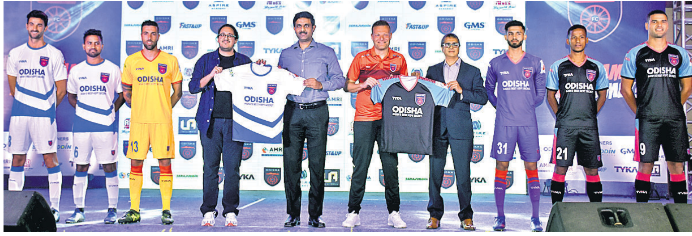
ଭୁବନେଶ୍ୱର: ରୁସ୍‌ସାର ଆୟୋଜିତ ଏକ ସ୍ୱତନ୍ତ୍ର କାର୍ଯ୍ୟକ୍ରମରେ ଅତିଥି ଖେଳାଳି ଓ କର୍ମଚାରୀମାନେ ଓଡ଼ିଶା ଏଫସି ଦଳର ଜର୍ସି ଉନ୍ମୋଚନ କରୁଛନ୍ତି ।