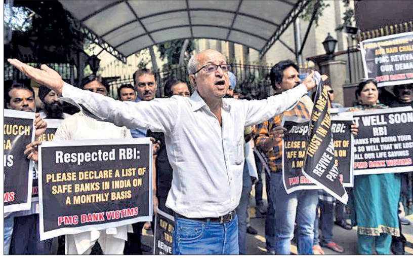
ପଞ୍ଜାବ ଆଣ୍ଡ ମହାରାଷ୍ଟ୍ର କୋ-ଅପରେଟିଭ୍ ବ୍ୟାଙ୍କ (ପିଏମ୍‌ସି)ରେ ସଙ୍କଟ ଲାଗିରହିଥିବାବେଳେ ଏହାର ଗ୍ରାହକମାନେ ଦୁଆଦିଲ୍ଲୀସ୍ଥିତ ଭାରତୀୟ ରିଜର୍ଭ ବ୍ୟାଙ୍କ (ଆର୍‌ବିଆଇ) ପୁଖ୍ୟାଳୟ ବାହାରେ ବିକ୍ଷୋଭ କରୁଛନ୍ତି।