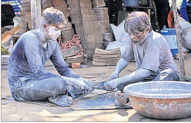
ଦାପାବଳି ପାଇଁ ଅହମଦାବାଦର ଏକ ବାଣ କାରଖାନାରେ ବାଣ ପ୍ରସ୍ତୁତିରେ ବ୍ୟସ୍ତ ରୁଜ ଶ୍ରମିକ।