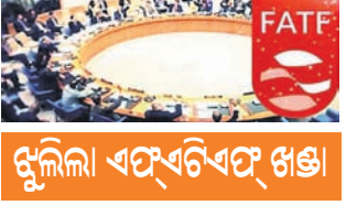
ଫୁଲିଲି ଏଫ୍‌ଏଚ୍‌ଏଫ୍ ଖଣ୍ଡା

ଆତଙ୍କବାଦକୁ ନେଇ ପାକିସ୍ତାନ ଏକପକ୍ଷୀୟ ହୋଇପଡ଼ିଥିବାବେଳେ ଏହାକୁ ପୁଣି ଏକ ଝଟକା ଲାଗିଛି। ପାକିସ୍ତାନକୁ ଆସନ୍ତା ୨୦୨୦ ଫେବୃୟାରୀ ମାସ ପର୍ଯ୍ୟନ୍ତ ଗ୍ରେ ଲିଷ୍ଟରେ ରଖିବା ଲାଗି ଏଫ୍‌ଏଚ୍‌ଏଫ୍ (ଫାଲିନାହିଆଲ ଆକ୍ସନ ଟାଏମ୍‌ପୋରୀ) ପକ୍ଷରୁ ନିଷ୍ପତ୍ତି ଗ୍ରହଣ କରାଯାଇଥିବା ମିଡ଼ିଆ ରିପୋର୍ଟରୁ ଜଣାପଡ଼ିଛି। ଏଥିସହ ଏହି ସମୟ ମଧ୍ୟରେ ଆତଙ୍କବାଦୀଙ୍କ ବିରୋଧରେ ଦୃଢ଼ କାର୍ଯ୍ୟାନୁଷ୍ଠାନ ଗ୍ରହଣ କରିବା, ସେମାନଙ୍କୁ ଆର୍ଥିକ