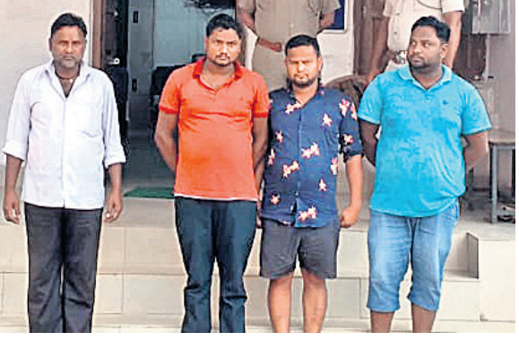
ଧରଣୀ ୪ ଅଭିଯୁକ୍ତ ।