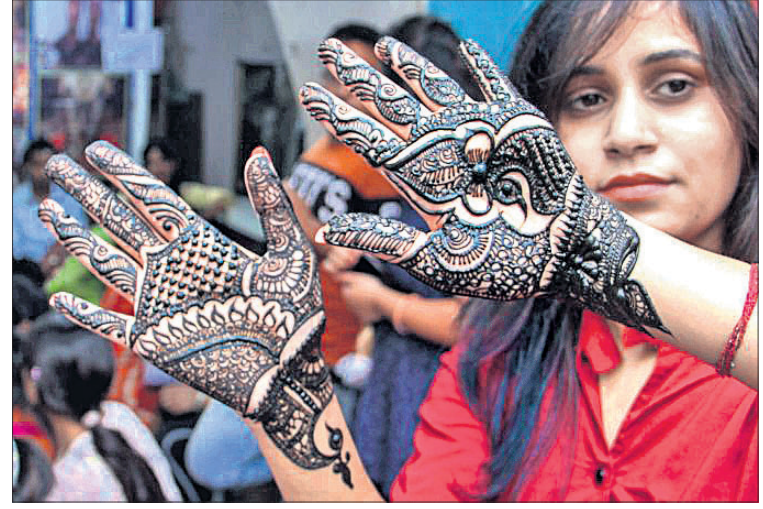
କରଓଡ଼ା ଉତ୍ସବ ପୂର୍ବରୁ ନିଜ ହାତରେ ମେହେନ୍ଦି ଲଗାଇଛନ୍ତି ଜଣେ ଲକ୍ଷ୍ମଣୀ।