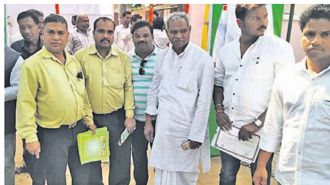
କାର୍ଯ୍ୟକ୍ରମରେ ଉପସ୍ଥିତ ବିଧାୟକ ଓ ଅନ୍ୟମାନେ।