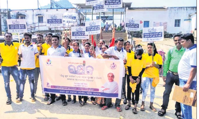
ବିକ୍ର ମୁବ ବାହିନୀ ପକ୍ଷରୁ ବାହାରି ଥିବା ସଚେତନତା ଶୋଭାଯାତ୍ରା।

ପରିକ୍ରମା କରିଥିଲେ। ଶୋଭାଯାତ୍ରାଟି ରେଳ ଷ୍ଟେସନ ପରିସରକୁ ବାହାରି ଥିଲା। ସହରର ବିଭିନ୍ନ ଛକରେ ସେମାନେ ସଚେତନତା ବାର୍ତ୍ତା ଦେଇଥିଲେ। 'ସଚର୍କ ହୁଅନ୍ତୁ, ସୁରକ୍ଷିତ ରୁହନ୍ତୁ', 'ଆମ ଭଲ ପାଇଁ ନିୟମ, ତାକୁ ମାନିବା ଆମ କାମ', 'ଜରିମାନା ରୁହେଁ ଜୀବନ ବଢ଼, ଜୀବନ ରହିଲେ ଜିତିବ ଗଡ଼' ବୋଲି ସେମାନେ ଘୋଷା ଦେଇଥିଲେ। ଏଥିସହ ବିନା ହେଲମେଟରେ ବାଇକରେ ଯାତ୍ରା କରୁଥିବା ଲୋକଙ୍କୁ ହେଲମେଟ ପିନ୍ଧିବାକୁ ସଚେତନ କରିଥିଲେ।