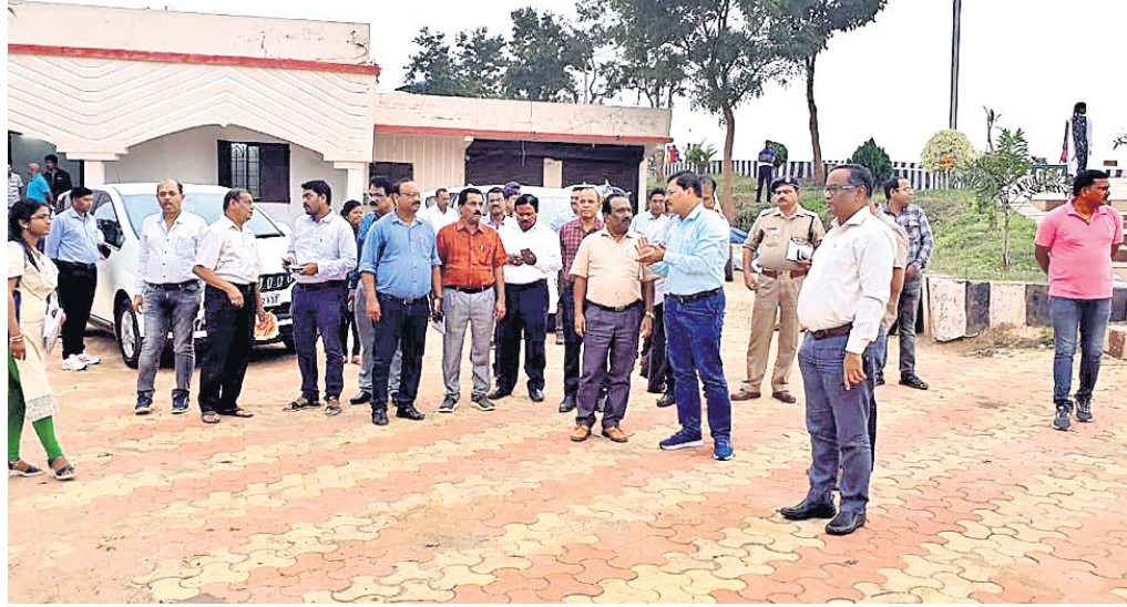
ହିଲିଡଙ୍ଗରକୁ ଜିଲାପାଳ ଓ ଅନ୍ୟମାନେ ପରିଦର୍ଶନ କରୁଛନ୍ତି ।

ପାହାଡ଼ର ବୃକ୍ଷପାର୍ଶ୍ୱରେ ଲଗାଯିବ କୃଷ୍ଣ ଓ ରାଧାଚୂଡ଼ା ଗଛ ପ୍ରବେଶ ପଥରୁ ପାହାଡ଼ ଶିଖର ପର୍ଯ୍ୟନ୍ତ ସ୍ଥାନିତ ହେବ ଆଦିବାସୀ ଚିତ୍ରକଳା