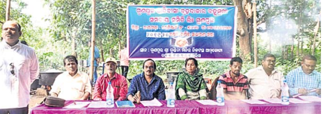
କାର୍ଯ୍ୟକ୍ରମରେ ଉପସ୍ଥିତ ଅତିଥିମାନେ।