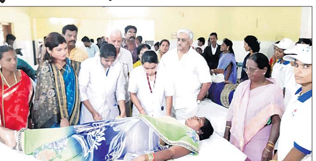
ଶିବିରରେ ଜଣେ ମହିଳା ରକ୍ତ ଦେଉଛନ୍ତି।