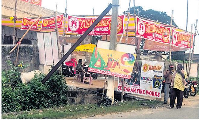
ବାଣ ବୋକାନ ।

ଦୀପାବଳି ଆଉ ମାତ୍ର କିଛି ଦିନ ବାକି ରହିଥିବାବେଳେ ବାଣ ବ୍ୟବସାୟୀ ଚଳଚଞ୍ଚଳ ହୋଇ ଉଠିଛନ୍ତି। ଗତବର୍ଷ ପାରଳାଖେମୁଣ୍ଡି ସହରର ଗୁଣ୍ଡିଚାବାଡ଼ି ପଡ଼ିଆରେ ଏକଦିନ ଗୋଟିଏ ୮୦ ଫୁଟ ଉଚ୍ଚ ଅସ୍ଥାୟୀ ବ୍ୟବସାୟୀଙ୍କୁ ଲାଇସେନ୍ସ ପ୍ରଦାନ କରାଯାଇଥିବାବେଳେ ଚଳିତବର୍ଷ ଏ ପର୍ଯ୍ୟନ୍ତ ୬୦ ଫୁଟ ଉଚ୍ଚ ଆବେଦନ ପତ୍ର ଗ୍ରହଣ କରାଯାଇଥିବା ବିଭାଗୀୟ ସ୍ତରକୁ ପ୍ରକାଶ।