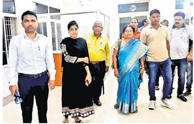
୫ଟି ସଚିବଙ୍କ ଗସ୍ତକୁ ନେଇ ପ୍ରଶାସନ ତପ୍ତର।

ଡିକିସାଳୟ, ଆହାର କେନ୍ଦ୍ର ସମେତ ପ୍ରମୁଖ ସ୍ଥାନରେ ତରବରିଆଭାବେ ସଫାସୁତରା କରାଯିବା ସହ ରଜ୍ଜ କରାଯାଇଥିବା ଦେଖିବାକୁ ମିଳିଛି। ସମସ୍ତ କାର୍ଯ୍ୟକ୍ରମ ପାଇଁ ଉପଯୁକ୍ତ ସ୍ଥାନ ଗୁଣ୍ଡିଚାବାଡ଼ି ପଡ଼ିଆରେ ପ୍ରସ୍ତୁତ କରାଯିବ।