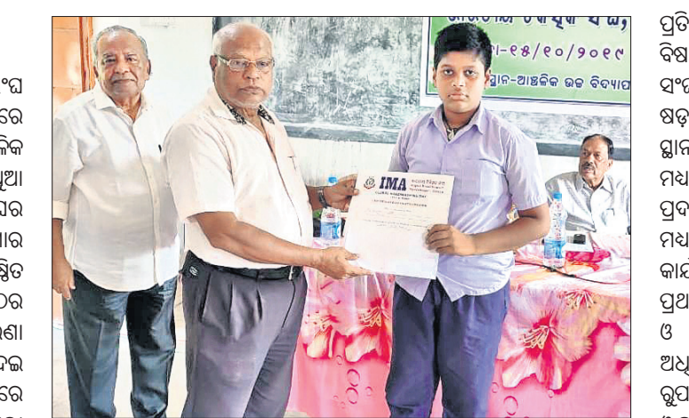
କଣେ କୃତୀ ଛାତ୍ରୀଙ୍କୁ ଅତିଥି ପୁରସ୍କୃତ କରୁଛନ୍ତି। ସ୍ୱଳ୍ପ ମୂଲ୍ୟରେ ଉପଲବ୍ଧ ହେଉଥିବା ସାଧାରଣ ହାତଧୁଆ ସାବୁନରେ କପିରି ହାତ ଧୋଇ ରୋଗ ସଂକ୍ରମଣକୁ