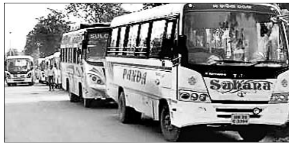
ବେଆଇନ ଭାବେ ପାର୍କିଂ କରାଯାଇଥିବା ବସ୍