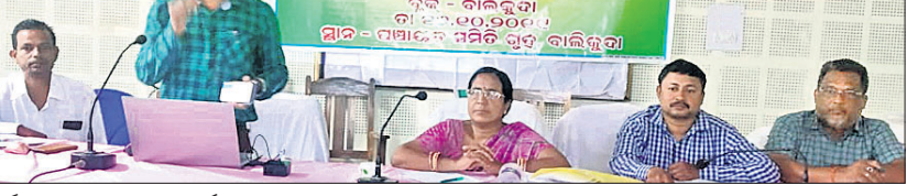
ବର୍ତ୍ତମାନ ପରିଚାଳନା ସମ୍ପର୍କିତ ତାଲିମ ଶିବିରରେ ଯୋଗଦେଇଥିବା ଅତିଥି।