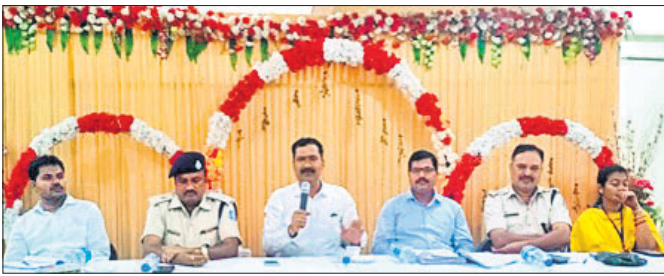
ବୈଠକରେ କଳିଜନଗର ଏଡିଏମ୍‌ଙ୍କ ସହ ଅତିରିକ୍ତ ଆରକ୍ଷା ଅଧ୍ୟକ୍ଷକ ଏବଂ ଅନ୍ୟମାନେ ।

ସହରର ଗ୍ରାମିକ, ବିଦ୍ୟୁତ୍, ପାନୀୟ ଜଳ ସମସ୍ୟା, ରାସ୍ତାଘାଟଗୁଡ଼ିକ ପୂର୍ଣ୍ଣ ବିଭାଗ ଓ ପୌର ପରିଷଦ ପକ୍ଷରୁ ଯୁକ୍ତକାଳୀନ ଭିତରେ ମରାମତି କରିବା ସହ ପୌର ପରିଷଦ ପକ୍ଷରୁ ପରିମଳ ବ୍ୟବସ୍ଥା ପୂଜା କର୍ମିତ ପକ୍ଷରୁ ବିଦ୍ୟୁତ୍ ସୁରକ୍ଷା ହୋଇଥିଲା। ଆସନ୍ତା ଅକ୍ଟୋବର ୨୭ ତାରିଖରୁ କାଳୀପୂଜା ଆରମ୍ଭ ହୋଇ ନଭେମ୍ବର ୬ ତାରିଖ ରୁଧିରାଜି କଲୀ ଓ ଭସାଣି ଉତ୍ସବ ଅନୁଷ୍ଠିତ ହେବା ନେଇ ବୈଠକରେ ସ୍ଥିର କରାଯାଇଛି। ମେଳଣରେ ଜନସାମଗ୍ରୀକୁ ଦୃଷ୍ଟିରେ ରଖି ଶାନ୍ତିସୂଚକା ପାଇଁ ପୋଲିସ୍ ଓ ଶାନ୍ତି କର୍ମିତକୁ ଦାୟିତ୍ୱ ପ୍ରଦାନ କରାଯାଇଛି। ପୂଜା ସମୟରେ ଶବ୍ଦ ପ୍ରଦୃଶ୍ୟ ନ ହେବା, ମଣ୍ଡପଗୁଡ଼ିକରେ ଅଗ୍ନି ନିର୍ବାପକ ବ୍ୟବସ୍ଥା, ସିଏ କ୍ୟାମେରା, ପୂଜା କର୍ମିତ ପକ୍ଷରୁ ବିଦ୍ୟୁତ୍ ସୁରକ୍ଷା ପ୍ରମାଣପତ୍ର ଏବଂ ମେଡିକାଲ ବିଭାଗରୁ ପ୍ରଥମ ଉପକରଣ ଉପସ୍ଥାପନ କରାଯିବ। ପାଇଁ ପୌର ପରିଷଦ ପକ୍ଷରୁ ସମସ୍ତ ବ୍ୟବସ୍ଥା କରାଯିବାକୁ ବୈଠକରେ ନିର୍ଦ୍ଦେଶ ଦିଆଯାଇଛି। ସେହିପରି ପୂଜା