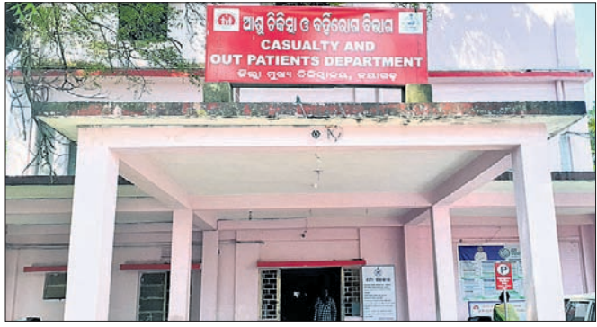
ଜିଲ୍ଲା ମୁଖ୍ୟ ଚିକିତ୍ସାଳୟ।

ପ୍ରକାଶ ଯେ, ଜିଲ୍ଲାରେ ଜିଲ୍ଲା ମୁଖ୍ୟ ଚିକିତ୍ସାଳୟ ସମେତ ରଣପୁର ମେଡିକାଲ, ୧୨ ଗୋଷ୍ଠୀ ସ୍ୱାସ୍ଥ୍ୟ କେନ୍ଦ୍ର (ସିଏସ୍‌ସି) ଓ ୩୭ ପ୍ରାଥମିକ ସ୍ୱାସ୍ଥ୍ୟ କେନ୍ଦ୍ର (ସିଏସ୍‌ସି) ଅଛି। ୫୧ ମେଡିକାଲରେ ୧୯୬୬ ଜଣ ଡାକ୍ତର ଆବଶ୍ୟକ ଥିବାବେଳେ ଅଛନ୍ତି ମାତ୍ର ୯୦ ଜଣ ଡାକ୍ତର । ୧୦୬ ଡାକ୍ତର ପଦବୀ ଖାଲି ପଢ଼ିଛି। ନିମ୍ନଲିଖିତ ହୋଇଥିବା ୯୦ ଡାକ୍ତରଙ୍କ ମଧ୍ୟରୁ ୨୩ ଜଣ ଡାକ୍ତର ପିଲି କରିବାକୁ ଯାଇଥିବା ସୂଚନା ମିଳିଛି। ସେହିଭଳି ୧୮ ଜଣ ଅବସରପ୍ରାପ୍ତ ଡାକ୍ତରଙ୍କୁ ଠିକା ଭାବେ ନିଯୁକ୍ତ କରାଯାଇଛି। ଜିଲ୍ଲା ମୁଖ୍ୟ ଚିକିତ୍ସାଳୟରେ ସିଡିଏମ୍‌ଏସ୍ ସମେତ ୮ଜଣ ଅଧିକାରୀ ରହିବା ପରିବର୍ତ୍ତେ