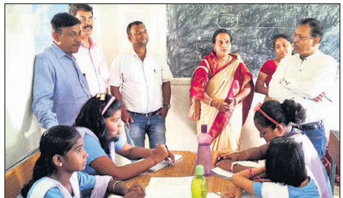
ସଚିବ ବିଦ୍ୟାପୀଠକୁ ପାଠ ପଢ଼ାଇଛନ୍ତି।