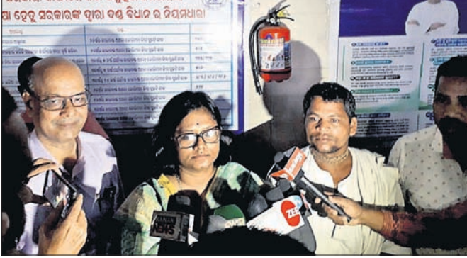
ଜିଲ୍ଲାପାଳ ରୁଚୁ ଖବରଦାତା ସମ୍ମିଳନୀରେ ସୂଚନା ଦେଉଛନ୍ତି।