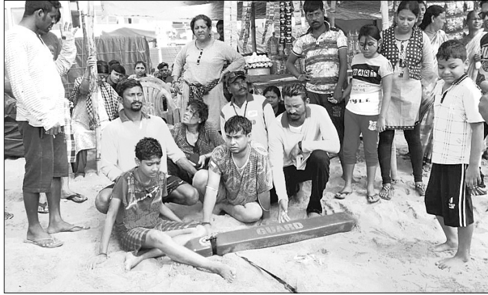
ସମୁଦ୍ରରୁ ଉଦ୍ଧାର ଯୁବକ ଓ ମହିଳା ।