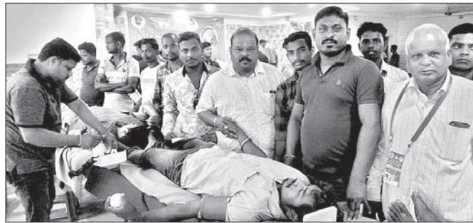
ବଞ୍ଚାଇବାପାଇଁ ଅଧିକାଂଶ ରକ୍ତଦାନ ଶିବିରରେ ରକ୍ତ ସଂଗ୍ରହ କରାଯାଇଛି ।