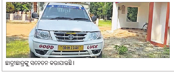
ଛାତ୍ରାଛାତ୍ରୀଙ୍କୁ ସଚେତନ କରାଯାଇଛି।