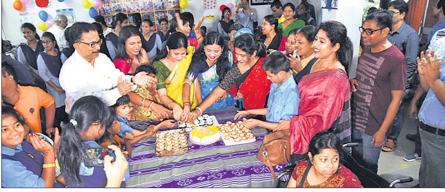
ଓପନ୍ ଲର୍ନିଂ ସିଷ୍ଟମରେ କେନ୍ଦ୍ର କାରି ମୁଖ୍ୟମନ୍ତ୍ରୀଙ୍କ ଜନ୍ମଦିନ ପାଳନ କରାଯାଇଛି।