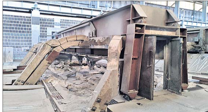
ନାଲିକୋର ବନ୍ଦ ପଡ଼ୁଥିବା ଏକ ପର୍‌।

ଅନୁଗୋଳ ଜିଲ୍ଲାରେ ଥିବା ନବରଙ୍ଗ ପ୍ରାୟ ୧୫୦୦ ଟନ କୋଇଲା ସଙ୍କଟ ଲାଗି ରହିଛି। ଗତ ୭ ସପ୍ତାହ ହେଲା ଡାକ୍ତରୀଭିତ୍ତିତ ମହାନଦୀ କୋଲ୍ ଫିଲ୍‌ଡେସ୍ ଲିମିଟେଡ୍ (ଏନସିଏଲ)ରୁ ଆବଶ୍ୟକ ପରିମାଣର କୋଇଲା ଯୋଗାଣ ହୋଇପାରୁ ନ ଥିବାରୁ ବିଦ୍ୟୁତ୍ ଉତ୍ପାଦନ ସ୍ତାସ ପାଇଛି। ଫଳରେ ପ୍ଲାଷ୍ଟିକ୍ ନିକ୍ଷେପ ବିଦ୍ୟୁତ୍ କେନ୍ଦ୍ର (ସିପିପି)ର ୩ ୟୁନିଟ୍ ସହ ୮୦ଟି ପର୍‌ ବନ୍ଦ ରଖାଯାଇଛି। ତେବେ ପ୍ଲାଷ୍ଟିକ୍ ଚଳାଇବା ପାଇଁ ରାଜ୍ୟ ଗ୍ରାହକ ଚକ୍ରା ଘରରେ ବିଦ୍ୟୁତ୍ ଶକ୍ତି କିଣାଯାଉଥିବା ନାଲିକୋ ପକ୍ଷରୁ ରୁଧିରୀ ପ୍ରୋସ୍ ବିକ୍ରିରେ କୁହାଯାଇଛି। ନାଲିକୋ ପକ୍ଷରୁ ମିଳିଥିବା ସୂଚନା ଅନୁଯାୟୀ, ଅନୁଗୋଳ ସ୍ଥିତ ନିକ୍ଷେପ ବିଦ୍ୟୁତ୍ ଉତ୍ପାଦନ କେନ୍ଦ୍ର (ସିପିପି) ଏବଂ ବାମନଯୋଡ଼ିର ଷ୍ଟ୍ରିଂ ଓ ପାଞ୍ଚାରି ପ୍ଲାଷ୍ଟିକ୍ କାର୍ଯ୍ୟ ପାଇଁ ନାଲିକୋ ସମ୍ପୂର୍ଣ୍ଣ ଭାବେ ଏମ୍‌ସିଏଲ୍