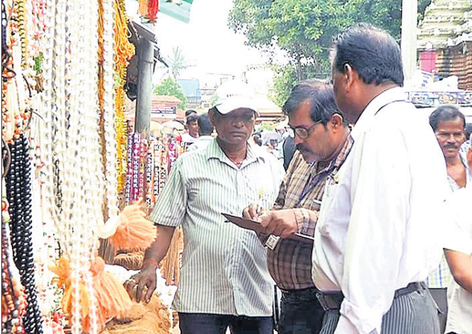
ମିଳିତ ଚିମ୍ ପକ୍ଷରୁ ଲିଙ୍ଗରାଜ ମନ୍ଦିର ପାର୍ଶ୍ୱ ସର୍ଭେ କରାଯାଇଛି ।