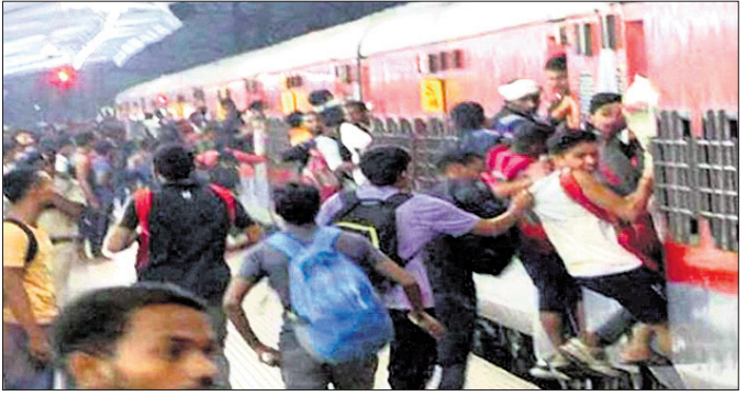
ତ୍ରେନ୍ରେ ଚଢ଼ିବାକୁ ପରୀକ୍ଷାର୍ଥୀଙ୍କ କସରତ ।