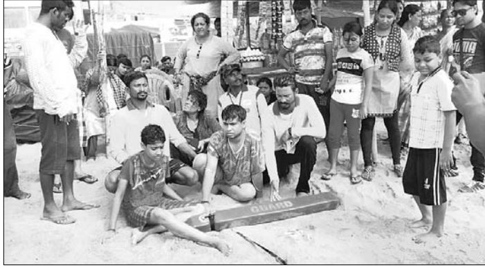
ସମୁଦ୍ରରୁ ଉଦ୍ଧାର ଯୁବକ ଓ ମହିଳା।