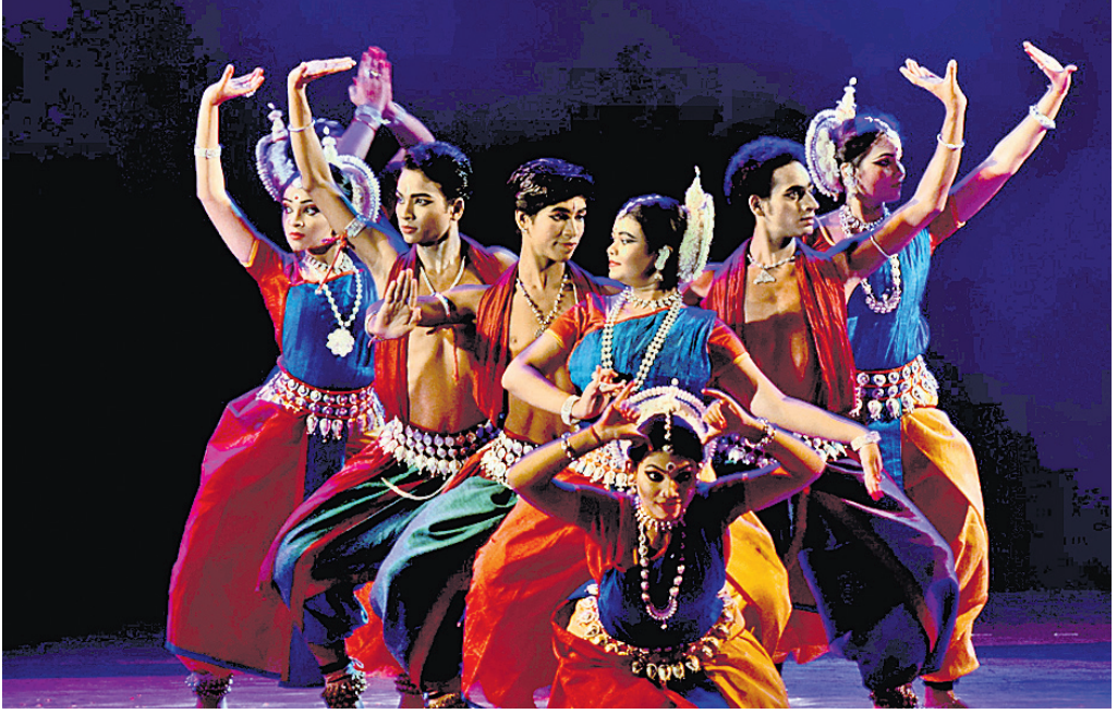
ଭଲ୍ଲ ଡ୍ୟାନ୍ସ ଆଣ୍ଡ ରିସର୍ଚ୍ଚ ଏକାଡେମୀ ପକ୍ଷରୁ ଭୁବନେଶ୍ୱର ରବୀନ୍ଦ୍ରମଣ୍ଡପରେ ବାଲିଅଡ଼ା କୁମାର ଉତ୍ସବରେ କଳାକାରଙ୍କ ଓଡ଼ିଶା ନୃତ୍ୟ ।

ଭାରତୀୟ ରେଳପଥ ନିଷ୍ପତ୍ତି ନେଇଛି। ରୁଧିର 'ହାଉସଫୁଲ୍-୪' ଏହି ଅଭିଯାନ ଆରମ୍ଭ ହୋଇଛି। ଟ୍ରେନଟି ବଡ଼ ସହର ସୁରତ, ଭବାନୀ, କୋଟା ବେଳ ଯାତ୍ରା କରିବ। ଏହାସହ ଟ୍ରେନରେ ଫିଲ୍ମ ପ୍ରମୋଶନ ପାଇଁ ରେଳପଥ ଆଉଁଟିକି ବଡ଼ ପ୍ରୟୋଗ ସଂସ୍ଥା ସହ ଯୋଗାଯୋଗ କରିଛି। ପ୍ରମୋଶନ ଶ୍ରେଣୀରେ ଏହା ଏକ ନିଆରା ମାଧ୍ୟମ। ଏହାଦ୍ୱାରା ଭଲ ରେଳପଥ ଓ ପ୍ରୟୋଗକାରୀ ସଂସ୍ଥା ଲାଭାଣ ଆରମ୍ଭ କରିଛି। ରୁଧିର ଏହି ଚଳଚ୍ଚିତ୍ର କଳାକାର ଓ କେତେଜଣ ରମଣାଧ୍ୟ ପ୍ରତିନିଧି ଭଲ ଟ୍ରେନରେ ଯାତ୍ରା କରିଥିଲେ। ପ୍ରଥମ ଦିନରେ ଟ୍ରେନଟି ପ୍ରମୁଖ ସେକ୍ସନରୁ ଦିଲ୍ଲୀକୁ ଯାତ୍ରା କରିଥିଲା। କଳା, ସଂସ୍କୃତି, ଚଳଚ୍ଚିତ୍ର, ଚିତ୍ରି ସିନିୟଲ ଓ ଖେଳକ୍ରୀଡ଼ା ପ୍ରମୋଶନ