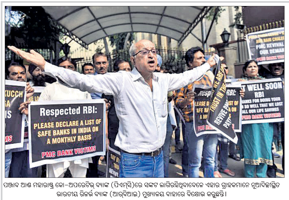
ପଞ୍ଜାବ ଆଞ୍ଚ ମହାରାଷ୍ଟ୍ର କୋ-ଅପରେଟିଭ୍ ବ୍ୟାଙ୍କ (ଏଏଏସ୍)ରେ ସଙ୍କଟ ଲାଗିରହିଥିବାବେଳେ ଏହାର ଗ୍ରାହକମାନେ ନୂଆଦିଲ୍ଲୀସ୍ଥିତ ଭାରତୀୟ ରିଜର୍ଭ ବ୍ୟାଙ୍କ (ଆର୍ଭିଆଇ) ମୁଖ୍ୟାଳୟ ବାହାରେ ବିଶୋଭ କରୁଛନ୍ତି।

ନୂଆଦିଲ୍ଲୀ, ୧୬ ଅକ୍ଟୋବର (ପି.ଟି.): ପୂର୍ବତନ ଅର୍ଥମନ୍ତ୍ରୀ ତଥା ବରିଷ୍ଠ କଂଗ୍ରେସ ନେତା ପି. ଚିନ୍ତାଧରମକୁ ପ୍ରବର୍ତ୍ତନ ନିର୍ଦ୍ଦେଶାଳୟ ପକ୍ଷରୁ ରୁଧିରା ଚିନ୍ତାଧରମକୁ ଗିରଫ କରାଯାଇଛି। ତାଙ୍କୁ ମନିଲକ୍ଷ୍ମୀ ମାମଲାର ଅଧିକ କେରା କରାଯିବ ବୋଲି ଜଣାପଡ଼ିଛି। ପୂର୍ବରୁ ତାଙ୍କୁ ସିଆଇ ଗିରଫ କରିବା ପରେ ସେ ଚିନ୍ତାଧରମକୁ ନେଇ ମଙ୍ଗଳବାର ସକାଳେ ଇଡିର ଚିନ୍ତାଧରମକୁ ଅଧିକାରୀ ସେଠାରେ ପହଞ୍ଚି ଚିନ୍ତାଧରମକୁ ପରୋପଚାର କରିଥିଲେ। ଏଥିସହ କେରା ଲାଗି ଇଡି ୧୪ ଦିନ ପାଇଁ ଚିନ୍ତାଧରମକୁ ବିଚାର ବିଭାଗୀୟ ହାତକୁ ନେବା ଲାଗି ଆବେଦନ କରିଛି। ପୂର୍ବରୁ ଏନେଇ ବହୁବାର ଇଡି ତାଙ୍କୁ କହିଥିଲେ ସୁଦ୍ଧା ଗିରଫ କରି ନ ଥିଲା। ବିଦେଶରେ ଥିବା ଚିନ୍ତାଧରମଙ୍କ ସମ୍ପର୍କିତ ମନିଲକ୍ଷ୍ମୀ ମାମଲାକୁ ନେଇ ଇଡି ଅଧିକ କେରା କରିବା