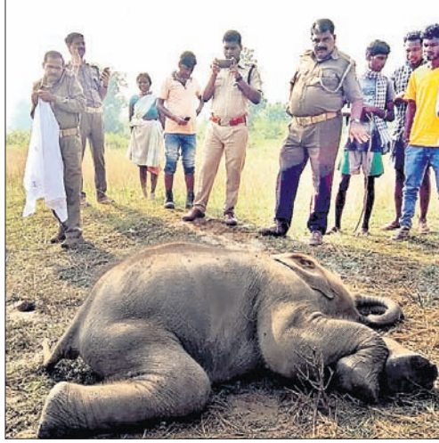
ବନକର୍ମଚାରୀମାନେ ହାତୀ ଶାବକ ମୃତଦେହ ନିରୀକ୍ଷଣ କରୁଛନ୍ତି।

ନୂଆଗାଁ, ୧୭।୧୦ (ଡି.ଏନ୍.ଏ.) ପୁରୀ ଜିଲ୍ଲା ନୂଆଗାଁ ବ୍ଲକ୍ ପ୍ରକାଶ କରନ୍ତୁଛି। ଏକାକୀ ଶାବକ ପ୍ରକାଶ କରନ୍ତୁଛି। ଏକାକୀ ଶାବକ ପ୍ରକାଶ କରନ୍ତୁଛି। ଏକାକୀ ଶାବକ ପ୍ରକାଶ କରନ୍ତୁଛି।