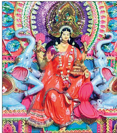
ଗୋଗୁଆ ବଣିକ ସଂଘ