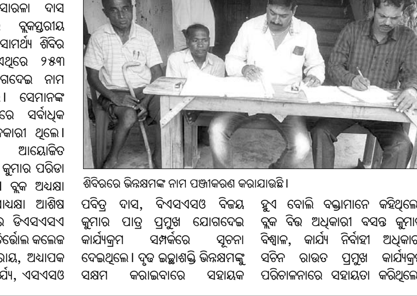
ଶିବିରରେ ଭିନ୍ନକ୍ଷମ ନାମ ପଞ୍ଜୀକରଣ କରାଯାଇଛି।

କୁଳ ପରିଷଦମାନ, କୁଳ ଶିକ୍ଷାଧିକାରୀ କନଭେନ୍ସନ ରହିବା କଥା। ସତ୍ୟ ଭାବେ ନେତୃତ୍ୱାଧୀନ ଅଫିସର, ସହକାରୀ କୁଳ ଶିକ୍ଷା ଅଧିକାରୀ, ବେକନିକାଲ କନସଲଟାଣ୍ଟ, ବିଜେ, ସିଆରସି, ଶିକ୍ଷକ ସମେତ ୨ଟି ସ୍ୱେଚ୍ଛାସେବୀ ଅନୁଷ୍ଠାନର ସଦସ୍ୟ ରହିବା କଥା। ସରକାରଙ୍କ ନିର୍ଦ୍ଦେଶ ଅନୁସାରେ କୁଳ ଶିକ୍ଷାଧିକାରୀଙ୍କ ନିର୍ଦ୍ଦେଶ ଅନୁସାରେ କମିଟି ଗଠନ କରାଯାଇଛି। ଏହି କମିଟି ଗଠନ ପାଇଁ ଲୋକ ବିଦ୍ୟାଳୟ ପରିବେଶ ନିର୍ମଳ ରଖିବା ଓ ପିଲାମାନଙ୍କୁ ସଫାପୁତ୍ରର ହେବାକୁ ନେଇ ଅନୁରୋଧ କରିବା ପାଇଁ କମିଟି ଗଠନ କରିବାକୁ ନିର୍ଦ୍ଦେଶ ଦିଆଯାଇଛି।