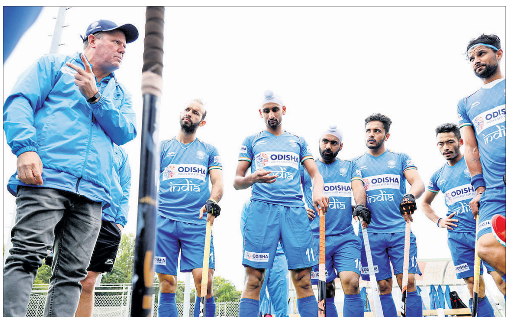
ଖେଳାଳିଙ୍କ ସହ ଭାରତୀୟ ହକି ଦଳର ପ୍ରଶିକ୍ଷକ ଗ୍ରାହ୍ୟା ରିଡ୍ ।

ଭୁବନେଶ୍ୱର, ୧୭।୧୦(କ୍ରୀଡ଼ା ପ୍ରତିନିଧି) ୨୦୨୦ ଟୋକିଓ ଅଲିମ୍ପିକ୍ସ ଯୋଗ୍ୟତା ପାଇଁ ଭାରତୀୟ ହକି ଦଳର ପ୍ରସ୍ତୁତି ଅତି ପର୍ଯ୍ୟାୟରେ ପହଞ୍ଚିଛି। ଗ୍ରୀଷ୍ମ ଋତୁ କଳିଙ୍ଗ ଷ୍ଟାଡ଼ିୟମରେ ଦୁଇଦିନିଆ ଯାତ୍ରା ଆରମ୍ଭ ହୋଇଛି। ଭାରତୀୟ ଦଳର ପ୍ରସ୍ତୁତିରେ କ୍ୟାମ୍ପ ଆରମ୍ଭ ହୋଇଛି। ଭାରତୀୟ ଦଳର ପ୍ରସ୍ତୁତିରେ କ୍ୟାମ୍ପ ଆରମ୍ଭ ହୋଇଛି। ଭାରତୀୟ ଦଳର ପ୍ରସ୍ତୁତିରେ କ୍ୟାମ୍ପ ଆରମ୍ଭ ହୋଇଛି।