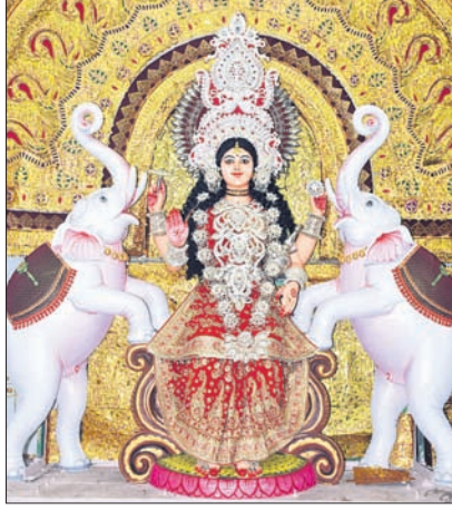
କେନ୍ଦ୍ରାପଡାରେ ମା'ଙ୍କ ଆରାଧନା-ବଳଗଣ୍ଡି ବଜାର