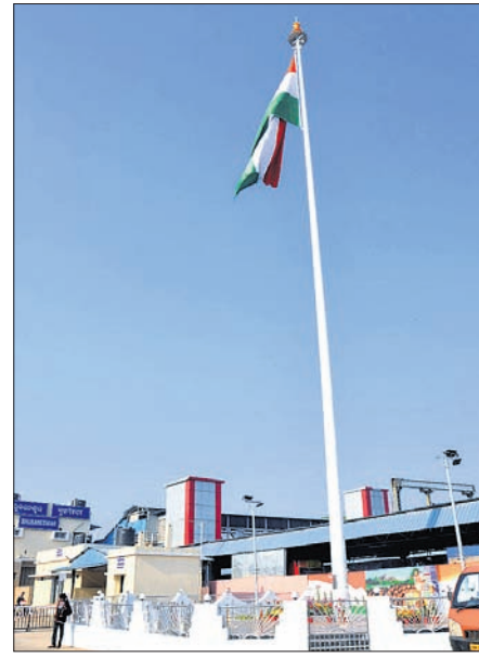
ଷ୍ଟେଶନଗୁଡ଼ିକ ମଧ୍ୟରେ ରହିଛି ଷ୍ଟୋର୍ସ ଓ ରୋଡ଼ ରେଳ ମଣ୍ଡଳର ୧୩ ଷ୍ଟେଶନ,

ଭୁବନେଶ୍ୱର, ୧୭.୧୦ (ବ୍ୟୁରୋ) ଲିଲା ସଦର ମହକୁମା ରେଳ ଷ୍ଟେଶନ, ଏହିଭାବିକ ସ୍ଥାନ ଓ ପର୍ଯ୍ୟଟନ କ୍ଷେତ୍ରର ଗୁରୁତ୍ୱ ବହନ କରୁଥିବା ରେଳ ଷ୍ଟେଶନଗୁଡ଼ିକରେ ଲାଗିବ ମନୁଷ୍ୟଲ (ସ୍ମାରକ) ଜାତୀୟ ପତାକା। ଭାରତୀୟ ରେଳପଥ ନିର୍ଦ୍ଦେଶାଳୟରେ ପୂର୍ବତ ରେଳପଥ ଅନ୍ତର୍ଗତ ଆଉ ୨୭ ବଡ଼ ଷ୍ଟେଶନରେ ଜାତୀୟ ପତାକା ସ୍ମାରକ ଭାବେ ଲାଗାଯିବ। ଏହା ଯାତ୍ରୀଙ୍କ ମଧ୍ୟରେ ଜାତୀୟତାବାଦ ଓ ଦେଶପ୍ରେମ ଭାବନା ଜାଗ୍ରତ କରିବା ସହ ଷ୍ଟେଶନର ଯୌତୁକ ବଢ଼ାଇବ। ଆସନ୍ତା ମାର୍ଚ୍ଚ ୩୦ତ ରେଳ ଷ୍ଟେଶନରେ ତ୍ରିଭଙ୍ଗା ଉଡ଼ାଳିବାକୁ ନିର୍ଦ୍ଦେଶ ଦିଆଯାଇଛି। ପୂର୍ବରୁ ପୂର୍ବତ ରେଳପଥ ଅନ୍ତର୍ଗତ ଭୁବନେଶ୍ୱର ମୁଖ୍ୟ ରେଳ ଷ୍ଟେଶନ ଓ ଆନ୍ଧ୍ରପ୍ରଦେଶର ବିଶାଖାପାଟଣା ଷ୍ଟେଶନରେ ପତାକା ଲାଗାଯାଇଛି। ଏବେ ପ୍ରସ୍ତୁତି