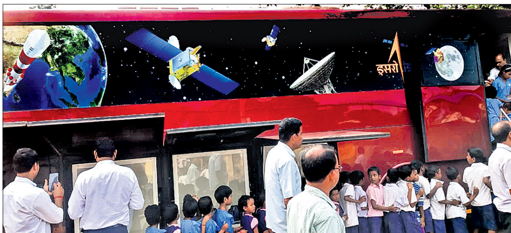
ଇସ୍ତ୍ରୋ ପ୍ରଦର୍ଶନୀ ବସ୍ତରେ ଛାତ୍ରଛାତ୍ରୀଙ୍କୁ ମହାକାଶ ଜ୍ଞାନ ଉପରେ ସଚେତନ କରାଯାଇଛି।

ଅନୁଗୋଳ ଅଧିକ, ୧୭।୧୦ ଅଭିଭାବକ ସମିତିଙ୍କ ମହାକାଶ ଗବେଷଣା ସଂସ୍ଥା (ଇସ୍ତ୍ରୋ) ପକ୍ଷରୁ ଅନୁଗୋଳବାସୀଙ୍କୁ ମହାକାଶ ମିଶନ ଯାନ ଓ ଜ୍ଞାନ ଉପରେ ସଚେତନ କରାଯାଇଛି।