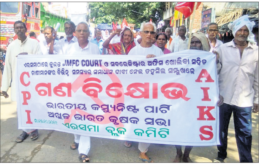
ସିପିଆଇ ପକ୍ଷରୁ ଅନୁଷ୍ଠିତ ଶୋଭାଯାତ୍ରା।