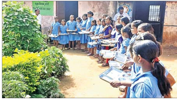
ଉପାହାରେ ଥିବା ପିଲାମାନେ ।