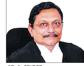
ଏସ୍.ଏ. ସି. ବି. କୋର୍ଟେ

ନୂଆଦିଲ୍ଲୀ, ୧୮.୧୦ (ପି.ଟି./ଆଇଏଏନଏ) ସୁପ୍ରିମକୋର୍ଟେ ଦ୍ୱିତୀୟ ସର୍ବୋଚ୍ଚ ବିଚାରପତି ଏସ୍.ଏ. ବି. କୋର୍ଟେ ଭାରତର ପରବର୍ତ୍ତୀ ପ୍ରଧାନ ବିଚାରପତି (ସିଜେଆଇ) ହେବାକୁ ଯାଉଛନ୍ତି। ସିଜେଆଇ ରଞ୍ଜନ ଗୋଗୋଇ ଶୁକ୍ରବାର କେନ୍ଦ୍ର ଆଇନ ଓ ନ୍ୟାୟ ମନ୍ତ୍ରଣାଳୟକୁ ପତ୍ର ଲେଖି ଜଷ୍ଟିସ୍ ବୋର୍ଡ଼େ ଡାକ ଉତ୍ତରାଧିକାରୀ ଭାବେ ନିଯୁକ୍ତି ଦେବା ଲାଗି ପୁସାରିସ କରିଛନ୍ତି। ଦେଶର ୪୬ତମ ପ୍ରଧାନ ବିଚାରପତି ଭାବେ ୨୦୧୮ ଅକ୍ଟୋବର ୩ରେ ଶପଥ ନେଇଥିବା ଜଷ୍ଟିସ୍ ଗୋଗୋଇ ନଭେମ୍ବର ୧୭ରେ ଅବସର ଗ୍ରହଣ କରିବେ। ସାଧାରଣତଃ ପ୍ରଧାନ ବିଚାରପତି ଅବସର ନେବା ପୃଷ୍ଠା-୪