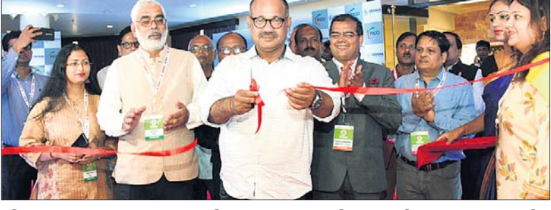
ଓଡ଼ିଶା ଗ୍ରାଭେଲ ବଜାର ଆରମ୍ଭକ୍ରମରେ ଖୋଲିଥିବା ଷ୍ଟଲ୍ ପ୍ରଦାନ କରାଯାଇଛି

ରାଜ୍ୟ ପର୍ଯ୍ୟଟନ ବିଭାଗ ପକ୍ଷରୁ ପିକ୍ ଏସ୍ ପ୍ରଦାନରେ ଭୁବନେଶ୍ୱରରେ ୩୫ ଥର ପାଇଁ ଚାଲିଥିବା ଓଡ଼ିଶା ଗ୍ରାଭେଲ ବଜାର ଆରମ୍ଭ କରାଯାଇଛି