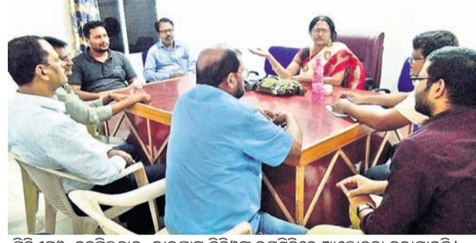
ସିଡିଏମ୍ୱି, ଚନ୍ଦ୍ରଶେଖର, ଭାରତୀୟ ବିଡିଏଲ୍ ଉପସ୍ଥିତିରେ ଆଲୋଚନା କରାଯାଇଛି।