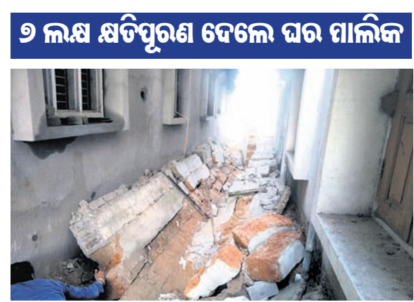
ଭୁଞ୍ଜିତ ପଡ଼ିଥିବା ପାଟେରି ।

ବଅଁରପାଳ, ୧୯୧୦ (ଡି.ଏନ.ଏ.) ଘରୋଇ ପାଇପ୍ କାମ କରୁଥିବା ବେଳେ ଶନିବାର ଏକ ପାଟେରି ଭୁଞ୍ଜିତ ୨ ଶ୍ରମିକଙ୍କ ମୃତ୍ୟୁ ହୋଇଛି। ଘଟଣା ଘଟିଛି ଅନୁଗୋଳ ଜିଲ୍ଲା ବଅଁରପାଳ ଥାନା ରଣେଶ ବଜାରରେ।