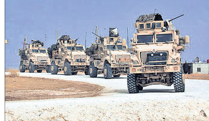
ଭଉଁର ସିରିଆ ସୀମା ତାଳ ଚମକରେ ଆମେରିକା ସେନାର ସୁକ୍ଷ୍ମାଡ଼ି ଅଟକିରହିଛି।