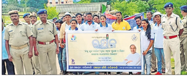
ସଚେତନ ଶୋଭାଯାତ୍ରାରେ ପୋଲିସ୍ ଏବଂ ବିଜୁ ମୁକବାହିନୀ ସଦସ୍ୟ।