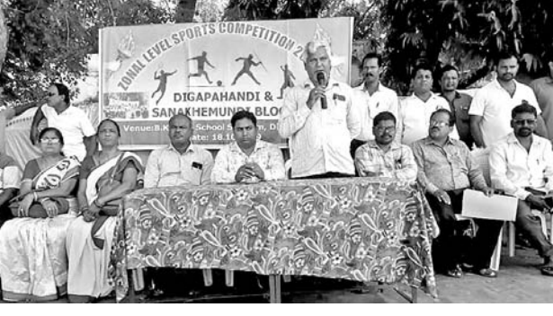
ଉଦ୍ଘାଟନୀ ସଭାରେ ମୁଖ୍ୟ ଅତିଥି ଉଦ୍ଘାଟନା ଦେଉଛନ୍ତି ।

ଉଦ୍ଘାଟନୀ ସଭାରେ ମୁଖ୍ୟ ଅତିଥି ଉଦ୍ଘାଟନା ଦେଉଛନ୍ତି । ପ୍ରତିଯୋଗିତାରେ ଆସିକା ଏନ୍.ଏସି କ୍ଲବ୍ ପକ୍ଷରୁ ୨୫ଟି ବିଦ୍ୟାଳୟର ଛାତ୍ରଛାତ୍ରୀ ଅଂଶ ଗ୍ରହଣ କରିଥିଲେ । ପ୍ରତିଯୋଗିତାରେ ଆସିକା ଏନ୍.ଏସି କ୍ଲବ୍ ପକ୍ଷରୁ ୨୫ଟି ବିଦ୍ୟାଳୟର ଛାତ୍ରଛାତ୍ରୀ ଅଂଶ ଗ୍ରହଣ କରିଥିଲେ । ପ୍ରତିଯୋଗିତାରେ ଆସିକା ଏନ୍.ଏସି କ୍ଲବ୍ ପକ୍ଷରୁ ୨୫ଟି ବିଦ୍ୟାଳୟର ଛାତ୍ରଛାତ୍ରୀ ଅଂଶ ଗ୍ରହଣ କରିଥିଲେ । ପ୍ରତିଯୋଗିତାରେ ଆସିକା ଏନ୍.ଏସି କ୍ଲବ୍ ପକ୍ଷରୁ ୨୫ଟି ବିଦ୍ୟାଳୟର ଛାତ୍ରଛାତ୍ରୀ ଅଂଶ ଗ୍ରହଣ କରିଥିଲେ ।