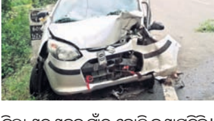
ଜିଲା ଶରଣକୁ ଗାଁର ବୋଲି ଜଣାପଡ଼ିଛି। କାର୍ଟି ବୁଲୁଥିବା ସମୟରେ ପିଲରରେ ଘଟଣା ଘଟିଥିଲା।