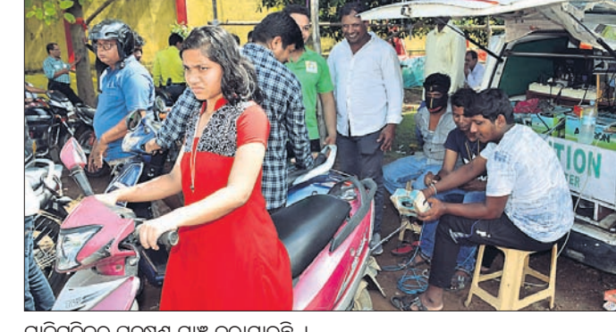
ଗାଡ଼ିଚାଳନା ପ୍ରଦୃଷଣ ସାଥ୍ କରାଯାଇଛି।