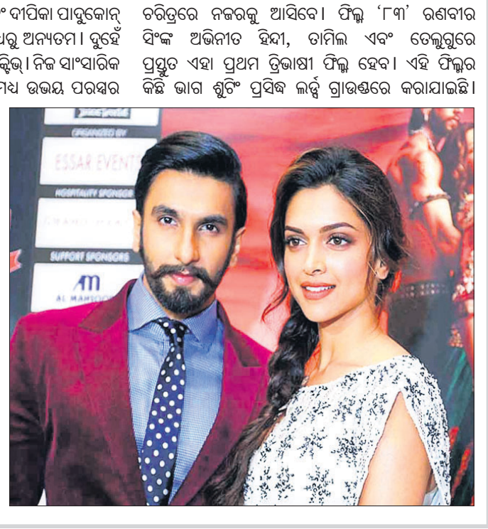
ଚଳଚ୍ଚିତ୍ରରେ ନଜରକୁ ଆସିବେ। ଫିଲ୍ମ '୮୩' ରଣବୀର ସିଂଙ୍କ ଅଭିନୀତ ହିନ୍ଦୀ, ତାମିଲ ଏବଂ ତେଲୁଗୁରେ ପ୍ରସ୍ତୁତ ଏହା ପ୍ରଥମ ଟ୍ରିଲିଙ୍ଗୁଆ ଫିଲ୍ମ ହେବ। ଏହି ଫିଲ୍ମର କିଛି ଭାଗ ଶୁଟିଂ ପ୍ରସିଦ୍ଧ ଲକ୍ଷ୍ମୀ ଗ୍ରାଉଣ୍ଡରେ କରାଯାଇଛି।

ମୁମ୍ବାଇ: ଅଭିନେତା ରଣବୀର ସିଂ ଏବଂ ଦୀପିକା ପାଲୁକୋନ୍ ବଲିଉଡ଼ର ସବୁଠାରୁ ଚର୍ଚ୍ଚିତ ଦମ୍ପତିଙ୍କ ମଧ୍ୟରୁ ଅନ୍ୟତମ। ଦୁହେଁ ସୋସିଆଲ ମିଡ଼ିଆରେ ମଧ୍ୟ ବେଶ୍ ଆକ୍ଟିଭ୍। ନିଜ ସାଂସାରିକ ଜଞ୍ଜାଳରେ ଯେତେ ବ୍ୟସ୍ତ ରହିଲେ ମଧ୍ୟ ଉଭୟ ପରସ୍ପର ପାଇଁ ସମୟ ବାହାର କରିଦେଇଥାନ୍ତି। ବର୍ତ୍ତମାନ ଦୀପିକାଙ୍କଠାରୁ ଚାଇମ୍ ମ୍ୟାନେଜମେଣ୍ଟ୍ ଶିଖୁଛନ୍ତି ରଣବୀର। ତାଙ୍କ ମତରେ ଦୀପିକା ଚାଇମ୍ ମ୍ୟାନେଜମେଣ୍ଟ୍ କରିବାର ସିଦ୍ଧହସ୍ତୀ। ସେ ମୋ ଜୀବନରେ ଆସିବା ପରେ ବହୁତ କିଛି ଶିଖିବାକୁ ମିଳିଛି ବୋଲି ସେ କହିଛନ୍ତି। ବିବାହ ପରେ ପ୍ରଥମଥର ପାଇଁ ଦୁହେଁ '୮୩' ଫିଲ୍ମରେ ଏକତ୍ର ନଜରକୁ ଆସିବେ। ଫିଲ୍ମଟି ୧୯୮୩ ବିଶ୍ଵକପ୍ ଉପରେ ଆଧାରିତ। ନିକଟରେ ଏହି ଚଳଚ୍ଚିତ୍ରର ଶୁଟିଂ ଶେଷ ହୋଇଯାଇଛି। କବିର ଖାନ୍ଙ୍କ ନିର୍ଦ୍ଦେଶିତ ଏହି ଫିଲ୍ମରେ ରଣବୀର ସିଂ ଭାରତୀୟ କ୍ରିକେଟ ଟିମର ପୂର୍ବତନ ଅଧିନାୟକ କପିଳ ଦେବଙ୍କ