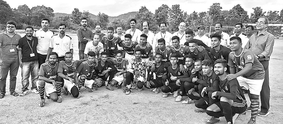
କଳିଙ୍ଗା ଓ ଭଞ୍ଜନଗର ମ୍ୟାଚ୍ ପୂର୍ବରୁ ଅତିଥି ଗହଣରେ ଖେଳାଳିମାନେ ।