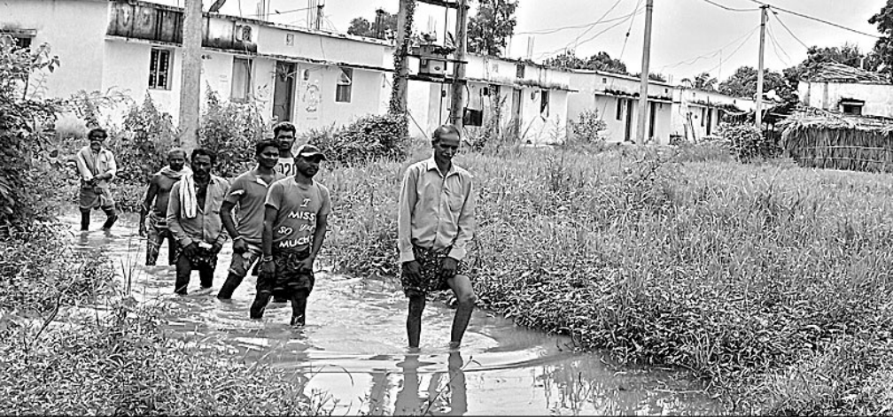
ରାସ୍ତାରେ ଜମା ହୋଇଥିବା ପାଣି ମଧ୍ୟରେ ଯାତାୟତ କରୁଛନ୍ତି କଲୋନୀ ବାସିନ୍ଦା ।

କିଛିବର୍ଷ ହେଲା ଗଞ୍ଜାମ ଜିଲ୍ଲା ଏକାଧିକ ସାମୁଦ୍ରିକ ଝଡ଼ର ସାମ୍ନା କରିଛି । ଏହାର ପ୍ରଭାବରେ ଘରଘର ଭାଙ୍ଗିବା ସହ ସ୍ଥାନୀୟ ଲୋକଙ୍କ ଜୀବନ ଜୀବିକା ପ୍ରଭାବିତ ହୋଇଛି । ବହୁ ଧନଜୀବନ ମଧ୍ୟ ହାନୀ ଘଟିଛି । ବେଶି ପ୍ରଭାବିତ ହୋଇଛନ୍ତି ସମୁଦ୍ର ଉପକୂଳବର୍ତ୍ତୀ ଲୋକେ । ସେମାନଙ୍କ ସୁରକ୍ଷା ପାଇଁ ବିଶ୍ୱବ୍ୟାପକ ସହାୟତାରେ ଗଞ୍ଜାମ ଜିଲ୍ଲା ପ୍ରଶାସନ ପକ୍ଷରୁ ସମୁଦ୍ର ଠାରୁ ପାଞ୍ଚ କିମି ପରିସର ମଧ୍ୟରେ ଥିବା ଗ୍ରାମବାସୀଙ୍କ ପାଇଁ ବାତ୍ୟା ନିରୋଧକ ଗୃହ (ଓଡ଼ିଆରପି) ନିର୍ମାଣ କରାଯାଇଥିଲା । ସେଠାରେ ରହିବା ପାଇଁ ପ୍ରଶାସନ ପକ୍ଷରୁ ଆନୁସଙ୍ଗିକ ବ୍ୟବସ୍ଥା ମଧ୍ୟ କରାଯାଇଛି । କିନ୍ତୁ କେତେକ ଅଞ୍ଚଳ ବର୍ତ୍ତମାନ ସୁଦ୍ଧା ପ୍ରଶାସନର ଦୃଷ୍ଟି ଆନୁସଙ୍ଗିକ ରହିଯାଇଛି । କେତେକ ଓଡ଼ିଆରପି କଲୋନୀ ବାସିନ୍ଦା ମୌଳିକ ସୁବିଧା ସୁଯୋଗରୁ ଏବେବି ବଞ୍ଚିତ । ଫଳରେ କଲୋନୀବାସୀଙ୍କ ବିଭିନ୍ନ ସମସ୍ୟାରେ ଘାଣ୍ଟିହୋଇ ଦୁର୍ଦ୍ଦଶାରେ ଜୀବନ ଅତିବାହିତ କରୁଛନ୍ତି । ଏହି ସମସ୍ୟା ନେଇ ପ୍ରଶାସନକୁ ବାରମ୍ବାର ହୁହାରି କଲେ ମଧ୍ୟ ହିତାଧିକାରୀ କୌଣସି ସୁଫଳ ପାଇପାରୁନାହାନ୍ତି । ଏଭଳି