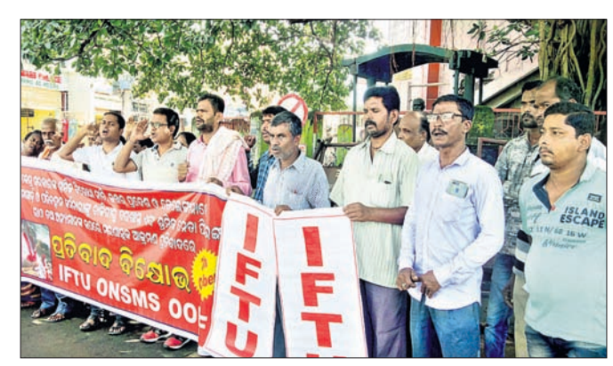
ବିଭିନ୍ନ ଶ୍ରମିକ ସଂଗଠନ ପକ୍ଷରୁ ବିଶୋଭ ପ୍ରଦର୍ଶନ କରାଯାଉଛି ।

ହୋଇ ଲକ୍ଷ ଲକ୍ଷ ସଂଖ୍ୟାରେ ଶ୍ରମିକ ଏବଂ କର୍ମଚାରୀ ଛଡ଼େଇ ହେଉଛନ୍ତି । ମୋଦି ସରକାର କାତାୟ ସମ୍ପତ୍ତି ରୂପେ ପରିଚିତ ବ୍ୟାଙ୍କ, ରେଳ, ବିମାନ ବନ୍ଦର ଓ ପ୍ରତିରକ୍ଷା ଉତ୍ପାଦନ ଆଦି କ୍ଷେତ୍ରକୁ ଦେଖା ବିଦେଶୀ କର୍ପୋରେସନଙ୍କୁ ଚେକି ଦେବାକୁ ଯୋଚାଇକରଣ ଆରମ୍ଭ କରିଥିବା ବେଳେ ଶ୍ରମ ସଂଘର ନିଜେ ଶ୍ରମିକମାନଙ୍କ କଷ୍ଟାନ୍ତ ଶ୍ରମ ଅଧିକାରକୁ ଦୁର୍ବଳ କରିବାକୁ ଶ୍ରମ ଆଇନକୁ ଉଲ୍ଲେବ କରିବାକୁ ଉଦ୍ୟମ ଆରମ୍ଭ କରିଛନ୍ତି । କେନ୍ଦ୍ର ସରକାରଙ୍କ ପଦାଳ ଅନୁସରଣ କରି ବିଭିନ୍ନ ରାଜ୍ୟର ସରକାରମାନେ ଇତିମଧ୍ୟରେ ଶ୍ରମିକ ଏବଂ କର୍ମଚାରୀଙ୍କ ଉପରେ ଆକ୍ରମଣ କରୁଛନ୍ତି । ନିକଟରେ ଭାଜପା ଶାସିତ ଉତ୍ତର ପ୍ରଦେଶ ସରକାର ଅର୍ଥାଭାବ ଆକଳରେ ସେଠାକାର ଗୃହ ବିଭାଗରେ କାର୍ଯ୍ୟରେ ୨୫ ହଜାର ହୋମରାଟ୍‌କୁ ଚାକିରିରୁ ଛଡ଼େଇ କରିଛନ୍ତି । ସେହିଭଳି ତେଲଙ୍ଗାନାର କେସିଆର ସରକାର ସେଠାକାର ରାଜ୍ୟ ପରିବହନ ନିଗମରେ କାର୍ଯ୍ୟରେ ୪୮ ହଜାର କର୍ମଚାରୀଙ୍କୁ ଅତ୍ୟନ୍ତ ଅଗଣତାନ୍ତ୍ରିକ