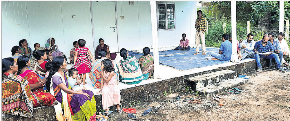
ସୁଲୁମାହାରେ ପଲ୍ଲିସଭାରେ ଯୋଗଦେବାକୁ ଗ୍ରାମବାସୀ ପହଞ୍ଚିନଥିଲେ।