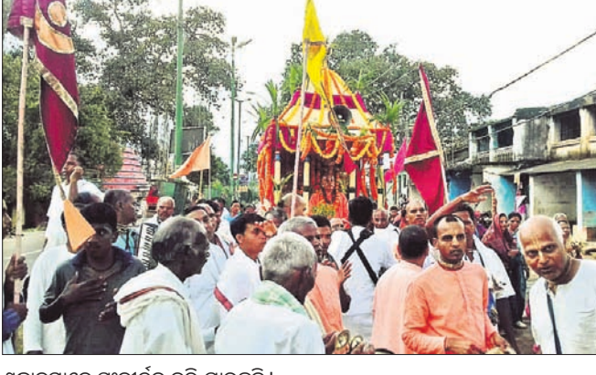
ଶ୍ରୀକାନ୍ତମାନେ ସଂକୀର୍ତ୍ତନ କରି ଯାଉଛନ୍ତି।