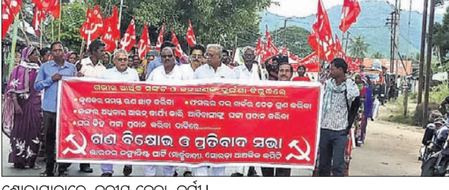
ଶୋଭାଯାତ୍ରାରେ ଦକାୟ ନେତା, କର୍ମୀ।