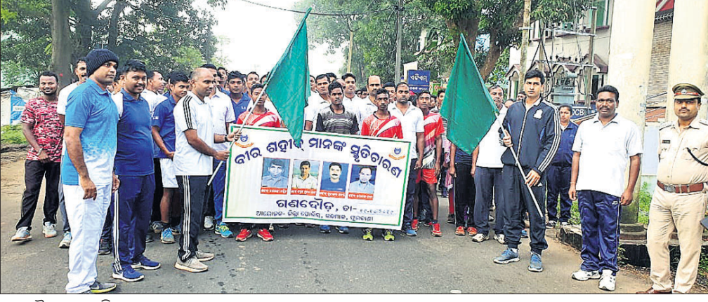
ଗଣଦୌଡ଼ରେ ଉପସ୍ଥିତ ମୁକବାହିନୀ, ମୁକବାହିନୀ।