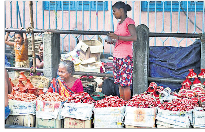
ଦାପାବଳି ପୂର୍ବରୁ କୋଲକାତା ରାସ୍ତାକଡ଼ରେ ଗ୍ରାହକଙ୍କ ଅପେକ୍ଷାରେ ଜଣେ ଦାପ ଦିକାରି

ହେବାକୁ ଥିଲା। ତେବେ କେତେକ ପ୍ରସଙ୍ଗରେ ବୁଲି ଦେଖି ସହମତି ହୋଇ ନ ଥିବାରୁ ପଞ୍ଜାବର ଆରମ୍ଭ ହୋଇପାରି ନାହିଁ। ମୁଖ୍ୟତଃ ପ୍ରତି ତୀର୍ଥଯାତ୍ରୀଙ୍କ ଉପରେ ଲଦ୍‌କାମାଦାବ ୨୦ ଡଲାର ସେବା ବିକସ ଧାର୍ଯ୍ୟ କରିଥିବାରୁ ଏହାକୁ ନୂଆଦିଲ୍ଲୀ ବିରୋଧ କରୁଛି।