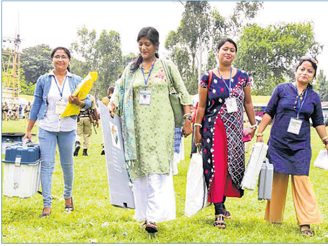
ପୋଲି ଅଫିସରମାନେ ଲଭିଏମ୍ ଓ ଅନ୍ୟ ଉପକରଣ ଧରି ସୋନିପଡ଼ ଭୋଟ କେନ୍ଦ୍ରକୁ ଯାଉଛନ୍ତି।

୨୮୮ ଆସନ ବିଶିଷ୍ଟ ମହାରାଷ୍ଟ୍ର ବିଧାନସଭା ଓ ୯୦ ଆସନ ବିଶିଷ୍ଟ ହରିୟାଣା ବିଧାନସଭା ନିର୍ବାଚନ ଲାଗି ଭୋଟଗ୍ରହଣ ସୋମବାର ସକାଳ ୭ଟି ଆରମ୍ଭ ହୋଇ ସନ୍ଧ୍ୟା ୬ଟା ପର୍ଯ୍ୟନ୍ତ ଚାଲିବ। ଉଭୟ ରାଜ୍ୟରେ ଭାଜପା ପୁନର୍ବାର କ୍ଷମତା ଦଖଲ କରିବାକୁ ଉଦ୍ୟମ କରି ରଖିଛି। ମହାରାଷ୍ଟ୍ର ବିଧାନସଭାକୁ ନିର୍ବାଚିତ ହେବା ଲାଗି ପ୍ରତିଯୋଗିତାରେ ୨୩୫ ମହିଳାଙ୍କ ସମେତ ୩୨୩୭ ପ୍ରାର୍ଥୀ ଅବତୀର୍ଣ୍ଣ ହୋଇଛନ୍ତି।