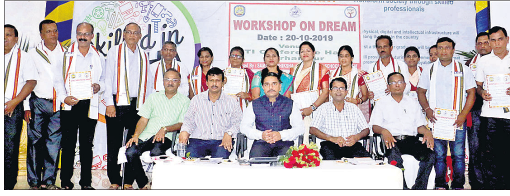
କର୍ମଶାଳାରେ ଜିଲ୍ଲାପାଳଙ୍କ ସମେତ ଶିକ୍ଷୟିତ୍ରୀ ଓ ଶିକ୍ଷକମାନେ।