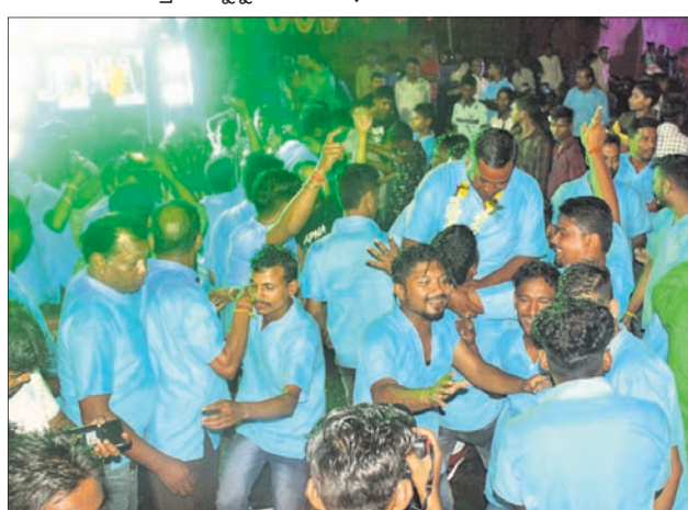
ଭସାଣିରେ ଉତ୍ସାହରେ ହେମସୁରପତା ପୂଜା କମିଟି ସଦସ୍ୟମାନେ।