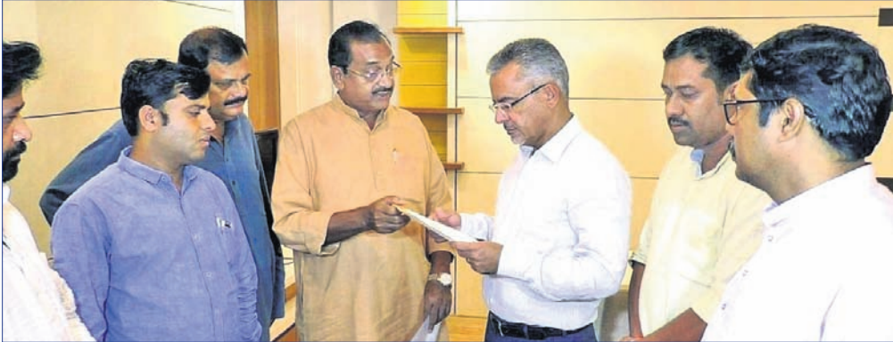
ଭାଜପା ପ୍ରତିନିଧିମାନେ ଗୃହ ସଚିବଙ୍କୁ ଭେଟି ଦାବିପତ୍ର ପ୍ରଦାନ କରୁଛନ୍ତି।