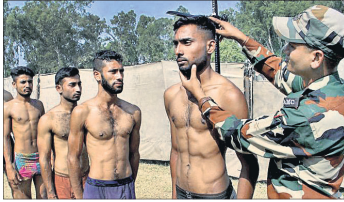
କଳ୍ପ ନିକଟସ୍ଥ ବାର ବ୍ରାହ୍ମଣଗଣଙ୍କୁ ସେନା ନିୟୁକ୍ତି ରାଜିତରେ ପରାସ୍ତାଧୀନ ଶାରୀରିକ ଯୋଗ୍ୟତା ଯାଞ୍ଚ କରାଯାଇଛି।

ନୂଆଦିଲ୍ଲୀ, ୨୩।୧୦(ପି.ଟି.)- ୩ ହିନ୍ଦୁଙ୍କ ମୃତ୍ୟୁର ଆତଙ୍କବାଦୀଙ୍କୁ ଧରାଗଲା ୩୦ ଲକ୍ଷ ଟଙ୍କା ପୁରସ୍କାର ଦିଆଯିବ ବୋଲି ରାଜ୍ୟ ସରକାର କହିଛନ୍ତି।