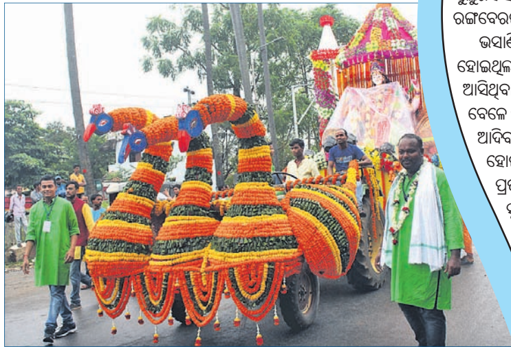
ବସ୍ତ୍ରାଣ୍ଡ ଲକ୍ଷ୍ମୀଙ୍କ ନେତୃ।