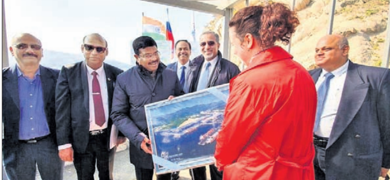
ରୁଷିଆରେ କେନ୍ଦ୍ରମନ୍ତ୍ରୀ ଧର୍ମେନ୍ଦ୍ର ପ୍ରଧାନ ଓ ଅନ୍ୟମାନେ।

କେନ୍ଦ୍ରମନ୍ତ୍ରୀ ଧର୍ମେନ୍ଦ୍ର ପ୍ରଧାନ ଓ ଓଡ଼ିଶା ମଧ୍ୟରେ ସିଧା ବାଣିଜ୍ୟିକ ସମ୍ପର୍କର ପଥ ପରିଷ୍କାର କରିବାକୁ ପଦକ୍ଷେପ ନେଇଛନ୍ତି। ରୁଷିଆ ଭୂମିତ୍ୟାଗ୍ରାହକ ଏବଂ ପାରାଦୀପ ସହର ଉଭୟ ଭଲ ସହଯୋଗୀ ବନ୍ଧୁ ହୋଇପାରିବେ।