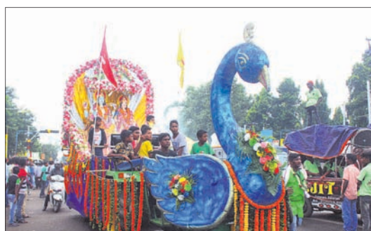
ଭସାଣି ଶୋଭାଯାତ୍ରାରେ ହୁଲୁରିସିଂହା ନେତୃ।