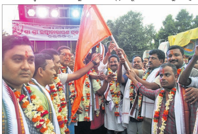
ଏଡ଼ିପିଓ ମେଳଣ ଉତ୍ସବକୁ ଉଦ୍‌ଘାଟନ କରୁଛନ୍ତି।