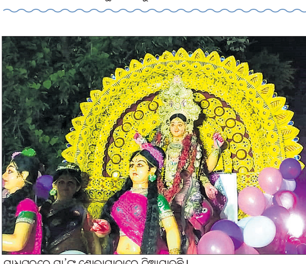
ମାଧପୁରରେ ମା'ଙ୍କୁ ଶୋଭାଯାତ୍ରାରେ ନିଆଯାଉଛି।