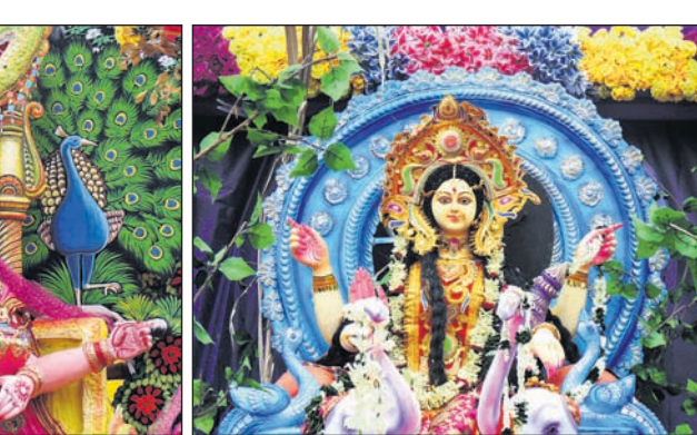
ପାଲଲହଡ଼ାରେ ମା'ଙ୍କୁ ଭସାଣି ଶୋଭାଯାତ୍ରାରେ ନିଆଯାଉଛି।