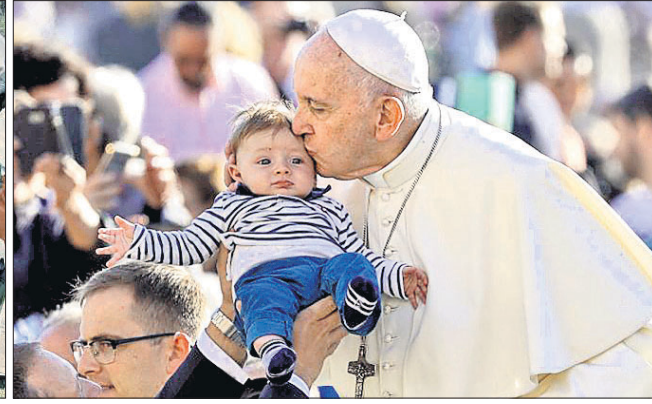
ଭାତିକାନ୍ଦ ସିଟିର ପିଟର୍ ସେଣ୍ଟରରେ ଏକ ଶିଶୁକୁ ସ୍ତନ ଦେଉଛନ୍ତି କ୍ୟାଥୋଲିକ୍ ଧର୍ମଗୁରୁ ପୋପ ଫ୍ରାନ୍ସିସ୍।