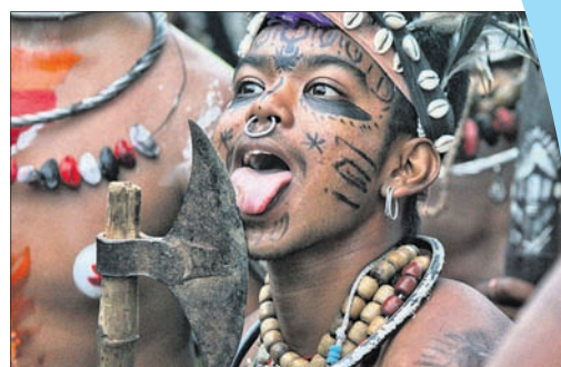
ବସ୍ତ୍ରାଣ୍ଡ ପୂଜା କମିଟି ଭସାଣିକୁ ଆସିଥିବା ଆଦିବାସୀ କଳାକାର।