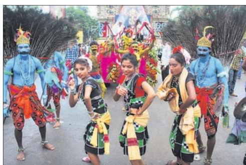
କଳାକାରମାନେ ଶବ୍ଦ ନୃତ୍ୟ ପରିବେଷଣ କରୁଛନ୍ତି।