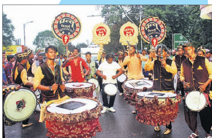
ଛତିଶଗଡ଼ରୁ ଆସିଥିବା ଧୂମଧାମ।