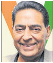
ସେମାନଙ୍କୁ ନିଯୁକ୍ତ କରାଯାଇଛି।

ନୂଆଦିଲ୍ଲୀ, ୨୩।୧୦(ପି.ଟି.)-ସୁଭାଷ ଚୋପ୍ରାଙ୍କୁ ରୂପବାର ଦିଲ୍ଲୀ ପ୍ରଦେଶ କଂଗ୍ରେସ କମିଟି (ଡିପିସିସି) ସଭାପତି ନିଯୁକ୍ତ କରାଯାଇଛି।