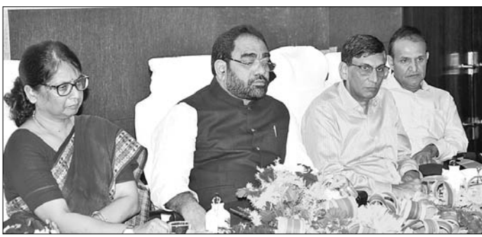
ଅରଣ୍ୟ ଭବନରେ ବନଖଣ୍ଡ ଅଧିକାରୀ ସମ୍ମିଳନୀରେ ମନ୍ତ୍ରୀ ଓ ଅଧିକାରୀଗଣ।