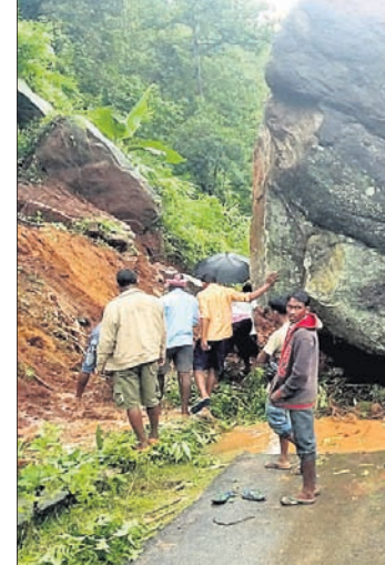
ଗାସ୍ତାରେ ପଡି ରହିଥିବା ପଥର। କାନି ପ୍ରମୁଖ ଘଟଣାସ୍ଥଳରେ ପହଞ୍ଚି ପକ୍ଷରୁ ବୁଲାଇବା ପାଇଁ ପ୍ରୟାସ କରାଯାଇଛି।

ଭୁବନେଶ୍ୱର, ୨୪।୧୦ (ବ୍ୟୁରୋ) ଉତ୍କଳ ବିଶ୍ୱବିଦ୍ୟାଳୟର ସିଡିଏଲ୍ ହଲ୍ରେ ଗୁରୁବାର ସନ୍ଧ୍ୟାରେ ଭୟାବହ ଅଗ୍ନିକାଣ୍ଡ ଘଟିଛି।