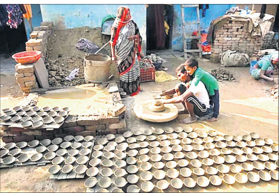
ଓଗାଳପୁର ଗାଁରେ ଜଣେ କୁସାରୀ ମାଟିଦୀପ ତିଆରି କରୁଛନ୍ତି ।

ଦୀପାବଳିରେ ମାଟି ଦୀପର ଚାହିଦା ନିଆରା । ଲୋକେ ବିଭିନ୍ନ ରଙ୍ଗବେରଙ୍ଗ ଦୀପ କିଣି ଘର ଆଗରେ ଏହାକୁ ଜଳାଇ ଉତ୍ସବ ମନାଇଥାନ୍ତି । ବର୍ତ୍ତମାନ ଗ୍ରାହକଙ୍କୁ ଆକୃଷ୍ଟ କରିବା ଲାଗି ହାତବଳୀରେ ବିଭିନ୍ନ ଡିଜାଇନ ଓ ରଙ୍ଗର ଫ୍ୟାନ୍ସି ଦୀପ ବିକ୍ରି ହେଉଛି । କଲିକତା ଭଳି ବିଭିନ୍ନ ସ୍ଥାନରୁ ଏସବୁ ଦୀପ ଆଣି ବିକ୍ରି କରାଯାଉଛି । ମାଟିପାତ୍ରର ଆଦର କମିବା ପରେ ବିଭିନ୍ନ ଗାଁଗଣାରେ ଥିବା କୁସାରଣାକ ନୀରବି ଗଲାଣି । ଦିନକୁ ଦିନ ଜାବିକା ହରାଇବାକୁ ବସିଲେଣି କୁସାରୀ । ପାରମ୍ପରିକ ମାଟିଦୀପ ସ୍ଥାନରେ ଏବେ କଲିକତା ଅଞ୍ଚଳର ଫ୍ୟାନ୍ସି ଦୀପ ଚାହିଦା ବଢ଼ିବାରେ ଲାଗିଛି । ଫଳରେ ଚିତ୍ତାରେ ରହିଛି କୁସାରୀଙ୍କ ପରିବାର । ଦୀପାବଳି ଆସିଲେ ମନେପଡ଼େ ଭଦ୍ରକ ଜିଲାର କୁସାରୀଙ୍କ ଗାଁ ଓଗାଳପୁର । ପ୍ରତିବର୍ଷ ପରିଚଳିତ ବର୍ଷ ମଧ୍ୟ ଗାଁର ସମସ୍ତ ପରିବାରର ମହିଳା ଓ ପୁରୁଷ ଦିନରାତି ଏକାକାର କରି ମାଟିରେ ବିଭିନ୍ନ ହାଣ୍ଡି, କଳସି ଓ ଦୀପ ତିଆରି କରିବାରେ ଲାଗିପଡ଼ିଛନ୍ତି । ପରିବାରର ଛୋଟ ପିଲାମାନେ ମଧ୍ୟ ମାଟି ନିର୍ମିତ