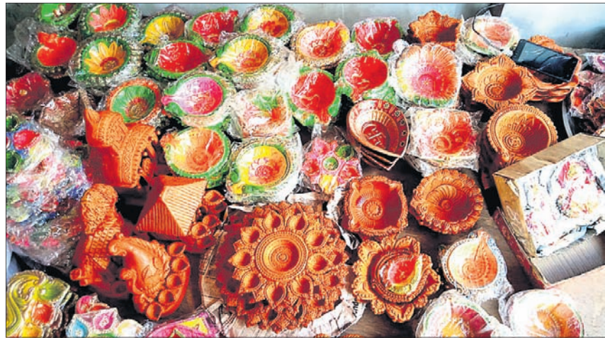
ଏକ ବୋକାନରେ ଫ୍ୟାନ୍ସି ଦୀପ ।

ଆବାସ ଯୋଜନାରେ ଫଟୋ ଉଠା ନ ଯିବା ଯତ୍ନେ ତଦନ୍ତ ରିପୋର୍ଟ ଦାଖଲ କଲେ ବିଡିଓ