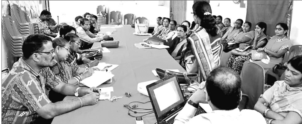
ବୈଠକରେ ଅଧିକାରୀମାନେ ଜାପାନୀ ଦୂର ଚିକାକରଣ ନେଇ ଆଲୋଚନା କରୁଛନ୍ତି।

ଭଣ୍ଡାରୀପୋଖରୀ ବ୍ଲକ୍ କମାନ୍ସେଇଟିଭିଏ ପଞ୍ଚାୟତ ପଞ୍ଚାୟତ ଗ୍ରାମୀଣ କର୍ମକ୍ରମ କଲେଜ ଛାତ୍ର ଛାତ୍ରୀମାନଙ୍କୁ ଆକର୍ଷଣ କରିବା ପାଇଁ ଗଭୀର ଗବେଷଣା କରାଯାଇଛି।