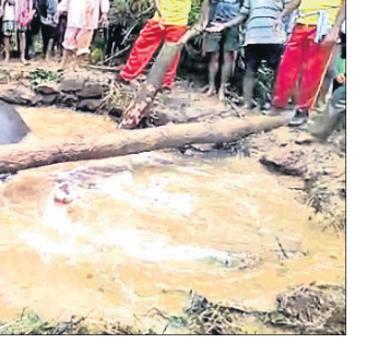
ହାତୀକୁ ଉଦ୍ଧାର ପାଇଁ ପ୍ରୟାସ କରାଯାଇଛି।

କୂଅ ଭିତରେ ପଡିଥିବା ଦେଖିଥିଲେ। ଏ ସଂକ୍ରାନ୍ତରେ ଗ୍ରାମବାସୀ ବଡ଼ଗାଁରେଖିରକୁ ଫୋନ୍ କରି ଜଣାଇଥିଲେ।