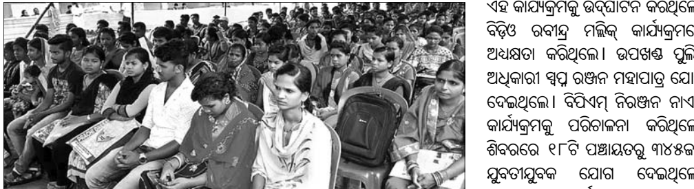
ଶିବିରକୁ ଆସିଥିବା ଯୁବକମାନଙ୍କୁ ପଢ଼ାଯାଉଛି।

ରାଜ୍ୟ ସରକାରଙ୍କ ପଞ୍ଚାୟତରାଜ ଓ ରାଜ୍ୟ ସରକାରଙ୍କ ପଞ୍ଚାୟତରାଜ ଓ ଉପକଣ୍ଠାରେ ଆନନ୍ଦନଗର ଓ ମନମୋହନ ଶାସ୍ତ୍ରୀଙ୍କୁ ସାହିତ୍ୟ ଆସର ପଢ଼ାଯାଇଛି।