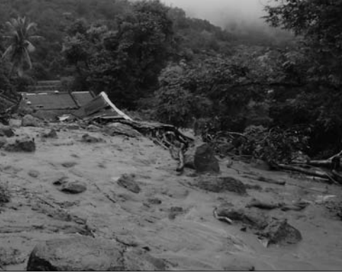
ଗୁମ୍ଫା ବୁକ୍ ବି. କଳାକୋଟ ପଞ୍ଚାୟତର କୁଳଙ୍ଗ ଗ୍ରାମରେ ପାହାଡ଼ ଧରି ପଡ଼ିଛି।

ଗୁମ୍ଫା/ପାରଳାଖେମୁଣ୍ଡି/କାଶୀନଗର/ରାୟଗଡ଼(ଗଜପତି), ୨୪।୧୦ (ସି.ପ୍ର./ଡି.ଏନ୍.ଏ.)-ଲଗୁତାପ ପ୍ରଭାବରେ ବୁଧବାର ସକାଳୁ ବର୍ଷା ଲାଗିରହିଛି। ଏଥିରେ ଗଜପତି ଜିଲ୍ଲା ବିଶେଷଭାବେ ପ୍ରଭାବିତ ହୋଇଛି। ଡିଡିଲା ଓ ଫର୍ମର ଖୁଣ୍ଟ ଲିଭାବାସୀ ଭଳି ନ ଥିବାବେଳେ ଏବେ ବୃଦ୍ଧି ବର୍ଷା ବିପ୍ଳବ ଲିଭାବାସୀଙ୍କ ଉପରେ ବାର ଘାଣ୍ଟି। ଗୁରୁବାର ସକାଳେ ଜିଲ୍ଲାର ଗୁମ୍ଫା ବୁକ୍ ବି. କଳାକୋଟ ପଞ୍ଚାୟତର କୁଳଙ୍ଗ ଗ୍ରାମରେ ପାହାଡ଼ ଧରି ଗ୍ରାମର ୨୦ ଘର ମାଟିରେ ମିଶିଯାଇଥିବାବେଳେ ୭୦