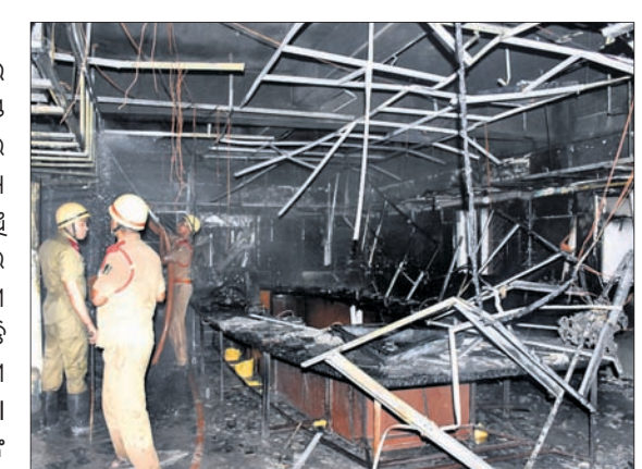
ଉତ୍କଳ ବିଶ୍ୱବିଦ୍ୟାଳୟରେ ନିଆଁ ଲାଗି ଯୋଡ଼ିଯାଇଥିବା ଆସବାବପତ୍ର।

ଉତ୍କଳ ବିଶ୍ୱବିଦ୍ୟାଳୟର ସିଡିଏଲ୍ ହଲ୍ରେ ଗୁରୁବାର ସନ୍ଧ୍ୟାରେ ଭୟାବହ ଅଗ୍ନିକାଣ୍ଡ ଘଟିଛି। ଏଥିରେ ବହୁ ଛାତ୍ରଛାତ୍ରୀଙ୍କ ଜୀବନ ହାନି ଘଟିଛି।