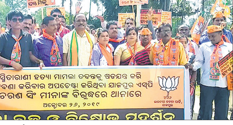
ଧର୍ମଶାଳା ଥାନା ସମ୍ମୁଖରେ ଭାଜପା କର୍ମୀଙ୍କ ବିରୋଧ ପ୍ରଦର୍ଶନ।