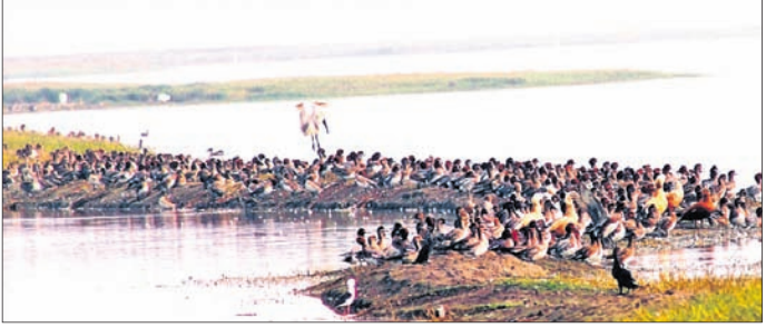
ବେଳେ ପର୍ଯ୍ୟନ୍ତ ଓ ପକ୍ଷୀ ବିଶାରଦଙ୍କ ମଧ୍ୟରେ ଆନନ୍ଦର ଲହରୀ ଖେଳିଯାଇଛି। ଚିଲିକାରେ ଶୀତଦିନେ ପ୍ରାୟ ୧୬୦ରୁ ଊର୍ଦ୍ଧ୍ୱ ପ୍ରକାରିର ପକ୍ଷୀଙ୍କ ସମାଗମ ହେଉଥିବା ବେଳେ ପ୍ରଥମ ପର୍ଯ୍ୟାୟରେ ୧୬ ପ୍ରକାରିର ପକ୍ଷୀ ଚିହ୍ନଟ କରାଯାଇଛି।

ବାଲୁଗା, ୨୬।୧୦(ଡି.ଏନ.ଏ.) ଶୀତର ପହିଲି ଶର୍ଣ୍ଣ ସାଜକୁ ନୀଳାମ୍ବୁ ଚିଲିକାକୁ ରଙ୍ଗବେରଙ୍ଗର ବିଦେଶୀ ପକ୍ଷୀଙ୍କ ପୁଅ ଛୁଟିବା ଆରମ୍ଭ ହୋଇଛି। ଶନିବାର ପୁଣ୍ୟ ଚିଲିକା ମଧ୍ୟସ୍ଥ ପକ୍ଷୀଅଭୟାରଣ୍ୟ ନକବଣ ଅଞ୍ଚଳରେ ପ୍ରାୟ ୧ ହଜାରରୁ ଊର୍ଦ୍ଧ୍ୱ ବିଦେଶୀ ପକ୍ଷୀଙ୍କ ସମାଗମ ହୋଇଥିବା ବାଲୁଗା ବନ୍ୟପ୍ରାଣୀ ବିଭାଗୀୟ ସ୍ତ୍ରୀରୁ ଜଣାଯାଇଛି । ପକ୍ଷୀଙ୍କ ଆଗମନ ହେତୁ ଚିଲିକା ଚଳଚଞ୍ଚଳ ହୋଇପଡ଼ିଥିବା