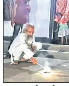
କେନ୍ଦ୍ରମନ୍ତ୍ରୀ ଛୁରୁଛୁରି କାରୁଛନ୍ତି।

ବାଲେଶ୍ୱର ଜିଲ୍ଲା ନୀଳଗିରି ନିକଟସ୍ଥ ଗୋପାଳାଥପୁର ଗ୍ରାମରେ କେନ୍ଦ୍ର ଅଣ୍ଟା କ୍ଷୁଦ୍ର ଏବଂ ମଧ୍ୟମଭାଗ, ମସ୍ୟା, ପ୍ରାଣାବିକାଶ ଏବଂ ଗୋପାଳନ ରାଷ୍ଟ୍ରମନ୍ତ୍ରୀ ତଥା ବାଲେଶ୍ୱର ଏମ୍ପି ପ୍ରତାପ ଚନ୍ଦ୍ର ଷଡ଼ଙ୍ଗୀ ଉଦ୍ଦେଶ୍ୟରେ ଛୋଟ ପିଲାଙ୍କ ଗହଣରେ ଛୁରୁଛୁରି କଳାକ୍ରମ କରୁଛନ୍ତି।