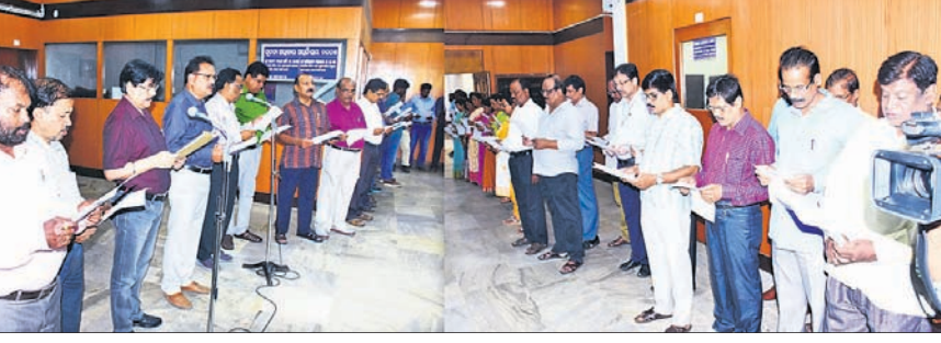
ସୂଚନା ଓ ଲୋକସମ୍ପର୍କ ବିଭାଗର ଅଧିକାରୀ ଓ କର୍ମଚାରୀମାନେ ଶପଥପାଠ କରୁଛନ୍ତି।

ଭୁବନେଶ୍ୱର, ୨୮୧୦(ଭୁବନେଶ୍ୱର) ଚଳିତ ମାସ ୨୮ ତାରିଖରୁ ନଭେମ୍ବର ୨ ତାରିଖ ପର୍ଯ୍ୟନ୍ତ ସମଗ୍ର ଦେଶରେ ଦୁର୍ନୀତି ନିବାରଣ ସପ୍ତାହ ପାଳନ କରାଯାଉଛି। ଏହି ପରିପ୍ରେକ୍ଷାରେ ରାଜ୍ୟ ସରକାରଙ୍କ ବିଭିନ୍ନ ବିଭାଗରେ ଦୁର୍ନୀତି ନ କରିବା ପାଇଁ ଅଧିକାରୀ ଓ କର୍ମଚାରୀମାନଙ୍କ ଶପଥପାଠ ଆୟୋଜନ କରାଯାଇଛି।