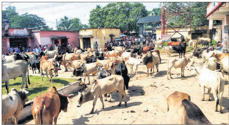
ରୁକ୍ କାର୍ଯ୍ୟାଳୟ ପରିସରରେ ଶତାଧିକ ଷଷ୍ଠ ।