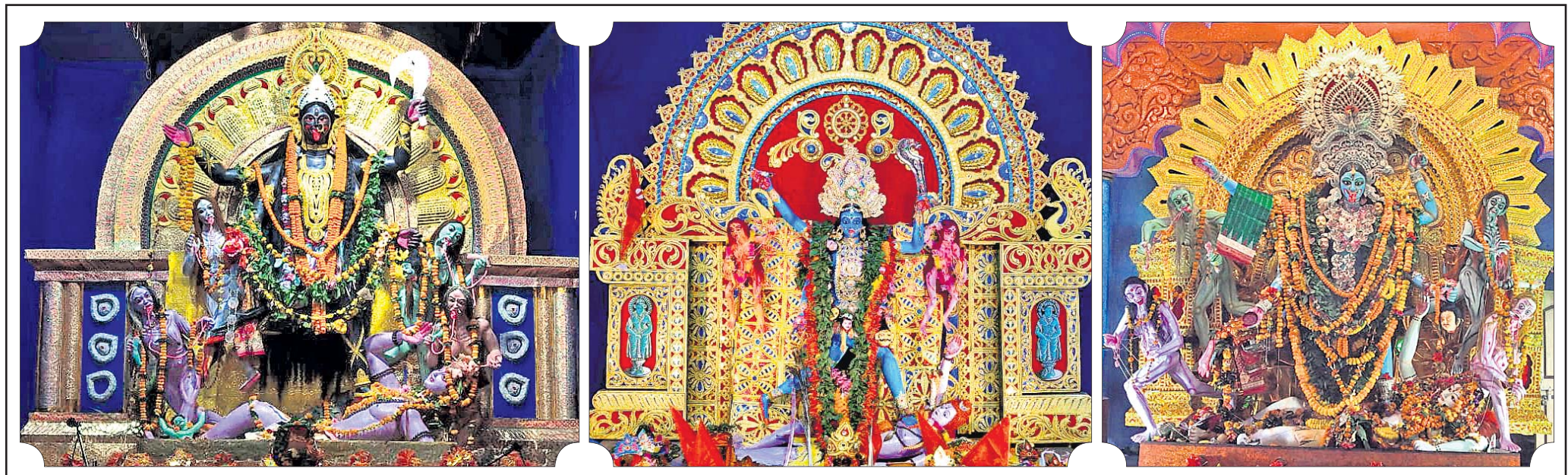
କାଶୀପୁର ମା' ଶୁଖାନ କାଳୀ ।