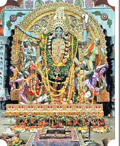
କାଳୀତୀର୍ଥ ମା' କାଳୀ ।