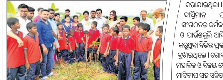
ଆଶ୍ରମ ବିଦ୍ୟାଳୟ ପରିସରରେ ବୃକ୍ଷରୋପଣ।

ବାଲେଶ୍ୱର ଅଫିସ, ୨୮୧୦: ବାଲେଶ୍ୱର ସଦର ବ୍ଲକ ଓଲଟାପାଟଣା ପଞ୍ଚାୟତର ଆକିନିଆଁ ଛିତ୍ର ଆନନ୍ଦମାର୍ଗ ଆଶ୍ରମ ବିଦ୍ୟାଳୟରେ 'ଆହ୍ଲା' ସଙ୍ଗଠନ ପକ୍ଷରୁ କୁନିକୁନି ପିଲାଙ୍କ ସହ ଦୀପାବଳି ପାଳନ କରାଯାଇଥିଲା।