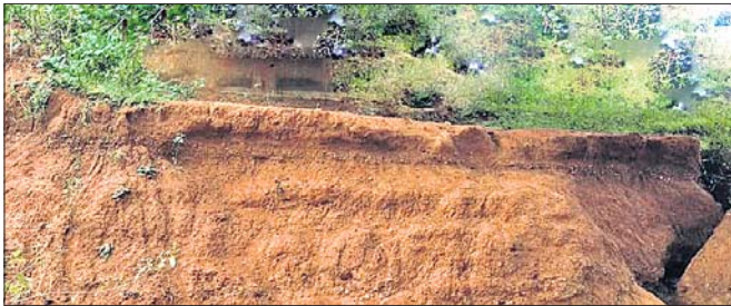
ବୈତରଣୀ ନଦୀ ଧୋଇ ନେଉଥିବା ତଟ ।

ବୈତରଣୀ ବୈତରଣୀ ନଦୀ ଦିନକୁ ଦିନ କୁଳ ଲାଞ୍ଚିଚାଲିଛି । ଫଳରେ ନଦୀ ପଠାକୁ ଲାଗିରହିଥିବା ଚାଷ ଜମିଗୁଡ଼ିକରେ ଧୀରେ ଧୀରେ ନଦୀ ଗଭୀର ଲାନ ହେବାକୁ ଯାଇଛି । ପୁରୁଣା ବନ୍ଧ ନ ଥିବାରୁ ତଥା ପ୍ରତ୍ୟେକ ବର୍ଷ ଗତିପଥ ପରିବର୍ତ୍ତନ ଏଥିପାଇଁ ମୁଖ୍ୟତଃ ଦାୟୀ ହୋଇଛି । ସୂଚନା ଅନୁଯାୟୀ ଓଡ଼ିଶା ଓ ଝାଡ଼ଖଣ୍ଡ ରାଜ୍ୟର କେନ୍ଦୁଝର ଓ ମୟୂରଭଞ୍ଜ ଜିଲ୍ଲାର ସୀମା ତିହ୍ନଟ କରୁଥିବା ବୈତରଣୀ ନଦୀ ତମ୍ବୁଆ ଦେଇ ବହିଯାଇଛି । ଏହି ନଦୀର ପାର୍ଶ୍ୱବର୍ତ୍ତୀ ଅଞ୍ଚଳ ଗୁଡ଼ିକରେ ରହିଥିବା ଜମିଗୁଡ଼ିକ