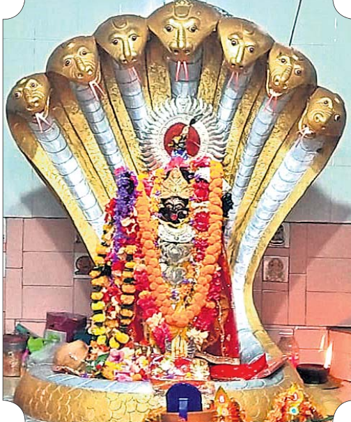
ମାଧପୁର ମା' କାଳୀ ।

ଘସିପୁରା ଠାରେ କାଳୀପୂଜା କମିଟି ପକ୍ଷରୁ ଚଳିତ ବର୍ଷ କାଳୀପୂଜା ଧୁମଧାମରେ ପାଳିତ ହେଉଛି । ଏଠାରେ ଦୀର୍ଘ ୭୫ବର୍ଷ ହେବ କମିଟି ପକ୍ଷରୁ ମା'ଙ୍କ ପୂଜାକୁ ପାଳନ କରାଯାଇଛି । ଗତ ରବିବାର ମଧ୍ୟରାତ୍ରରୁ ସମସ୍ତ ରାତିନିମିତ୍ତ ସହ ପୂଜା ସମ୍ପନ୍ନ କରାଯାଇଥିଲା । ସୋମବାର ସକାଳୁ ମା'ଙ୍କ ଦର୍ଶନ ପାଇଁ ଶ୍ରଦ୍ଧାଳୁଙ୍କ ଭିଡ଼ ପରିଲକ୍ଷିତ ହୋଇଥିଲା । କମିଟି ପକ୍ଷରୁ ଶ୍ରଦ୍ଧାଳୁ ମାନଙ୍କୁ ପ୍ରସାଦ ବନ୍ଧନ କରାଯାଇଥିଲା । ଚଳିତ ବର୍ଷ ସୁଭକ୍ତ ତୋରଣ ସାଙ୍ଗକୁ ରଙ୍ଗୀନ ଆଲୋକମାଳରେ ପୂଜା ମଣ୍ଡପ ଝଲସୁଛି । ସେହିପରି ସାଂସ୍କୃତିକ କାର୍ଯ୍ୟକ୍ରମ ଓ ଅପେରା ଏହି ପୂଜା କମିଟିର ବିଶେଷ ଆକର୍ଷଣ । ଆସନ୍ତା କାଲି ଜିଲ୍ଲା ବାହାର କଳାକାର ମାନଙ୍କ ଦ୍ୱାରା ନୃତ୍ୟ ପରିବେଶଣ କାର୍ଯ୍ୟକ୍ରମ ଅନୁଷ୍ଠିତ ହେବାକୁ ଥିବା ବେଳେ ୩୧ ତାରିଖରୁ ୨ ତାରିଖ ପର୍ଯ୍ୟନ୍ତ ତିନି ଦିନ ବ୍ୟାପୀ ସାଥୀକ ଗଣନାତ୍ୟ ପକ୍ଷରୁ ଅପେରା ପ୍ରଦର୍ଶିତ କରାଯିବ । କମିଟି ଉପଦେଷ୍ଟା କେଶବ ଚନ୍ଦ୍ର ସାହୁ, ସଭାପତି ହରେକୃଷ୍ଣ ସାହୁ, ଉପ ସଭାପତି ପ୍ରମୋଦ ଦାଶ, ସମ୍ପାଦକ ସୁରେଶ୍ ସେଠୀ, ଅଧ୍ୟୁପାନୟ ରଣା, ରାଜ କିଶୋର ବେହେରା, ସୁତି ରଞ୍ଜନ ମିଶ୍ର, ଗଣେଶ ପତି ପ୍ରମୁଖ କାର୍ଯ୍ୟକ୍ରମ ପରିଚାଳନା କରୁଛନ୍ତି ।