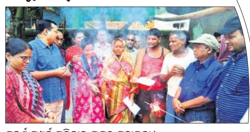
ସୁବର୍ଣ୍ଣ ସମ୍ପର୍କ ପରିବାର ପକ୍ଷରୁ ସହାୟତା।

ବାଲେଶ୍ୱର ଜିଲ୍ଲାରେ 'ସୁବର୍ଣ୍ଣ ସମ୍ପର୍କ' ପରିବାର ପକ୍ଷରୁ ଚଳିତବର୍ଷ ନିଆରା ଭଙ୍ଗରେ ଦୀପାବଳି ପର୍ବ ପାଳନ କରାଯାଇଥିଲା।