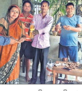
'ବାବନସାଥୀ' ପକ୍ଷରୁ ଜଣେ ମହିଳାଙ୍କୁ ମାଟି ଦୀପ ଦାୟିତ୍ୱ ପଢ଼ିବା ନେତୃତ୍ୱରେ ପ୍ରଦାନ କରାଯାଇଛି।

ବାଲେଶ୍ୱର ଜିଲ୍ଲା ବସ୍ତା ବ୍ଲକ ସରକାରଙ୍କ ପକ୍ଷରୁ ଅନ୍ତର୍ଗତ ବେଣାପୁରା 'ବାବନସାଥୀ' ସଂଗଠନ ପକ୍ଷରୁ ଦୀପାବଳି ଉତ୍ସବ ପାଳନ ଉପଲକ୍ଷେ ୬ ହଜାର ମାଟିଦୀପ ବଣ୍ଟନ କରାଯାଇଛି।