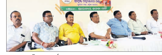
ଖବରଦାତା ସମ୍ମିଳନୀରେ ପୂର୍ବତନମନ୍ତ୍ରୀ ପଦ୍ମଲୋଚନ ପଣ୍ଡା ଓ ଅନ୍ୟମାନେ।