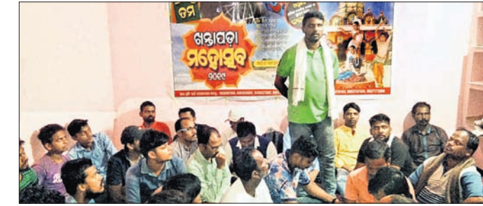
ମହୋତ୍ସବ ପ୍ରସ୍ତୁତି ବୈଠକରେ ଉପସ୍ଥିତ କର୍ମକର୍ତ୍ତା।