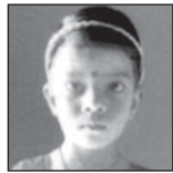
ବେହେରା ପୁଣି ପରିବାରବର୍ଗ