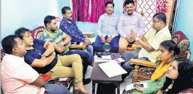
ବୈଠକରେ ଉପସ୍ଥିତ କମିଟିର କର୍ମକର୍ମୀ ।