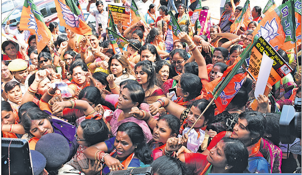
ଭାଙ୍ଗପା ମହିଳା ମୋର୍ଚ୍ଚା ପକ୍ଷରୁ ବିରୋଧ ପ୍ରଦର୍ଶନ କରାଯାଉଛି।