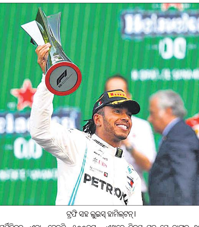
ଗ୍ରାଁ ପ୍ର ସହ ଲୁଇସ୍ ହାମିଲଟନ୍ । ଏଥିରେ ବିଜୟ ସହ ସେ ତାଙ୍କର ୬୬ ଖାଲି ଟ୍ରାଉଜର୍ସ ଫାମିଲିଗିପ୍ ଟାକ୍ସଲ ଅଷ୍ଟ୍ରିଆରେ ସୁଧର୍ ଗ୍ରାଁ ପ୍ର ହେବ ।

ମର୍ସିଡିଜ୍ରେ ଲୁଇସ୍ ହାମିଲଟନ ମେକ୍ସିକାନ ଗ୍ରାଁ ପ୍ର ଜିତିଛନ୍ତି । ଖୁବ୍ ଗ୍ରାଁ ପ୍ର ଜିତିଛନ୍ତି । ଚଳିତ ସିକ୍ସରେ ଏହା ହେଉଛି ତାଙ୍କର ୧୦ମ ଗାଜେଟ୍ । ଫୋର୍ମାରି ସେବାଷ୍ଟିଆନ ଭେଟେଲ ଏବଂ ହାମିଲଟନଙ୍କ ଚିମ୍ପେଟ ଭାଇଟେରା ବୋଟାସ୍ ଯଥାକ୍ରମେ ଦ୍ୱିତୀୟ ଓ ତୃତୀୟ ହୋଇଛନ୍ତି । ଫୋର୍ମାରି ଚାଲ୍ସ କ୍ଲେଭେକ୍ ପୋଲ୍ ପୋଲିଗନଙ୍କୁ ରେସ୍ ଆରମ୍ଭ କରିଥିଲେ ମଧ୍ୟ ତାଙ୍କୁ ଯଥାକ୍ରମେ ଉଦ୍ଧୃକ୍ତରୁ ଆଲୋକ ଆଲବନ ଏବଂ ମାକ୍ ଉଷ୍ଟିପେନ୍କଠାରୁ ଆଗରେ ଚତୁର୍ଥ ସ୍ଥାନରେ ସମ୍ପୂର୍ଣ୍ଣ ହେବାକୁ ପଡ଼ିଥିଲା । ରେସ୍ ଆରମ୍ଭରେ ପିର୍ ଷ୍ଟୁ ଯୋଗୁ ଉଷ୍ଟିପେନ୍କ୍ ସଂଘର୍ଷ କରିବାକୁ ପଡ଼ିଥିଲା । ଘୁମାନ୍ ହିରୋ ରେସ୍ ପ୍ୟାକ୍ଟର ସର୍ଭିସ୍ ପେରେଜ ସପ୍ତମ ସ୍ଥାନ ଅଧିକାର କରିଥିଲେ । ଫୋରୋ ରୋସାରୋ ବୁଲ୍ ଦ୍ରାଇଭର ପିଏରେ ଗାଲି ଏବଂ ନିକୋ ହାଜେନ୍ଦର୍ଗଙ୍କୁ ପଛରେ ପକାଇ ରେନଲ୍ଡର ତାନିଏଲ ରିକାର୍ଡୋ ୮ମ ହୋଇଥିଲେ । ହାମିଲଟନଙ୍କ କ୍ୟାରିୟରର ଏହା ୮୩ତମ ଗାଜେଟ୍ । ଅନ୍ୟପକ୍ଷରେ