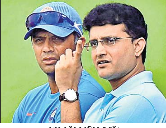
ରାହୁଲ ଦ୍ରାଊଡ଼ ଓ ସୌରଭ ଗାଙ୍ଗୁଲି

ଦୀର୍ଘଦିନ ଧରି ଚିନ୍ତାମଣି ରହିଆସିଥିବା ଯୌରଭ ଗାଙ୍ଗୁଲି ଓ ରାହୁଲ ଦ୍ରାଊଡ଼ଙ୍କୁ ରୁଧିରାଣୀ ବେଙ୍ଗାଳୁରୁରେ ପରସ୍ପରକୁ ଭେଟିବେ । ଗାଙ୍ଗୁଲି ବର୍ତ୍ତମାନ ଭାରତୀୟ କ୍ରିକେଟ କଣ୍ଟ୍ରୋଲ ବୋର୍ଡ (ବିସିଆଇ)ର ନୂଆ ସଭାପତି ଭାବେ ନିର୍ବାଚିତ ହୋଇଥିବା ବେଳେ ଦ୍ରାଊଡ଼ ନ୍ୟାଶନାଲ କ୍ରିକେଟ ଏକାଡେମୀ (ଏନ୍ସିଏ)ର ମୁଖ୍ୟ ଅଛନ୍ତି । ଉଭୟେ ଭାରତୀୟ କ୍ରିକେଟର 'ରୋଡ୍ ମ୍ୟାଚ୍' ନେଇ ଆଲୋଚନା କରିବେ । ଦ୍ରାଊଡ଼ ଜୁଲାଇରେ ଏନ୍ସିଏର ମୁଖ୍ୟ ଭାବେ ଦାୟିତ୍ୱ ଗ୍ରହଣ କରିଛନ୍ତି । ପ୍ରତିଷ୍ଠାନ ପାଇଁ ସେ ଲଢ଼ିମଧ୍ୟରେ ଏକ 'ରୋଡ୍ ମ୍ୟାଚ୍' ପ୍ରସ୍ତୁତ କରିସାରିଛନ୍ତି । ଦୁଇ ପୂର୍ବତନ ଅଧିନାୟକ ଯେତେବେଳେ ଭେଟାଭେଟି ହେବେ ସେତେବେଳେ ଗାଙ୍ଗୁଲି କ୍ରିକେଟରେ ଉଦ୍ଧୃତି ପାଇଁ ଚାହୁଁଛନ୍ତି । ନିଜ ମନରେ ରହିଥିବା ବିଶ୍ୱାସରାଶିକୁ ଉପସ୍ଥାପନ କରିବେ । ଗତ ୨୩ ତାରିଖରେ ଦାୟିତ୍ୱ ଗ୍ରହଣ କରିଥିଲେ ।