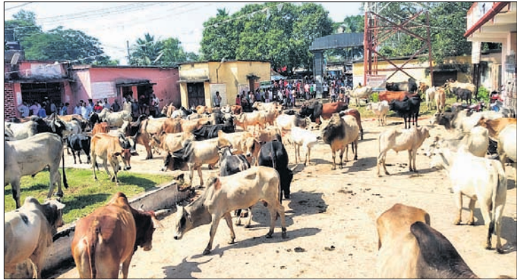
ରୁକ୍ କାର୍ଯ୍ୟାଳୟ ପରିସରରେ ଶତାଧିକ ଷଷ୍ଠ ।

ରାଜନଗର ରୁକ୍ ଅଞ୍ଚଳରେ ବୁଲାଇ ଷଷ୍ଠ ସଂଖ୍ୟା ବୁଦ୍ଧି ପାଉଥିବା ବେଳେ ସେମାନଙ୍କ ପ୍ରାୟତଃ ଯୋଗୁ ଚାଷୀଙ୍କୁ ବହୁ କ୍ଷତି ସହିବାକୁ ପଡ଼ୁଛି । ଅନେକ ସମୟରେ ଷଷ୍ଠଗୁଡ଼ିକ କିଆରିରେ ପଶି ଫସଲ ଖାଇବା ସହ ହେକ୍ଟର ହେକ୍ଟର ଫସଲ ନଷ୍ଟ କରି ପକାଉଛନ୍ତି । ଏ ନେଇ ଚାଷୀମାନେ ବାରମ୍ବାର ଅଭିଯୋଗ କରୁଥିଲେ ବି ପ୍ରଶାସନ ପକ୍ଷରୁ କୌଣସି ପଦକ୍ଷେପ ଗ୍ରହଣ କରାଯାଇନାହିଁ । ପ୍ରଶାସନର ଏଭଳି ନିଷ୍ପତ୍ତା ବିରୋଧରେ ଗ୍ରାମୀଣ ଚାଷୀମାନେ ସୋମବାର ଅଭିନବ ଢଙ୍ଗରେ ପ୍ରତିବାଦ କରିଛନ୍ତି । ଜିଲ୍ଲାପାଳଙ୍କ କନଶ୍ଚୁଣାଣି ଚାଲିଥିବା ବେଳେ ଶିବିର ଭିତରେ ଚାଷୀମାନେ ଷଷ୍ଠ ଛାଡ଼ିଦେବା ଭଳି ଘଟଣା ନଜରକୁ ଆସିଛି । ଯାହାକୁ ନେଇ ଏବେ ଜିଲ୍ଲାବ୍ୟାପୀ ଚର୍ଚ୍ଚା ଆରମ୍ଭ ହୋଇଛି ।