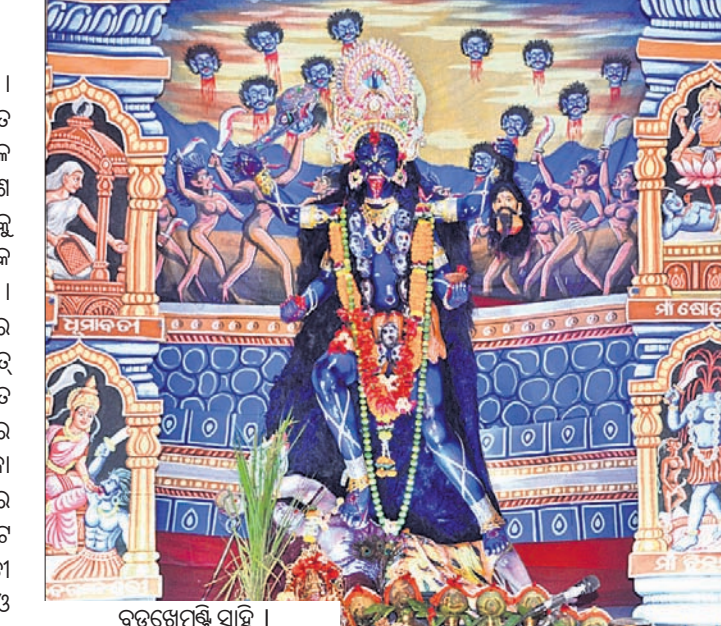
ବଡ଼ଖେମୁଣ୍ଡି ସାହି ।

ବ୍ରହ୍ମପୁରରେ ଫିକା ପଡ଼ିଛି ଦାପାବଳି । ସହରରେ ଆଡ଼ସବାଜି ଶବ୍ଦ ଚଳିତ ବର୍ଷ ଉତ୍ତେଜ ଯାଇଥିବା ବେଳେ ମହାନଗରରେ କାଳୀପୂଜା ଅନିଚ୍ଛା ରଞ୍ଜନ ଆଲୋକମାଳା ସାଙ୍ଗକୁ ଆକର୍ଷଣୀୟ ତୋରଣ, ଆଧୁନିକ ସାଜସଜ୍ଜା ଦର୍ଶକଙ୍କୁ ବିମୋହିତ କରୁଛି । ରବିବାର ଦାପାବଳି ଅବସରରେ ସହରରେ ଚଳିତବର୍ଷ ୪ ପ୍ରମୁଖ ବୃହତ୍ ମଞ୍ଚପରେ ମା'ଙ୍କ ପୂଜା ଅନୁଷ୍ଠିତ ହୋଇଛି। ଗେଟବନ୍ଦୀର ଗୋକର୍ଣ୍ଣେଶ୍ୱର ମନ୍ଦିର ନିକଟସ୍ଥ ଦକ୍ଷିଣକାଳୀ ପୂଜା କମିଟି ପକ୍ଷରୁ ଆୟୋଜିତ ମଞ୍ଚପରେ ୧୦୦୦୯୦୩ ଓ ୬୦୦୯୦୩ ଉଚ୍ଚତାର ବାଙ୍ଗାଲୋର ଭାନ୍ସୁମତୀ ପ୍ୟାଲେସ୍ ଭାଞ୍ଜା ତୋରଣ ଓ ମଞ୍ଚପରେ ଶୋଭା ପାଉଥିବା ବିଷୁକ ଦଶ ଅବତାର କଳାକୃଷ୍ଣ ପଦ୍ମାବତୀଙ୍କ ମନକିଶ୍ଚିଛି। ବିତୀୟ ବର୍ଷରେ ପହଞ୍ଚିଥିବା ଶିଶୁଅଳ ନିକଟସ୍ଥ ସୁବାସନଗରରେ ଶ୍ୟାମାକାଳୀ ମୁବକ ସଂଘ ପକ୍ଷରୁ ଆୟୋଜିତ ପୂଜାମଞ୍ଚପରେ ୧୫.୫ ଫୁଟ ଉଚ୍ଚତାର ରାଜମହଲ ଭାଞ୍ଜା ତୋରଣ ଓ ଆକର୍ଷଣୀୟ ଆଲୋକ ସାଜସଜ୍ଜା ପର୍ଯ୍ୟଟକଙ୍କୁ ଆକୃଷ୍ଟ କରୁଛି । ଦୀର୍ଘ ୫ ବର୍ଷ ପରେ