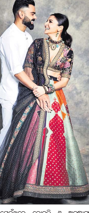
ଯୋଡ଼ିଥିବା ଦେଖିବାକୁ ମିଳିଛି । ସମେତ ବଲିଉଡର ବହୁ ନାମାଦୀ କଳାକାରଙ୍କୁ ଦେଖିବାକୁ ମିଳିଥିଲା ।

ଭାରତୀୟ ଅଧିନାୟକ ବିରାଟ କୋହଲି ଓ ତାଙ୍କ ପତ୍ନୀ ଅନୁଷ୍ଠା ଶର୍ମା ଦୀପାବଳି ପାଳନ କରିବା କିଛି ଫଟୋ ସୋସିଆଲ ମିଡ଼ିଆରେ ଶେୟାର କରିଛନ୍ତି । ସଭିଙ୍କୁ ଦୀପାବଳିର ଶୁଭକାମନା । ଆଲୋକର ଉତ୍ସବ ସଭିଙ୍କ ପାଇଁ ପ୍ରେମ ଓ ଶାନ୍ତି ଆଣି ଦେଉ ବୋଲି କୋହଲି ଟୁଇଟ୍ କରି ଇନ୍ଦିୟାଗ୍ରାମରେ କ୍ୟାପଶନ ଦେଇ ଲେଖିଛନ୍ତି । ତାଙ୍କ ଭଳି ଅନୁଷ୍ଠା ମଧ୍ୟ କିଛି ଫଟୋ ଶେୟାର କରିଛନ୍ତି । ଗୋଟିଏ ଫଟୋରେ ଘରେ ରଖାଯାଇ ସହ ଦୀପା ସଜା ହୋଇଥିବା ଦେଖିବାକୁ ମିଳିଛି । ଉଭୟଙ୍କୁ ଚୁକ୍ତରୁ ପ୍ରଣାମନେ ବହୁ ପସନ୍ଦ କରିଛନ୍ତି । ନିକଟରେ କୋହଲିଙ୍କ ନେତୃତ୍ୱାଧୀନ ଦଳ ଦକ୍ଷିଣ ଆଫ୍ରିକା ବିପକ୍ଷ ୩ ମ୍ୟାଚ୍ ବିଶିଷ୍ଟ ସିରିଜ୍ ୩-୦ ବ୍ୟବଧାନରେ ମୁକ୍ତପୋଇ କରି ଦେଇଛି । ସେହିଭଳି ବିଭିନ୍ନ ଅପିଡାଭ ବଜନ ତାଙ୍କ ଯୋଡ଼ିଥିବା ଦେଖିବାକୁ ମିଳିଛି । ସମେତ ବଲିଉଡର ବହୁ ନାମାଦୀ କଳାକାରଙ୍କୁ ଦେଖିବାକୁ ମିଳିଥିଲା ।