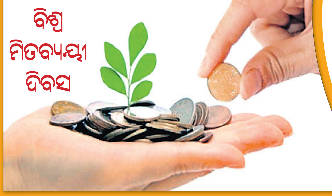
ବିଶ୍ଵ ମିତବ୍ୟୟୀ ଦିବସ

ଲୋକମାନଙ୍କ ଜୀବନମାନରେ ସୁଧାର ଆଣିବା ପାଇଁ ସଞ୍ଚୟ ଉପରେ ଅନ୍ୟଦେଶର ବ୍ୟାଙ୍କଗୁଡ଼ିକ ଏହାକୁ ସମର୍ଥନ କରିଥିଲେ । ଧୀରେଧୀରେ ବ୍ୟାଙ୍କଗୁଡ଼ିକୁ ବିଭିନ୍ନ ମହିଳା ସଂଗଠନ, ଖେଳସଂସଦ ତଥା ଅନ୍ୟ ସଂଗଠନ ପକ୍ଷରୁ ମଧ୍ୟ ସମର୍ଥନ ମିଳିଥିଲା । ଏହି ଦିବସକୁ ମୁଖ୍ୟତଃ ନୈତିକ, ଆର୍ଥିକ ବୃଦ୍ଧିର ଏକ ମିଶନ ରୂପେ ପ୍ରଚାର କରାଯାଇଥିଲା । ବିତାଣ ବିଶ୍ଵାସ୍ତୁକ୍ ପରେ ମଧ୍ୟ ବିଶ୍ଵ ମିତବ୍ୟୟୀ ଦିବସ ଭାରି ରହିଥିଲା ଓ ୧୯୫୫ରୁ ୧୯୭୦ ମଧ୍ୟରେ ଏହାର ଲୋକପ୍ରିୟତା ଶୀର୍ଷରେ ପହଞ୍ଚିଥିଲା । ଏହା ମଧ୍ୟ ବ୍ୟବହାରିକ ରୂପରେ କେତେକ ଦେଶରେ ଏକ ପରମ୍ପରା ପାଲଟିଗଲା । ଆଜି ମଧ୍ୟ ବିକଶିତ ଦେଶଗୁଡ଼ିକ ମିତବ୍ୟୟୀତାକୁ ପସନ୍ଦ କରୁଛନ୍ତି ଓ ଦେଶର ଅଧିକାଂଶ ଲୋକ ସଞ୍ଚୟ ଉପରେ ବିଶ୍ଵାସ