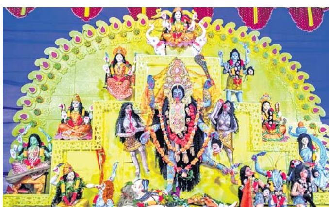
ମୁନିଗୁଡ଼ାରେ ମା' କାଳୀଙ୍କୁ ପୂଜାର୍ଚ୍ଚନା।

୭୦ ଟଙ୍କା ଲାଗୁଥିବା ସମୟରେ ନିରାହ ଅସହାୟଙ୍କୁ ଠକି ସେମାନଙ୍କଠାରୁ ଟଙ୍କା ଲୁଟି ନେଇଥିବାକୁ ଡଙ୍ଗରିଆମାନେ ଅସହାୟ ପ୍ରକାଶ କରିଛନ୍ତି। ଏହାର ତଦନ୍ତ କରି ବୋଧାତ୍ତ ବିରୋଧରେ କାର୍ଯ୍ୟାନୁଷ୍ଠାନ ନେବାକୁ ସେମାନେ ଜିଲ୍ଲାପାଳ ଓ ସହକାରୀ ଶ୍ରମ ଅଧିକାରୀଙ୍କୁ ନିକଟରେ ଦାବି କରିଛନ୍ତି। କାହାରିକୁ ଭରସା କରନାହିଁ। ସିଧାସଳଖ ଶ୍ରମ କାର୍ଯ୍ୟାଳୟକୁ ଆସି ସମସ୍ତ ସୁବିଧା ନିଅ। ଏହି ଘଟଣାର ତଦନ୍ତ କରି ଗ୍ରାମବାସୀଙ୍କୁ ନ୍ୟାୟ ମିଳିବ ବୋଲି ସହକାରୀ ଶ୍ରମାଧିକାରୀ କହିଛନ୍ତି।