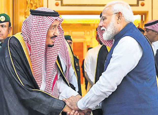
ପ୍ରଧାନମନ୍ତ୍ରୀ ନରେନ୍ଦ୍ର ମୋଦି ସୌଦି ଆରବ ରାଜା ସଲମାନ ବିନ୍ ଅବ୍ଦୁଲଅଜିଜ୍ ଅଲ୍ ସୌଦିଙ୍କୁ ଭେଟିଛନ୍ତି।