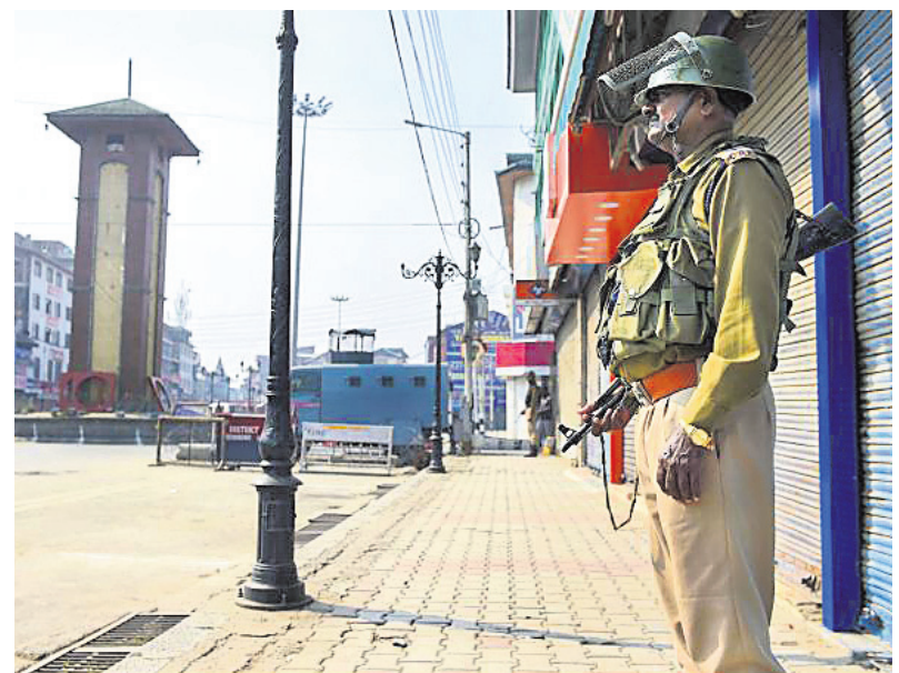
ୟୁରେପୀୟ ସଂଘର ୨୩ ଏମ୍ପି ଶ୍ରୀମନ୍ତର ଗସ୍ତ କରିଥିବାବେଳେ ଲାଲଗୌଳରେ ମୃତ୍ୟୁର ଜଣେ ସୁରକ୍ଷା କର୍ମୀ।