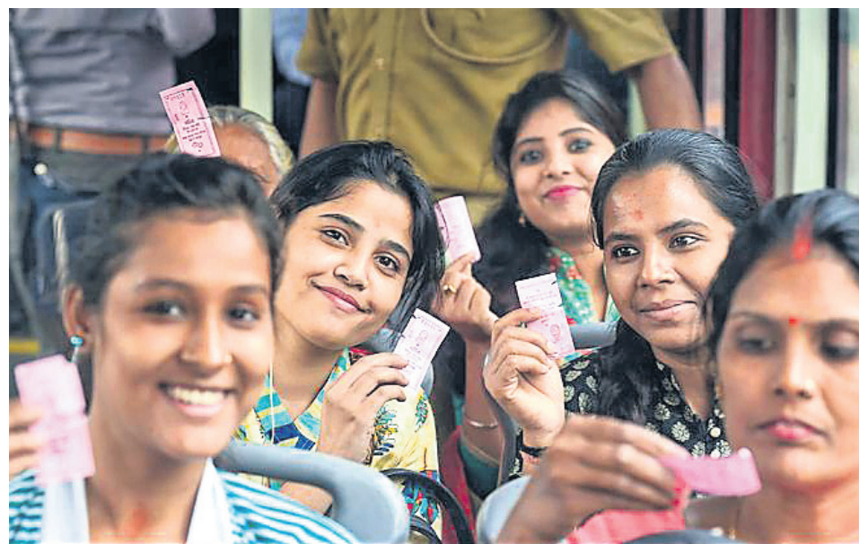
ନୂଆଦିଲ୍ଲୀରେ ତିରିଦି ବସ୍ରେ ମାଗଣାରେ ଯାତ୍ରା କରୁଥିବା ମହିଳାମାନେ ପିଙ୍କ ଟିକେଟ୍ ଦେଖାଉଛନ୍ତି।