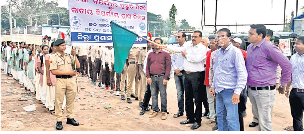
ଜିଲ୍ଲାପାଳ ପତାକା ଦେଖାଇ ଶୋଭାଯାତ୍ରା ଶୁଭାଚରଣ କରୁଛନ୍ତି।