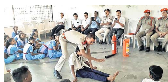
ଅଗ୍ନିଶମ କର୍ମଚାରୀ ଉଦ୍ଧାର କୌଶଳ ପ୍ରଦର୍ଶନ କରୁଛନ୍ତି।