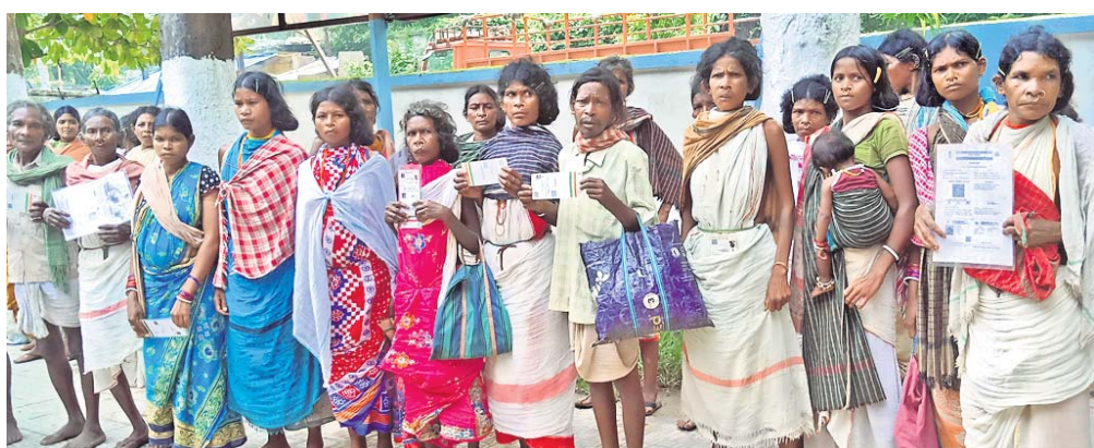
ଅଭିଯୋଗ ଜଣାଇବାକୁ ଆସିଥିବା ଡଙ୍ଗରିଆ କର୍ମଚାରୀ।

ଜିଲ୍ଲାପାଳ, ସହକାରୀ ଶ୍ରମାଧିକାରୀଙ୍କୁ ଭେଟି ଅଭିଯୋଗ ଜଣାଇଲେ