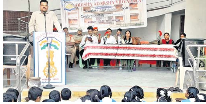
କାର୍ଯ୍ୟକ୍ରମରେ ଉପସ୍ଥିତ ଅତିଥିମାନେ।