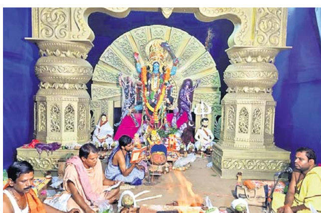
ଗୁଡ଼ାରେ ମା' କାଳୀଙ୍କୁ ପୂଜା ପୂର୍ତ୍ତା।