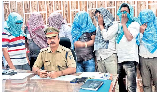
ଖବରଦାତା ସମ୍ମିଳନୀରେ ଏସ୍‌ପିଓ ସୂଚନା ଦେଇଛନ୍ତି।

୧ଲକ୍ଷରୁ ଉର୍ଦ୍ଧ୍ୱ ଟଙ୍କା, ୮ ମୋବାଇଲ, ୪ ବାଇଲ୍ ଜବତ