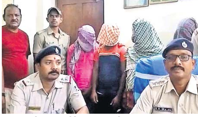
ଖବରଦାତା ସମ୍ମିଳନୀରେ ଏସ୍ପିପିଓ ସୂଚନା ଦେଉଛନ୍ତି।