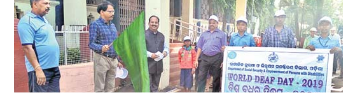
ଶୋଭାଯାତ୍ରାକୁ ଅତିଥି ପଠାଇ ଦେଖାଇ ଶୁଭାରମ୍ଭ କରୁଛନ୍ତି।