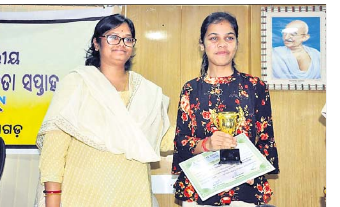
ଜିଲାପାଳ ଜଣେ କୃତୀ ଛାତ୍ରୀଙ୍କୁ ପୁରସ୍କୃତ କରୁଛନ୍ତି।