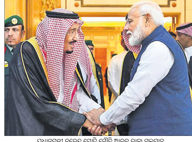
ପ୍ରଧାନମନ୍ତ୍ରୀ ନରେନ୍ଦ୍ର ମୋଦି ସୌଦି ଆରବ ରାଜା ସଲମାନ ବିନ୍ ଅବ୍‌ଦୁଲ୍‌ଆଜିଜ୍ ଅଲ୍ ସୌଦିଙ୍କୁ ଭେଟିବା ପରେ ଫଟୋ ଗ୍ରହଣ କରାଯାଇଛି।