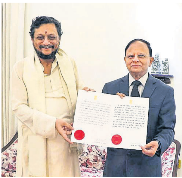
ଭାବୀ ସିଜେଆଇ ଜଷ୍ଟିସ୍ ଶରଦ୍ ଅରବିନ୍ଦ ବୋଦେଙ୍କୁ ରାଷ୍ଟ୍ରପତିଙ୍କ ପକ୍ଷରୁ ନିମ୍ନଲିଖିତ ପ୍ରଦାନ କରୁଥିବା ପ୍ରଧାନମନ୍ତ୍ରୀଙ୍କ ପ୍ରଧାନ ସଚିବ ପି.କେ. ମିଶ୍ର।