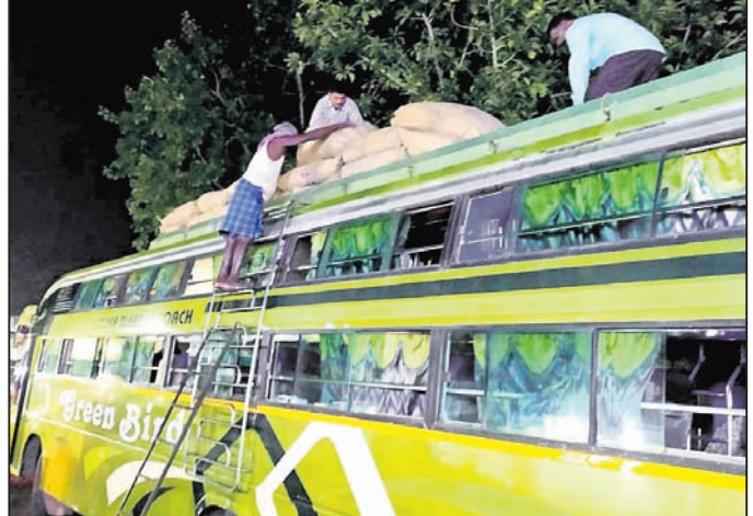
ଯାତ୍ରୀବାହୀ ବସ୍ ଯୋଗେ ବେଆଇନ ମାଲ୍ ପରିବହନ କରାଯାଉଛି ।

ବିଭିନ୍ନ କ୍ଷେତ୍ରରେ ପ୍ରଶାସନିକ ଅଧିକାରୀଙ୍କ ଚାକିରୀ ନୀତି ଯୋଗୁଁ ଦିନକୁ ଦିନ କଳାକାରୀଙ୍କ ସାମ୍ରାଜ୍ୟ ବଢିବାରେ ଲାଗିଛି।