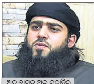
ଅବୁ ହାସନ ଅଲ୍ ମୁଜାହିଦ୍

ସିରିଆରେ ଆମେରିକାର ସାମରିକ କାର୍ଯ୍ୟାଳୟର ବେଳେ ନିହତ ହୋଇଥିବା ଇସ୍ଲାମିକ୍ ସ୍ଟେଟ୍ (ଆଇଏସ୍) ମୁଖ୍ୟ ଅବୁ ବକର ଅଲ୍ ବାଗ୍‌ଦାଦିଙ୍କ ଉତ୍ତରାଧିକାରୀଙ୍କ ମୃତ୍ୟୁ ଘଟିଛି। ଆମେରିକା ରାଷ୍ଟ୍ରପତି ଡୋନାଲ୍ଡ୍ ଟ୍ରମ୍ପ୍ ରବିବାର ୪୮ ବର୍ଷୀୟ ବାଗ୍‌ଦାଦିଙ୍କ ମୃତ୍ୟୁ ନେଇ ସ୍ପଷ୍ଟ କରିଥିବାବେଳେ ମଙ୍ଗଳବାର ତାଙ୍କ ଉତ୍ତରାଧିକାରୀଙ୍କ ସମ୍ପର୍କରେ ଏହି ପ୍ରଘଟ୍ଟ କରିଛନ୍ତି। ଆମେରିକା ସ୍ୱତନ୍ତ୍ର ବକର ଅପରେଶନ ବେଳେ ସୁଡ଼ଜ୍ ଭିତରେ କୁକୁରମାନେ ବାଗ୍‌ଦାଦିଙ୍କୁ ଗୋଡ଼ାଇଥିଲେ। ମୃତ୍ୟୁ ସୁନିଶ୍ଚିତ ବା ଆତଙ୍କବାଦୀଙ୍କ ନାମ ଓ କେଉଁ ଜାଣି ବାଗ୍‌ଦାଦି ନିଜକୁ ଆତ୍ମାତ୍ୟାଗୀ ଅପରେଶନରେ ଉଦ୍ଧାର ଦେଇଥିଲେ। ତାଙ୍କର ୧ ନୟର ଉତ୍ତରାଧିକାରୀ ମଧ୍ୟ ଆମେରିକା ସୈନ୍ୟକ କାର୍ଯ୍ୟାଳୟରୁ ନିହତ ହୋଇଥିବା ଟ୍ରମ୍ପ୍ ଟୁଇଟ୍ କରିଛନ୍ତି। ବାଗ୍‌ଦାଦି ଆତ୍ମହତ୍ୟାକାରୀ ଭାବେ ଉଲ୍ଲିଖିତ ପ୍ରକାଶ ପାଇଛି।