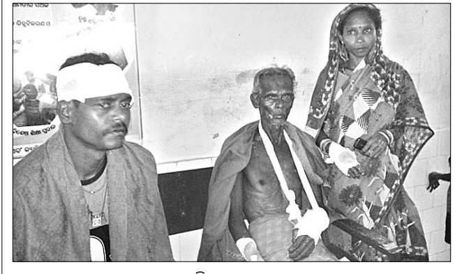
ଆକ୍ରମଣରେ ଆହତ ହୋଇଥିବା ପରିବାର।