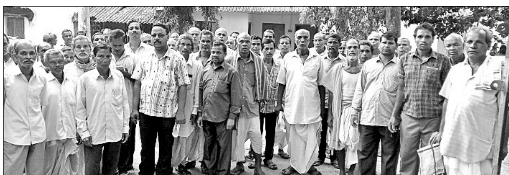
ପଶୁମାଞ୍ଚଳ ରେଞ୍ଜ କାର୍ଯ୍ୟାଳୟ ଘେରାଇ କରିଛନ୍ତି କାକୁଡ଼ିଆ ଗ୍ରାମବାସୀ।

ନରସିଂହପୁର ବ୍ଲକ ଅଞ୍ଚଳର କାକୁଡ଼ିଆ ଗ୍ରାମବାସୀ ଚାଷ ଉପରେ ନିଜର କ୍ଷତିପାତ୍ରାଣି। ସେମାନେ ମହାନଦୀ କୂଳରେ ଧାନ, ଆଖୁ, ଆଳୁ, ରାଶି, ତାଳି ଜାତୀୟ ଫସଲ ଓ ପନି ପରିବା କରି ପରିବାର ଚଳାଇଥାନ୍ତି। ହେଲେ ଦୀର୍ଘଦିନ ହେବ ସେମାନଙ୍କ ଫସଲକୁ ବାରହା ଓ ମାଙ୍କଡ଼ପଲ ପଶୁ ନଷ୍ଟ କରୁଛନ୍ତି।