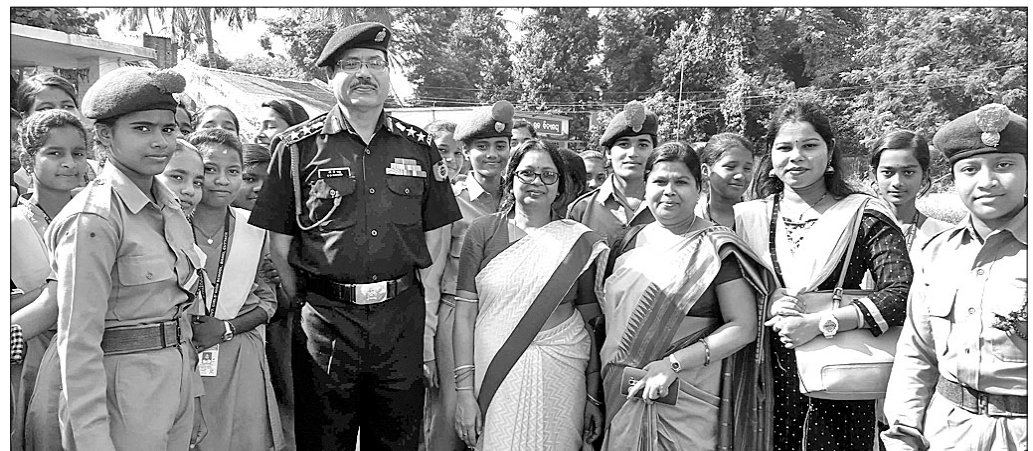
ଛାତ୍ରୀମାନଙ୍କ ଗହଣରେ ମହିଳା ଏନ୍‌ସିସି କମାଣ୍ଡଣ୍ଟ ଅଫିସର ଓ ଅନ୍ୟମାନେ।