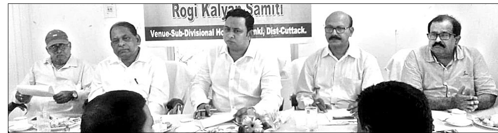
ରୋଗୀ କଲ୍ୟାଣ ସମିତି ବୈଠକରେ ବିଧାୟକ ଓ ଅନ୍ୟ ଅଧିକାରୀ ଉପସ୍ଥିତ।