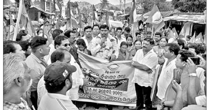
ପଦଯାତ୍ରାରେ ସାମିଲ ହୋଇଥିବା ନେତା ଓ କର୍ମୀମାନେ।

ଆର.ଉଦୟଗିରି, ୩୧୧୧୦(ଡି.ଏନ.ଏ.)-ଆର.ଉଦୟଗିରିରେ ବିଜେଡି ପକ୍ଷରୁ ଜନ ସମ୍ପର୍କ ପଦଯାତ୍ରା ଅନୁଷ୍ଠିତ ହୋଇଯାଇଛି।