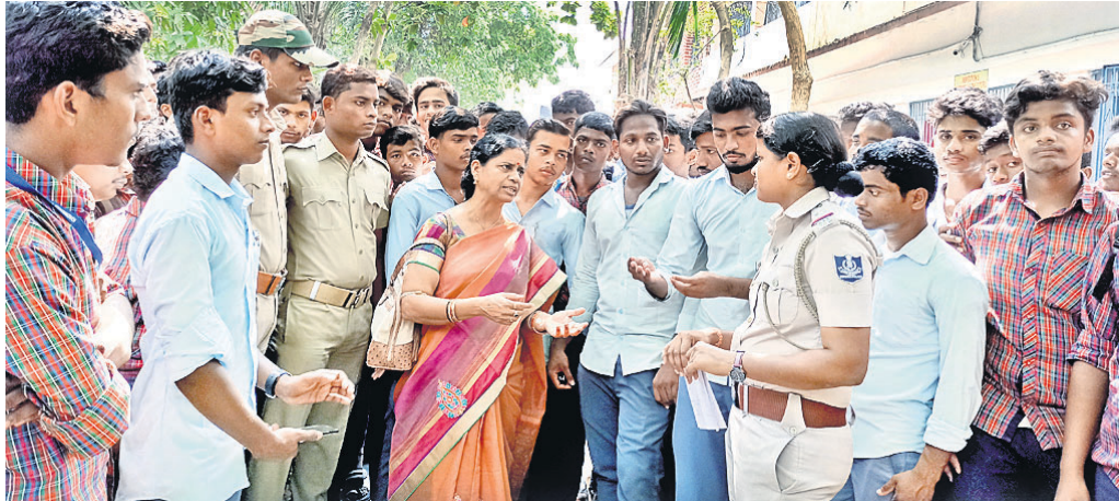
ଛାତ୍ରମାନଙ୍କ ସହ ପୋଲିସ୍ ଅଧିକାରୀ ଓ କଲେଜ ଅଧ୍ୟକ୍ଷ ଆଲୋଚନା କରୁଛନ୍ତି।