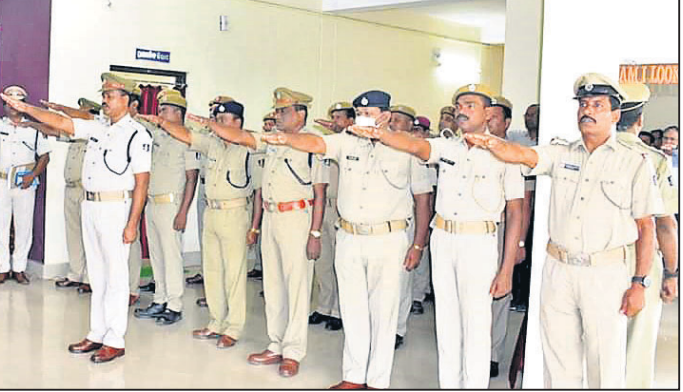
ଶପଥ ପାଠ ହେଉଛି।