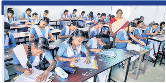
ଅନେକ ବିଦ୍ୟାଳୟରେ ମାତ୍ର ୧୦ପ୍ରତିଶତ ଉତ୍ତୀର୍ଣ୍ଣ ଅର୍ଜନରେ ଉପଲବ୍ଧ ହେଉଛି ପରୀକ୍ଷାଟିଏ ୬୦୨୨ ମାତ୍ର ୬୮ ବିଦ୍ୟାଳୟ ଦେଇଛନ୍ତି ତଥ୍ୟ

ପ୍ରାୟ ଅଧା ଛାତ୍ରୀଛାତ୍ର ଗଣିତରେ ଫେଲ୍ ହୋଇଥିବା ଜଣାପଡ଼ିଛି। ଏହା କେବଳ ଉଚ୍ଚଶିକ୍ଷା ନୁହେଁ, ବରଂ ଗଣିତ ଶିକ୍ଷା ଦେବାକୁ ପଡ଼ିଛି।