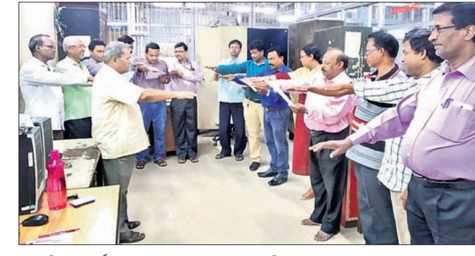
ଡାକ ବିଭାଗ କର୍ମଚାରୀମାନେ ଶପଥ ପାଠ କରୁଛନ୍ତି।

ଭଞ୍ଜନଗରର ବିଭିନ୍ନ କାର୍ଯ୍ୟାଳୟ ଓ ଶିକ୍ଷାନୁଷ୍ଠାନଗୁଡ଼ିକରେ ଗୁରୁବାର ରାଷ୍ଟ୍ରୀୟ ଏକତା ଦିବସ ପାଳନ ହୋଇଛି।