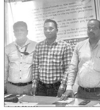
ମୋ ଗାଁରେ ତହସିଲ କାର୍ଯ୍ୟକ୍ରମରେ ତହସିଲଦାର ଓ ଅନ୍ୟମାନେ।

ଶେରଗଡ, ୩୧୧୧୦(ଡି.ଏନ.ଏ.)-ଶେରଗଡ ବ୍ଲକ୍ ତାଳୁକା ଗ୍ରାମ ପଞ୍ଚାୟତରେ ମୋ ନିବେଦନ ଓ ମୋ ଗାଁରେ ତହସିଲ କାର୍ଯ୍ୟକ୍ରମ ଅନୁଷ୍ଠିତ ହୋଇଯାଇଛି।