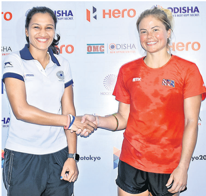
ରାଣୀ ରାମପାଲଙ୍କ ସହ କରମର୍ଦ୍ଦିନ କରୁଛନ୍ତି ଆମେରିକା ଅଧିନାୟିକା କାଥଲିନ୍ ଶାର୍ଟ୍ ।

ସିରିଜ ପାଇଁ ଯୋଜନା କରାଯାଇଛି । ଯେଉଁଠି ଯେଉଁଠି ଅନୁଷ୍ଠିତ ହେବ ତାହା ୧୦-୦ ଗୋଲରେ ରୁଷିଆକୁ ପରାସ୍ତ କରିଥିଲା । ର୍ୟାଲିଙ୍ଗ୍ ଏବଂ ପ୍ରଦର୍ଶନ ଦୃଷ୍ଟିରୁ ଭାରତ ଆଗରେ ରହିଛି । ତେଣୁ ଏଥର ମଧ୍ୟ ଘରୋଇ ଦଳପାଇଁ ସହଜ ହେବ ବୋଲି ଆଶା କରାଯାଉଛି । ଅନ୍ୟପକ୍ଷରେ ଗତ କ୍ରମରେ ଭାରତୀୟ ଦଳ ଅନୁଭବ ହେଉଥିବା ପରିବେଶ ସହିତ ଦଳ ଠିକ୍‌ଭାବେ ଖାପଖୁଆଇବାରେ ଅସୁବିଧା ହୋଇଥିଲା । ମାତ୍ର ଏଥର ପରିବେଶ ସୁଧାରିବା ପାଇଁ ଗୋଟିଏ ପରିସ୍ଥିତିରେ ରୁଷିଆକୁ ଦେଖିବାକୁ ପଡ଼ିବ । ଯଦି ଦଳଟି ଭାରତୀୟ ଦଳକୁ ପରାସ୍ତ କରିବ ତେବେ ଗୋଟିଏ ଖେଳାଳିଙ୍କୁ ଟିକେଟ ପାଇବ । ଗୋଟିଏ ଖେଳାଳିଙ୍କୁ ଟିକେଟ ପାଇବ ତେବେ ଗୋଟିଏ ଖେଳାଳିଙ୍କୁ ଟିକେଟ ପାଇବ । ଗୋଟିଏ ଖେଳାଳିଙ୍କୁ ଟିକେଟ ପାଇବ ତେବେ ଗୋଟିଏ ଖେଳାଳିଙ୍କୁ ଟିକେଟ ପାଇବ ।