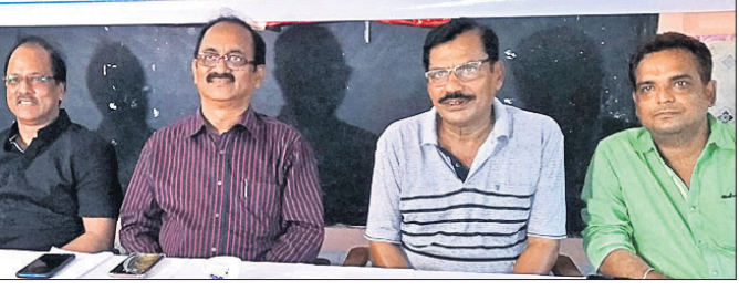
ଆନ୍ତର୍ଦ୍ଧିକ ଗେଟ୍‌ବଲ ଚାଲିଯିବାର ସମ୍ପର୍କରେ ସୂଚନା ଦେବା ଅବସରରେ କର୍ମକର୍ତ୍ତାମାନେ ।

ଭୁବନେଶ୍ୱର, ୩୧୧୦(କ୍ରୀଡ଼ା ପ୍ରତିନିଧି) ଇଣ୍ଡିଆନ ଗେଟ୍‌ବଲ ଯୁନିୟନ (ଆଇଜିୟୁ) ଆନୁକୂଲ୍ୟରେ ଭୁବନେଶ୍ୱରରେ ପ୍ରଥମଥର ପାଇଁ ଆନ୍ତର୍ଦ୍ଧିକ ଗେଟ୍‌ବଲ ଚାଲିଯିବାର ସମ୍ପର୍କରେ ସୂଚନା ଦେବା ଅବସରରେ କର୍ମକର୍ତ୍ତାମାନେ ।