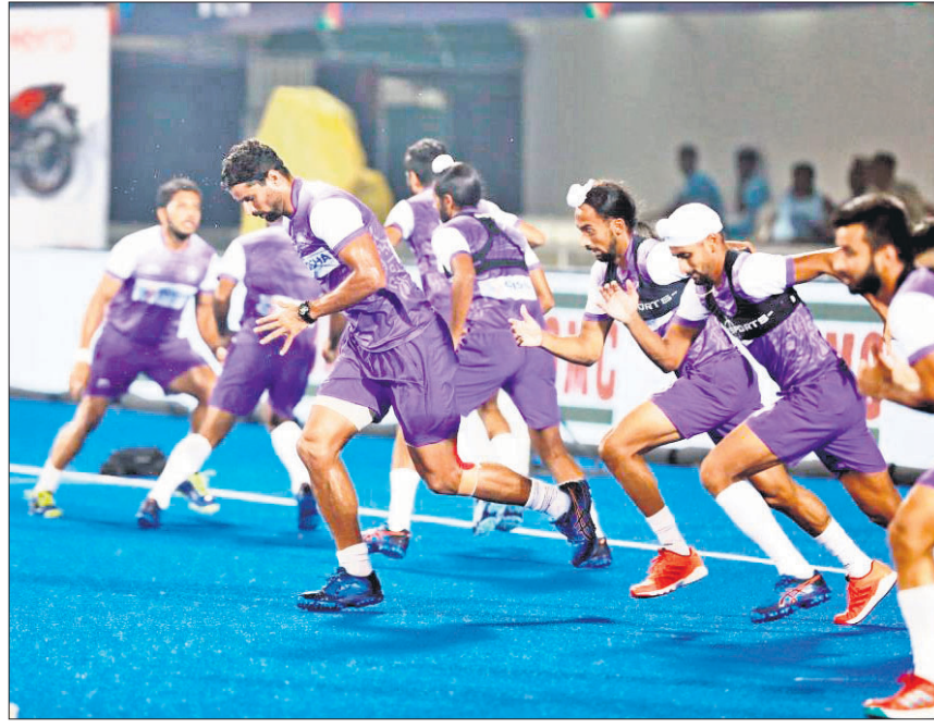
କଳିଙ୍ଗ ଷ୍ଟାଡ଼ିୟମରେ ଗୁରୁବାର ଆମେରିକା ମହିଳା ଓ ଭାରତୀୟ ପୁରୁଷ ହକି ଦଳର ଅଭ୍ୟାସ ।