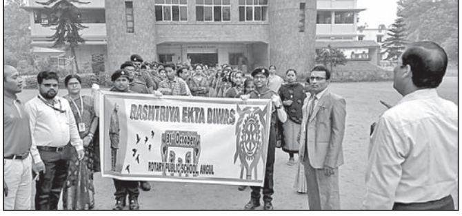
ଅନୁଗୋଳ ରୋଗୀର ପଢ଼ିକ ସ୍ଥଳରେ ଏକତା ଦିବସ ପାଳନ କରାଯାଇଛି।