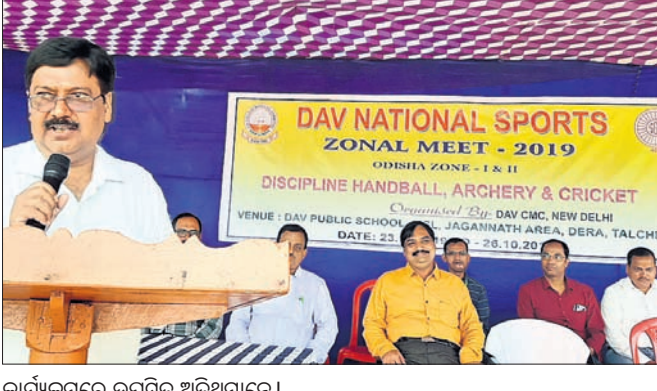
କାର୍ଯ୍ୟକ୍ରମରେ ଉପସ୍ଥିତ ଅତିଥିମାନେ।