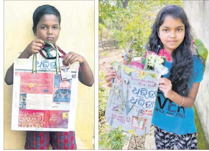
ଆରାଧ୍ୟ ବରାଦ ଚ୍ୟାଟିର୍ଯ୍ୟା ସାଧନାଳ

ଆପଣଙ୍କ ଫଟୋ ଏଠାରେ ସ୍ଥାନିତ ପାଇଁ ପଠାନ୍ତୁ plasticfreeodishadht@gmail.com