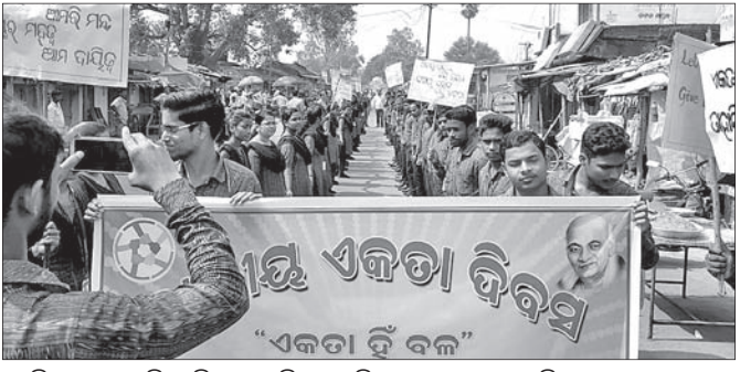
ଛେତିପଦାଠାରେ ଜିଲା ଶିକ୍ଷା ଓ ପ୍ରତିଷ୍ଠା ପ୍ରତିଷ୍ଠାନ ପକ୍ଷରୁ ଏକତା ଦିବସ ପାଳନ।