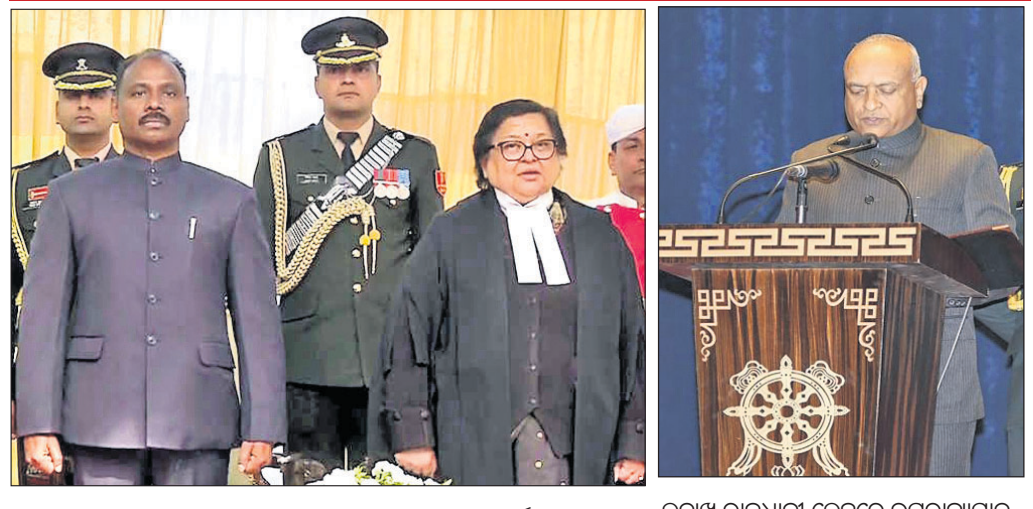
କର୍ମ-କର୍ମର କେନ୍ଦ୍ରଶାସିତ ଅଞ୍ଚଳ ଏଲଜି ଭାବେ ଗୋଟିଏ ଚକ୍ର ପୂର୍ଣ୍ଣ ଉପରାଜ୍ୟପାଳ ପାଠ୍ୟ କରାଯାଇଛି। ଏହି କାର୍ଯ୍ୟକ୍ରମରେ ଲେଡି ଓ କାର୍ଯ୍ୟକାରୀ କାର୍ଯ୍ୟକ୍ରମ ପରିଷଦର ଅଧିକାରୀ, ସେନା ଓ ଅଧିକାରୀଙ୍କ ବାହାରି, ଧାର୍ମିକ ନେତା ଓ ସାଧାରଣ ଜନତା ଉପସ୍ଥିତ ଥିଲେ। ପରେ ମୁଖ୍ୟ ବିଚାରପତି ଶ୍ରୀମନ୍ତ୍ରୀ ଯାଇ

ରାଜ ଭବନରେ ପୂର୍ଣ୍ଣ ଶପଥ ପାଠ୍ୟ କରାଯାଇଥିଲା। ଓଡ଼ିଶା ଜନତା ଦଳର ଗୋଟିଏ ଚକ୍ର ପୂର୍ଣ୍ଣ ୧୯୮୫ ବ୍ୟାପାର ରୁଜୁରାଟ କ୍ୟାଡର ଆଇଏଏସ୍ ଅଧିକାରୀ ପ୍ରଶାସନିକ ଅଧିକାରୀ ଭାବେ କାର୍ଯ୍ୟରତ ଥାଇ ଉପରାଜ୍ୟପାଳ ନିଯୁକ୍ତି ପାଇବାରେ ସେ ହେଉଛନ୍ତି ସମସ୍ତଙ୍କ ପ୍ରଥମ ଅଧିକାରୀ। ଅର୍ଥ ମନ୍ତ୍ରାଳୟରେ ବ୍ୟୟ ବିଭାଗ ସଚିବ