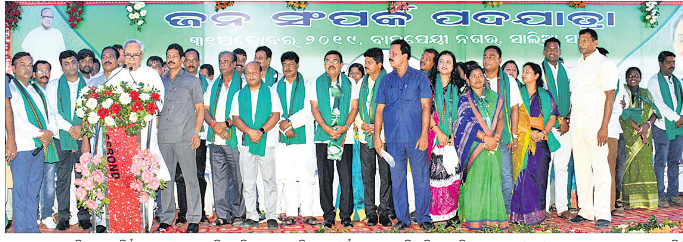
ଭୁବନେଶ୍ୱର ଉତ୍ତର ବିଧାନସଭା ନିର୍ବାଚନମଣ୍ଡଳୀ ପକ୍ଷରୁ ସାହିଆସାହିଠାରେ ଆୟୋଜିତ ଜନସମ୍ମିଳିତ ପଦଯାତ୍ରାରେ ବିଜେଡି ସଭାପତି ତଥା ମୁଖ୍ୟମନ୍ତ୍ରୀ ନବୀନ ପଟ୍ଟନାୟକ ଉଦ୍‌ଘୋଷଣା କରୁଥିବା ଦେଖାଯାଇଛି।