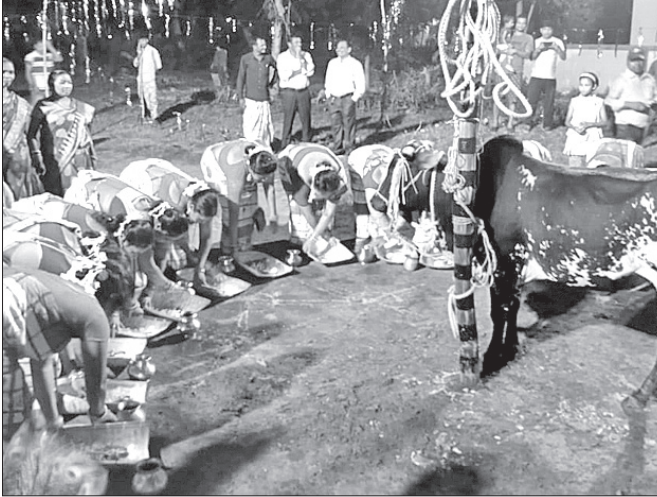
ମହିଳାମାନେ ଗୋମାତା ପୂଜା କରୁଛନ୍ତି।