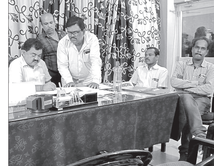
ଉପଜିଲାପାଳ କାର୍ଯ୍ୟ ଅନୁଧ୍ୟାନ କରୁଛନ୍ତି।