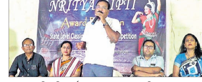
ଲୋକନୃତ୍ୟ ପ୍ରତିଯୋଗିତା କାର୍ଯ୍ୟକ୍ରମରେ ଯୋଗ ଦେଇଥିବା ଅତିଥି ।

ଭଦ୍ରକ ଅଫିସ, ୩୧।୧୦ ଭୁବନେଶ୍ୱରର ନୃତ୍ୟଦିପ୍ତୀ ଫାଉଣ୍ଡେସନ ପକ୍ଷରୁ ଭଦ୍ରକ ସଂସ୍କୃତି ଭବନଠାରେ ପକ୍ଷରୁ ଭଦ୍ରକ ସଂସ୍କୃତି ଭବନଠାରେ ରାଜ୍ୟସ୍ତରୀୟ ଶାସ୍ତ୍ରୀୟ ଓ ଲୋକନୃତ୍ୟ ପ୍ରତିଯୋଗିତା ଅନୁଷ୍ଠିତ ହୋଇଥିଲା । ବିବସ୍ୟାପୀ ଏହି କାର୍ଯ୍ୟକ୍ରମରେ କନିଷ୍ଠ ଓ ବରିଷ୍ଠ ବର୍ଗରେ ବିଭିନ୍ନ ବିଭାଗରେ ପ୍ରତିଯୋଗିତା ହୋଇଥିଲା । ପୁନାମଧ୍ୟମ ନୃତ୍ୟଶିଳ୍ପୀ ଦେବଦିପ୍ତୀ ବିଶ୍ୱାଳଙ୍କ ଆବାହକତ୍ୱରେ ଆୟୋଜିତ ଏହି କାର୍ଯ୍ୟକ୍ରମରେ ବିଧାୟକ ସମ୍ପାଦକ କୁମାର ମଲ୍ଲିକ ପୁଖ୍ୟଅତିଥି ଭାବେ ଯୋଗଦେଇ କଳା ଓ ନୃତ୍ୟର ବିକାଶ ଉପରେ ଆଲୋଚନା କରାଯାଇଥିଲା ।