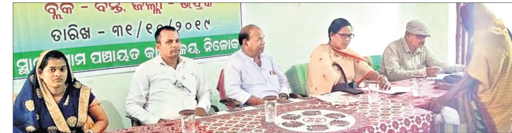
ସମାଧାନ ଶିବିରରେ ଅଧିକାରୀମାନେ ।