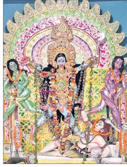
ବାସୁଦେବପୁର କଟକର ବଜାର କାଳୀପୂଜା ମଣ୍ଡପ ।

ଭଦ୍ରକ ଅଫିସ, ୩୧।୧୦ ଭଦ୍ରକ ଐତିହାସିକ କାଳୀପୂଜା ପାଇଁ ଚରଣୀ ଅଞ୍ଚଳ ଝଲିପୁଛି । ଗୁରୁବାର ଥିଲା ପୂଜାର ୫ମ ଦିନ । ଲକ୍ଷାଧିକ ଜନସମାଗମକୁ ନିୟନ୍ତ୍ରଣ କରିବା ପାଇଁ ପୋଲିସକୁ ନାକେଦମ୍ ହେବାକୁ ପଡ଼ିଛି । ପୂର୍ବାହ୍ନୁ ବିଭିନ୍ନ ପୂଜା ମଣ୍ଡପରେ ଅଧ୍ୟାୟକ ଭିଡ଼ ପରିଲକ୍ଷିତ ହୋଇଥିଲା । ପାଗ ଅନୁକୂଳ ଥିବା କାରଣରୁ ବ୍ୟବସାୟୀ ଓ ଆୟୋଜକଙ୍କ ମନରେ ଖୁସି କହିଲେ ନ ସରେ । ପଥରକାଳୀ ଅପେରା ପ୍ରଦର୍ଶନ ପଡ଼ିଆ ନିକଟରେ ମୁଦପଡ଼ିକା ପ୍ରବଳ ଭିଡ଼ ଜମିଥିଲା । ସେହିପରି ପୁରୁଣା ଓ ସଂସ୍କାରୁଚି ପଡ଼ିଆ,