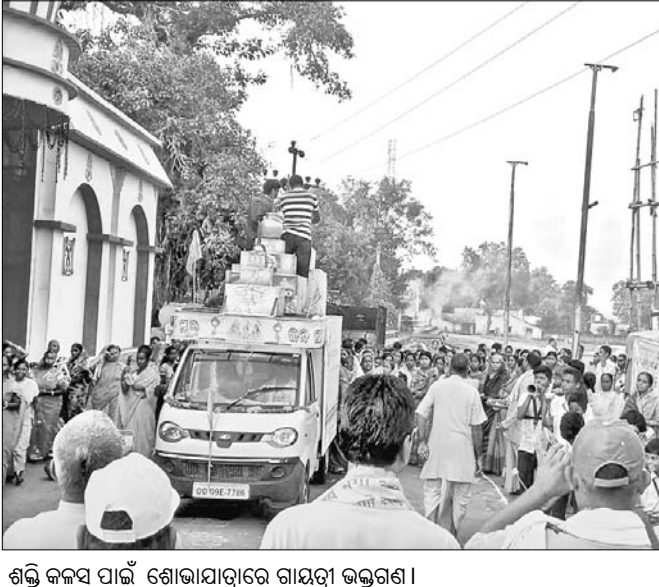
ଶକ୍ତି କଳସ ପାଇଁ ଶୋଭାଯାତ୍ରାରେ ଗାୟତ୍ରୀ ଭକ୍ତଗଣ।