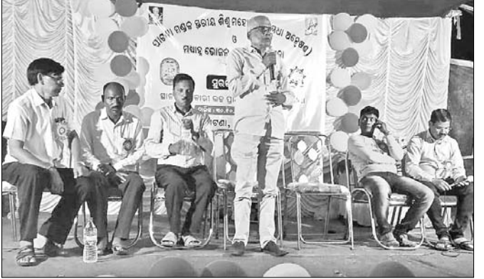
ସୁରଭି କାର୍ଯ୍ୟକ୍ରମରେ ଉପସ୍ଥିତ ଅତିଥି।

ପାଟଣା, ୩୧।୧୦(ସ.ପ୍ର.) ପରିସରରେ ବୁଧବାର ସନ୍ଧ୍ୟାରେ କୁଳ ସୁରଭି ଶିଶୁମହୋତ୍ସବ ସୁରଭିକାର୍ଯ୍ୟକ୍ରମ ୨୯୧୯ ଅନୁଷ୍ଠିତ ହୋଇଯାଇଛି। ଏଥିରେ ପାଟଣା ବ୍ଲକ୍ ଅଧୀନରେ ଥିବା