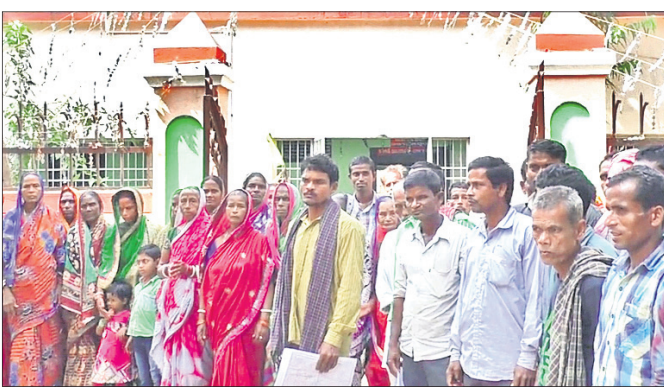
ଥାନା ସମ୍ମୁଖରେ ସେରପୁର ଗାଁ ଲୋକ।

ବହୁ ଉପରୁ ପାଣି ପଡୁଥିବାରୁ ପଥରେ ପଡି ଜଳବିନ୍ଦୁ ଚଳୁଥିବା ବିଭିନ୍ନ ହୋଇ ଲୁହୁଡ଼ିଆ ପରିବେଶ ଓ ସେଥିରେ ଚାରିପଟେ ଆଲୋକ ପଡି ଭାସିଯାଇ ଲୁହୁଡ଼ିଆ ଦୃଶ୍ୟ ମନପୁସ୍ତ କରିଥାଏ। ଯୋଡ଼ା ବୃକ୍ଷର ପ୍ରାକୃତିକ ପରିବେଶ ମଧ୍ୟରେ ଅନ୍ୟ ଏକ ପର୍ଯ୍ୟଟନ କେନ୍ଦ୍ର ହାଣ୍ଡିକାଳା ଜଳପ୍ରପାତ ରହିଛି। ଖଣି ଖାଦ୍ୟର ପ୍ରଭାବରେ ଏହାର ପରିବେଶ ନଷ୍ଟ ହେବାକୁ ବସିଛି। ଖୁମ୍ବୁରା ବୃକ୍ଷ ଅନ୍ତର୍ଗତ ଅଧୁରଖୋଳା ଜଳପ୍ରପାତ, ତେଲକୋଇ ବୃକ୍ଷର ପୁରୁପାଗାଠାଗା, ଯୋଡ଼ା ବୃକ୍ଷର ପିଶାବୁଣୀ, ବାଂଶପାଳ ବୃକ୍ଷର ବାରାଗଡ଼ ପଞ୍ଚାୟତର ଘାଟଗା, ସଦର ବୃକ୍ଷରେ ଗିରିତ୍ରୟ ଜଳପ୍ରପାତର ବିକାଶ କରାଯାଇନଥିବାରୁ ପର୍ଯ୍ୟଟକଙ୍କ ଆଖିଆଳରେ ରହିଯାଇଛି। ସରକାର ଆବିଷ୍କାର ପର୍ଯ୍ୟଟନର ବିକାଶ କଥା କହୁଥିବା ବେଳେ କେନ୍ଦୁଝର ଜିଲ୍ଲାର ଆବିଷ୍କାର ବହୁଳ ଅଞ୍ଚଳରେ ଥିବା ପ୍ରାକୃତିକ ପରିବେଶ ସମୃଦ୍ଧ ଜଳପ୍ରପାତ ଓ ଅନ୍ୟ କେନ୍ଦ୍ର ରୁଚିକର ବିକାଶ କଲେ ଏହା ପରୋକ୍ଷରେ ସେମାନଙ୍କ ବିକାଶରେ ସହାୟକ ହେବ ବୋଲି ମତ ପ୍ରକାଶ ପାଉଛି।