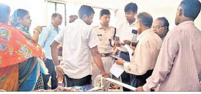
ରୋଗୀ ଓ ସମ୍ପର୍କୀୟଙ୍କ ସହ ଜିଲ୍ଲାପାଳ ଓ ଏସ୍ପି ଆଲୋଚନା କରୁଛନ୍ତି।

ଏବଂ ସେଠାକାର ମେଡିକାଲରେ କୌଣସି ବ୍ୟବଚ୍ଛେଦ କରା ନ ଯିବା ପରିବାର ଲୋକ ଏବଂ ଗ୍ରାମବାସୀଙ୍କୁ ସନ୍ଦେହରେ ପକାଇଥିଲା। ଗ୍ରାମରେ ବୈଠକ ଚକାଯାଇ ଆତ୍ମଲୀଢ଼କୁ ଅଟକ ରଖାଯିବାକୁ ନିଷ୍ପତ୍ତି ନିଆଯିବା ସହ ଖଇରା ଥାନାରେ ଲିଖିତ ଅଭିଯୋଗ କରାଯାଇଥିଲା। ଖଇରା ଥାନାଧିକାରୀଙ୍କ ନିର୍ଦ୍ଦେଶ କ୍ରମେ ଶବକୁ ବ୍ୟବଚ୍ଛେଦ ପାଇଁ ସୋର ପଠାଯାଇଛି। ସେଠାକୁ ଫେରିବା ପରେ ଗ୍ରାମବାସୀଙ୍କ ସହ ଆଲୋଚନା ପରେ ଯାହା କିଛି ନିଷ୍ପତ୍ତି ନିଆଯିବ ବୋଲି ଆଇଆଇସି ଲୋପାପୁରୀ ନାୟକ କହିଛନ୍ତି।