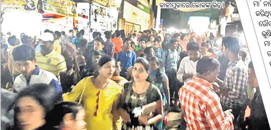
କାଳୀପୂଜାରେ ଲୋକଙ୍କ ଭିଡ଼ ।

ମା' ଭଦ୍ରକାଳୀ ଗୁରୁବାର ଜଗନ୍ନାତ୍ରୀ ବେଶରେ ଦର୍ଶନ ଦେଇଛନ୍ତି । ବେଶରେ ମା'ଙ୍କୁ ଦର୍ଶନ କଲେ ଭକ୍ତଙ୍କ ମାନସିକ ପୂରଣ ହୁଏ ବୋଲି ବିଶ୍ୱାସ ରହିଛି । ଆଦ୍ୟାଶକ୍ତି ମା' ଭଦ୍ରକାଳୀ ସୃଷ୍ଟିର ସମସ୍ତ ଶକ୍ତିର ଅଧିକାରିଣୀ ଜଗତର ପାଳନ କର୍ତ୍ତା । ସମସ୍ତ ଜୀବ, ପ୍ରାଣୀ ଓ ଉଦ୍ଭିଦ ଜଗତ, ଜଳ, ଗ୍ଳାନ ସର୍ବତ୍ର ତାଙ୍କର ସଭା ଉପକାଳ୍ପି ହେଉଛି । ଶୁକ୍ରବାର ମା' ପୂଜାସନା ହୁଏ ବାହନରେ ମହାସରସ୍ୱତୀ ବେଶରେ ଦର୍ଶନ ଦେବେ ।