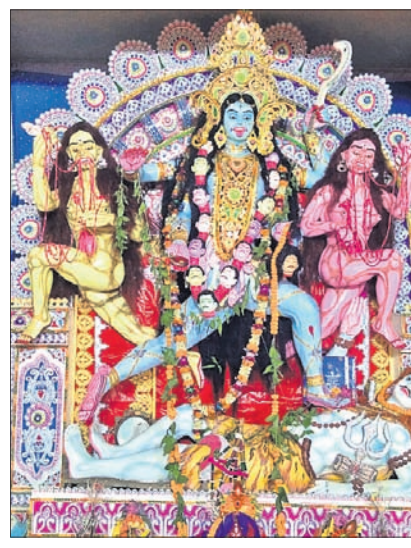
ବାସୁଦେବପୁର ବୁକ ରୋଡ଼ କାଳୀପୂଜା ମଣ୍ଡପ ।