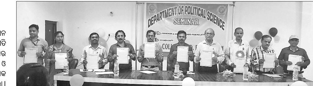
ରାଜନୀତି ବିଜ୍ଞାନ ବିଭାଗ ଆଲୋଚନାଚକ୍ରରେ ଉପସ୍ଥିତ ଅତିଥି।