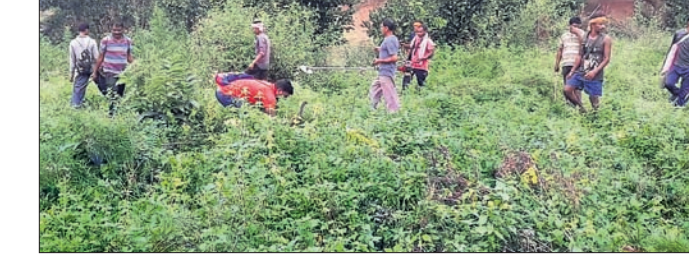
ବେଆଇନ ଗଞ୍ଜେଇ ଗଛ।

ଫିରିଙ୍ଗିଆ, ୧୧୧୧: ଦିନରେ ଫିରିଙ୍ଗିଆ, ବଗାଳି, ଉତ୍ତାମାଞ୍ଚା ଓ କେନ୍ଦ୍ରାପା ଅଞ୍ଚଳରେ ଗଞ୍ଜେଇ ଗଛ କଟାଯାଇଛି। ଏଥିରେ ଅବକାରୀ ବିଭାଗର ୧୦ ଓ ପୋଲିସ ବିଭାଗର ୬୦ କର୍ମଚାରୀ ସାମିଲ ହୋଇଥିଲେ। ଫିରିଙ୍ଗିଆ ରାଓ ଏବଂ ଅବକାରୀ ଇନ୍ଦ୍ରପ୍ରସାଦ ପୁରୁଣା ଆନାରେ ଏ ନେଇ ନଂ.୯୪/୧୯ ଚନ୍ଦ୍ର ଚାଞ୍ଚିକ ନେତୃତ୍ଵରେ ପ୍ରାୟ ୧୦୫ ଏକକ କର୍ମଚାରୀ ଗଞ୍ଜେଇ ଗଛକୁ କାଟି ନଷ୍ଟ କରି ଦିଆଯାଇଛି। ଏହି ଅଭିଯାନର ପ୍ରଥମ