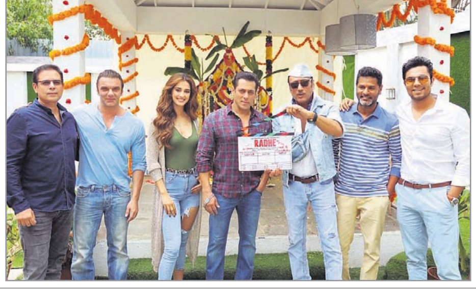
୨୦୨୦ ଇନ୍ଦରେ ଅକ୍ସୟ-ସଲମାନ୍ ଟଙ୍କର