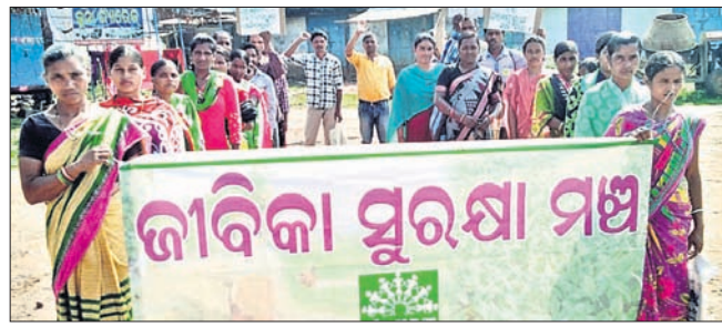
ସଂଗଠନର ସଦସ୍ୟ ଶୋଭାଯାତ୍ରା ବାହାରିଛନ୍ତି।

ଦାରିଙ୍ଗବାଡି, ୧୧୧୧(ଡି.ଏନ.ଏ.): ପୁରୁକ୍ଷା ଯୋଜନାରେ ସାମିଲ ପାଇଁ ଶୁକ୍ରବାର ଆନ୍ଦୋଳନ ସହ ମୁଖ୍ୟମନ୍ତ୍ରୀଙ୍କ ଉଦ୍ଦେଶ୍ୟରେ ଦାବିପତ୍ର ଦାବି ପଡ଼ିଥିବା ପ୍ରକୃତ ହିତାଧିକାରୀଙ୍କୁ ତୁରନ୍ତ ଚିହ୍ନଟ କରି ଜାତୀୟ ଖାଦ୍ୟ