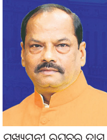
ପୁଷ୍ୟମନ୍ତ୍ରୀ ରଘୁବର ଦାସ