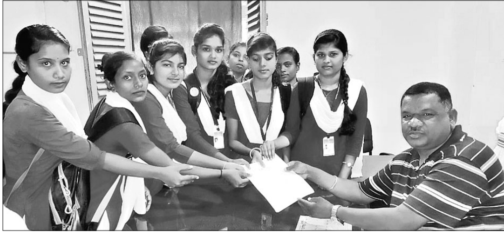
ଛାତ୍ରୀମାନେ ଦାବିପତ୍ର ପ୍ରଦାନ କରୁଛନ୍ତି।

ଭଞ୍ଜନଗର ସାବିତ୍ରୀ ମହିଳା ମହାବିଦ୍ୟାଳୟ ସମ୍ମୁଖରେ ଛାତ୍ରୀମାନେ ରୋମିଓମାନେ ଦୂର ଭୁଲୁଛନ୍ତି। ଛାତ୍ରୀମାନଙ୍କୁ ଯିବାଆସିବାବେଳେ କମେଣ୍ଡ ମାଗୁଛନ୍ତି, ଯାହାକୁ ନେଇ ଛାତ୍ରୀମାନଙ୍କ ମଧ୍ୟରେ ଚାନ୍ଦି ଅସନ୍ତୋଷ ପ୍ରକାଶ ପାଇଛି। କଲେଜ ସମ୍ମୁଖ ରାସ୍ତାଟି ସହରର ଏକ ଗୁରୁତ୍ୱପୂର୍ଣ୍ଣ ରାସ୍ତା ହୋଇଥିବାବେଳେ ଉକ୍ତ ରାସ୍ତାରେ ଗାଡ଼ିଗୁଡ଼ିକ ଦ୍ରୁତ ଗତିରେ ଯାତାୟାତ କରୁଛି। ଛାତ୍ରୀମାନେ କଲେଜକୁ ଭୟଭୀତ ଅବସ୍ଥାରେ ଯାତାୟାତ କରୁଛନ୍ତି। ଗତ ବୁଧବାର ଗାଡ଼ି ଧକ୍କାରେ ଜଣେ ଛାତ୍ରୀ ଆହତ ହୋଇଛନ୍ତି। ତେଣୁ ଗାଡ଼ିଗୁଡ଼ିକର ବେଗ ନିୟନ୍ତ୍ରଣ ପାଇଁ କଲେଜ ସମ୍ମୁଖରେ ସିଡ୍ ବ୍ରେକର ବ୍ୟବସ୍ଥା କରାଯାଉ। କଲେଜ ନିକଟରେ ଲୋକେ ଘରୁ ଓ ଦୋକାନରୁ ବାହାରୁଥିବା ମଇଳା ଆଣି ପକାଇଛନ୍ତି। ଏହାଦ୍ୱାରା