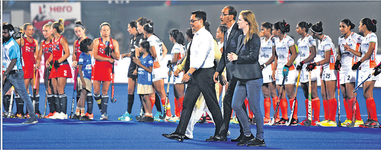
କଳିଙ୍ଗ ଷ୍ଟାଡ଼ିୟମରେ ଏଫଆଇଏଚ୍ ଅଲିମ୍ପିକ୍ କ୍ୱାଲିଫାୟର୍ସ ହକିର ଉଦ୍‌ଘାଟନା ଦିବସ ଅବସରରେ ସାଂସ୍କୃତିକ କାର୍ଯ୍ୟକ୍ରମ। ଅତିଥି ଓ ଖେଳାଳିମାନେ।