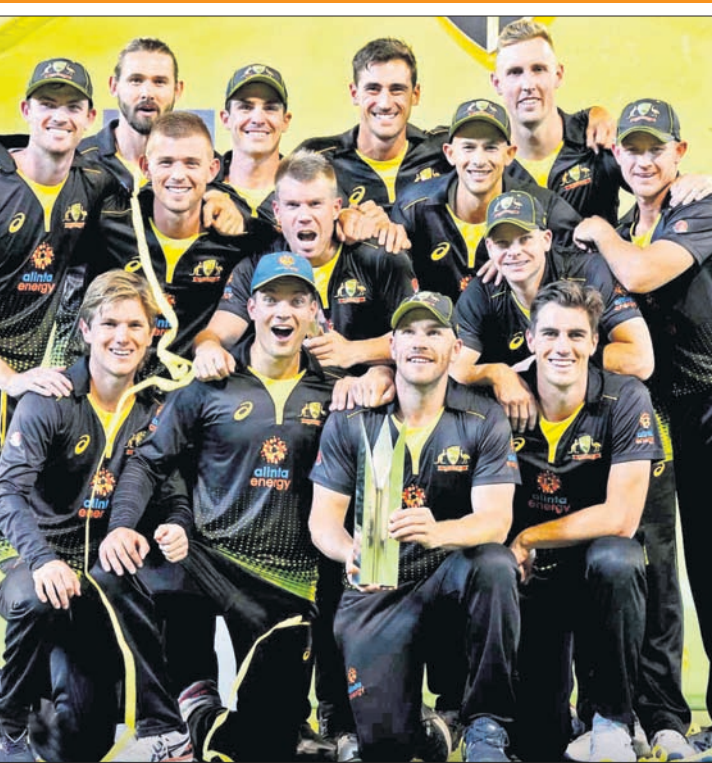
ଟ୍ରଫି ସହ ସିରିଜ ବିଜୟ ଅଷ୍ଟ୍ରେଲିଆ ଦଳ।

ଫ୍ଲୋର ଅଫ୍ ଦି ମ୍ୟାଚ୍, ସିରିଜ ଟ୍ରଫି ସହ ସିରିଜ ବିଜୟ ଅଷ୍ଟ୍ରେଲିଆ ଦଳ।