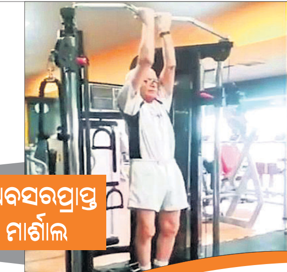
ଚର୍ଚ୍ଚାରେ ଅବସରପ୍ରାପ୍ତ ଏୟାର ମାର୍ଶାଲ୍