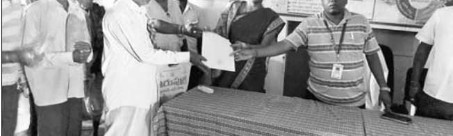
ହିତାଧିକାରୀଙ୍କୁ ପକ୍ଷା ବନ୍ଧନ କରାଯାଇଛି।