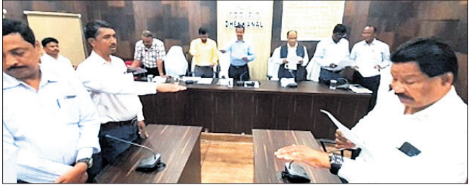
ଦେବାନାଳ ଅଫିସ, ୧୧୧୧

ଅନ୍ୟତା ଭୋଗବିଳାସକୁ ଦେଖି ଆକର୍ଷିତ ହେବା ବୁଦ୍ଧିମାନ ପରିଚୟ ନୁହେଁ। ଭୋଗବିଳାସକୁ ପଛରେ ଛାଡ଼ି ଆତ୍ମ ସଂଯମା ହେଲେ ଦୁର୍ନୀତିରୁ ବାଚସ୍ପତି କର୍ମ କରିବା ସମ୍ଭବ।