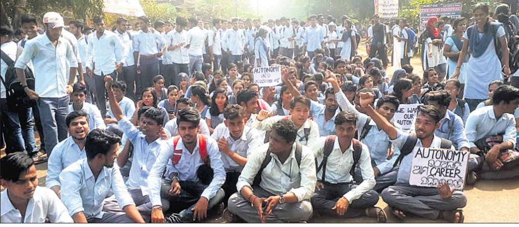
ଛାତ୍ରାଛାତ୍ରୀମାନେ ଧାରଣାରେ ବସିଛନ୍ତି ।