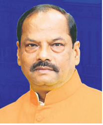
ପୁଷ୍ୟମନ୍ତ୍ରୀ ରଘୁବର ଦାସ

ଭିଡ଼ିଫିଆ, ଅପରାଧ ବୃଦ୍ଧି ରମ୍ଭୁବରଙ୍କ ମୁଣ୍ଡବ୍ୟଥା ମହାମେଣ୍ଟରେ ଆସନ ଭାଗବତ୍ୟାଙ୍କୁ ନେଇ ମତଭେଦ ହେମନ୍ତଙ୍କୁ ନେତା ମାନ୍ୟତା ଦାବି କରାଯାଇଛି।