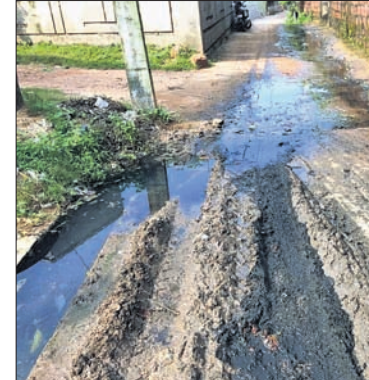
କର୍ତ୍ତୃପକ୍ଷ ଦିନ ଗଢ଼ାଇ ଚାଲିଛନ୍ତି । ଅଞ୍ଚଳବାସୀ ନିର୍ଦ୍ଧାରିତ ସମୟରେ ହୋଇଛି ଟ୍ୟାଙ୍କ ପୌଠ କରୁଛନ୍ତି । ତଥାପି କାର୍ଯ୍ୟ ସମାପନକୁ ଉପେକ୍ଷିତ କରାଯାଉଛି ବୋଲି ଲୋକମାନେ ପ୍ରଶ୍ନ କରିଛନ୍ତି । ସମସ୍ୟା ସମାଧାନ ନ ହେଲେ ପୁଞ୍ଜିତ ଅବତୋଷ ଜନଆନ୍ଦୋଳନରେ ପରିଣତ ହେବ । ଏଥିପାଇଁ ପୌର କର୍ତ୍ତୃପକ୍ଷ ଦାୟୀ ରହିବେ ବୋଲି ଖାର୍ଚ୍ଚବାସୀ କହିଛନ୍ତି ।

ରାଜ୍ୟ ଗୃହ ଓ ନଗର ଉନ୍ନୟନ ବିଭାଗ ପକ୍ଷରୁ ଦେଢ଼ାମାଲକୁ ମିଳିଛି ଆଦର୍ଶ ସହରର ମାନ୍ୟତା । ଲକ୍ଷ୍ମୀପୁରା ଅବସରରେ ଆୟୋଜିତ ଜାତୀୟସ୍ତରୀୟ ସରସମେଳା ଉଦ୍‌ଘାଟନା ସମାରୋହରେ ସ୍ଵଚ୍ଛତା ରକ୍ଷା ଦିଗରେ ଉତ୍କଳଜାତୀୟ ଅବଦାନ ପାଇଁ ପୁରସ୍କୃତ ହୋଇଛି ପୌରସଂସ୍ଥା । ହେଲେ ୩୩୦ ଖର୍ଚ୍ଚ ଫିଟିଣ୍ଡିଂ ଟ୍ୟାଙ୍କ ଗଢ଼ିବା ଆଦର୍ଶ ସହରର ବାସ୍ତବ ଚିତ୍ର ପଦାରେ ପଡ଼ିଛି । ଫଳରେ ସ୍ଵଚ୍ଛତା କାର୍ଯ୍ୟକ୍ରମ କେବଳ କାର୍ଯ୍ୟକ୍ରମରେ ସୀମିତ ବୋଲି ବୁଦ୍ଧିଜୀବୀମାନେ କହିଛନ୍ତି ।