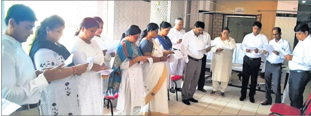
କର୍ମଚାରୀମାନେ ଶପଥ ପାଠ କରୁଛନ୍ତି ।