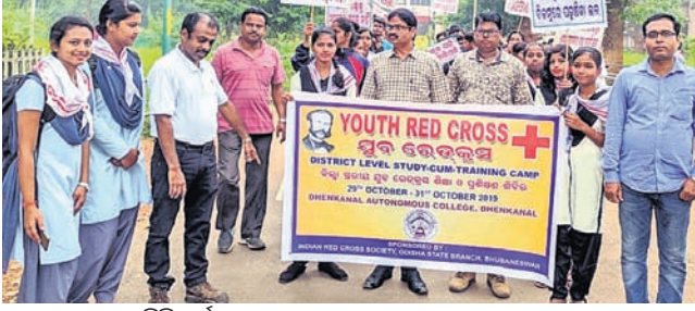
ଶୋଭାଯାତ୍ରାରେ ଶିବିରାଠାଙ୍କ ସମେତ ଅନ୍ୟମାନେ ।