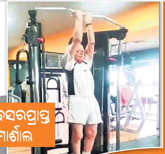
ଚର୍ଚ୍ଚାରେ ଅବସରପ୍ରାପ୍ତ ଏୟାର ମାର୍ଶାଲ୍