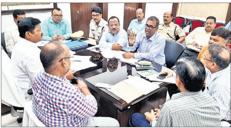
ବୈଠକରେ ଉପସ୍ଥିତ ମନ୍ତ୍ରୀ ଓ ଅଧିକାରୀମାନେ।