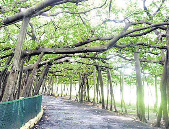
କୋଲକାତା: ଭାରତରେ ରହିଛି ବିଶ୍ୱର ବୃହତ୍ ବଜାର। କୋଲକାତାର ଆଚାର୍ଯ୍ୟ ଜଗଦୀଶ୍ ଚନ୍ଦ୍ର ବୋଷ ବ୍ୟବସାୟ ଗାଡ଼ିରେ ଏକ ବିଶାଳକାୟ ବରଗଛ ରହିଛି। ଯାହାର ନାମ ବ୍ରେଡ୍ ବାନିୟନ ଟ୍ରା। ଏହି ଗଛକୁ ବହୁ ପର୍ଯ୍ୟଟକ ଦେଖିବାକୁ ଆସିଥାନ୍ତି। ଏହି ଗଛଟି ୨୫୦ ବର୍ଷ ତଳର। ଏହାର ବିଶାଳକାୟ ଆକାର ଓ ଅଧାଧାରଣା ସଂଖ୍ୟାରେ ଶାଖା ତିରା ମେଲିଥିବା ଦେଖାଯାଏ। ୧୮୬୪ ମସିହା ଓ ୧୮୬୭ ମସିହାରେ ବୁକ୍ ରେକର୍ଡ ବିଶାଳକାୟ ବାଟୋଲୁ ସାମ୍ରାଜ୍ୟ କରିଛି ଏହି ଗଛ। ବର୍ତ୍ତମାନ ଏହା ଶୀର୍ଷ ପରିଧିର ବୃଷ ଭାବେ ୪୮୯ ମିଟର ଯାଏ ରହିଛି। ଏହାର ବିଶାଳ ଶାଖାର ଉଚ୍ଚତା ୨୪.୫ ମିଟର।