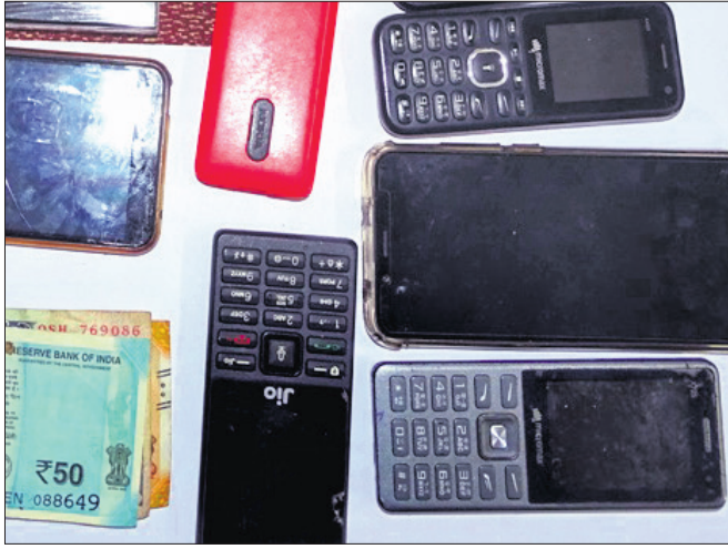
ପୋଲିସ୍ ଠାରୁ ଜମା ହୋଇଥିବା ଏକ ମୋବାଇଲ୍ ଫୋନ୍ ଓ ଏକ ସିମ୍ କାର୍ଡ।

ବଲାଙ୍ଗୀର ସହର ଭାମବୋଇ ମେଡିକାଲ କଲେଜ ନିକଟରେ ଗୋପନୀୟତା ଉଲ୍ଲଙ୍ଘନ କରାଯାଇଥିବା ସମ୍ବନ୍ଧରେ ପୋଲିସ୍ ଥାନାରେ ଏକ କେସ୍ ରେଜିଷ୍ଟର କରାଯାଇଛି।