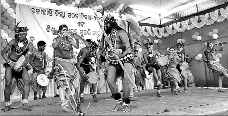
ଜିଲ୍ଲା ଗଠନ ଦିବସରେ ପରିବେଷିତ ସାଂସ୍କୃତିକ କାର୍ଯ୍ୟକ୍ରମ ।