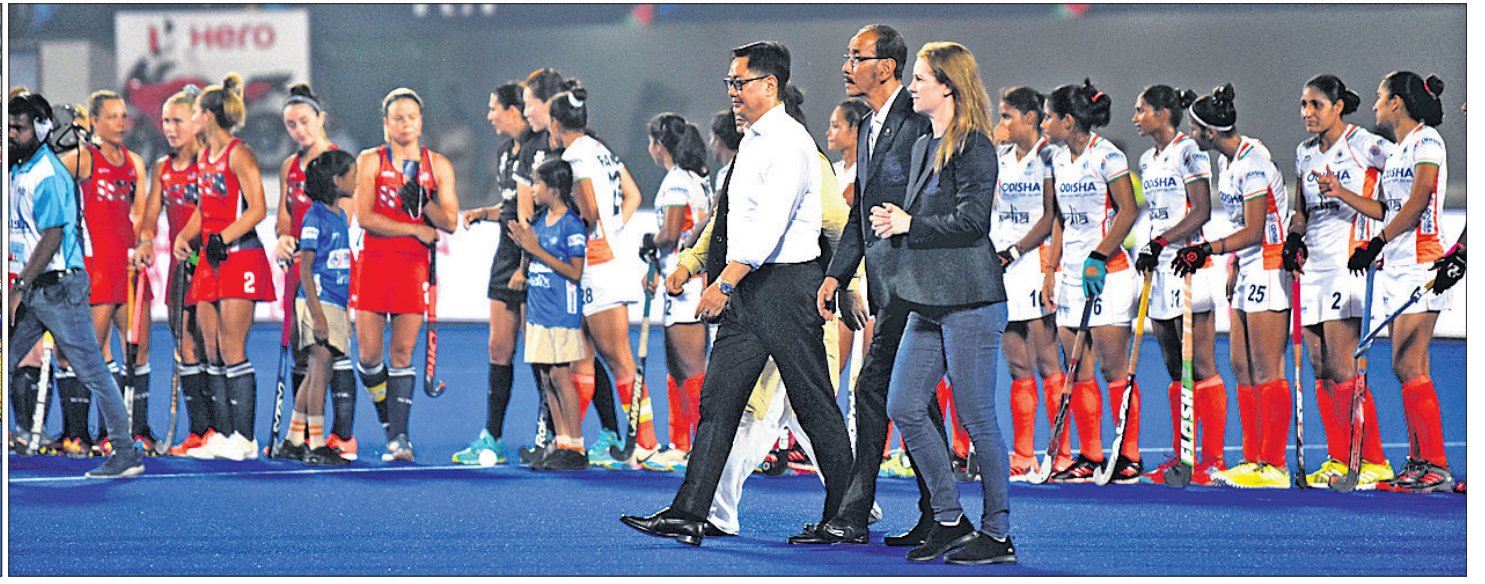
କଳିଙ୍ଗ ଷ୍ଟାଡ଼ିୟମରେ ଏଫଆଇଏଚ୍ ଅଲିମ୍ପିକ୍ କ୍ୱାଲିଫାୟର୍ସ ହକିର ଉଦ୍‌ଘାଟନା ଦିବସ ଅବସରରେ ସାଂସ୍କୃତିକ କାର୍ଯ୍ୟକ୍ରମ। ଅତିଥି ଓ ଖେଳାଳିମାନେ।