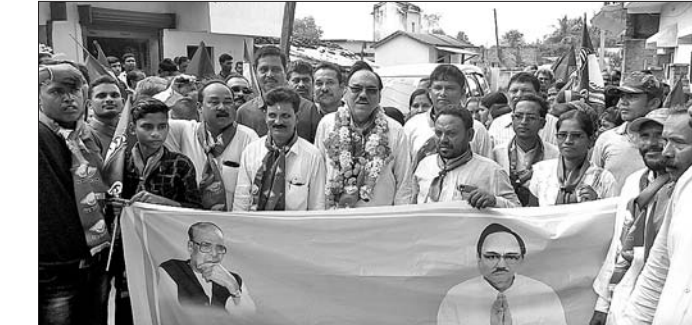
ଜୟଜ୍ଞାନଗର ପଡ଼ାରେ ବିଜେଡିର ଶୋଭାଯାତ୍ରା।