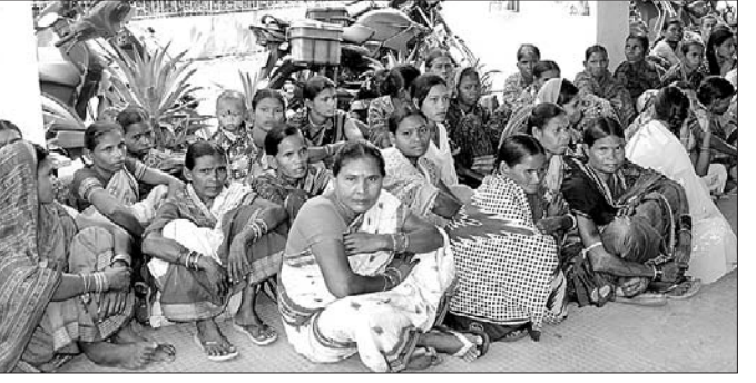
ସମ୍ବଲପୁର ଜିଲ୍ଲାପାଳଙ୍କ ଅଧିକାରୀଙ୍କୁ ସମ୍ବଲପୁରରେ ଭାବପୂର୍ଣ୍ଣ ବିଶେଷ ପ୍ରଦର୍ଶନ କରୁଛନ୍ତି ।

ସମ୍ବଲପୁର ଜିଲ୍ଲା ମାନେଶ୍ୱର ତହସିଲ ଝାଙ୍କବାହାଲ ଗ୍ରାମକୁ ସରକାର ରାଜସ୍ୱ ଗ୍ରାମ ଭାବେ ସ୍ୱୀକୃତି ପ୍ରଦାନ କରିଛନ୍ତି । ହେଲେ ଏହାକୁ ବହୁଆପାଲି ଗ୍ରାମବାସୀ ବିରୋଧ କରୁଛନ୍ତି । ପୂର୍ବରୁ ଝାଙ୍କବାହାଲ ବହୁଆପାଲି ଗ୍ରାମରେ ମିଶି ରହିଥିଲା । ବହୁଆପାଲି ଗ୍ରାମବାସୀଙ୍କ ସହ ବିଂଦକ କରି ଆପୋଷ ରୁଖିମଣା କରିବାକୁ ଆଲୋଚନା କରାଯାଇଥିଲା । ହେଲେ ସେମାନେ ରାଜି ହେଇ ନାହାନ୍ତି ।