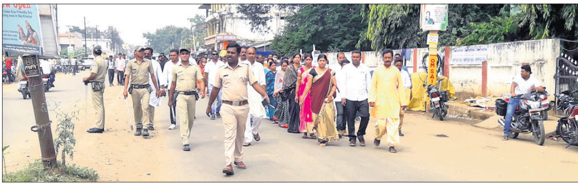
ଅନାୟା ଭୋଟ ପାଇଁ ସଭ୍ୟସଭ୍ୟ ପଦ୍ମଆରରେ ଆସୁଛନ୍ତି ।