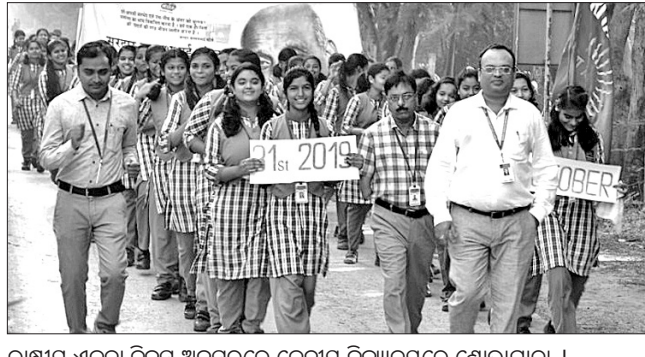
ରାଷ୍ଟ୍ରୀୟ ଏକତା ଦିବସ ଅବସରରେ କେନ୍ଦ୍ରୀୟ ବିଦ୍ୟାଳୟରେ ଶୋଭାଯାତ୍ରା ।

ଭେଙ୍ଗେନ ବ୍ଲକ୍ ଅନ୍ତର୍ଗତ ଜାଣୋଲ ଖେଳ ପଡ଼ିଆରେ ପାଞ୍ଚଦିନ ଧରି ଚାଲିଥିବା ନକଆଉଟ ଫୁଟବଲ ଟୁର୍ନାମେଣ୍ଟରେ ବାରୁପାଲି ଦଳ ଚାମ୍ପିୟନ ହୋଇଛି । ବୀର ପୁରୁଷ ଯାଏ ମୁକ୍ତ ସଂଘ ଆନୁକୂଲ୍ୟରେ ହୋଇଥିବା ଏହି ପ୍ରତିଯୋଗିତାରେ ଶୁକ୍ରବାର ଅପରାହ୍ନରେ ଖେଳାଯାଇଥିବା ଫାଇନାଲ ମ୍ୟାଚରେ ବିଜୟୀ ଦଳ ଜାଣୋଲ ଦଳକୁ ୨-୦ ଗୋଲ ଖସାଇଥିଲେ ।