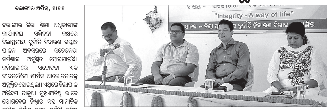
ଜିଲ୍ଲାପ୍ରଧାନୀୟ ଦୁର୍ନୀତି ନିବାରଣ ସପ୍ତାହ ପାଳନ ଅବସରରେ ମହାସଭା ଅତିଥି ।