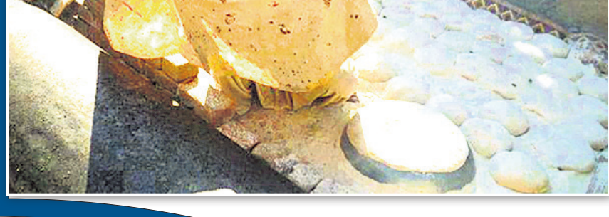
ନୂଆଦିଲ୍ଲୀ: ସାଧାରଣତଃ ଆପଣମାନେ ଚୁଲି ରୁଟି ବା ଚନ୍ଦୁରି ରୁଟି କଥା ଶୁଣିଥିବେ ଏବଂ ଖାଇଥିବେ। ହେଲେ କେବେ ଚାନ୍ଦୁରି ରୁଟି କଥା ଶୁଣିଛନ୍ତି କିମ୍ବା ଖାଇଛନ୍ତି କି ? ଶୁଣିଲା ବେଳକୁ କଥାଟା ଅଦୂର। ଲାଗୁଥିବ, ହେଲେ କଥାଟି ସତ। ବର୍ତ୍ତମାନ ସୋସିଆଲ ମିଡିଆରେ ଏକ ଭିଡିଓ ଭାଇରାଲ ହୋଇଛି। ଯେଉଁଥିରେ ରୁଟିର ଆକାରକୁ ଦେଖିଲେ ଆଶ୍ଚର୍ଯ୍ୟ ଲାଗୁଛି। ଏହି ଗୋଟିଏ ରୁଟିରେ ପୁରା ପରିବାରର ପେଟ ଭରି ହୋଇଯିବ ବୋଲି ସୋସିଆଲ ମିଡିଆରେ ଚର୍ଚ୍ଚା ହେଉଛି। ତାହା ପୁଣି ଗୋଟିଏ ପାକିସ୍ତାନୀ ପରିବାରର ବୋଲି କୁହାଯାଇଛି। ଦେଖି ମନେହୁଏ ଏହି ଭିଡିଓକୁ ବ୍ୟବସାୟୀ ହର୍ଷ ଗୋଏଙ୍କା ଶେୟାର କରିଛନ୍ତି। ଶେୟାରର କିଛି ସମୟ ଭିତରେ ଏହାକୁ ୫୦ହଜାରରୁ ଊର୍ଦ୍ଧ୍ୱ ଯୁଗ୍ମ ଦେଖିବା ସହ ବହୁ ମତାମତ କମେଣ୍ଟ ମଧ୍ୟ ଦେଇଛନ୍ତି। ଉକ୍ତ ଭିଡିଓରେ ଜଣେ ବ୍ୟକ୍ତି ନିଜ ହାତରେ ଅତି ଲୈଖକତାର ସହ ରୁଟି କରୁଥିବାର ଦେଖିବାକୁ ମିଳିଛି। ଏହି ରୁଟି ଘରର ଖଟ ଆକାରର ହୋଇଥିବାରୁ ଏହାକୁ ଚାନ୍ଦୁରି ରୁଟି ବୋଲି କୁହାଯାଉଛି। ଏହାକୁ ପ୍ରଯୋଜନା କରୁଥିବା ବେଳେ ନିର୍ଦ୍ଦେଶନା ଦେବେ ପ୍ରଭୁଦେବୀ। ପୂର୍ବରୁ ସଲମାନ୍ ଓ ପ୍ରଭୁଦେବୀ 'ଫାଣ୍ଡେ'ରେ ଏକାଠି କାମ କରିଛନ୍ତି। ସଲମାନ୍ଙ୍କ 'ଦବଙ୍ଗ-୩'ରେ ମଧ୍ୟ ପ୍ରଭୁଦେବୀ ନିର୍ଦ୍ଦେଶନା ଦେଇଛନ୍ତି। ଉଲ୍ଲେଖଯାଉ କି, ଆସନ୍ତାବର୍ଷ ଇନ୍ଦରେ ସଲମାନ୍ ଓ ଆଲିୟାଙ୍କ ଫିଲ୍ମ 'ଇନ୍ଦିଆଲ୍' ରିଲିଜ୍ ହେବାର ଥିଲା। କିନ୍ତୁ ନିର୍ଦ୍ଦେଶନା ସମ୍ପନ୍ନ ଲୀଲା ଭଣ୍ଡାଳୀ ଏହାର ଶୁଟିଂ ଆଧାରୁ ବନ୍ଦ କରିଦେଇଥିଲେ। ୨୦୨୦ ଇନ୍ଦରେ ସଲମାନ୍ଙ୍କ 'ରାଧେ' ଓ ଅକ୍ସନ କୁମାରଙ୍କ 'ଲକ୍ଷ୍ମୀବତ୍ସ' ଏକାଠି ବଡ଼ ପରଦାରେ ପୁଲିଭାତ କରିବ। ଏହି ଫିଲ୍ମରେ ଅକ୍ସନ କୁମାର ଜଣେ କିନ୍ନର ଭୂମିକାରେ ନଜର ଆସିବେ। ତାଙ୍କ ବିପକ୍ଷରେ 'କବୀର ସିଂ' ଆକ୍ସେସ୍ କିଆରୀ ଆତରାମୀ ଅଭିନୟ କରିଛନ୍ତି।