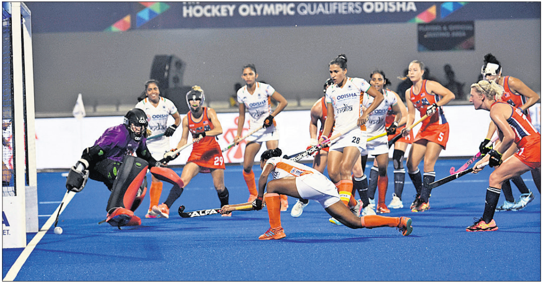
କଲିଙ୍ଗ ଷ୍ଟାଡ଼ିୟମରେ ଶୁକ୍ରବାର ଅନୁଷ୍ଠିତ ଆମେରିକା ବିପକ୍ଷ ଏଫଆଇଏସଏ ଅଲିମ୍ପିକ୍ କ୍ୱାଲିଫାୟର୍ସ ମହିଳା ହକି ମ୍ୟାଚରେ ଭାରତୀୟ ଖେଳାଳି ଗୋଲ ଦେବାକୁ ପ୍ରୟାସ କରୁଛନ୍ତି। ଏହି ମ୍ୟାଚରେ ଭାରତ ୫-୧ ଗୋଲରେ ବିଜୟ ଲାଭ କରିଛି। (ରିପୋର୍ଟ: ଖେଳ ପୃଷ୍ଠାରେ)

କରାଯିବ। ସମସ୍ତ ୫ ପର୍ଯ୍ୟାୟ ନିର୍ବାଚନ ପାଇଁ ବିଜୁପ୍ରକାଶ, ନାମାକନପତ୍ର ଦାଖଲ, ଯାଞ୍ଚ ଓ ପ୍ରାର୍ଥପତ୍ର ପ୍ରତ୍ୟାହାର ଲାଗି ଭିନ୍ନ ଭିନ୍ନ ତାରିଖ ଧାର୍ଯ୍ୟ କରାଯାଇଛି। ୮୧ ଆସନରେ ଡିସେମ୍ବର ୨୩ରେ ଭୋଟ ଗଣତି ହେବାକୁ ଥିବାବେଳେ ନିର୍ବାଚନ ପ୍ରକ୍ରିୟା ୨୯ରେ ଶେଷ ହେବ। ରାଜ୍ୟର ୨୪ ଜିଲ୍ଲା ମଧ୍ୟରୁ ୧୩ ଜିଲ୍ଲାରେ ମାଓବାଦୀ ସମସ୍ୟାକୁ ଦୃଷ୍ଟିରେ ରଖି ବ୍ୟାପକ ପ୍ରସ୍ତୁତି କରାଯାଇଛି। ୬୭ ନିର୍ବାଚନପଞ୍ଚକାରେ ମାଓବାଦୀଙ୍କ ପ୍ରଭାବ ସର୍ବାଧିକ। ବାମ କଠୋରପନ୍ଥାକ ମୁକାବିଲା ପାଇଁ ସ୍ୱତନ୍ତ୍ର ବଳ ଗଠନ କରାଯିବ ବୋଲି ସିଇସି କହିଛନ୍ତି। ଶାନ୍ତିଶୃଙ୍ଖଳା ସହ ନିର୍ବାଚନ କରାଇବା ପାଇଁ ରାଜ୍ୟ ସରକାର କେନ୍ଦ୍ରକୁ ୨୫୦ କମ୍ପାନୀ ଅର୍ଦ୍ଧସାମରିକ ବଳ ମାଗିଛନ୍ତି। (ନିର୍ବାଚନ ପ୍ରକ୍ରିୟା ତାରିଖ ସାବଣୀ: ପୃଷ୍ଠା-୪)