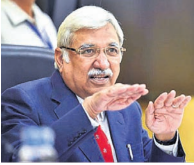
ସିଇସି ସୁନୀଲ ଆରୋରା

ଭାରତୀୟ ଶାସିତ ଝାଡ଼ଖଣ୍ଡରେ ନଭେମ୍ବର ୩୦ରୁ ଡିସେମ୍ବର ୨୦ ମଧ୍ୟରେ ପାଞ୍ଚଟି ପର୍ଯ୍ୟାୟରେ ବିଧାନସଭା ନିର୍ବାଚନ ହେବ। ଡିସେମ୍ବର ୨୨ରେ ବୃତ୍ତୀୟ, ୧୨ରେ ବୃତ୍ତୀୟ ଓ ୧୬ରେ ଚତୁର୍ଥ ପର୍ଯ୍ୟାୟ ଭୋଟ ଗ୍ରହଣ କରାଯିବ। ଡିସେମ୍ବର ୨୩ରେ ସମସ୍ତ ୮୧ ଆସନରେ ଭୋଟ ଗଣତି କରାଯିବ ବୋଲି ଶୁକ୍ରବାର ପୂର୍ଣ୍ଣ ନିର୍ବାଚନ କମିଶନର (ସିଇସି) ସୁନୀଲ ଆରୋରା ଘୋଷଣା କରିଛନ୍ତି। ସିଇସିଙ୍କ ଏହି ଘୋଷଣା ପରେ ମାଓବାଦୀ ପ୍ରଭାବିତ ଏହି ରାଜ୍ୟରେ ତତ୍କାଳ ଆଦର୍ଶ ଆଚରଣ ବିଧି ଲାଗୁ ହୋଇଛି। ନୂଆଦିଲ୍ଲୀର ନିର୍ବାଚନ ସଦନରେ ଆୟୋଜିତ ଏକ ଖବରଦାତା ସମ୍ମିଳନୀରେ ସିଇସି