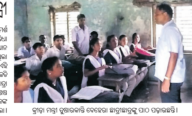
କ୍ରୀଡ଼ା ମନ୍ତ୍ରୀ ରୁଷାରକାନ୍ତି ବେହେରା ଛାତ୍ରାଛାତ୍ରୀଙ୍କୁ ପାଠ ପଢ଼ାଇଛନ୍ତି।

ଅଭ୍ୟାସ କରିବାକୁ ଛାତ୍ରାଛାତ୍ରୀଙ୍କୁ ମନ୍ତ୍ରୀ ପରାମର୍ଶ ଦେଇଥିଲେ। ପରେ ବିଦ୍ୟାଳୟର ଫୁଟିବା ଅନୁଭବ କରିବା ପାଇଁ ସମସ୍ତଙ୍କୁ ମନ୍ତ୍ରୀ ଛାତ୍ରାଛାତ୍ରୀ ଓ ପ୍ରଧାନ ଶିକ୍ଷକଙ୍କୁ ମୁକାବିଲା କରିବାକୁ ପରାମର୍ଶ ଦେଇଥିଲେ।