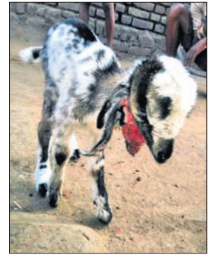
୪ଟି କାନ ଥିବା ଛେଳି ଛୁଆ ।