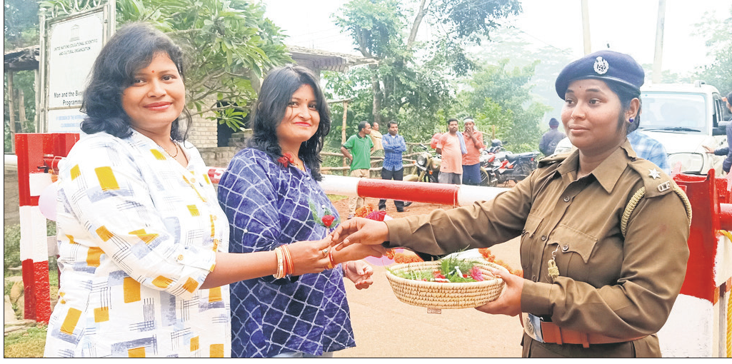
ଗୋଲାପ ପୁଲ ଦେଇ ପର୍ଯ୍ୟଟକଙ୍କୁ ସାଗତ କରାଯାଇଛି।

■ ଗୋଲାପ ପୁଲ ଦେଇ ସାଗତ କରାଯାଇଛି। ■ ପ୍ରଥମ ଦିନରେ ୧୩୪ ପର୍ଯ୍ୟଟକ ଦେଖିଥିବା କର୍ତ୍ତୃପକ୍ଷ କହିଛନ୍ତି। ବିଭିନ୍ନ ପ୍ରକାରର ବନ୍ୟପ୍ରାଣୀ, ସରୀସୃପ, ବିଭିନ୍ନ ପକ୍ଷୀ ଓ ଛେବ ବିଧିପତା ପାଇଁ ଏହି ଅଭୟାରଣ୍ୟ ସମଗ୍ର ବିଶ୍ୱରେ ବିଖ୍ୟାତ। ଏଠାକୁ ଆସୁଥିବା ପର୍ଯ୍ୟଟକମାନେ ପ୍ରକୃତିର ମନଲୋଭା ଦୃଶ୍ୟ ସାଙ୍ଗକୁ ଅତି ନିକଟରୁ ବନ୍ୟପ୍ରାଣୀଙ୍କୁ ଦେଖିବାର ସୁଯୋଗ ପାଇଥାନ୍ତି। ଏଥିପାଇଁ ଶିମିଳିପାଳ ଅଭୟାରଣ୍ୟର ସ୍ୱତନ୍ତ୍ର ଆକର୍ଷଣ ରହିଛି। ଏଠାକୁ ପରିବର୍ତ୍ତନରେ ଆସୁଥିବା ପର୍ଯ୍ୟଟକଙ୍କ ସୁରକ୍ଷା ବ୍ୟବସ୍ଥା ପ୍ରତି ଗୁରୁତ୍ୱ ଦିଆଯାଇଛି। ଏଥି ପାଇଁ ସ୍ୱତନ୍ତ୍ର ସ୍ୱାତ ମଧ୍ୟ ଗଠନ କରାଯାଇଛି।