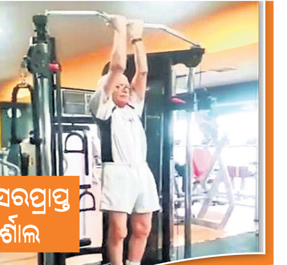
ଚର୍ଚ୍ଚାରେ ଅବସରପ୍ରାପ୍ତ ଏୟାର ମାର୍ଶାଲ