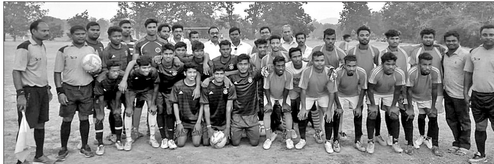
ଅତିଥି ଓ ଆୟୋଜକଙ୍କ ସହ ସୁବଳୟା ପ୍ରତିଯୋଗିତାର ଖେଳାଳିମାନେ ।

ଜଣ ବ୍ୟକ୍ତି ଗରିଆପୁଣ୍ଡା ଗ୍ରାମ ନିକଟରେ ଅଟକାଇଥିଲେ । ମାରଣାସ୍ତ୍ର ଦେଖାଇ ଭୟଭିତ କରି ଟଙ୍କା ଲୁଟି ନେଇ ଫେରାଇ ହୋଇଯାଇଥିଲେ । ତେବେ ରେଡ଼ାଖୋଲ ଓ ଚାରମାଲ ଥାନା ଅଞ୍ଚଳରେ ଗତ କିଛି ମାସ ହେବ ପାଇନାସ୍ କର୍ମଚାରୀଙ୍କଠାରୁ ଲୁଟ୍ ଘଟଣା ବୃଦ୍ଧି ପାଇଛି । ଏହି ଲୁଟ୍ ଘଟଣାର ସୂଚନା ଦେବାକୁ ପୋଲିସ ୩ ଜଣ କର୍ମଚାରୀ ୨ଟି ମୋଟର ସାଇକଲ ଯୋଗେ ଏହି ରାସ୍ତା ଦେଇ ବୌଦ୍ଧପୁର ଫେରୁଥିଲେ । ତାଙ୍କୁ ଅନୁସରଣ କରି ପଛରୁ ଏକ ବାଇକରେ ଆଘାତ ୩ ଦେବାର ସୁଯୋଗ ହାତ ଛଡ଼ା କରୁନି ।