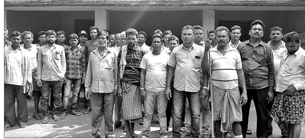
ସ୍କୁଲରେ ତାଲା ପକାଇ ଗ୍ରାମବାସୀ ବାହାରେ ଠିଆ ହୋଇଛନ୍ତି।