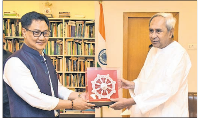
ଲୋକସେବା ଭବନରେ ମୁଖ୍ୟମନ୍ତ୍ରୀ ନବୀନ ପଟ୍ଟନାୟକଙ୍କୁ କେନ୍ଦ୍ର ସ୍ତ୍ରୀ ଓ ମୁଦ୍ରା ବ୍ୟାପାର ରାଷ୍ଟ୍ରମନ୍ତ୍ରୀ କିରେନ୍ ରିଜିକୁ ସୌଜନ୍ୟମୂଳକ ସାକ୍ଷାତ୍ ଅବସରରେ।