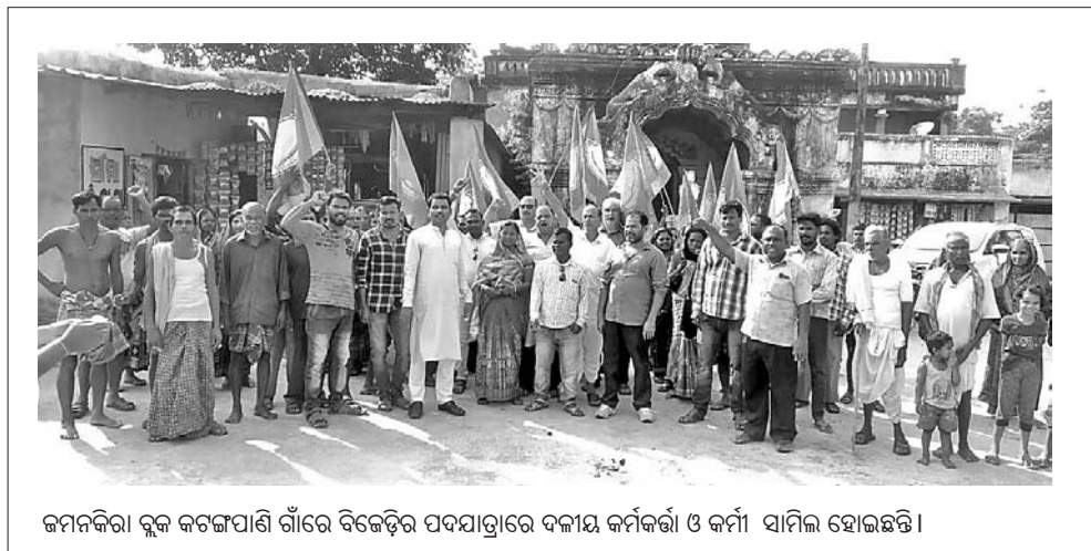
କମଳକରା ବ୍ଲକ କଟକପାଣି ଗାଁରେ ବିକେନ୍ଦ୍ର ପଦ୍ମାଗ୍ରାରେ ବକାୟ କର୍ମକର୍ମୀ ଓ କର୍ମୀ ସାମିଲ ହୋଇଛନ୍ତି ।

କିପରି କ୍ଷୁଦ୍ର ଶିଳ୍ପ ପାଇଁ ବାଟ ଦେଖାଇ ସେ ସମ୍ପର୍କରେ ମତ ରଖିବା ସହ ଶେଷରେ ଧନ୍ୟବାଦ ଅର୍ପଣ କରିଥିଲେ । ଏହି ଅବସରରେ ଆଞ୍ଚଳିକ ଶିଳ୍ପ କେନ୍ଦ୍ର ପକ୍ଷରୁ ଛାତ୍ରଛାତ୍ରୀଙ୍କୁ କ୍ଷୁଦ୍ର ଓ ମଧ୍ୟମ ଶିଳ୍ପ ସମ୍ପର୍କରେ ପୂର୍ଣ୍ଣ ବିଶ୍ୱାସ କରାଯାଇଥିଲା । ଏହି ଶିବିରରେ ମହାବିଦ୍ୟାଳୟର ସମସ୍ତ ଛାତ୍ରଛାତ୍ରୀ, ଅଧ୍ୟାପକ, ଅଧ୍ୟାପିକା ଉପସ୍ଥିତ ଥିଲେ ।