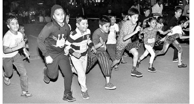
ଝାରସୁଗୁଡ଼ା ଦେବାନ୍ତ କମ୍ପାନୀ ପକ୍ଷରୁ ଆୟୋଜିତ ଗଣଦୌଡରେ ପିଲାମାନେ ସାମିଲ ହୋଇଛନ୍ତି।

ସର୍ବଦା ବଳୁର ଭାଲ ପଟେଲଙ୍କ ୧୪୪ତମ ଜନ୍ମଦିନ ଅବସରରେ ଝାରସୁଗୁଡ଼ାରେ ଦେବାନ୍ତ କମ୍ପାନୀ ପକ୍ଷରୁ ଗଣଦୌଡ ତଥା ରନ ଫର ଯୁନିଟ୍ କାର୍ଯ୍ୟକ୍ରମ ଅନୁଷ୍ଠିତ ହୋଇଯାଇଛି । ଏହି ଗଣଦୌଡରେ ୪୫୦ ଜଣ ଭାଗ ନେଇଥିଲେ । ପାଖାପାଖି ୫ କି.ମି. ଦୂର ଗାଡ଼ି, ମାନବ ସମ୍ବଳ ମୁଖ୍ୟ ଏବଂ ଶିଶୁମାନଙ୍କୁ, ଏବଂ ସର୍ବମୁଖ୍ୟ ଗୋ