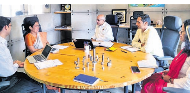
କେରଳ ସ୍ୱାସ୍ଥ୍ୟମନ୍ତ୍ରୀଙ୍କ ସହ ଏସ୍‌ଡିଏ ଅଧକ୍ଷ ଓ ଅନ୍ୟମାନେ।

ପ୍ରାଥମିକତା ଦେଇଆଣ୍ଡି। ସେଠାରେ ରାଜ୍ୟ ସରକାରଙ୍କ ସାମାଜିକ ସୁରକ୍ଷା ବିଭାଗ ଅଧୀନରେ କେନ୍ଦ୍ର ପାଇଁ ଭଳି କାର୍ଯ୍ୟକ୍ରମର ପଦକ୍ଷେପ ନିଆଯାଇଛି।