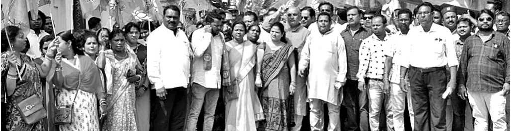
ସମ୍ବଲପୁର ଜିଲ୍ଲାପାଳଙ୍କ ଅଧିକାରୀଙ୍କୁ ସମ୍ବଲପୁରରେ ଭାବପୂର୍ଣ୍ଣ ବିଶେଷ ପ୍ରଦର୍ଶନ କରୁଛନ୍ତି ।

ରାଜ୍ୟ ସରକାର ଲୋକଙ୍କୁ ସ୍ୱାସ୍ଥ୍ୟସେବା ଯୋଗାଇ ଦେବାକୁ ଯୋଜନା କରୁଛନ୍ତି । ବାସ୍ତବରେ ଲୋକମାନେ କିଛି ପୁସିଆ ପାଇନାହାନ୍ତି । ସୁଇଚ୍ ଇମ୍ପାଉର, ଜିଲ୍ଲା ମୁଖ୍ୟ ଚିକିତ୍ସାଳୟ, ସମଗ୍ର ପିଏସ୍‌ସି, ସିଏସ୍‌ସିରେ ତାଲୁକ, ନର୍ସ କର୍ମଚାରୀ ଅଭାବ ରହିଛି । ଇମ୍ପାଉର ଉପରେ ଓଡ଼ିଶା ସମେତ ପଡ଼ୋଶୀ ରାଜ୍ୟର ଲୋକେ ଚିକିତ୍ସା ଲାଗି ନିର୍ଭର କରନ୍ତି । ହେଲେ ସେଠି ଅଧିକ ଅଧିକ ତାଲୁକ ପଦ ଖାଲି ପଡ଼ିଛି । ସରକାର ସେଠାର ନିର୍ଦ୍ଦେଶକ ପଦ ପୂରଣ କରି ପାରୁନାହାନ୍ତି । ଲୋକମାନେ ବାଧ୍ୟ ହୋଇ ଘରୋଇ ମେଡିକାଲରେ ଚିକିତ୍ସିତ ହୋଇ ଖର୍ଚ୍ଚାତ ହେଉଛନ୍ତି । ଶୁକ୍ରବାର ଜିଲ୍ଲାପାଳଙ୍କ ଅଧିକାରୀ