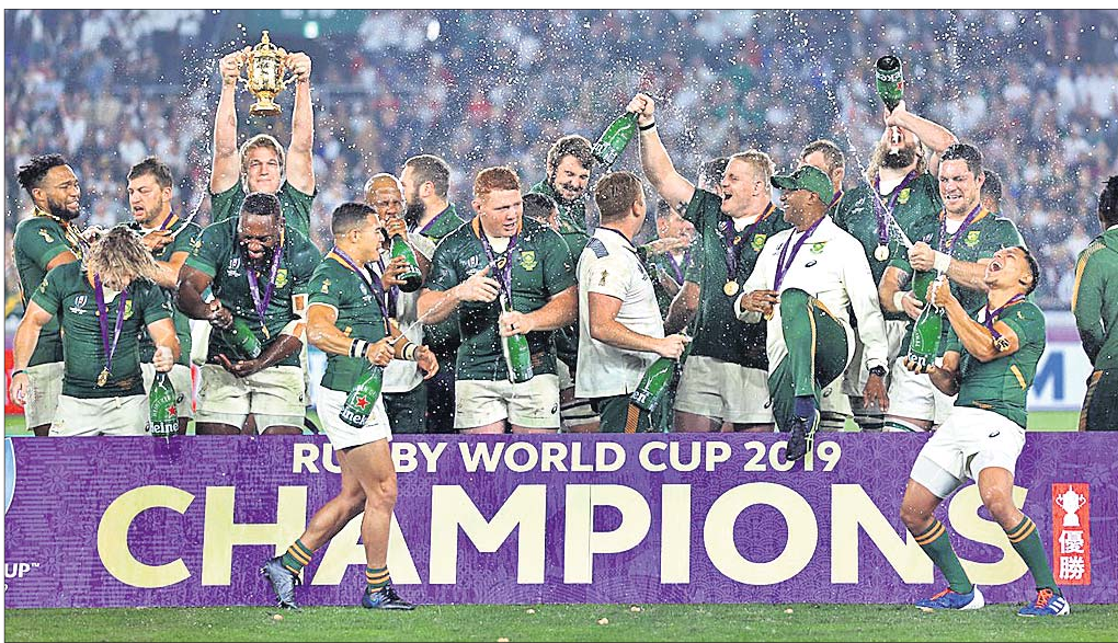
ତୃପ୍ତି ସହ ରକ୍ଷା ବିଶ୍ୱକପ୍ ଚାମ୍ପିୟନ୍ ଦକ୍ଷିଣ ଆଫ୍ରିକା ଟିମ୍ ।

ଦକ୍ଷିଣ ଆଫ୍ରିକା ଚାମ୍ପିୟନ୍ ହୋଇଛି । ଦକ୍ଷିଣ ଆଫ୍ରିକା ଦଳ ପାରମ୍ପରିକ ଖେଳ ପ୍ରଦର୍ଶନ କରି ୩୨-୧୨ ବ୍ୟବଧାନରେ ଇଂଲଣ୍ଡକୁ ହରାଇ ଦେଇଛି ।