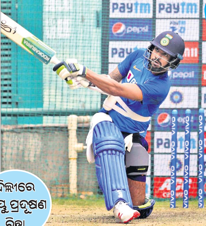
ଦିଲ୍ଲୀରେ ବାୟୁ ପ୍ରଦୂଷଣ ରିପୋର୍ଟ

ଭାରତ ଗ୍ରହରେ ଆସିଥିବା ବାଂଲାଦେଶ କ୍ରିକେଟ୍ ଦଳ ରବିବାରଠାରୁ ଟି୨୦ ସିରିଜ ଖେଳି ଏହାର ଅଭିଯାନ ଆରମ୍ଭ କରିବ ।