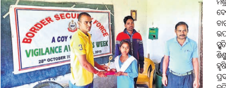
ଛାତ୍ରୀଙ୍କୁ ପୁରସ୍କାର ପ୍ରଦାନ କରାଯାଇଛି ।

ଦୁର୍ନୀତି ନିବାରଣ ସମାଜକୁ କିପରି ଦୁର୍ନୀତି ଦୂର କରିବା ଉଦ୍ଦେଶ୍ୟରେ ଛାତ୍ରଛାତ୍ରୀମାନଙ୍କୁ ନେଇ ବହୁତା ପ୍ରତିଯୋଗିତା କରାଯାଇଥିଲା । ଉଚ୍ଚ କାର୍ଯ୍ୟକ୍ରମରେ ଏସଆଇ ରାଠିଆମାନଙ୍କୁ ଉପସଭାରେ ଉପସଭାରେ ପ୍ରଧାନ ଶିକ୍ଷକ ସମେତ ବିଦ୍ୟାର୍ଥୀ ଶିକ୍ଷକଙ୍କ ଦ୍ୱାରା ଦୁର୍ନୀତି ନିବାରଣ ସମ୍ପର୍କିତ ବିଭିନ୍ନ ବିଷୟକୁ ନେଇ ପ୍ରତିଯୋଗିତା କରାଯାଇଥିଲା । ନିଜେ ଦୁର୍ନୀତିଠାରୁ