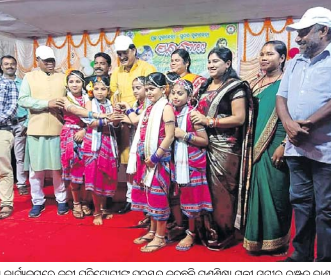
ସୁନାବେଢ଼ା ପୌରାଞ୍ଚଳସ୍ତରୀୟ ପରର କାର୍ଯ୍ୟକ୍ରମରେ ଅତିଥି ଭାବେ ଯୋଗଦେଇ କୋରାପୁଟ ବିଧାୟକ ରଘୁରାମ ପଟ୍ଟନାୟକ ଏହା କହିଛନ୍ତି।