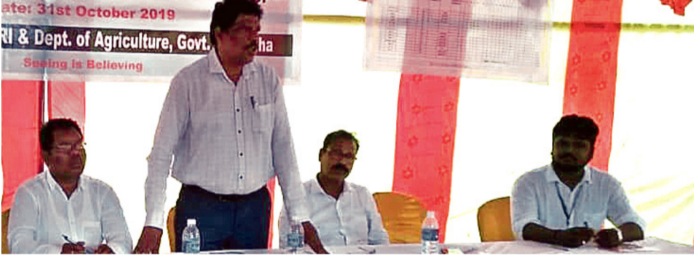
କର୍ମଶାଳାରେ ଉପସ୍ଥିତ ଅଧିକାରୀମାନେ ।