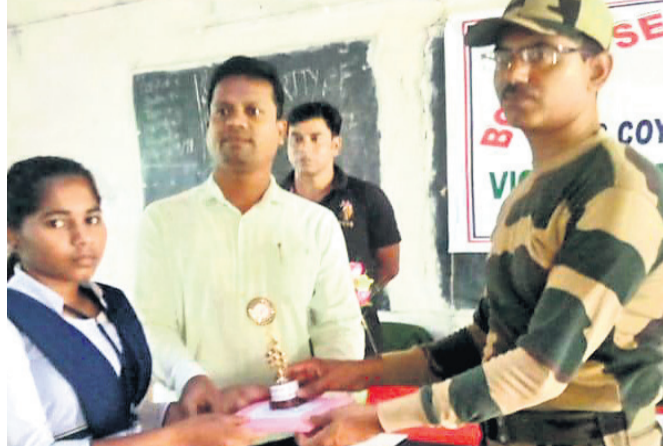
ଜଣେ ଛାତ୍ରୀଙ୍କୁ ପୁରସ୍କାର ପ୍ରଦାନ କରାଯାଇଛି ।

ଦେଇ ଆପେ ଆପେ ଦୁର୍ନୀତି ଲୋପ ପାଇଯିବ ବୋଲି ଉପସଭାରେ ପ୍ରମୋଦ କୁମାର କହିଥିଲେ । ଏହାପରେ ଉପସଭାରେ ଲୋକଙ୍କ ମାନସିକତାରେ ପରିବର୍ତ୍ତନ ଆଣିବାକୁ ଲୋକମାନଙ୍କୁ ପ୍ରୋତ୍ସାହିତ କରାଯାଇଥିଲା ।