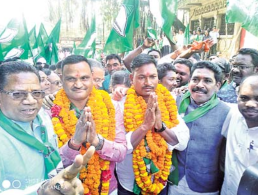
ପ୍ରାର୍ଥୀପତ୍ର ଦାଖଲ ପାଇଁ ଭାଜପାର ଶୋଭାଯାତ୍ରା ।