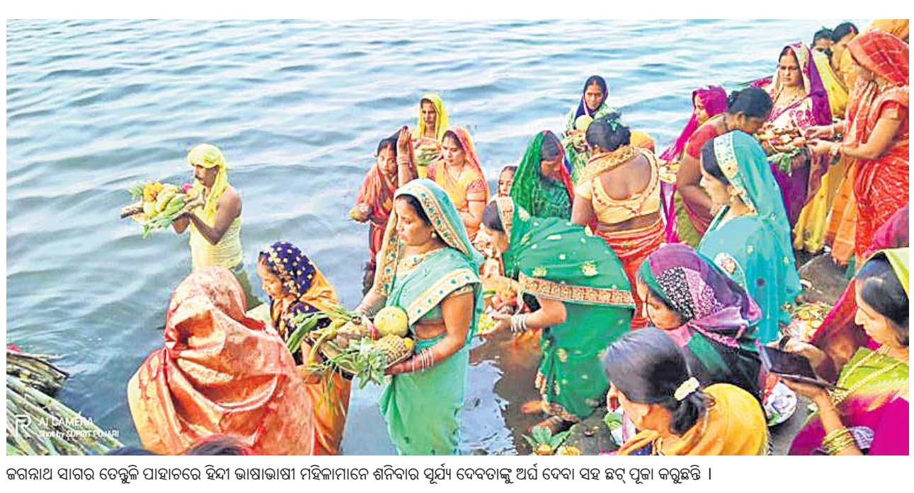
ଜଗନ୍ନାଥ ସାଗର ଟେକ୍ସଟାଇଲ ପାହାଚରେ ହିନ୍ଦୀ ଭାଷାଭାଷୀ ମହିଳାମାନେ ଶନିବାର ସୂର୍ଯ୍ୟ ଦେବତାଙ୍କୁ ଅର୍ପଣ ଦେବା ସହ ବ୍ରତ ପୂଜା କରୁଛନ୍ତି ।