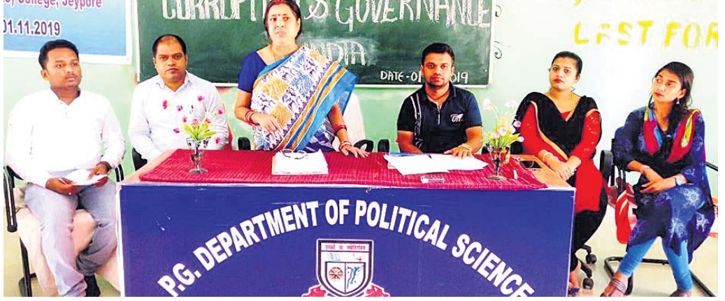
ବିକ୍ରମଦେବ କଲେଜର ରାଜନୀତି ବିଜ୍ଞାନ ବିଭାଗ ପକ୍ଷରୁ ଆୟୋଜିତ କର୍ମଶାଳାରେ ମଞ୍ଚସଭାର ଅତିଥିମାନେ ।