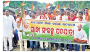
ଡାକ୍ତରୀ, ୨୧୧୧ (ଡି.ଏନ.ଏ.)- ଡାକ୍ତରୀ କ୍ଷେତ୍ରରେ ଗାନ୍ଧୀ ସଂକଳ୍ପ ପଦଯାତ୍ରା ଅନୁଷ୍ଠିତ ହୋଇଛି ।

ଡାକ୍ତରୀ, ୨୧୧୧ (ଡି.ଏନ.ଏ.)- ଡାକ୍ତରୀ କ୍ଷେତ୍ରରେ ଗାନ୍ଧୀ ସଂକଳ୍ପ ପଦଯାତ୍ରା ଅନୁଷ୍ଠିତ ହୋଇଛି । ଗାନ୍ଧୀ ସଂକଳ୍ପ ପଦଯାତ୍ରା ଅନୁଷ୍ଠିତ ହୋଇଛି । ଗାନ୍ଧୀ ସଂକଳ୍ପ ପଦଯାତ୍ରା ଅନୁଷ୍ଠିତ ହୋଇଛି ।