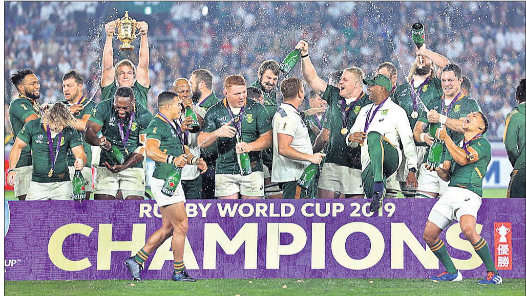
ତୃପ୍ତି ସହ ରଞ୍ଜଣୀ ବିଶ୍ୱକପ୍ ଚାମ୍ପିୟନ୍ ଦକ୍ଷିଣ ଆଫ୍ରିକା ଟିମ୍ ।

୭୦,୧୦୩ ଦର୍ଶକଙ୍କ ସାମ୍ମୁଖରେ ଦକ୍ଷିଣ ଆଫ୍ରିକା ଚାମ୍ପିୟନ୍ ଥିବାର ପାଇଁ ବିଶ୍ୱକପ୍ ହାତେଇଛି । ପୂର୍ବରୁ ୧୯୯୫ ଓ ୨୦୦୭ ସଂସ୍କରଣରେ ଦଳ ଚାମ୍ପିୟନ୍ ହୋଇଥିଲା ।