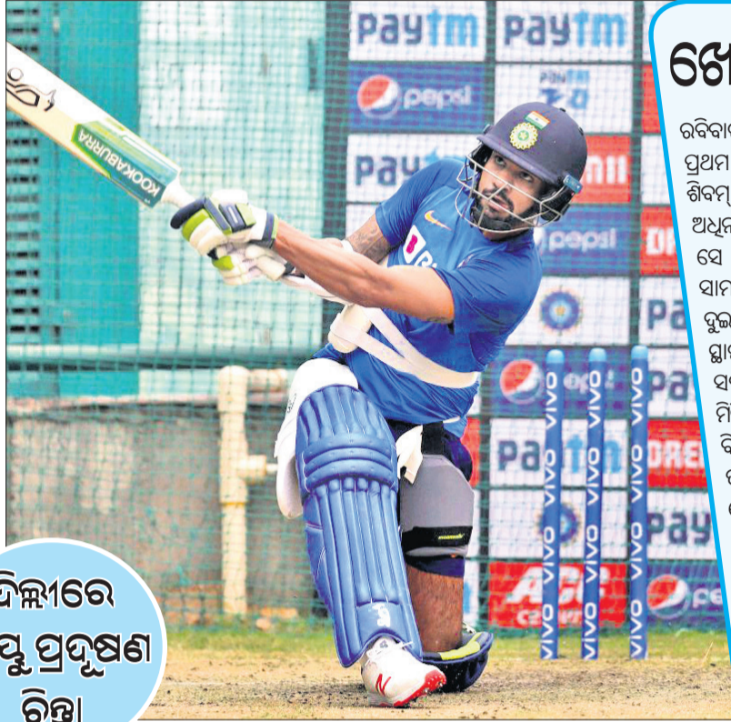
ଦିଲ୍ଲୀରେ ବାୟୁ ପ୍ରଦୂଷଣ ଚିତ୍ରା

ଦୀପାବଳି ପରବର୍ତ୍ତୀ ସମୟରେ ଦିଲ୍ଲୀରେ ବାୟୁ ପ୍ରଦୂଷଣର ସ୍ତର ଉଚ୍ଚ ରହିଛି... ଦୀପାବଳି ପରବର୍ତ୍ତୀ ସମୟରେ ଦିଲ୍ଲୀରେ ବାୟୁ ପ୍ରଦୂଷଣର ସ୍ତର ଉଚ୍ଚ ରହିଛି