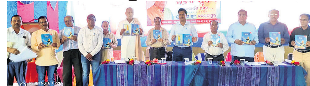
ସ୍ମରଣିକା ଲଳିତ ସ୍ମୃତି ଉଦ୍ଘୋଷଣା କରାଯାଇଛି ।

ସାହିତ୍ୟିକ ସ୍ମରଣିକା ଲଳିତ ମୋହନ ପଟ୍ଟନାୟକଙ୍କ ପ୍ରଥମ ଶ୍ରାଦ୍ଧ ବାର୍ଷିକୀ ଗ୍ରାମୀଣ ସୌର ସାହିତ୍ୟ ସମାଜ ପକ୍ଷରୁ ଉତ୍ସବର ଆୟୋଜନ କରାଯାଇଛି ।