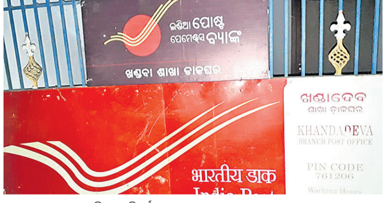
ଖାଣ୍ଡବା ଡାକଘର ଲାଗିଥିବା ବୁଡ଼ିପୁର୍ଣ୍ଣ ନାମଫକକ।

ଲେଖାଯାଇଥିବାବେଳେ ଅନ୍ୟ ଏକ ସ୍ଥାନରେ ଖଣ୍ଡାଦେବ ଶାଖା ଡାକଘର ଉଦ୍ଘୋଷଣ ରହିଛି। ହେଲେ ଗ୍ରାମର ପ୍ରକୃତ ନାମ ଅନୁଯାୟୀ ଖାଣ୍ଡବା ଡାକଘର ବୋଲି ଲେଖାଯାଇନାହିଁ। ଫଳରେ ଅନେକ ସମୟରେ ଲୋକେ ଅସୁବିଧାର ସମ୍ମୁଖୀନ ହେଉଛନ୍ତି। ଏହା ବ୍ୟତୀତ ଡାକଘର ଲାଗିଥିବା ଡାକଘର ସମ୍ପୂର୍ଣ୍ଣ ନଷ୍ଟ ହୋଇଥିବାବେଳେ ତିନି ପକାଇବା ମଧ୍ୟ ସମ୍ଭବ ହେଉନାହିଁ। ଫଳରେ ଏହି ଡାକଘର ଓ କାର୍ଯ୍ୟାଳୟ କର୍ମଚାରୀଙ୍କୁ ନେଇ ଅନେକ ପ୍ରଶ୍ନ ଉଦ୍ଘୁସିତାରେ ଗ୍ରାମବାସୀ ଡାକଘରର ନାମଫକକ ଓ ଡାକଘରକୁ ଫଟୋ ସହ ବର୍ତ୍ତମାନ ସୋସିଆଲ ମିଡିଆରେ ଏକ ଭିଡିଓ ଅପଲୋଡ୍ କରିଛନ୍ତି। ଏଥିରେ ଅଞ୍ଚଳବାସୀ ଡାକଘର ବ୍ୟବସ୍ଥା ନେଇ ଅସନ୍ତୋଷ ପ୍ରକାଶ କରିବା ସହ ଜରୁରୀ ଚିଠି ଆସିଲେ ତାହା କିପରି ମିଳିବ ଏବଂ ଚିଠି ଆସିଥିବା ବ୍ୟକ୍ତିଙ୍କୁ ଅବସ୍ଥା କ'ଣ ହେବ ବୋଲି ପ୍ରଶ୍ନ ଉଠାଇଛନ୍ତି। ବିଶେଷକରି ବାକିରି ନିୟୁକ୍ତିପତ୍ର ଆସିଲେ ତାହା ମିଳିବ କି ନାହିଁ ତାହାକୁ ନେଇ ଆଶଙ୍କା ପ୍ରକାଶ ପାଇଛି। ତେଣୁ ତୁରନ୍ତ ଅବ୍ୟବସ୍ଥାକୁ ସୁଧାରି ଡାକଘରକୁ ସମ୍ପୂର୍ଣ୍ଣ କାର୍ଯ୍ୟାଳୟ କରିବାକୁ ଅଞ୍ଚଳବାସୀ ଦାବି କରିଛନ୍ତି।