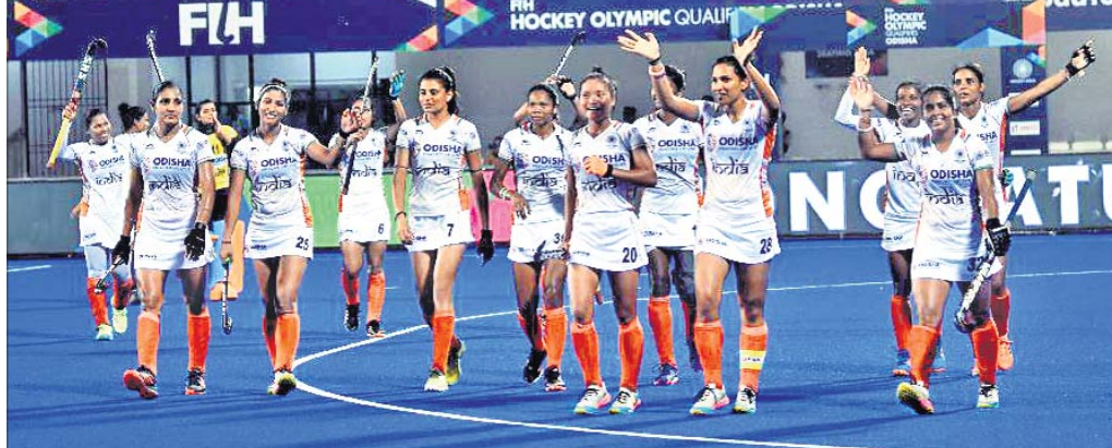
ଯୋଗ୍ୟତା ହାସଲ ପରେ ଭାରତୀୟ ମହିଳା ହକି ଦଳ।