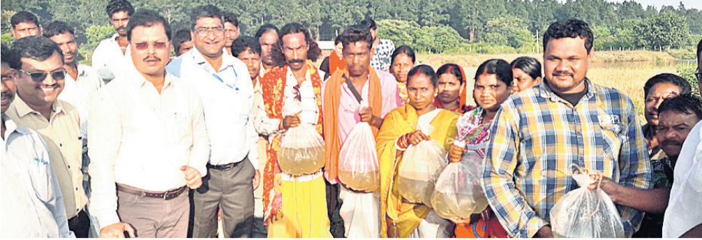
ଜିଲାପାଳ ଚାଷୀଙ୍କୁ ମାଛ ଯାଆଁକ ପ୍ରଦାନ କରୁଛନ୍ତି ।

ସ୍ଥାନୀୟ ମିଶନ ଶକ୍ତି ହଲ ଠାରେ ମଧୁର କଳ ମଧ୍ୟ ଗବେଷଣା ସଂଗ୍ରାହଣା ପକ୍ଷରୁ ଦିନିକା କର୍ମଶାଳା ଅନୁଷ୍ଠିତ ହୋଇଯାଇଛି ।