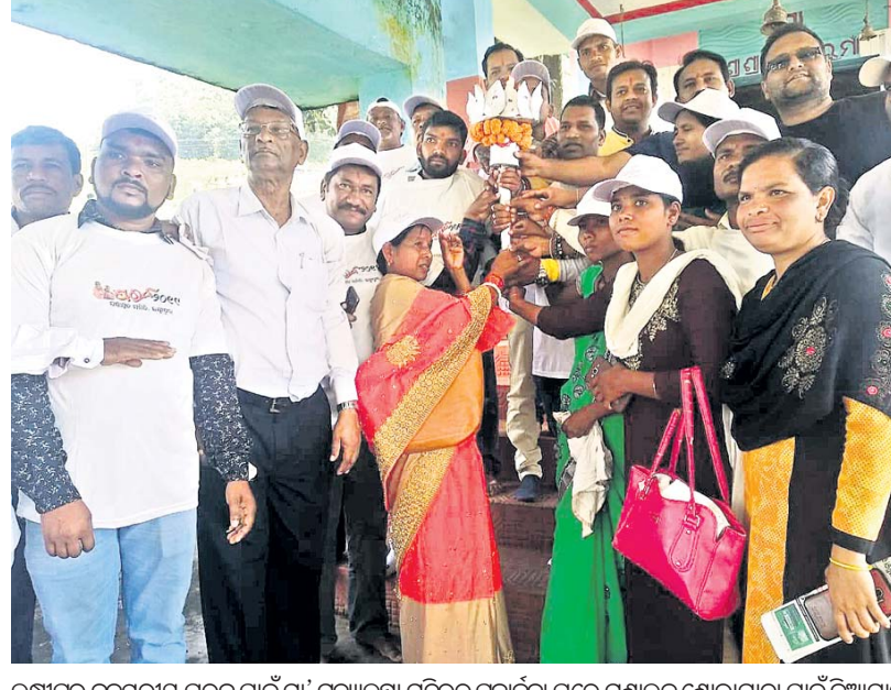
ଲକ୍ଷ୍ମୀପୁର ବୁଲ୍‌ପୁରୀ ପରବ ପାଇଁ ମା' ପ୍ରତ୍ୟାଲକ୍ଷ୍ମୀ ମନ୍ଦିରକୁ ପୂଜାର୍ଚ୍ଚନା ପରେ ମଣ୍ଡଳର ଶୋଭାଯାତ୍ରା ପାଇଁ ନିଆଯାଇଛି।