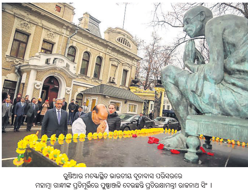
ଭୂଷିଆର ମହୋତ୍ସବ ଆରମ୍ଭ ହେବା ପରିସରରେ ମହାତ୍ମା ଗାନ୍ଧୀଙ୍କ ପ୍ରତିମୂର୍ତ୍ତିରେ ପୁଷ୍ପାଞ୍ଜଳି ଦେଇଛି ପ୍ରତିରକ୍ଷାମନ୍ତ୍ରୀ ରାଜନାଥ ସିଂ ।

୨୦୦୪ ନଭେମ୍ବର ୨ରେ ଲକ୍ଷ୍ନୱର ଉତ୍ତର ନର୍ଦ୍ଦେଶରେ ଏକ ଟ୍ରେନ କାରକ୍ଷୁଧାକାରୀ ଫଳରେ ୮ ଜଣ ଯାତ୍ରୀଙ୍କ ମୃତ୍ୟୁ ହୋଇଥିଲା। ଏଥିରେ ପ୍ରାୟ ୧୫୦ ଆହତ ହୋଇଥିଲେ। ଷ୍ଟବଲ କୁସିଂ ପାରବେଳ ଏଭଳି ଦୁର୍ଘଟଣା ହୋଇଥିଲା। ଟ୍ରେନ ଓ କାରର ଡ୍ରାଇଭର ଏଥିରେ ପ୍ରାଣ ହରାଇଥିଲେ। ୨୦୧୨ ନଭେମ୍ବର ୨ରେ ବାରାକ୍ ସୁସେନ୍ ଓ ବାମା ଆମେରିକା ରାଷ୍ଟ୍ରପତି ଭାବେ ପୁନଃ ନିର୍ବାଚିତ ହୋଇଥିଲେ। ୨୦୦୯ରୁ ୨୦୧୨ ଯେ ଦେଶର ଶାସନ ଭାର ସମ୍ଭାଳିଥିଲେ। ଏହି ଦିନ ଟମ୍ ବିଦ୍ରୋହ ମଧ୍ୟ ଦେଶର ପ୍ରଥମ ସମ୍ପଲ୍ଲୀକାର ଘଟଣା ଭାବେ ସିନେଟରୁ ନିର୍ବାଚିତ ହୋଇଥିଲେ।