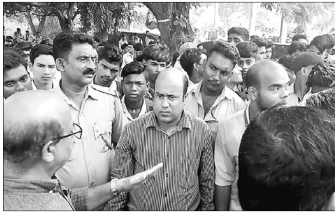
ଧାରଣାଗ୍ରହଣରେ ଅଧ୍ୟକ୍ଷ ଉଦ୍ୟୋଗ ଛାତ୍ରଛାତ୍ରୀଙ୍କୁ ବୁଝାଇଛନ୍ତି।

ଆନନ୍ଦପୁର ମହାବିଦ୍ୟାଳୟ ପରିସରରେ ମଙ୍ଗଳବାର ୧୧ଟା ସମୟରେ ଛାତ୍ରଛାତ୍ରୀ ଆନ୍ଦୋଳନକୁ ଓହ୍ଲାଇଥିଲେ।