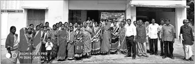
ତହସିଲଦାରଙ୍କ କାର୍ଯ୍ୟାଳୟକୁ ଅଭିଯୋଗ କରିବାକୁ ଆସିଥିବା ଚାଷୀ ସମୂହ।

ଚଳିତ ବର୍ଷ ଖରିଫ ଚାଷ ପାଇଁ ତେରିରେ ମୌସୁମୀ ବର୍ଷ ହୋଇ ପାଗ ଅନୁକୂଳ ହୋଇଥିଲା। କିନ୍ତୁ ଚାଷ ପାଇଁ ବର୍ଷା ତେରିରେ ପହଞ୍ଚିଥିବା ବୃଷ୍ଟିରୁ କୁଳର କେତେକ ପଞ୍ଚାୟତରେ ଖରିଫ ଋତୁରେ ହୋଇଥିବା ଧାନ ଚାଷ କ୍ଷତିଗ୍ରସ୍ତ ହୋଇଛି।