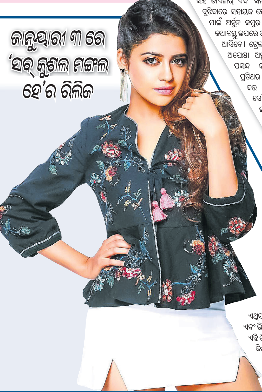
ଜାନୁଆରୀ ୩ ରେ 'ସର୍ବ କୁଶଳ ମଙ୍ଗଳ ହେ'ର ରିଲିଜ

ବାବା: ଗାଡ଼ି ଚଳାଇବା ବେଳେ ହେଲମେଟ୍ ପିନ୍ଧିବାକୁ ନିୟମ ରହିଛି। ହେଲମେଟ୍ ନ ପିନ୍ଧିଲେ ଜରିମାନା ଗଣିବାକୁ ପଡ଼ିବ। ତେବେ ଉତ୍ତରପ୍ରଦେଶ ବାବା ସ୍ଥିତ ବିସ୍ମୃତ୍ ବିଭାଗର ଏକ କାର୍ଯ୍ୟାଳୟରେ କର୍ମଚାରୀ ହେଲମେଟ୍ ପିନ୍ଧି କାମ କରୁଛନ୍ତି। ଏହି କାର୍ଯ୍ୟାଳୟଟି କରାକାର୍ଯ୍ୟ ଅବସ୍ଥାରେ ରହିଛି। ଫଳରେ ଏହାର ସିଲିଂରୁ ଖଣ୍ଡ ଖଣ୍ଡ ପୁଲ୍ଲୁର ଖସୁଛି। କେତେକ କର୍ମଚାରୀଙ୍କ ମୁଣ୍ଡରେ ଆୟାତ ଲାଗିବାକୁ ଏବେ ସବୁ କର୍ମଚାରୀ ପୁରୁଷା ଦୃଷ୍ଟିରୁ ମୁଣ୍ଡରେ ହେଲମେଟ୍ ପିନ୍ଧି କାମ କରୁଛନ୍ତି। ଏନେଇ ଜିଲା ବିସ୍ମୃତ୍ ବିଭାଗ ବରିଷ୍ଠ କର୍ମଚାରୀଙ୍କୁ ସୂଚନା ଦିଆଯାଇଥିଲେ ମଧ୍ୟ ସ୍ଥିତିରେ ସୁଧାର ଆସିପାରି ନାହିଁ।