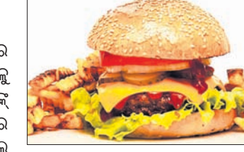
୫୦ ମିନଟ ପରିସରରେ ବିଜ୍ଞାପନ ଉପରେ ଲାଗିବ କଟକଣା

ଦେଶରେ ବିଦ୍ୟାଳୟଗୁଡ଼ିକରେ ଖୁବ୍ ଶୀଘ୍ର ଜଙ୍କ୍ ଫୁଡ଼ ମନା ହେବ। ଆଇ. ଡି.ଏସ୍, ସର୍ବ ଡି.ଏସ୍ ଓ ଅନ୍ୟ ଜଙ୍କ୍ ଫୁଡ଼ଗୁଡ଼ିକ ଆଉ ସ୍କୁଲ କ୍ୟାମ୍ପରେ ମିଳିବ ନାହିଁ। ଏହାସହ ସ୍କୁଲ କ୍ୟାମ୍ପରେ ୫୦ ମିନଟ ପରିସରରେ ଏଭଳି ଖାଦ୍ୟର ବିଜ୍ଞାପନ ମଧ୍ୟ ଲାଗିପାରିବ ନାହିଁ। ପିଲାଙ୍କୁ ସୁରକ୍ଷିତ ଓ ଅପରିଶ୍ରମଗୁଣ୍ଡ ଖାଦ୍ୟ ଖାଇବା ଲାଗି ଉତ୍ସାହିତ କରିବା ସକାଶେ ଖୁବ୍ ଶୀଘ୍ର ଏହି କଟକଣା ଲାଗୁ କରାଯିବ। ଫୁଡ଼ ସେଫ୍ଟି ଆଣ୍ଡ ଷ୍ଟାଣ୍ଡାର୍ଡସ୍ ଅଧିକାରୀ ଅଧିକାରୀ (ଏଫ୍‌ଏସ୍‌ଏସ୍‌ଆଇ) ପକ୍ଷରୁ ଏପରି ପ୍ରସ୍ତାବ ଦିଆଯାଇଛି। 'ଫୁଡ଼ ସେଫ୍ଟି ଆଣ୍ଡ ଷ୍ଟାଣ୍ଡାର୍ଡସ୍ (ସ୍କୁଲ ଛାତ୍ରାଛାତ୍ରୀଙ୍କ ପାଇଁ ସୁରକ୍ଷିତ ଓ ସୁସ୍ଥ ଖାଦ୍ୟ) ନିୟମ, ୨୦୧୯' ଶୀର୍ଷକ ଏକ ଚିଠି ଆଇନ ଖାଦ୍ୟ ନିୟନ୍ତ୍ରଣ ଏଫ୍‌ଏସ୍‌ଏସ୍‌ଆଇ ପ୍ରଶାସନ କରିଛି। ପ୍ରସ୍ତାବ ଅନୁସାରେ ସ୍କୁଲ ପରିସରରେ ଜଙ୍କ୍ ଫୁଡ଼ ବିକ୍ରି ବନ୍ଦ କରାଯିବ।