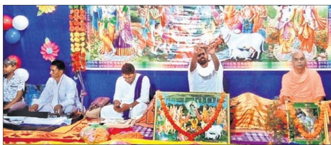
ପ୍ରବଚନ ସଭାରେ ଯୋଗଦେଇଥିବା ସାଧୁସଭା।

ଜଞ୍ଜାଳମୟ ଜୀବନ ଯୋଗୁ ମଣିଷ ଅଶାନ୍ତତା ହୋଇପଡ଼ୁଛି। ଅର୍ଥ ରୋକିବାର, ବିଳାସବ୍ୟସନ ଚିତ୍ତାରେ ସମସ୍ତେ ଜୀବନ ବିତାଉଛନ୍ତି।