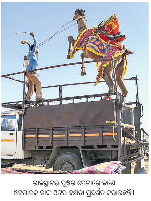
ରାଜସ୍ଥାନର ପୁଷ୍ପର ମେଳଣରେ ଜଣେ ଓଡ଼ିଆ ଲୋକ ଟ୍ରକ ଉପରେ ବସି ଉପସ୍ଥାପନ କରାଯାଇଛି।