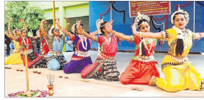
ଆଞ୍ଚଳିକ ଶିଶୁ ବିଜ୍ଞାନ କଂଗ୍ରେସ କାର୍ଯ୍ୟକ୍ରମରେ ଛାତ୍ରୀମାନେ ନୃତ୍ୟ ପରିବେଷଣ କରୁଛନ୍ତି।