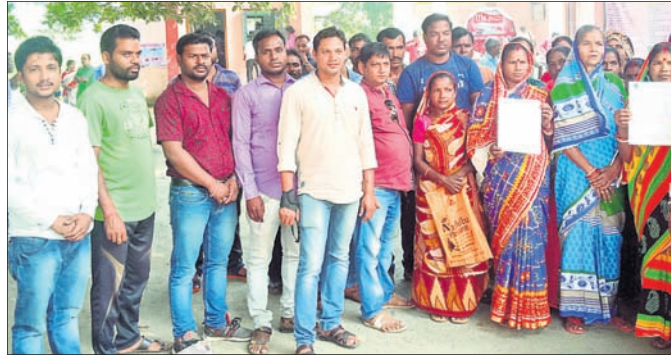
ଦାଦିପତ୍ର ଦେବାକୁ ଆସିଥିବା ଅଞ୍ଚଳବାସୀ ଓ ସାମାଜିକ ଅନୁଷ୍ଠାନର କର୍ମକର୍ମୀ।

ବାଲେଶ୍ୱର ସଦର ବ୍ଲକ୍ ବଡ଼ଖୁଆ ଗ୍ରାମରେ ପାନୀୟଜଳ ଦୂଷିତ ହୋଇପଡ଼ିଥିବା ନେଇ ଦାବିଦିନ ହେଲା ଅଭିଯୋଗ ହୋଇଆସୁଛି।