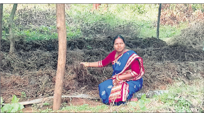
କ୍ଷିତିଧାରୀ ଉତ୍ପାଦନ ସ୍ଥଳରେ ଗାୟତ୍ରୀ