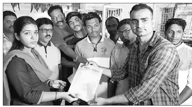
ସବୁଜ ବାହନୀ ତରଫରୁ ଦାବିପତ୍ର ପ୍ରଦାନ କରାଯାଇଛି ।

ରାଷ୍ଟ୍ର ହେଉ କୋଠା, ନିର୍ମାଣ କାର୍ଯ୍ୟ ପାଇଁ ଅନେକ ସମୟରେ ଗଛ କାଟିବାକୁ ପଡ଼ିଥାଏ । ସମ୍ପତ୍ତି ଓଡ଼ିଆରୁପରେ ସହରରେ ବିଭିନ୍ନ ସ୍ଥାନରେ ରାଷ୍ଟ୍ର ପ୍ରସ୍ତୁତକରଣ ଚାଲିଛି । ଏଣୁ ବହୁ ପରିମାଣରେ ଗଛ କାଟିବାକୁ ପଡ଼ିଛି । ଏହାକୁ ବ୍ରହ୍ମପୁର ସରକାର ଦାବି କରିଛନ୍ତି । ଏନେଇ ଏକ ଦାବିପତ୍ର ବ୍ରହ୍ମପୁର ପୂର୍ବ ବିଭାଗ ନିର୍ବାହୀ ସମ୍ପତ୍ତି ପ୍ରଶାସନ ଦ୍ୱାରା ଜାରି କରାଯାଇଛି । ବ୍ରହ୍ମପୁର ସହରରେ ବହୁ ପୁରାତନ ବୃକ୍ଷ ବିଭିନ୍ନ ରାଷ୍ଟ୍ର କର୍ତ୍ତୃକରେ ରହିଛି । ଗଛ ସହରକୁ ସବୁଜ ସୁନ୍ଦର, ଅମ୍ଳଜାନ ଓ ପତାମାଳାକୁ ପ୍ରତିରୋଧକ କରାଯାଇଥିଲା । କିନ୍ତୁ ଆୟ ଛାଡ଼ି ପ୍ରଦାନ କରୁଛି । ରାଷ୍ଟ୍ର ଉନ୍ନତୀକରଣ ନିମନ୍ତେ ବିଭିନ୍ନ ବୃକ୍ଷରୁ ବର୍ଷ ସାରା କଟାଯାଇଛି । ଫଳରେ ପରିବେଶ ପ୍ରତି ନକାରାତ୍ମକ ପ୍ରଭାବ ପଡ଼ୁଛି । ବିଗତ ଦିନରେ ସବୁଜ ବାହନୀ ତରଫରୁ ଏକ