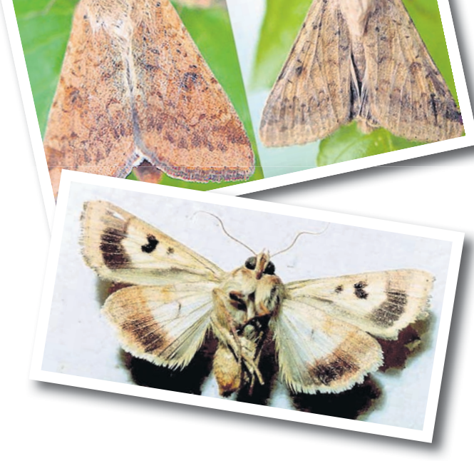
ପତ୍ରକଟା, ଛୁଇଁବିକା ଓ ଫଳବିକା ପୋକ ଦମନ ସମ୍ପର୍କରେ... ଭୂତାଣୁଜନିତ ଜୈବ କାଟନାଶକ ଯଥା ହେଲି ଯାଇଡ୍ରୋ କାଟନାଶକ ଯିଅନ୍ତୁ। କାବାଣୁଜନିତ ଦ୍ରବ୍ୟର ପ୍ରୟୋଗ: କାବାଣୁଜନିତ ବାୟୋଲୋପ କିମ୍ବା ତାଳପେଲ କିମ୍ବା ବାୟୋଲୋପ ୨ ମିଲିମିଟର କିମ୍ବା ୨ ମିଲିଗ୍ରାମ ଏକ ଲିଟର ପାଣିରେ ମିଶାଇ ଫସଲକୁ ସିଞ୍ଚନ କରନ୍ତୁ। ୭ ଦିନ ଅନ୍ତରେ ୨ ରୁ ୩ ଥର ସିଞ୍ଚନ କରନ୍ତୁ। -ପୂର୍ବତନ ପ୍ରତ୍ୟେକ ଓ ବିଭାଗୀୟ ମୁଖ୍ୟ, କାଟକତ୍ୱ ବିଭାଗ, ଓଡ଼ିଶା, ଭୁବନେଶ୍ୱର

ଅମଳକ୍ଷମ କିସମର ମଞ୍ଜି ଜମିରେ ବୁଣିବୁ। ସର୍ବେକ୍ଷଣ: ଫସଲ କିଆରିକୁ ୨ ରୁ ୩ ଦିନ ବ୍ୟବଧାନରେ ପରିବର୍ତ୍ତନ କରି ପୋକଟିର ଆବିର୍ଭାବ ଏବଂ କ୍ଷତିର ଲକ୍ଷଣ ଓ ପରିମାଣ ଜାଣିବା ପରେ ଦମନ ପ୍ରକ୍ରିୟା ଆରମ୍ଭ କରନ୍ତୁ। ସକ୍ଷ ଆକର୍ଷକ ଯନ୍ତ୍ରର ବ୍ୟବହାର: ଫସଲ କିଆରିରେ ପୂର୍ଣ୍ଣାଙ୍ଗପ୍ରାୟ ପୋକଟି ଉତ୍ତୁରୁଥିବା ଦେଖିଲେ କିମ୍ବା କ୍ଷତିର ଲକ୍ଷଣ ଜଣାପଡ଼ିଲେ ଏକ ହେକ୍ଟର ଜମିରେ ୨୦ଟି ଆକର୍ଷକ ଯନ୍ତ୍ରରେ ୨୦ଟି ହେଲି ଲିଓର ଥୋପ ରଖନ୍ତୁ ଓ ଯନ୍ତ୍ରଗୁଡ଼ିକୁ ଫସଲ କିଆରିରେ ଥୋପନ୍ତୁ। ପରଦିନ ଯନ୍ତ୍ରରୁ ପୁରୁଷ ପୋକକୁ ସଂଗ୍ରହ କରି ମାରିଦିଅନ୍ତୁ। ୧୫ ଦିନ ବ୍ୟବଧାନରେ ଯନ୍ତ୍ରରେ ଥୋପ ବଦଳାନ୍ତୁ। ଭୂତାଣୁଜନିତ ଦ୍ରବ୍ୟର ପ୍ରୟୋଗ: ମୋ: ୯୭୭୭୦୪୪୪୦୭