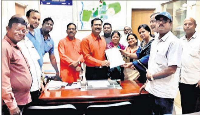
କଂଗ୍ରେସ ପକ୍ଷରୁ ଅତିରିକ୍ତ ଜିଲ୍ଲାପାଳଙ୍କୁ ଦାବିପତ୍ର ଦିଆଯାଇଛି।