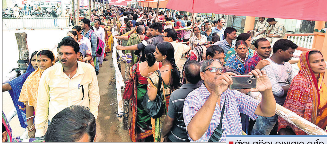
ସାକ୍ଷୀଗୋପାଳ ମନ୍ଦିରରେ ରାଧାପାଦ ଦର୍ଶନ ପାଇଁ ଶ୍ରଦ୍ଧାଳୁଙ୍କ ଲୟାଧାଡ଼ି ।

ଫିକା ପଡ଼ିଲା ରାଧାପାଦ ଦର୍ଶନ ସେବାୟତଙ୍କ ଧାରଣା ଯୋଗୁ ଅଧ୍ୟୟନ ଦର୍ଶନ ବନ୍ଦ