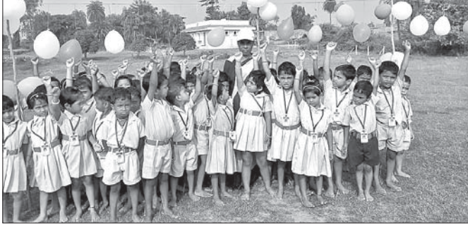
କ୍ରୀଡ଼ା ପ୍ରତିଯୋଗିତାରେ ଅଂଶଗ୍ରହଣ କରିଥିବା ଛାତ୍ରଛାତ୍ରୀ।