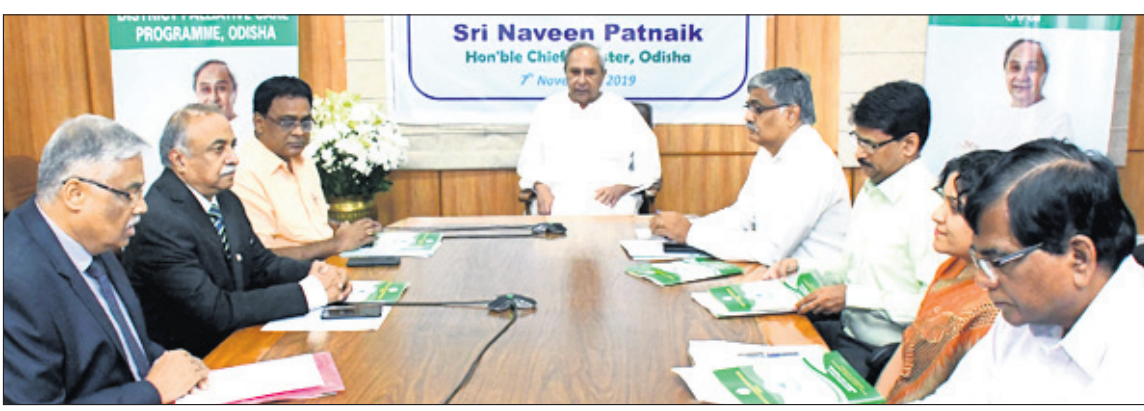
ଡିଡ୍ଡିଲୁ ପାଲିଆଟିଭ୍ କେୟାର ପ୍ରୋଗ୍ରାମ ଉଦ୍ଦେଶ୍ୟରେ ପୁଖ୍ୟମନ୍ତ୍ରୀ ନବୀନ ପଟ୍ଟନାୟକ ଓ ଅନ୍ୟ ପଦାଧିକାରୀମାନେ।