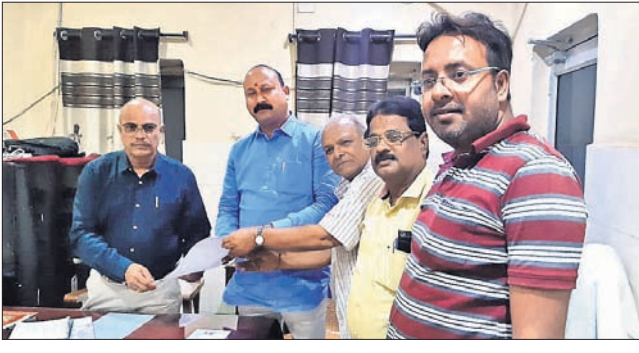
ଉପଜିଲ୍ଲାପାଳଙ୍କୁ ଦାବିପତ୍ର ପ୍ରଦାନ କରାଯାଇଛି ।