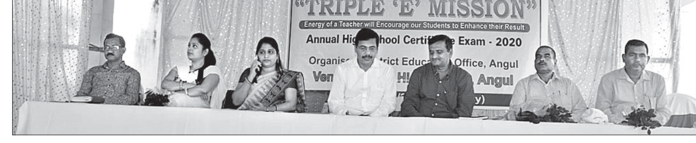
ଅନୁଗୋଳ ଉଚ୍ଚ ବିଦ୍ୟାଳୟ ଠାରେ ଜିଲ୍ଲା ଶିକ୍ଷା ଅଧିକାରୀଙ୍କ କାର୍ଯ୍ୟକ୍ରମ ପକ୍ଷରୁ 'ଥ୍ରୀ-ଇ-ମିଶନ' କାର୍ଯ୍ୟକ୍ରମ ଆରମ୍ଭ ଅବସରରେ ମଞ୍ଚାସୀନ ଅତିଥିମାନେ।