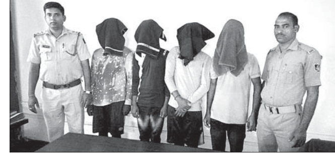
ପୋଲିସ୍ ସହ ଗିରଫ ୪ ଅଭିଯୁକ୍ତ।

ଅନୁଗୋଳ ଜିଲ୍ଲା ରୋଡ଼ରେ ଥିବା ଗାଣ୍ଡୁ ପଡ଼ିଆରେ ରୁପାବାର ବିକଳିତ ରାତିରେ ଡକ୍ଟରୀ ଯୋଜନା କରୁଥିବାବେଳେ ୪ ଜଣଙ୍କୁ ଅନୁଗୋଳ ପୋଲିସ୍ ଗିରଫ କରି ଗୁରୁବାର କୋର୍ଟଚାଲାଣ କରିଛି।