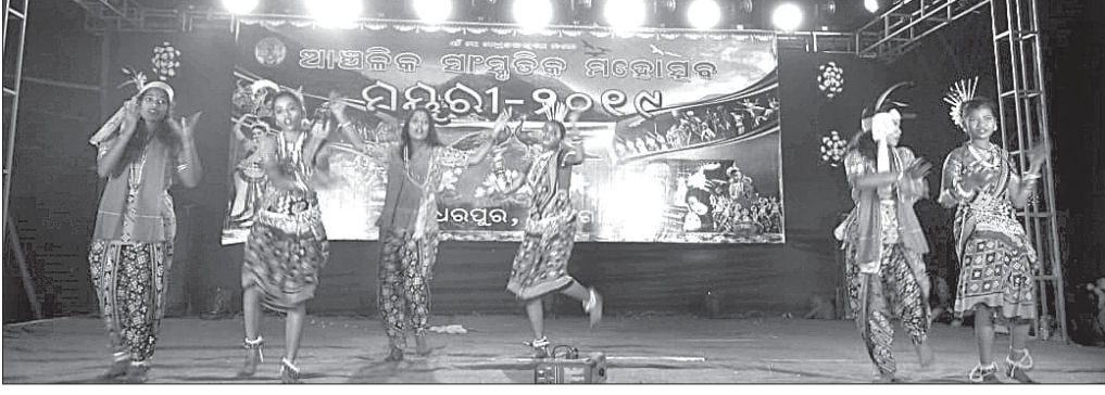
ବର୍ଷରପାଳ, ୨୦୧୯ (ଡି.ଏନ.ଏ.)

ବର୍ଷରପାଳ ରୁକ୍ମ ମହିପାଳପୁର ପଞ୍ଚାୟତରେ ଆଞ୍ଚଳିକ ସାଂସ୍କୃତିକ ମହୋତ୍ସବ ମୟୂରୀ-୨୦୧୯ ରୁପାବାର ସନ୍ଧ୍ୟାରେ ଉଦ୍‌ଘାଟିତ ହୋଇଯାଇଛି।