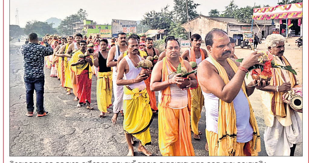
କିଶୋରନଗର ବୁକ ବଜାରରେ କାର୍ତ୍ତିକେଶ୍ୱର ପୂଜା ପାଇଁ ଗୁରୁବାର ଗ୍ରାମବାସୀଙ୍କ ପକ୍ଷରୁ କଳ୍ପସ ଯାତ୍ରା କରାଯାଇଛି ।