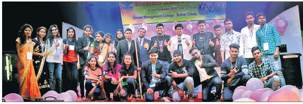
ଆଇ ଡ୍ରିମ୍ କଲେଜରେ ସ୍ୱାଗତ ଓ ପୁରସ୍କାର ବିତରଣ ଉତ୍ସବ ।