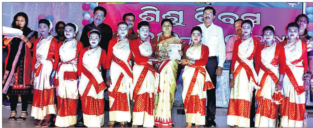
ଅତିଥିକ ସହ କାର୍ଯ୍ୟକ୍ରମରେ ଅଂଗ୍ରହଣ କରିଥିବା ଛାତ୍ରମାନେ ।