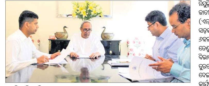
ନୂଆଦିଲ୍ଲୀ ସ୍ଥିତ ଓଡ଼ିଶା ଉପକରଣ ସମିତିର ମୁଖ୍ୟମନ୍ତ୍ରୀ ନବୀନ ପଟ୍ଟନାୟକ ଓ ଅନ୍ୟ ପଦାଧିକାରୀ।