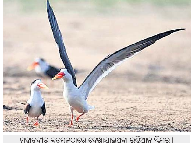
ମହାନଦୀର ବତମ୍ବୁଲରେ ଦେଖାଯାଇଥିବା ଇଣ୍ଡିଆନ ସିମର।

ପ୍ରାକୃତିକ ପର୍ଯ୍ୟଟନସ୍ଥଳୀ ସାତକୋଶିଆ ସାଣ୍ଡ ରିସର୍ଟର ପର୍ଯ୍ୟଟକମାନଙ୍କୁ ଆକୃଷ୍ଟ କରୁଥିବା ବେଳେ ପକ୍ଷୀ ଇଣ୍ଡିଆନ ସିମର ପ୍ରତିବର୍ଷ ଭଳି ଚଳିତବର୍ଷ ମହାନଦୀର ବତମ୍ବୁଲରେ ଶୁଣ୍ଠାପଡ଼ି ନିର୍ଦ୍ଦେଶ ଦେଇଛନ୍ତି।