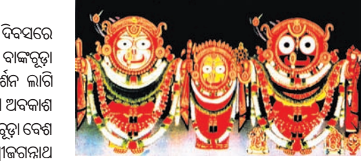
ଅଗ୍ର ଗଣ୍ଡିରେ ଏକ ସୁବର୍ଣ୍ଣ କିଆ ଖଞ୍ଜା ଯାଇଥିଲା। ଏକ ଛୋଟ ସ୍ୱର୍ଣ୍ଣ କିରୀଟ ମହାପ୍ରଭୁଙ୍କ କପାଳର ଶୀର୍ଷ

କାର୍ତ୍ତିକ ଶୁକ୍ଳ ଦ୍ୱାଦଶୀ ତଥା ପଞ୍ଚୁଳ ଦ୍ୱିତୀୟ ଦିବସରେ ଶନିବାର ରତ୍ନସିଂହାସନରେ ମହାପ୍ରଭୁଙ୍କ ବାଙ୍କଚୂଡ଼ା ବେଶ ଅନୁଷ୍ଠିତ ହୋଇଛି।