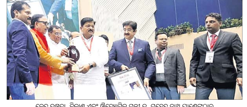
କେନ୍ଦ୍ର ଦକ୍ଷତା, ବିକାଶ ଏବଂ ଔଦ୍ୟୋଗିକ ମନ୍ତ୍ରୀ ଡ. ମହେନ୍ଦ୍ର ନାଥ ପାଣ୍ଡେଙ୍କଠାରୁ ମନ୍ତ୍ରୀ ପ୍ରତାପ ଜେନା ପୁରସ୍କାର ଗ୍ରହଣ କରୁଛନ୍ତି।

ଭାରତୀୟ ପଞ୍ଚାୟତିରାଜ ଏବଂ ପାନାୟ ଲକ୍ଷ୍ମୀ, ଆଇନ, ଗୃହ ଓ ନଗର ଉନ୍ନୟନ ମନ୍ତ୍ରୀ ପ୍ରତାପ ଜେନାଙ୍କୁ ସର୍ବଶ୍ରେଷ୍ଠ ମନ୍ତ୍ରୀ ପୁରସ୍କାର ପ୍ରଦାନ କରାଯାଇଛି।