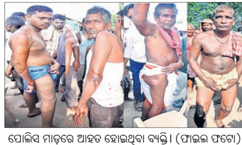
ପୋଲିସ ମାଡ଼ରେ ଆହତ ହୋଇଥିବା ବ୍ୟକ୍ତି। (ପାଇଲ ଫଟୋ)