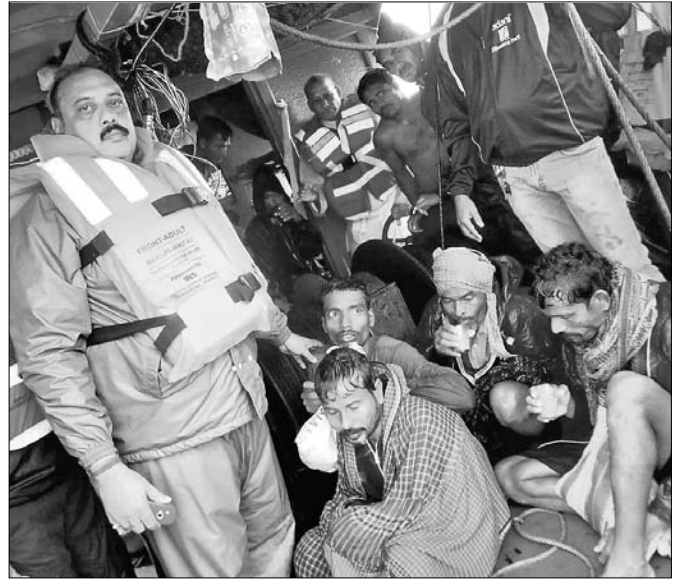
ସମୁଦ୍ରକୁ ଉଦ୍ଧାର ହୋଇଥିବା ମହ୍ୟଜୀବା।

ସାମୁଦ୍ରିକ ଝଡ଼ 'ବୁଲ୍‌ବୁଲ୍' ପ୍ରଭାବରେ ଶୁକ୍ରବାର ବିଳମ୍ବିତ ରାତିରେ ଭଦ୍ରକ ଜିଲ୍ଲାର ଧାମରା ମୁହାଣରେ ଏକ ବୋର୍ଡ଼ ବୁଡ଼ିଯାଇଥିଲା। ସେଥିରେ ଥିବା ୯ ଜଣ ମହ୍ୟଜୀବା ଓ କର୍ମଚାରୀ ପହଁରି ପହଁରି ନିକଟତ୍ର କାଳିଭଞ୍ଜିଆଁ ଛାପରେ ରହିଥିଲେ।