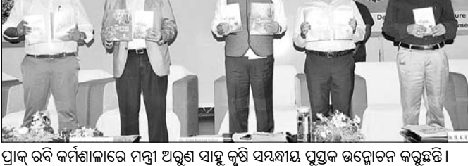
ପ୍ରାକ୍ ରବି କର୍ମଶାଳାରେ ମନ୍ତ୍ରୀ ଅରୁଣ ସାହୁ କୃଷି ସମ୍ବନ୍ଧୀୟ ପୁସ୍ତକ ଉଦ୍ଘୋଷଣା କରୁଛନ୍ତି।

କୃଷି ଓ କୃଷକ ସଶକ୍ତୀକରଣ ବିଭାଗ ପକ୍ଷରୁ କୃଷି ଭବନଠାରେ ଶୁକ୍ରବାର ଦୁଇଦିନିଆ ପ୍ରାକ୍ ରବି କର୍ମଶାଳା ଉଦ୍ଘାଟିତ ହୋଇଯାଇଛି।