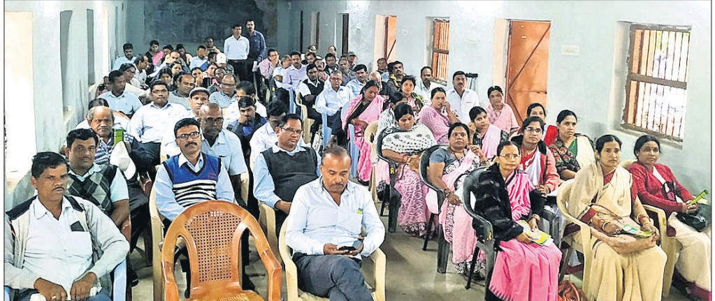
ସଚେତନତା କାର୍ଯ୍ୟକ୍ରମରେ ଉପସ୍ଥିତ ଶିକ୍ଷୟିତ୍ରୀ ଶିକ୍ଷକ ଓ ଅନ୍ୟମାନେ।

ପାଲଲହଡ଼ା, ୯।୧୧(ଡି.ଏନ.ଏ.)- ଅନୁଗୋଳ ଜିଲା ପାଲଲହଡ଼ା ଉପଖଣ୍ଡ ଆଲୁରି ପଞ୍ଚାୟତ ସମିତିର ଗ୍ରାମର ଜୁଲୁଗୁରା ଗ୍ରାମରୁ ଜଣେ ମହିଳାଙ୍କ ଅର୍ଦ୍ଧଦଗ୍ଧ ମୃତଦେହକୁ ଖମାର ପୋଲିସ୍ ଉଦ୍ଧାର କରିଛି। ମହିଳାଙ୍କ ମୃତଦେହ ଉଦ୍ଧାର ପରେ ପୋଲିସ୍ ଡାକ୍ତରୀରେ ମୃତଦେହର ଉପଚାର ନିର୍ବାହ କରାଯାଇଛି।