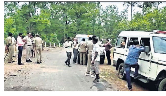
ଘଟଣାସ୍ଥଳରେ ପୋଲିସ୍ ଟିମ୍।

ପାଲଲହଡ଼ା, ୯।୧୧(ଡି.ଏନ.ଏ.)- ଅନୁଗୋଳ ଜିଲା ପାଲଲହଡ଼ା ଉପଖଣ୍ଡ ଆଲୁରି ପଞ୍ଚାୟତ ସମିତିର ଗ୍ରାମର ଜୁଲୁଗୁରା ଗ୍ରାମରୁ ଜଣେ ମହିଳାଙ୍କ ଅର୍ଦ୍ଧଦଗ୍ଧ ମୃତଦେହକୁ ଖମାର ପୋଲିସ୍ ଉଦ୍ଧାର କରିଛି। ମହିଳାଙ୍କ ମୃତଦେହ ଉଦ୍ଧାର ପରେ ପୋଲିସ୍ ଡାକ୍ତରୀରେ ମୃତଦେହର ଉପଚାର ନିର୍ବାହ କରାଯାଇଛି।