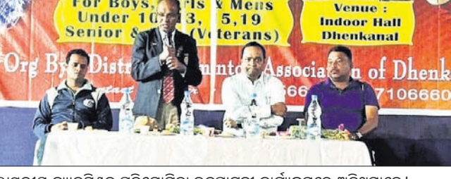
ଜିଲ୍ଲାସ୍ତରୀୟ ବ୍ୟାଡମିଣ୍ଟନ ପ୍ରତିଯୋଗିତା ଉଦ୍‌ଘାଟନୀ କାର୍ଯ୍ୟକ୍ରମରେ ଅତିଥିମାନେ ।

ଡେକାନାଲ ଜନତୋର ହଲ୍‌ରେ ଶନିବାର ଜିଲ୍ଲାସ୍ତରୀୟ ବ୍ୟାଡମିଣ୍ଟନ ପ୍ରତିଯୋଗିତା ଉଦ୍‌ଘାଟିତ ହୋଇଯାଇଛି । ଏହା ଆସନ୍ତା ୧୨ ତାରିଖ ଯାଏ ଚାଲିବ । ସର୍ବକନିଷ୍ଠ, କନିଷ୍ଠ, ବରିଷ୍ଠ ପୁରୁଷ ଏବଂ ମାଃବର୍ଷରୁ ଉର୍ଦ୍ଧ୍ୱ ପ୍ରତିଯୋଗୀ ଏଥିରେ ଭାଗ ନେଇଛନ୍ତି । ଉଭୟ ସିଙ୍ଗଲ୍ ଏବଂ ଡବଲ୍ ମ୍ୟାଚ୍ ଖେଳାଯିବ । ଏଥିରେ ଉଭୟ ପୁରୁଷ ଏବଂ ମହିଳା ଅଂଶଗ୍ରହଣ କରିବେ । ଏଥି ଲାଗି ୪ ବିଭାଗ କରାଯାଇଛି । ୧୦ବର୍ଷ, ୧୩ ବର୍ଷ, ୧୫ବର୍ଷ, ୧୯ବର୍ଷର ପ୍ରତିଯୋଗୀମାନେ ଡବଲ୍ ଓ ସିଙ୍ଗଲ୍ ବିଭାଗରେ ପ୍ରତିଭା ପ୍ରଦର୍ଶନ କରିବେ । ସେହିପରି ମାଃବର୍ଷ ଉର୍ଦ୍ଧ୍ୱ ବୟସର ପ୍ରତିଯୋଗୀଙ୍କୁ ନେଇ