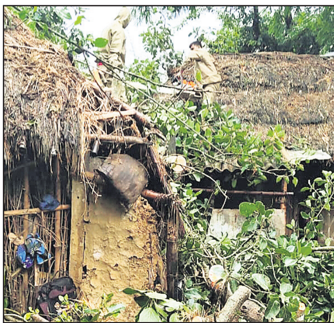
ଭଞ୍ଜାରିପୋଖରୀରେ ଅଗ୍ନିଶମ କର୍ମୀମାନେ ଘର ଉପରେ ପଡ଼ିଥିବା ଗଛ କାଟୁଛନ୍ତି ।