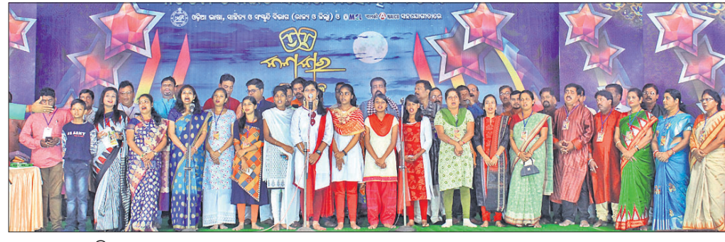
ସେବା ଓ ସଂସ୍କୃତି ଅନୁଷ୍ଠାନ କଳାକାର ସଦସ୍ୟାସଦସ୍ୟମାନେ।

ବର୍ତ୍ତମାନ, ୯।୧୧(ଡି.ଏନ.ଏ.)- ନାଲକୋ ଓ ବର୍ତ୍ତମାନ ଥାନା ଅଞ୍ଚଳରେ ବ୍ରାଉନ ସୁଗାର କାରବାର ବୃଦ୍ଧି ପାଇଛି। କିଛିଦିନ ତଳେ ପୋଲିସ୍ ନାଲକୋ ଓ ବର୍ତ୍ତମାନ ଅଞ୍ଚଳରୁ ବ୍ରାଉନସୁଗାର ଜବତ ସହ ୨ କିଲୋଗ୍ରାମ ବ୍ରାଉନସୁଗାର ଜବତ ହେବ ବୋଲି ଜଣାପଡ଼ିଛି।