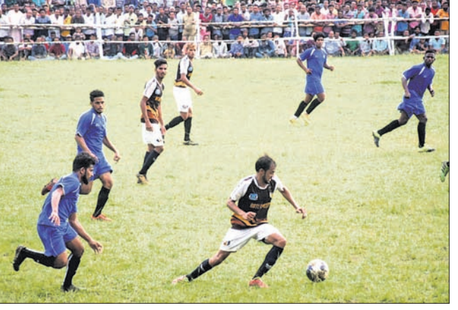
ରତଲାମ୍ ସିଟି ଫୁଟବଲ କ୍ଲବ୍ ଓ ସଂଘର୍ଷ କ୍ଲବ୍ ମଧ୍ୟରେ ୨ୟ ସେମିଫାଇନାଲ୍ ମ୍ୟାଚ୍।

ଦୟାଗଡ଼ ଅଫିସ୍, ୯୧୧୧ ହୋଇଥିଲା। ମଧ୍ୟପ୍ରଦେଶର ରତଲାମ୍ ସିଟି ଫୁଟବଲ କ୍ଲବ୍ ଓ ଭୁବନେଶ୍ୱରର ସଂଘର୍ଷ କ୍ଲବ୍ ମଧ୍ୟରେ ସେମିଫାଇନାଲ ଖେଳାଯାଇଥିଲା। ଏଥିରେ ମଧ୍ୟପ୍ରଦେଶ ୨-୦ ଗୋଲ୍ରେ ବିଜୟ ଲାଭ କରି ଫାଇନାଲ୍ରେ ପ୍ରବେଶ କରିଛି। ଫଳରେ ରବିବାର ସାଇ ହାଲ୍ ସୁନାବେଡ଼ା ଓ ରତଲାମ୍ ସିଟି ଫୁଟବଲ କ୍ଲବ୍ ମଧ୍ୟରେ ଫାଇନାଲ୍ ମ୍ୟାଚ୍ ଅନୁଷ୍ଠିତ ହେବ।