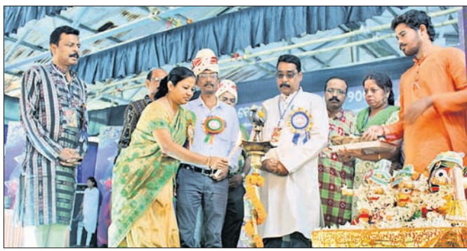
ମହୋତ୍ସବକୁ ଅଭିଯୋଗରେ ଉଦ୍‌ଘାଟନ କରୁଛନ୍ତି।

ଅନୁଗୋଳର ସେବା ଓ ସଂସ୍କୃତି ଅନୁଷ୍ଠାନ 'କଳାକାର' ପକ୍ଷରୁ ଘାଟମଣି ବୋଇତ ବନ୍ଦୀ ମହୋତ୍ସବ ୨୦୧୯ ଶନିବାର ଉଦ୍‌ଘାଟିତ ହୋଇଯାଇଛି।