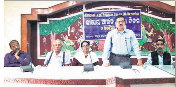
କାର୍ଯ୍ୟକ୍ରମରେ ଉପସ୍ଥିତ ଅତିଥିମାନେ।