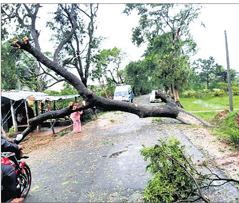
ଆରଡ଼ି-ଭଦ୍ରକ ରାସ୍ତାରେ ଗଛ ପଡ଼ିଥିବା ଯୋଗୁ ଏକ ଆୟୁରାଜ୍ଞ ଅଟକି ରହିଛି ।