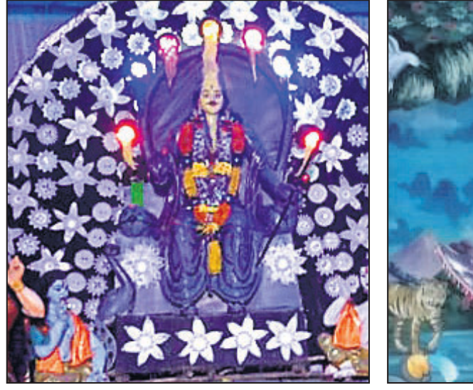
ଧର୍ମଶାଳୀ ପୁରୀରେ କାର୍ତ୍ତିକେଶ୍ଵର ପୂଜା।

ବର୍ତ୍ତମାନ, ୯।୧୧(ଡି.ଏନ.ଏ.)- ବର୍ତ୍ତମାନ ଥାନା ଅଞ୍ଚଳରେ ବ୍ରାଉନ ସୁଗାର କାରବାର ବୃଦ୍ଧି ପାଇଛି। କିଛିଦିନ ତଳେ ପୋଲିସ୍ ନାଲକୋ ଓ ବର୍ତ୍ତମାନ ଅଞ୍ଚଳରୁ ବ୍ରାଉନସୁଗାର ଜବତ ସହ ୨ କିଲୋଗ୍ରାମ ବ୍ରାଉନସୁଗାର ଜବତ ହେବ ବୋଲି ଜଣାପଡ଼ିଛି।