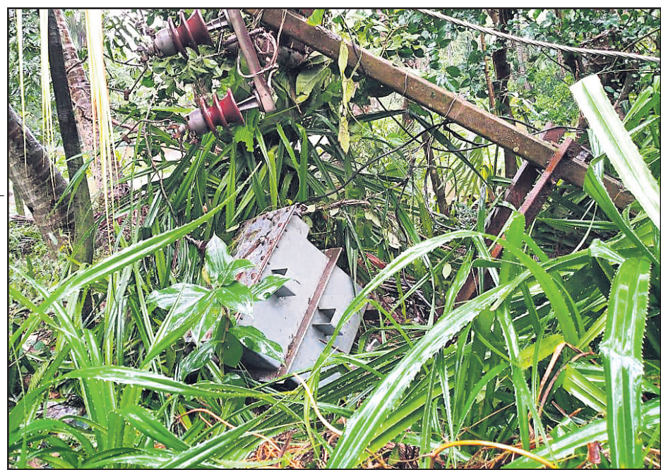
ଚାନ୍ଦବାଲିଠାରେ ଏକ ଗ୍ରାହ୍ୟତୀର ଭାଙ୍ଗିପଡ଼ିଛି ।