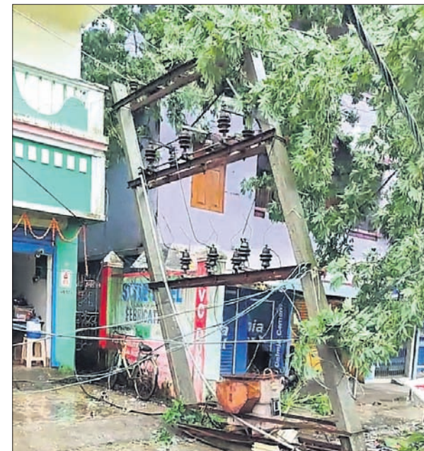
ବାଲେଶ୍ୱର ଆଇଟିଆଇ ଛକ ନିକଟରେ ଗ୍ରାହ୍ୟତୀର ନଳି ପଡ଼ିଛି ।