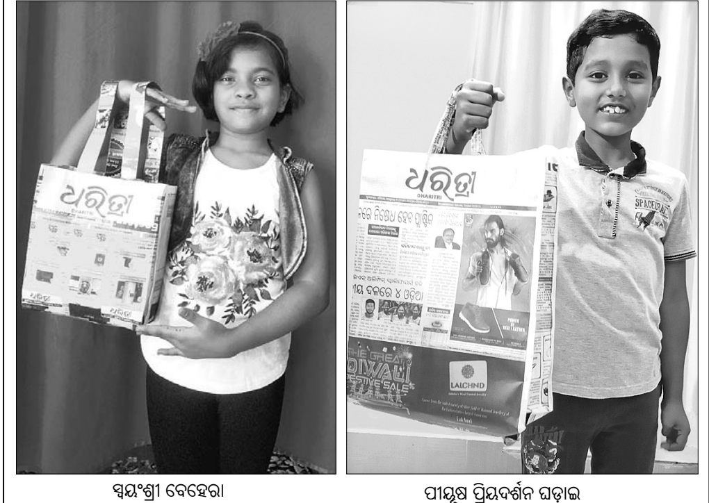
ସ୍ୱୟଂଶ୍ରୀ ବେହେରା ପାଠ୍ୟ ପ୍ରିୟବର୍ଗନ ଘଡ଼ାଇ

ଆପଣଙ୍କ ଫଟୋ ଏଠାରେ ସ୍ଥାନିତ ପାଇଁ ପଠାନ୍ତୁ plasticfreeodishadht@gmail.com