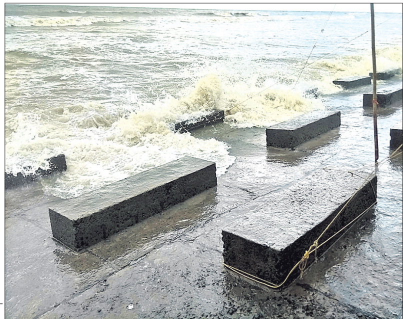
ଉପକୂଳରେ ବେଙ୍ଗାଳୀରେ ସମୁଦ୍ର ଉଚ୍ଚତା ଉଚ୍ଚ କୁଳରେ ମାଡ଼ ହେଉଛି ।

ବଙ୍ଗୋପସାଗରରେ ବାତ୍ୟା ରୂପ ନେଇଥିବା 'ବୁଲ୍‌ବୁଲ୍' ଶନିବାର ସନ୍ଧ୍ୟା ୭ଟା ସୁଦ୍ଧା ବାଲେଶ୍ୱର ଉପକୂଳ ଅତିକ୍ରମ କରିଛି । ୧୦୦ କି.ମି.ରୁ ଊର୍ଦ୍ଧ୍ୱ ବେଗରେ ପବନ ବହିବା ସାଙ୍ଗକୁ ପ୍ରବଳ ବର୍ଷା ହେବା ଯୋଗୁ ଉପକୂଳ ଅଞ୍ଚଳରେ ବ୍ୟାପକ କ୍ଷୟକ୍ଷତି ଘଟିଛି । ଭଦ୍ରକ ଓ ବାଲେଶ୍ୱର ଜିଲାର ବିଭିନ୍ନ ସ୍ଥାନରେ ଶତାଧିକ ଗଛ ଓ ବିଦ୍ୟୁତ୍ ଖୁଣ୍ଟି ଭାଙ୍ଗିପଡ଼ିଛି । ବହୁ ଅଞ୍ଚଳ ଅଧିକାରାଳୟ ହୋଇ ରହିଛି । ବାତ୍ୟା 'ବୁଲ୍‌ବୁଲ୍' ଛାଡ଼ିଯାଇଛି ଏଠି ଅନେକ କ୍ଷତିକ୍ରମ ।