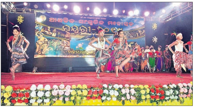
ଉଦ୍‌ଘାଟନୀ ସମ୍ବନ୍ଧରେ କଳାକାରମାନେ ନୃତ୍ୟ ପରିବେଷଣ କରୁଛନ୍ତି।

ଅନୁଗୋଳ ଅଧିକାରୀ, ୯।୧୧ କାର୍ତ୍ତିକେଶ୍ଵର ପୂଜା ପାଇଁ ଅନୁଗୋଳ ବସନ୍ତ ପଞ୍ଚାୟତର ଧର୍ମଶାଳୀ ପୁରୀ (ଲୋକେଇପାଣି) ଉତ୍ସବମୁଖର ଉଦ୍‌ଘାଟିତ ହୋଇଛି। ଶନିବାରବାର ଠାରୁ ଆରମ୍ଭ ହୋଇଥିବା ଏହି ପୂଜା ଆୟତ୍ତ ୧୨ ତାରିଖରେ ଶେଷ ହେବ ବୋଲି ଅନୁଷ୍ଠାନ ପକ୍ଷରୁ ଜଣାଯାଇଛି।