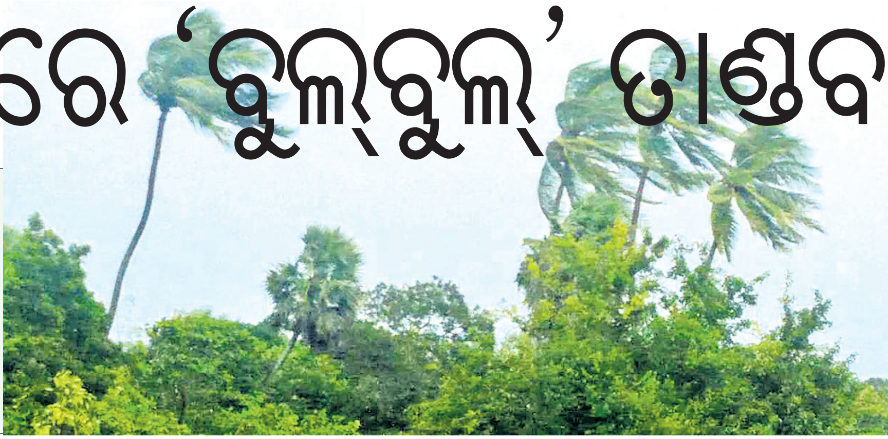
ବାତ୍ୟା ପ୍ରଭାବରେ ବାଲେଶ୍ୱର ସହରରେ ପ୍ରବଳ ବେଗରେ ପବନ ବହୁଛି ।

ବଙ୍ଗୋପସାଗରରେ ବାତ୍ୟା ରୂପ ନେଇଥିବା 'ବୁଲ୍‌ବୁଲ୍' ଶନିବାର ସନ୍ଧ୍ୟା ୭ଟା ସୁଦ୍ଧା ବାଲେଶ୍ୱର ଉପକୂଳ ଅତିକ୍ରମ କରିଛି । ୧୦୦ କି.ମି.ରୁ ଊର୍ଦ୍ଧ୍ୱ ବେଗରେ ପବନ ବହିବା ସାଙ୍ଗକୁ ପ୍ରବଳ ବର୍ଷା ହେବା ଯୋଗୁ ଉପକୂଳ ଅଞ୍ଚଳରେ ବ୍ୟାପକ କ୍ଷୟକ୍ଷତି ଘଟିଛି । ଭଦ୍ରକ ଓ ବାଲେଶ୍ୱର ଜିଲାର ବିଭିନ୍ନ ସ୍ଥାନରେ ଶତାଧିକ ଗଛ ଓ ବିଦ୍ୟୁତ୍ ଖୁଣ୍ଟି ଭାଙ୍ଗିପଡ଼ିଛି । ବହୁ ଅଞ୍ଚଳ ଅଧିକାରାଳୟ ହୋଇ ରହିଛି । ବାତ୍ୟା 'ବୁଲ୍‌ବୁଲ୍' ଛାଡ଼ିଯାଇଛି ଏଠି ଅନେକ କ୍ଷତିକ୍ରମ ।