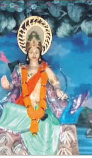
ବନ୍ତଳ ଅଞ୍ଚଳରେ ଅନୁଷ୍ଠିତ କାର୍ତ୍ତିକେଶ୍ଵର ମେଳ।