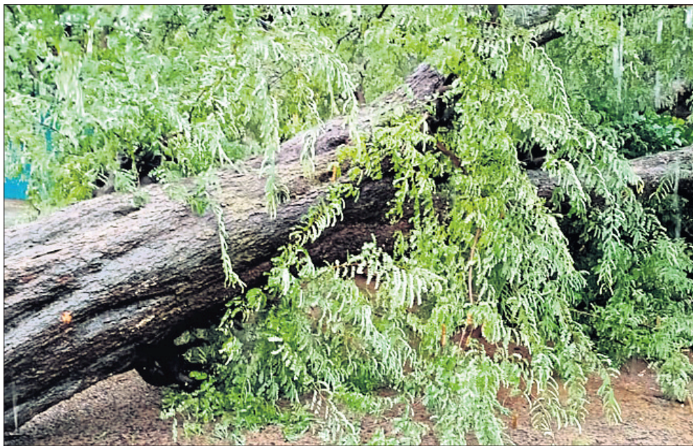
ବାଲେଶ୍ୱର ସେଣ୍ଟାଲ ଷୁଲ ନିକଟରେ ଏକ ବଡ଼ ଗଛ ଭାଙ୍ଗି ପଡ଼ିଛି ।