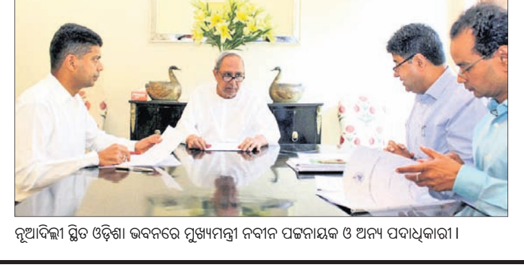
ନୂଆଦିଲ୍ଲୀ ସ୍ଥିତ ଓଡ଼ିଶା ଭବନରେ ପୁଖ୍ୟମନ୍ତ୍ରୀ ନବୀନ ପଟ୍ଟନାୟକ ଓ ଅନ୍ୟ ପଦାଧିକାରୀ।

୬ହଜାର କୋଟି ଟଙ୍କା ବକେୟା ରହିଛି। ତେଣୁ କେନ୍ଦ୍ରୀୟ ଅଧିକାରୀ ସହ ରାଜ୍ୟର ବିଭାଗଗୁଡ଼ିକ ସମନ୍ୱୟ ରକ୍ଷା କରି ସହାୟ ଗୁରୁତ୍ୱ ସମାଧାନ ପାଇଁ ପୁଖ୍ୟମନ୍ତ୍ରୀ ନିର୍ଦ୍ଦେଶ ଦେଇଛନ୍ତି। ସେହିଭଳି ୫-ଟି (ବଳଗତ କାର୍ଯ୍ୟ, ସ୍ୱଚ୍ଛତା, ବୈଷୟିକ ବିଦ୍ୟା, ସମୟ ଏବଂ ପରିବର୍ତ୍ତନ ରୁପ) ଯେପରି କାର୍ଯ୍ୟକାରୀ ହୋଇପାରିବ, ସେ ନେଇ ଆଲୋଚନା କରାଯାଇଥିଲା। ଏହାକୁ ପ୍ରତି କାର୍ଯ୍ୟରେ ଲାଗାଇବା ପାଇଁ ପୁଖ୍ୟମନ୍ତ୍ରୀ ଆବାସିକ କମିଶନର, ସ୍ୱତନ୍ତ୍ର ଆବାସିକ କମିଶନରଙ୍କୁ ନିର୍ଦ୍ଦେଶ ଦେଇଥିଲେ। ନୂଆଦିଲ୍ଲୀରେ ଓଡ଼ିଶା ସରକାର ଏକ ସାଂସ୍କୃତିକ କେନ୍ଦ୍ର କରିବାକୁ ଚାହୁଁଛନ୍ତି। ଏଥିପାଇଁ ଜମି ବ୍ୟବସ୍ଥା କରିବା ଲାଗି ପ୍ରକ୍ରିୟା ଆରମ୍ଭ କରିବାକୁ ପୁଖ୍ୟମନ୍ତ୍ରୀ ଅଧିକାରୀମାନଙ୍କୁ ନିର୍ଦ୍ଦେଶ ଦେଇଛନ୍ତି।