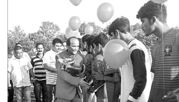
ଅତିଥିମାନେ ଖେଳାଳିଙ୍କ ସହ କରମର୍ଦ୍ଦନ କରୁଛନ୍ତି।