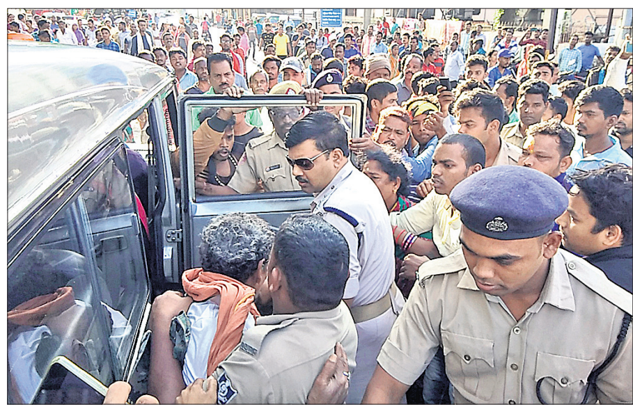
ଉଦ୍ଧାର ଏସିବି ନେତାଙ୍କୁ କାନ୍ଥୁଆଲିଟିରେ ଶିଶୁ ମୃତ୍ୟୁକୁ ନେଇ ଉଦ୍ଧେଷିତାରେ ଘଟଣାସ୍ଥଳରେ ପୋଲିସ ବୁଝାଖୁଣି କରୁଛି। ମୃତ ଶିଶୁଙ୍କୁ ଧରି କ୍ରନ୍ଦନରେ ପରିବାରବର୍ଗ।