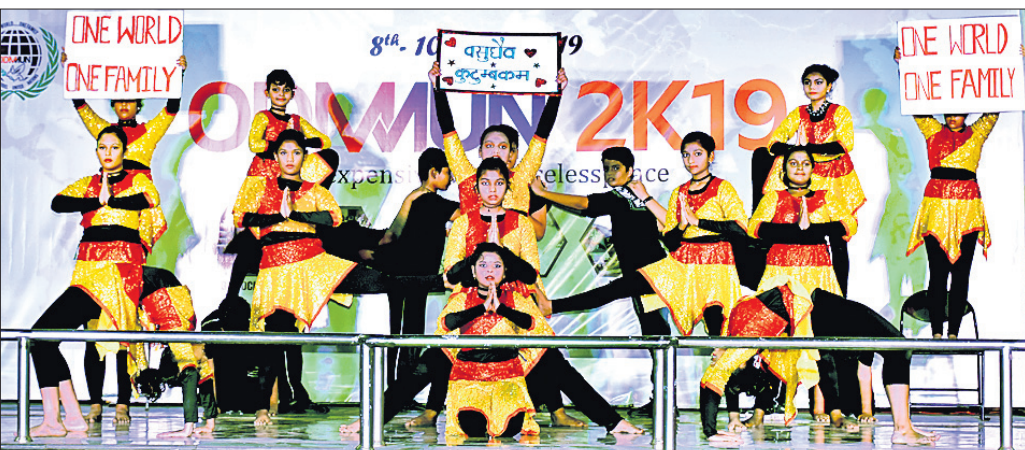
ଛାତ୍ରାଛାତ୍ରୀଙ୍କ ଦ୍ୱାରା ପରିବେଷିତ ନୃତ୍ୟ ।

ପଢ଼ୋଶା ରାଷ୍ଟ୍ରଗୁଡ଼ିକ ସହ ଆଜି ଆମର ଭଲ ସମ୍ପର୍କ ନାହିଁ । କେବଳ ପାକିସ୍ତାନ ନୁହେଁ, ଭାରତର ସାମାଜିକ ସ୍ଥିତିକୁ କୋଣସି ଗୋଟିଏ ବି ଦେଶ ଆଜି ଭାରତ ଉପରେ ସନ୍ତୁଷ୍ଟ ନାହାନ୍ତି । ଶ୍ରୀଲଙ୍କା ଲୋକେ ନିଜ ଦେଶରେ ଭାରତୀୟକଠାରୁ ଚାଲିନିଜମାନଙ୍କୁ ଅଧିକ ପସନ୍ଦ କରୁଛନ୍ତି । ସେହିପରି ବାଲୀଦେଶ ଭଳି ଅନ୍ୟ ଛୋଟ ଛୋଟ ରାଷ୍ଟ୍ରଗୁଡ଼ିକ ମଧ୍ୟ ଭାରତୀୟଙ୍କୁ ସହଜରେ ଗ୍ରହଣ କରିପାରୁନାହାନ୍ତି । ତାହା ପ୍ରତି ମୁହୂର୍ତ୍ତରେ ଭାରତକୁ ଧୋକା ଦେବାକୁ ଚେଷ୍ଟା କରୁଥିଲେ ମଧ୍ୟ ଆମେ ନିଜଠାରୁ ବହୁ ଛୋଟ ଦେଶ ପାକିସ୍ତାନ ପଛରେ ପଡ଼ିଛୁ । ଦିନକୁ ଦିନ ଆମ ମଧ୍ୟରେ ସହନଶୀଳତା କମିଯାଉଛି । ଉତ୍କଳ, କଳା, ସଂସ୍କୃତି, ଭାଷା ଓ ଐତିହ୍ୟର ପରିଚୟ ନେଇ ଆମେ ଆମ ପଢ଼ୋଶାକୁ ସାନ ଭାଇ, ଭଉଣୀ ଭଳି ବ୍ୟବହାର କରିବା ପରିବର୍ତ୍ତେ ହିଂସା, ଦ୍ୱେଷ ଓ ପର ଆପଣାଉ ଭେଦଭାବ ନେଇ ଚାଲୁଛୁ । ଦେଶପ୍ରେମ କଥା କହୁଥିବା ଭାରତୀୟ ଭୂଲିଯାଇଛନ୍ତି ଯେ, ୧୯୪୦ ପୂର୍ବରୁ ପାକିସ୍ତାନ, ବାଲୀଦେଶ, ବର୍ମା, ନେପାଳ ଓ ଆଫଗାନିସ୍ତାନର କିଛି ଅଂଶ ଭାରତ ସହ ଯୋଡ଼ିହୋଇଥିଲା । ଆମେ ସମସ୍ତେ ଗୋଟିଏ ପରିବାରର ଅଂଶ ଓ ଭ୍ରାତୃଭ୍ରତ ଭାବ ନେଇ ଚାଲିବା ଆମର ପରିଚୟ ବୋଲି ପୂର୍ବତନ ଏମ୍ପି ଡିଆ ‘ଧାରତ୍ରୀ’ ଏବଂ ‘ଓଡ଼ିଶା ପୋଷ୍ଟ’ର