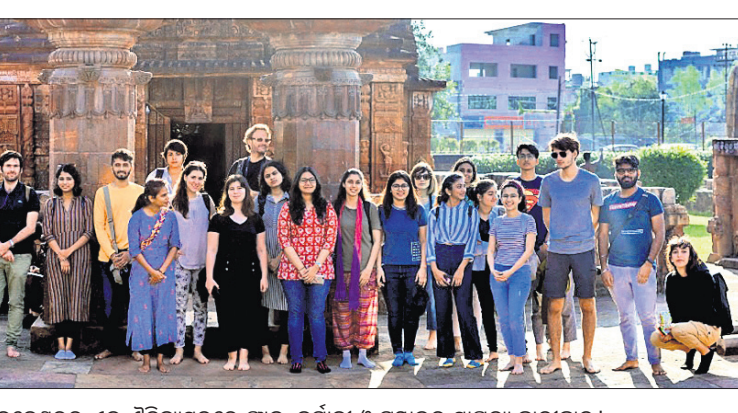
ଉଦ୍ଧାର ଏସିବି ପଦଯାତ୍ରାବେଳେ ପୁରୁଣା ଭୁବନେଶ୍ୱରର ଏକ ଏତିହ୍ୟସ୍ଥଳରେ ପ୍ରାନ୍ତ, ଜର୍ମାନୀ ଓ ମୁସଲିମ ସ୍ତ୍ରୀମାନଙ୍କୁ ସ୍ୱାଗତ୍ୟ କରାଯାଇଛି।

ଉଦ୍ଧାର ଏସିବି ନେତାଙ୍କୁ କାନ୍ଥୁଆଲିଟିରେ ଶିଶୁ ମୃତ୍ୟୁକୁ ନେଇ ଉଦ୍ଧେଷିତାରେ ଘଟଣାସ୍ଥଳରେ ପୋଲିସ ବୁଝାଖୁଣି କରୁଛି। ମୃତ ଶିଶୁଙ୍କୁ ଧରି କ୍ରନ୍ଦନରେ ପରିବାରବର୍ଗ।