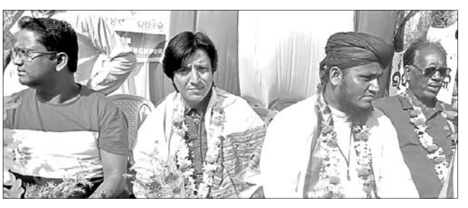
ମହମ୍ମଦଙ୍କ ଜୟନ୍ତୀ ଉତ୍ସବରେ ଯୋଗ ଦେଇଥିବା ଅତିଥି।