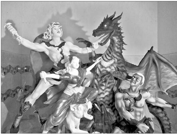
ବାରଙ୍ଗର ବିଭିନ୍ନ ସ୍ଥାନରେ କାର୍ତ୍ତିକେଶ୍ୱରଙ୍କ ପୂଜା: କୁସିଂଧା ପୂଜା ମଣ୍ଡପ।