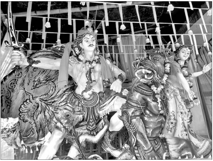
କୃଷ୍ଣଚନ୍ଦ୍ରପୁର ପୂଜା ମଣ୍ଡପ।