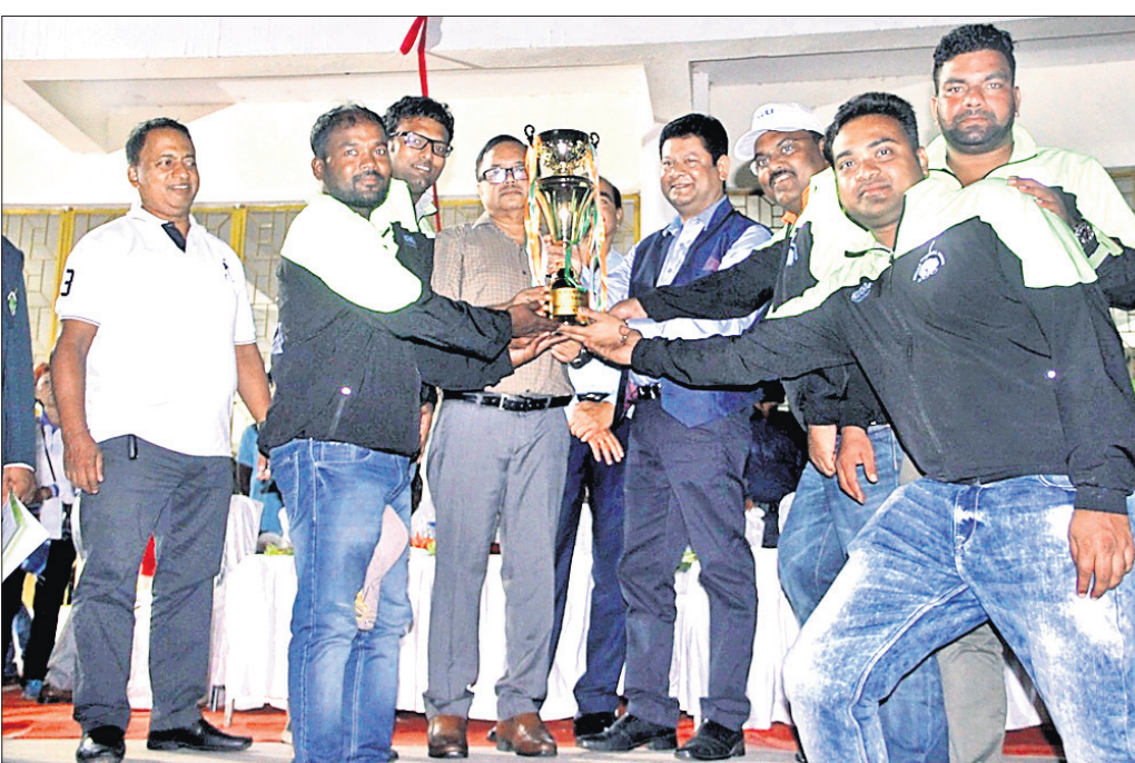
ଚାମ୍ପିୟନ ଓଡ଼ିଶା 'ଏ' ଦଳର ଖେଳାଳିମାନେ ଅତିଥିକାଠାରୁ ଟ୍ରଫି ଗ୍ରହଣ କରୁଛନ୍ତି।

ଦଳ ଭାଗ ନେଇଥିଲେ। ଭାରତ ବାହାରୁ ଲେଖାଏ 'ଏ' ଚାମ୍ପିୟନର ଗତି ଦଳ ଅନ୍ତର୍ଗ୍ରହଣ କରିଥିଲେ। ଏହା ବ୍ୟତୀତ ଓଡ଼ିଶା ବାହାରୁ ମହାରାଷ୍ଟ୍ର, ଆସାମ, ପଶ୍ଚିମବଙ୍ଗ, ଦିଲ୍ଲୀ, ହରିୟାଣା ଓ ଚଣ୍ଡିଗଡ଼ରୁ ଗୋଟିଏ ଲେଖାଏ ଦଳ ଭାଗ ନେଇଥିଲେ।