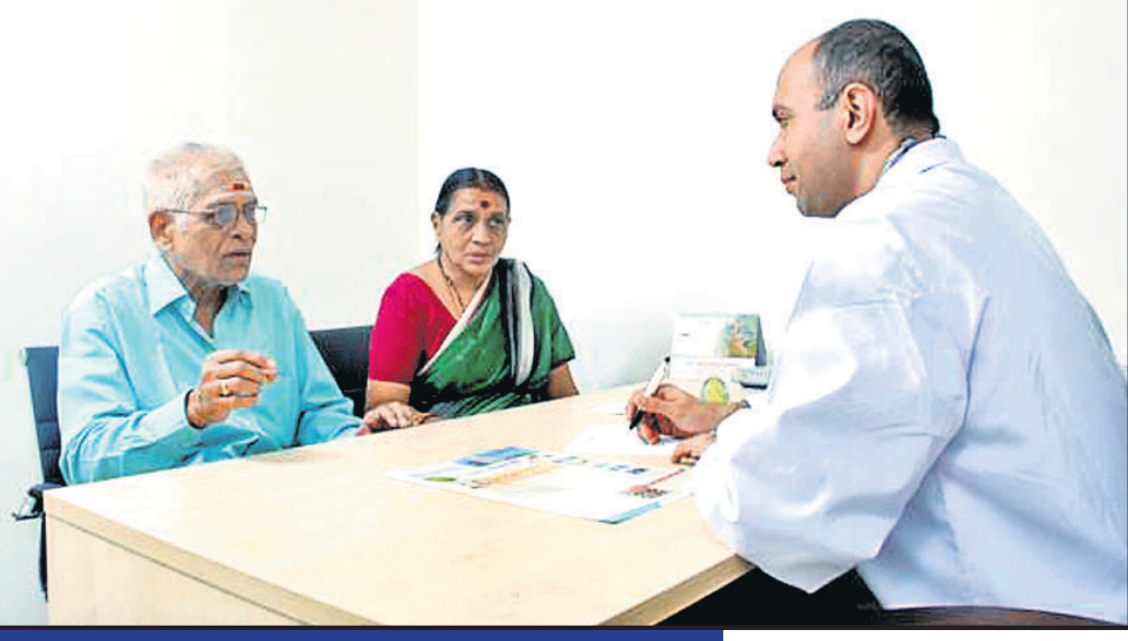
ଚଳିତ ମାସ ୧୪ ତାରିଖରେ ପାଳିତ ହେବ 'କାଳି ଯାଉଛି ବିଶ୍ୱ ମଧୁମେହ ଦିବସ'। ସେ ସମ୍ପର୍କିତ ବିଷୟବସ୍ତୁକୁ ନେଇ ଉପସ୍ଥାପନା...

“ପରିବାରରେ ଡାଇବେଟିସ୍ ରୋଗୀ ଥିଲେ ତାଙ୍କ ଖାଦ୍ୟପେୟରେ କେତେକ ପରିବର୍ତ୍ତନ ଲୋଡ଼ାପଡ଼େ। ତେଣୁ ରୋଗୀଙ୍କ ମନସ୍ତତ୍ତ୍ୱକୁ ସମ୍ମାନ ଦେଇ ତଥା ଆନୁଷ୍ଠାନିକ ସୁବିଧା ପାଇଁ ପରିବାରର ଅନ୍ୟ ସଦସ୍ୟମାନଙ୍କ ଖାଦ୍ୟ ମଧ୍ୟ ପରିବର୍ତ୍ତନ ହୋଇଯିବା ସ୍ୱାଭାବିକ।”