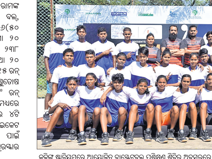
କଳିଙ୍ଗ ସ୍ମୃତିୟମରେ ଆୟୋଜିତ ବାୟୋଟେକ୍‌ସ୍‌ ପ୍ରଶିକ୍ଷଣ ଶିବିର ଅବସରରେ ପ୍ରଶିକ୍ଷାର୍ଥୀ ଓ ଅନ୍ୟମାନେ।