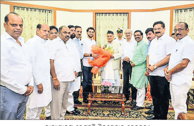
ରାଜ୍ୟପାଳଙ୍କୁ ଭେଟୁଛନ୍ତି ଶିବସେନାର ନେତୃବୃନ୍ଦ।

ସରକାର ଗଠନ ଦାବିକୁ ଏକ ସଂଖ୍ୟାଗରିଷ୍ଠ ଦଳ ଭାଙ୍ଗିବା ଓହ୍ଲାଇବା ପରେ ଏବେ ଦ୍ୱିତୀୟ ବୃହତ୍ ଦଳ ଶିବସେନା ଏଥିପାଇଁ ଅଣ୍ଟା ଭିଡ଼ିଛି। ଏହି ଦଳକୁ ସମର୍ଥନ ଦେବା ଲାଗି ଏନ୍‌ସିପି ପ୍ରସ୍ତୁତ ଥିଲାବେଳେ କଂଗ୍ରେସ ନିଷ୍ପତ୍ତିକୁ ଖୁଲାଇ ରଖିଛି। ସୋମବାର ସଂଖ୍ୟାଗରିଷ୍ଠ ଶିବସେନା ପ୍ରତିନିଧି ରାଜ୍ୟପାଳ ଭବନ ଦି' କୋଣାର୍କକୁ ଭେଟିଥିଲେ। ସେମାନେ ସରକାର ଗଠନ ଲାଗି ପ୍ରସ୍ତୁତ ବୋଲି କହିବା ସହ ଏଥିପାଇଁ ୪୮ ଘଣ୍ଟା ସମୟ ମାଗିଥିଲେ। ତେବେ ଅଧିକ ସମୟ ଦେବା ଲାଗି ଶିବସେନାର ଅନୁରୋଧକୁ ରାଜ୍ୟପାଳ ପ୍ରତ୍ୟାଖ୍ୟାନ କରିଦେଇଛନ୍ତି। ରାଜ୍ୟପାଳ ଏନ୍‌ସିପିକୁ ଡାକିଥିବା ଦଳର ନେତା ଅଜିତ ପାଠ୍ୟୁର ସୂଚନା ଦେଇଛନ୍ତି। ଏନ୍‌ସିପିକୁ ୨୪ ଘଣ୍ଟା ମଧ୍ୟରେ ସରକାର ଗଠନ ନେଇ ସମୟ ଦିଆଯାଇଥିବା ସରକାରରେ ଶିବସେନାର ଏକମାତ୍ର ମନ୍ତ୍ରୀ ଥିବା ଅରବିନ୍ଦ ସାଞ୍ଜୁର ସୋମବାର ଇସ୍ତଫା ଦେବା ଫଳରେ ଏହି ଦଳ ଜାତୀୟ