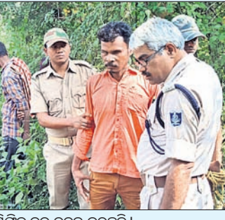
ପୋଲିସ୍ ଓ ସାଇଣ୍ଟିଫିକ୍ ଦଳ ତଦନ୍ତ କରୁଛନ୍ତି।