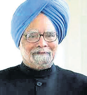
କାର୍ଯ୍ୟକାରୀ ଶେଷ ହୋଇଥିଲାବେଳେ ଅଗଷ୍ଟରେ ସେ ରାଜସ୍ଥାନକୁ ପୁଣିଥରେ ଭଜ ସଦନକୁ ନିର୍ବାଚିତ ହୋଇଛନ୍ତି।

ଦିଲ୍ଲୀ, ୧୧।୧୧(ପି.ଟି.) ରାଜ୍ୟ ସଭା ଅଧ୍ୟକ୍ଷ ଏମ୍ ଭେଙ୍କାୟା ନାଲକୁ ପୂର୍ବତନ ପ୍ରଧାନମନ୍ତ୍ରୀ ଡ଼ା. ବରିଷ୍ଠ କଂଗ୍ରେସ ନେତା ମନମୋହନ ସିଂଙ୍କୁ ଅର୍ଥ ସଂକ୍ରାନ୍ତ ସଂସଦୀୟ ଷ୍ଟାଣ୍ଡିଂ କମିଟିକୁ ମନୋନୀତ କରିଛନ୍ତି। ବିଗତ କର୍ତ୍ତୃକ୍ରମ ଗ୍ଲାନରେ ତାଙ୍କୁ ନିଆଯାଇଛି। ବିଗତ କର୍ତ୍ତୃକ୍ରମ ସହରାଞ୍ଚଳ ବିକାଶ ଷ୍ଟାଣ୍ଡିଂ କମିଟିକୁ ମନୋନୀତ ହୋଇଥିବା ଜଣାପଡିଛି। ମନମୋହନଙ୍କୁ ଅର୍ଥ କମିଟିରେ ନେବା ଲାଗି ବିଗତ କର୍ତ୍ତୃକ୍ରମ ଗ୍ଲାନରେ ତାଙ୍କୁ ନିଆଯାଇଛି। ଗତ ଜୁନ୍‌ରେ ମନମୋହନଙ୍କ ରାଜ୍ୟ ସଭା