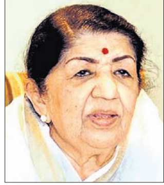
ମୁମ୍ବାଇ, ୧୧/୧୧ (ପି.ଟି.)