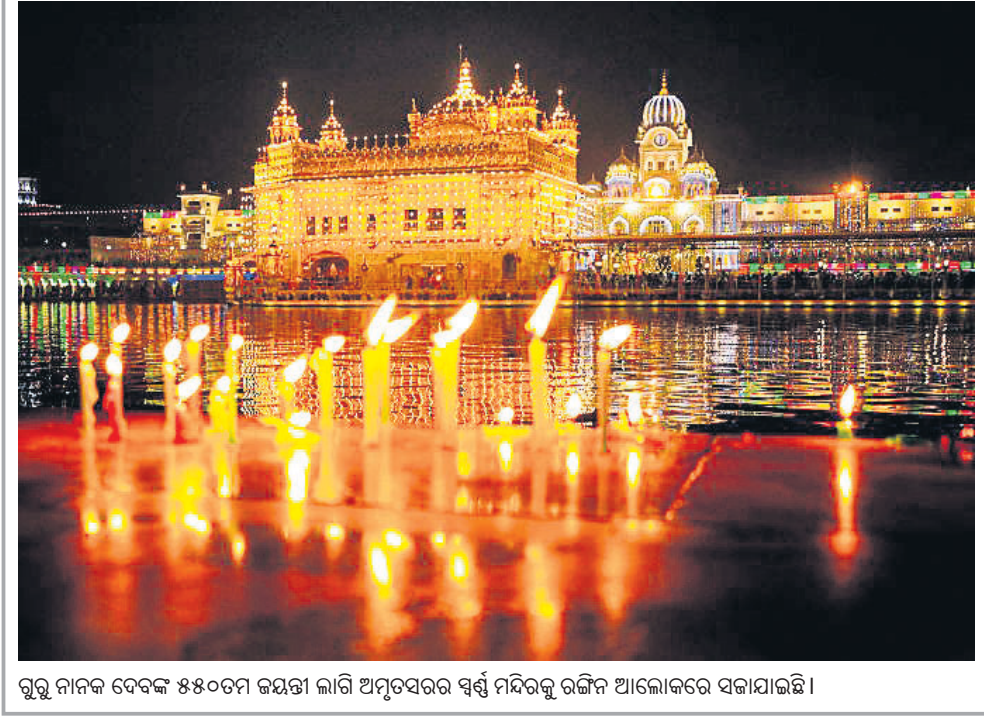
ରୁକୁ ନାନକ ଦେବଙ୍କ ୫୫୦ତମ ଜୟନ୍ତୀ ଲାଗି ଅମୃତସରର ସ୍ୱର୍ଣ୍ଣ ମନ୍ଦିରକୁ ରଙ୍ଗିନି ଆଲୋକରେ ସଜାଯାଇଛି।