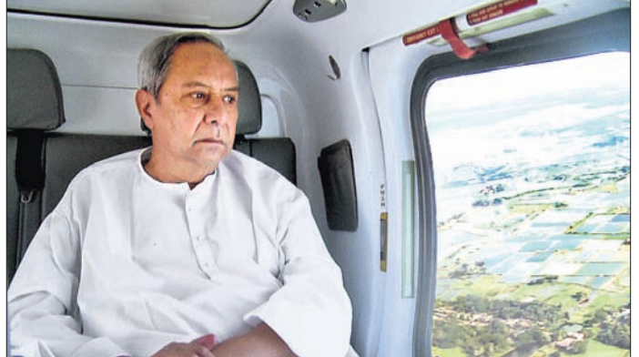
ମୁଖ୍ୟମନ୍ତ୍ରୀ ନବୀନ ପଟ୍ଟନାୟକ ହେଲିକପ୍ଟରକୁ ବାଦ୍ୟା ପ୍ରଭାବିତ ଅଞ୍ଚଳ ଅନୁଧ୍ୟାନ କରୁଛନ୍ତି।

ବାଦ୍ୟା 'ବୁଲୁବୁଲୁ' ପ୍ରଭାବରେ ଉପକୂଳ ଓଡ଼ିଶାର ୬ ଜିଲ୍ଲାରେ ବ୍ୟାପକ କ୍ଷତି ଘଟିଛି। ଘରବାର ଭାଙ୍ଗିବା ସହ ଲକ୍ଷ ଲକ୍ଷ ହେକ୍ଟର ଜମିରେ ଫସଲ ଉଚ୍ଛୃଷ୍ଟି ଯାଇଛି। ଧାନ, ବିରି, ମୁଗ ଓ ପରିବା ଫସଲ ନଷ୍ଟ ହୋଇଛି। ମୁଖ୍ୟମନ୍ତ୍ରୀ ନବୀନ ପଟ୍ଟନାୟକ ସୋମବାର ମଧ୍ୟାହ୍ନରେ ଜଗତସିଂହପୁର, କେନ୍ଦ୍ରାପଡ଼ା, ଭଦ୍ରକ, ବାଲେଶ୍ୱର, ଯାଜପୁର ଏବଂ ମୟୂରଭଞ୍ଜ ଜିଲ୍ଲାର ବାଦ୍ୟା କ୍ଷତିଗ୍ରସ୍ତ ଅଞ୍ଚଳକୁ ଆକାଶମାର୍ଗରୁ ଅନୁଧ୍ୟାନ କରିଛନ୍ତି। ରାଜ୍ୟ ସରକାରଙ୍କ ପ୍ରାଥମିକ ଆକଳନ ଅନୁଯାୟୀ ୫୫୦୦ ଘର କ୍ଷତିଗ୍ରସ୍ତ ହୋଇଥିବାବେଳେ ୩ ଲକ୍ଷ ହେକ୍ଟର ଚାଷ ଜମି ପ୍ରଭାବିତ ହୋଇଛି।