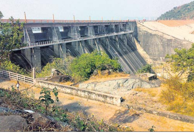
ଅବହେଳିତ ହୃଦଗଡ଼ ତ୍ୟାଗ ।

ଅର୍ଥନୈତିକ ବିକାଶ ହୋଇପାରିବ । ମାନ୍ୟତା ପାଇଥିବା ତ୍ୟାଗ ପର୍ଯ୍ୟଟନ କେନ୍ଦ୍ର ମଧ୍ୟରୁ ହାତଡ଼ିଆ ବୁଦ୍ଧର ହୃଦଗଡ଼ ଓ ସଦର ବୁଦ୍ଧର କାନଝରୀ ରହିଛି ।