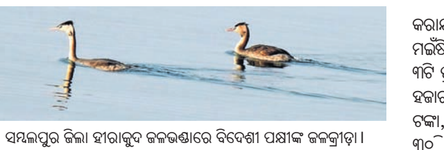
ସମ୍ଭଳପୁର ଜିଲ୍ଲା ହୀରାକୁଦ ଜଳଭଣ୍ଡାରେ ବିଦେଶୀ ପକ୍ଷୀ ଜଳକ୍ରୀଡ଼ା।

ସମ୍ଭଳପୁର ଜିଲ୍ଲା ହୀରାକୁଦ ଜଳଭଣ୍ଡାରୁ ବିଦେଶୀ ପକ୍ଷୀ ଆଗମନ ହୋଇଛି। ଯୋଗନାଥ ବନ୍ୟପ୍ରାଣୀ ବିଭାଗ କର୍ମଚାରୀ ଜଳଭଣ୍ଡାର ବିଭିନ୍ନ ସ୍ଥାନରେ ଏହି ବିଦେଶୀ ପକ୍ଷୀ ସମାଗମକୁ ଦେଖିବାକୁ ପାଇଛନ୍ତି। ଏହି ଅଞ୍ଚଳରେ ପକ୍ଷୀ ପ୍ରଜାତିର ସଂଖ୍ୟା ବୃଦ୍ଧି ପାଇବ ବୋଲି ବିଭାଗ କର୍ମଚାରୀ କହିଛନ୍ତି।