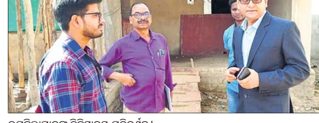
ଉପଜିଲ୍ଲାପାଳଙ୍କ ଚିକିତ୍ସାଳୟ ପରିଦର୍ଶନ ।