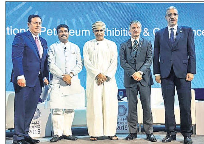
କେନ୍ଦ୍ରମନ୍ତ୍ରୀ ଧର୍ମେନ୍ଦ୍ର ପ୍ରଧାନ ଓ ଅନ୍ୟମାନେ।

କମ୍ପ୍ୟୁଟର ନିର୍ବାହନ ଅର୍ଥ ବ୍ୟବସ୍ଥା କରିବା ପାଇଁ ତଥା ଉର୍ଦ୍ଧାର ନିରନ୍ତର ଆବଶ୍ୟକତା ସୂଚନା କରାଯାଉଛି।