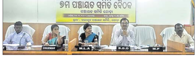
ବୈଠକରେ ଉପସ୍ଥିତ ଅତିଥି ।

କେନ୍ଦୁଝର ଜିଲ୍ଲା ଯୋଡ଼ା ପଞ୍ଚାୟତ ସମିତି ସଭାଗୃହଠାରେ ସୋମବାର ପୂର୍ବାହ୍ନ ୧୧ଟାରେ ସପ୍ତମ ପଞ୍ଚାୟତ ସମିତି ସମୀକ୍ଷା ବୈଠକ ଅନୁଷ୍ଠିତ ହୋଇଯାଇଛି ।