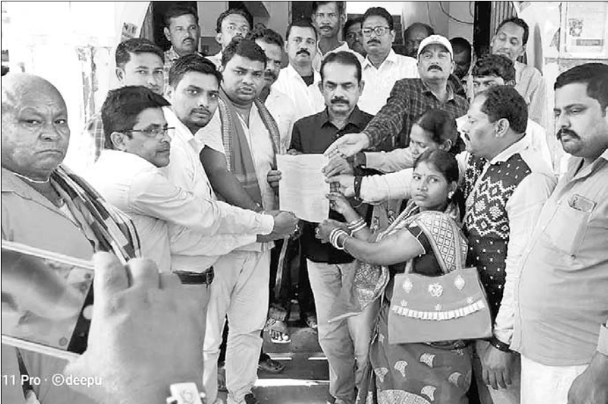
ଗାଷ୍ଟାଙ୍କ ପକ୍ଷରୁ ଦାବିପତ୍ର ପ୍ରଦାନ କରାଯାଇଛି।

ଦଳ କିଲପାଳଙ୍କ ଉଦ୍ଦେଶ୍ୟରେ ବଡ଼ସାହି ବିତିଓକୁ ଦାବିପତ୍ର ପ୍ରଦାନ କରିଛନ୍ତି। ବାଟ୍ୟାରେ ପରିମାଣରେ ନଷ୍ଟ ହୋଇଥିବା ବେଳେ ପ୍ରଶାସନ ପକ୍ଷରୁ ଏହାର ତଦନ୍ତ କରାଯାଇ ତଥ୍ୟ ପ୍ରଦାନ କରିବାକୁ ଦାବିପତ୍ରରେ ଉଲ୍ଲେଖ ରହିଛି। ଏହାର ଏକ ନକଲ ମଧ୍ୟ ପ୍ରଦାନ କରାଯାଇଛି।