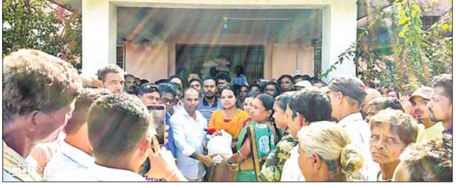
ଅତିଥିଙ୍କ ଦ୍ୱାରା ବିହନ ବଣ୍ଟନ କରାଯାଇଛି ।

ଚମ୍ପୁଆ କୃଷି କାର୍ଯ୍ୟକ୍ରମରେ ସୋମବାର ଏମ୍ପି ଓ ବିଧାୟକଙ୍କ ଦ୍ୱାରା ଚାଷୀଙ୍କୁ ସୋରିଷ, ବୁଟ ବିହନ ବଣ୍ଟନ କରାଯାଇଛି ।