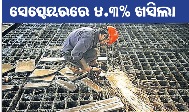
ସେପ୍ଟେମ୍ବରରେ ୫.୩% ଖସିଲା

ଦେଶରେ ମାନ୍ୟତା ଲାଗି ରହିଥିବା ବେଳେ ଚଳିତ ବର୍ଷ ସେପ୍ଟେମ୍ବର ମାସରେ ଔଦ୍ୟୋଗିକ ଉତ୍ପାଦନ ୫.୩% ହ୍ରାସ ଘଟିଛି। ଏହି ସମୟରେ ଘରୋଇ ବଜାରର ଶିଳ୍ପ ଉତ୍ପାଦନ ୮ ବର୍ଷର ସର୍ବନିମ୍ନ ସ୍ତରକୁ ଖସିଥିବା ଜଣାପଡିଛି। ମାଲ୍ଟିପ୍ଲାଇଡିଂ, ଖଣି, ବିଦ୍ୟୁତ୍ ଭଳି କ୍ଷେତ୍ରରେ ଉତ୍ପାଦନ ହ୍ରାସ ହେବାରୁ ଏକଜେଟ୍ ଉତ୍ପାଦନ ସୋପାନ ପ୍ରକାଶିତ ସରକାରୀ ତଥ୍ୟକୁ ସାମ୍ବାଲି ଆସିଛି। ଲଗାତର ଭାବେ ଦ୍ୱିତୀୟ ମାସ ଲାଗି ଶିଳ୍ପ କ୍ଷେତ୍ର ଉତ୍ପାଦନ ହ୍ରାସ ହେଉଥିବାରୁ ଦେଶର ଆର୍ଥିକ ମାନ୍ୟତା କଟକ ହେଉଥିବା ବଜାର ବିଶେଷଜ୍ଞମାନେ କହିଛନ୍ତି। ଅଗଷ୍ଟରେ ଏହା ୧.୧% ହ୍ରାସ ହୋଇଥିବା ବେଳେ ସେପ୍ଟେମ୍ବରରେ ବଡ଼ ୫.୩% ଖସିଥିବାରୁ ତିନି ବାର ପାଲଟିଛି। ମାନ୍ୟତା ଲାଗି ରହିଥିବା ଉତ୍ପାଦନରେ ବିଭିନ୍ନ ବ୍ୟାଙ୍କ ଯୁଗିଥିବାରୁ ସୁଧହାର ହ୍ରାସ କରିବା ନେଇ ସମ୍ଭାଷନା ଉପୁଜିଛି।